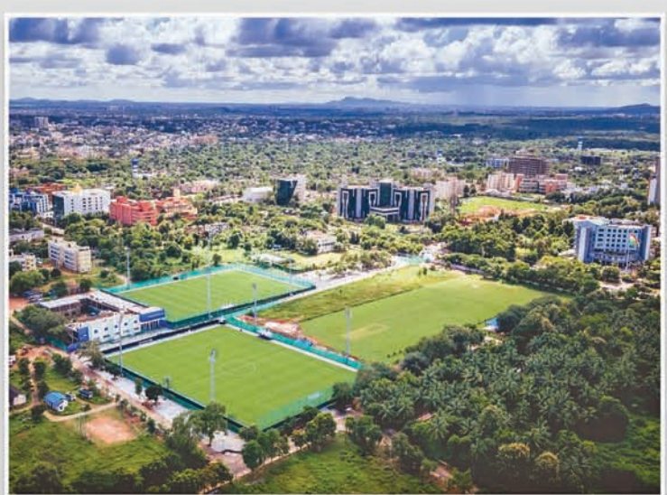
ଓଡ଼ିଶା ଫୁଟବଲ ଏକାଡେମୀ