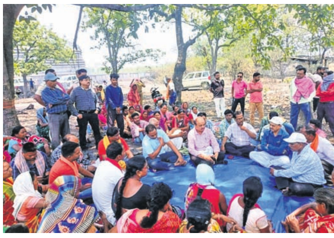
ଧାରଣା ଦେଇଥିଲେ ହେମଗିରି ଅତିରିକ୍ତ ତହସିଲଦାର ତଥ୍ୟାଳୟରେ ଉପସ୍ଥିତ ଅଧିକାରୀଙ୍କ ସହିତ ପିତାମହ ଓ ପୁତ୍ରାଣୁଙ୍କର ଆଲୋଚନା ହେଉଥିଲା।

ଧାରଣା ଦେଇଥିଲେ ହେମଗିରି ଅତିରିକ୍ତ ତହସିଲଦାର ତଥ୍ୟାଳୟରେ ଉପସ୍ଥିତ ଅଧିକାରୀଙ୍କ ସହିତ ପିତାମହ ଓ ପୁତ୍ରାଣୁଙ୍କର ଆଲୋଚନା ହେଉଥିଲା। ଅଧିକାରୀଙ୍କୁ ଏହି କାର୍ଯ୍ୟରେ ଆପଣେ ସମର୍ଥନ ଦେବାକୁ ଅନୁରୋଧ କରାଯାଇଥିଲା। ଏହାପରେ ଉଭୟ ପକ୍ଷ ଏକ ସମ୍ମତ ଉପସ୍ଥାପନା ଉପରେ ସମ୍ମତ ହୋଇଛନ୍ତି।