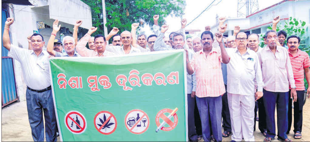
ନିଶା ମୁକ୍ତି ଅଭିଯାନ ରାଲିରେ ବାହାରି ଥିବା ଅବସରପ୍ରାପ୍ତ କର୍ମଚାରୀ।

ବଲାଙ୍ଗୀର ଜିଲା ବେଳପଡ଼ା ବ୍ଲକ୍ରେ ନିଶା କାରବାର ବନ୍ଦି ରାଲି। ଏଥିଯୋଗୁଁ ସୁବପାତି ବିପଥଗାମୀ ହେଉଛନ୍ତି। ସମାଜରେ ଅଶାନ୍ତିକାରୀ ବାତାବରଣ ଦେଖାଦେଇଛି। ପାରିବାରିକ ଶାନ୍ତି ଅପସରି ଯାଉଛି। ଏହାକୁ ନେଇ ଅବସରପ୍ରାପ୍ତ ସରକାରୀ କର୍ମଚାରୀ ସଂଘ ଉଦ୍‌ବେଗ ପ୍ରକାଶ କରିଛି।