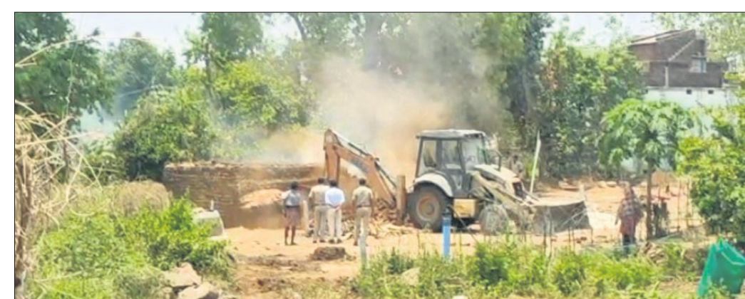
ପୋଲିସ୍ ଓ ରାଜସ୍ୱ ବିଭାଗ ପକ୍ଷରୁ ଇଟାଭାଟିକୁ ନଷ୍ଟ କରାଯାଇଛି।

ବଲାଙ୍ଗୀର ଜିଲା ଲୋକାୟୁକ୍ତ ତତ୍‌ସମ୍ମିଳନୀ ଅଧିକାରୀଙ୍କ ପକ୍ଷରୁ ତଦନ୍ତ ଆରମ୍ଭ ହୋଇଛି। ଲୋକାୟୁକ୍ତଙ୍କ ପକ୍ଷରୁ ତଦନ୍ତ ଆରମ୍ଭ ହୋଇଛି। ଲୋକାୟୁକ୍ତଙ୍କ ପକ୍ଷରୁ ତଦନ୍ତ ଆରମ୍ଭ ହୋଇଛି। ଲୋକାୟୁକ୍ତଙ୍କ ପକ୍ଷରୁ ତଦନ୍ତ ଆରମ୍ଭ ହୋଇଛି।