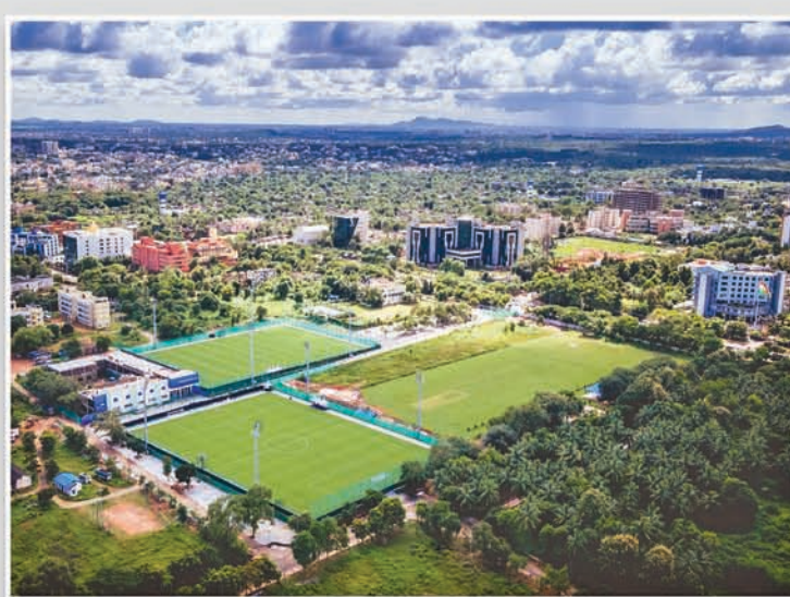
ଓଡ଼ିଶା ଫୁଟବଲ ଏକାଡେମୀ