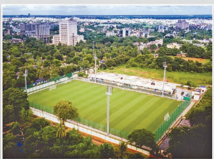
କ୍ୟାପିଟାଲ ଫୁଟବଲ ଏରେନା