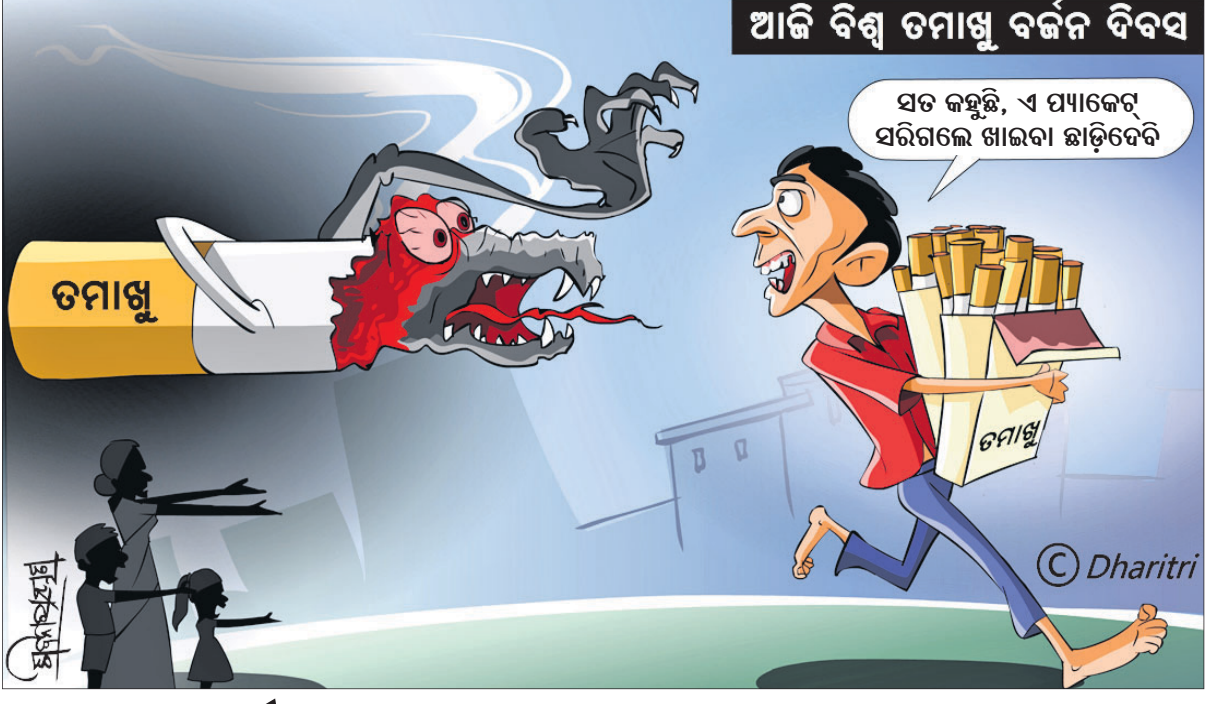
ଆଜି ବିଶ୍ୱ ତମାଖୁ ବର୍ଜନ ଦିବସ

କ୍ରମେ ଲୋକମୁଖରୁ ଓ ଜନମାନସରୁ ବିକୃତ ହେଉଥିବା ଜଗଜ୍ଞମାନଙ୍କୁ ପାଠିକା-ପାଠକଙ୍କ ନିକଟରେ ପହଞ୍ଚାଇବା ସକାଶେ ଧରତ୍ରୀର ପ୍ରୟାସ