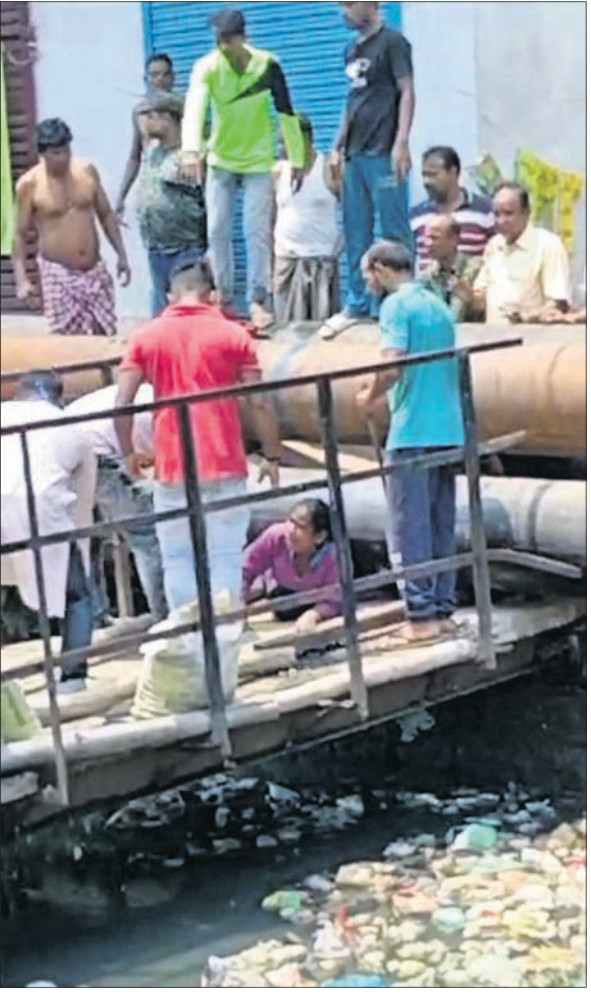
ହୁମ୍ପ ପାଇପ ଡିଲେ କାମ ହୋଇଯାଇଥିବା ଛାତ୍ରୀ ଏବଂ ମୋହିନୀ।

ପରେ ପରିବାର ଲୋକ ତାଙ୍କୁ ସିଧିଏସିଧିଏ ଏକ ଘରୋଇ ହସିଡାଲକୁ ନେଇ ଯାଇଥିଲେ। ସେଠାରେ ଦିକ୍ଷାଧିକାରୀ ଅବସ୍ଥାରେ ତାଙ୍କର ମୃତ୍ୟୁ ହୋଇଛି। ମୋହିନୀଙ୍କ ମୃତ୍ୟୁରେ ସାଧନା ଅଞ୍ଚଳରେ ଶୋକର ଛାୟା ଖେଳିଯାଇଥିବା ବେଳେ ସରକାର ଆର୍ଥିକ ସହାୟତା ପ୍ରଦାନ କରିବାକୁ ସ୍ଥାନୀୟ ଅଞ୍ଚଳବାସୀ ଦାବି କରିଛନ୍ତି।