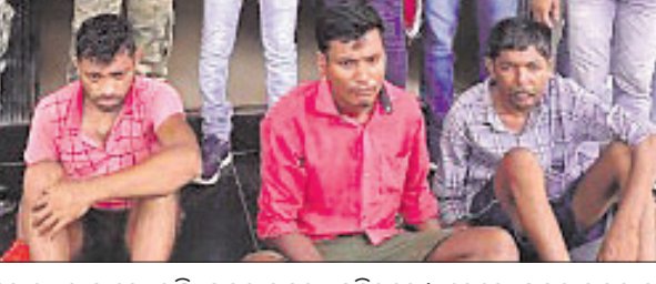
କୋଷା ସାମାଜିକ ବିକାଶ ପଡ଼ାଉକରା କରିଥିଲେ। ତେବେ ପଡ଼ାଉକରାକୁ ଜଣାପଡ଼ିଥିଲା ଯେ, ଏହି ୩ ଜଣ ଗିରଫ ଦିନରେ କେତେକ ମାଓବାଦୀ ମାମଲାରେ ଜଡିତ ଥାଇ ଫେରାର ଥିବା ମିଳିଥିଲା ମାଓବାଦୀ।