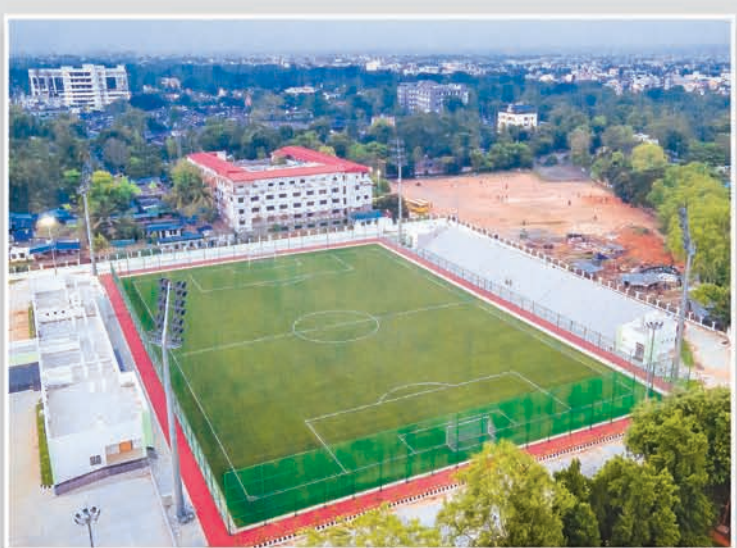
ଭୁବନେଶ୍ୱର ଫୁଟବଲ ଏକାଡେମୀ

“ଜୁଡ଼ା ପାଇଁ ଯୁବଗୋଷ୍ଠୀ ଭବିଷ୍ୟତ ପାଇଁ ବଡ଼ ଶକ୍ତି”