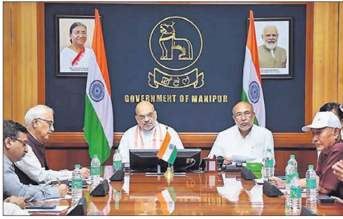
ସର୍ବଦଳୀୟ ବୈଠକରେ ଅମିତ ଶାହା, ଏନ୍. ବାରେନ୍ଦ୍ର ସିଂ ଓ ଅନ୍ୟ ନେତାମାନେ।

ହିନ୍ଦୀ ପ୍ରଭାବିତ ମଣିପୁରରେ ଶାନ୍ତି ଓ ସ୍ୱାଭାବିକ ଛୁଟି ଫେରାଇ ଆଣିବା ଲାଗି ଉଦ୍ୟମ ତଳାଇଥିବା ସରକାରୀ ଅଧିକାରୀମାନଙ୍କୁ ମନୋନୀତ କରିବା ପାଇଁ ମେଡ଼ାଲ ଫେରାଇ ଦିଆଯାଇଛି।