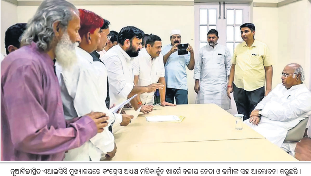
ନୂଆଦିଲ୍ଲୀରେ ଏଆଇସିସି ମୁଖ୍ୟାଳୟରେ କଂଗ୍ରେସ ଅଧକ୍ଷ ମଲ୍ଲିକାର୍ଜୁନ ଖାର୍ଗେ ଦକ୍ଷୀଣ ନେତା ଓ କର୍ମୀଙ୍କ ସହ ଆଲୋଚନା କରୁଛନ୍ତି।

ପୁଣ୍ୟ, ୧୨: ଭାରତୀୟ ଜନତା ପାର୍ଟି(ଭାଜପା) ନେତ୍ରୀ ପଙ୍କଜ ମୁଣ୍ଡେ ପୁଣ୍ୟରେ ଦଳ ଉପରେ ତାଙ୍କର ତାଙ୍କ ଅଧ୍ୟକ୍ଷତା ବ୍ୟକ୍ତ କରିଛନ୍ତି। ଦିଲ୍ଲୀରେ ରାଷ୍ଟ୍ରୀୟ ସମାଜ ପାର୍ଟି ପକ୍ଷରୁ ଅଧିକାରୀ ଦେବା ହୋଇଥିବାରୁ ପଙ୍କଜା ଦେଲିଥିବା ଆଲୋଚିତ କାର୍ଯ୍ୟକ୍ରମରେ ପଙ୍କଜା ଦେଲିଥିବା ବ୍ୟାଜପା ନେଇ ଏବେ ପୁଣି ଚର୍ଚ୍ଚା ଆରମ୍ଭ ହୋଇଛି। ସେହି କାର୍ଯ୍ୟକ୍ରମରେ ପଙ୍କଜା କହିଛନ୍ତି, ମୁଁ ଭାଜପାରେ ଅଛି, କିନ୍ତୁ ଭାଜପା ମୋର ହୋଇପାରିବ ନାହିଁ। ଆଉ ଯଦି ତାଙ୍କ ପିତାଙ୍କ