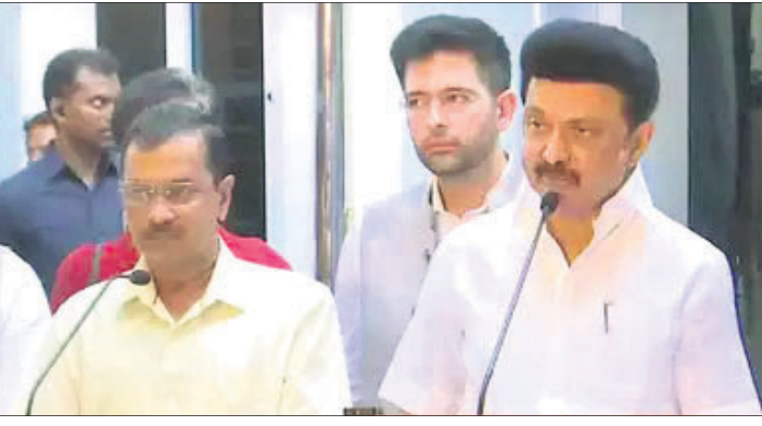
ଚେନାଇ ଠାରେ ଗୁରୁବାର ଚାଳିକନାଟୁ ପୁଣ୍ୟମନ୍ତ୍ରୀ ଏମ୍.କେ. ଷ୍ଟାଲିନିଜ୍ମ ସହ ଏଏପି ଆବାହକ ତଥା ଦିଲ୍ଲୀ ପୁଣ୍ୟମନ୍ତ୍ରୀ ଅଭିଯୋଗ କରିଛନ୍ତି।

ଚେନାଇ, ୧୨ ଦିଲ୍ଲୀ ସରକାରଙ୍କ ପ୍ରଶାସନିକ ସେବାକୁ ନିୟନ୍ତ୍ରଣ କରିବା ପାଇଁ କେନ୍ଦ୍ର ସରକାର ଆଣ୍ଡିଆ ଆଧ୍ୟାପକଙ୍କୁ ରାଜ୍ୟ ସଭାରେ ସଭାରେ ଉପସ୍ଥାପନ କରିବା ପାଇଁ ପୁଣ୍ୟମନ୍ତ୍ରୀ ଅଭିଯୋଗ କରିଛନ୍ତି। ଏହି କ୍ରମରେ ସେ ଗୁରୁବାର ଚାଳିକନାଟୁ ପୁଣ୍ୟମନ୍ତ୍ରୀ ଏମ୍.କେ. ଷ୍ଟାଲିନିଜ୍ମ ଭେଟି ଚାଳି ସମର୍ଥନ ଲୋଡ଼ିଥିଲେ। ଡିଏମ୍‌କେ ରାଜ୍ୟ ସଭାରେ ଏଏପିକୁ ସମର୍ଥନ କରିବେ ବୋଲି ଷ୍ଟାଲିନିଜ୍ମ ପ୍ରତିଷ୍ଠିତ ଦେବା ପରେ କେନ୍ଦ୍ର ଫାଇଲି ଚାଳି କୃତଜ୍ଞତା ଜଣାଇଛନ୍ତି। ଯଦି ନିର୍ବାଚିତ ସରକାରଙ୍କ ପ୍ରଶାସନ ଉପରେ ନିୟନ୍ତ୍ରଣ ନ ରହିବ, ତେବେ ନିର୍ବାଚିତ ସରକାରଙ୍କର କିଛି ମାନେ ନାହିଁ। ପ୍ରଥମ ଥର