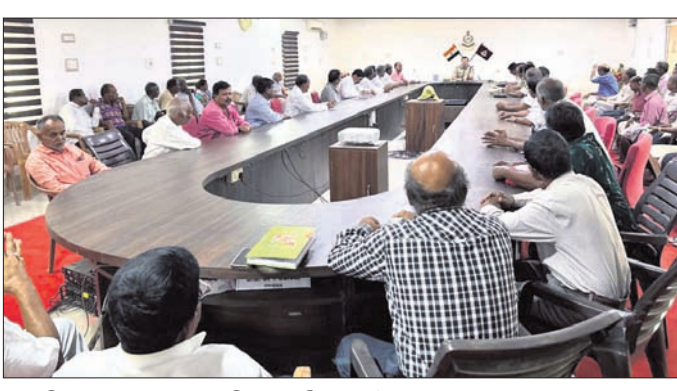
ପୋଲିସ୍ ଅଧିକାରୀଙ୍କ ସହ ବରିଷ୍ଠ ନାଗରିକଙ୍କ ବୈଠକ ପୋଲିସ୍ ଅଧିକାରୀମାନେ ଉପସ୍ଥିତ ଥିଲେ।