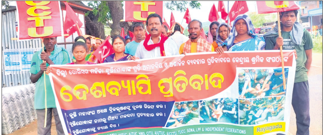
ବିରୋଧ ପ୍ରଦର୍ଶନ କରାଯାଇଛି।

ଦିନରେ ଦଳରେ ଏକ ବିଶ୍ୱଜିତିତ ଦେଖାଗଲେ କାର୍ଯ୍ୟାନୁଷ୍ଠାନ ନିଆଯିବ ବୋଲି କହିଛନ୍ତି।