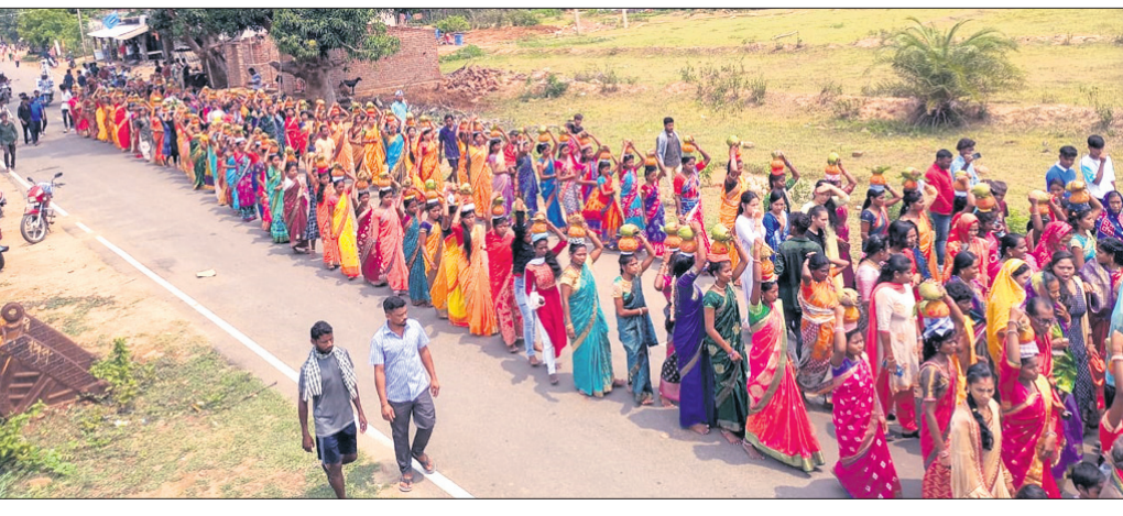
କଳସ ଶୋଭାଯାତ୍ରାରେ ଯୋଗଦେଇଥିବା ମହିଳା କଳସ ଶୋଭାଯାତ୍ରାରେ ଯୋଗଦେଇଥିବା ମହିଳା...