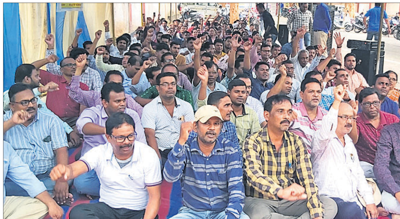
ଗଞ୍ଜାମ ଜିଲ୍ଲା ଭଞ୍ଜନଗର ଉପ ଜିଲ୍ଲାପାଳଙ୍କ କାର୍ଯ୍ୟାଳୟ, ସମ୍ମୁଖରେ ଗୁରୁବାର ଆନ୍ଦୋଳନ ଚଳାଇଥିବା ଅମଳାମାନେ।