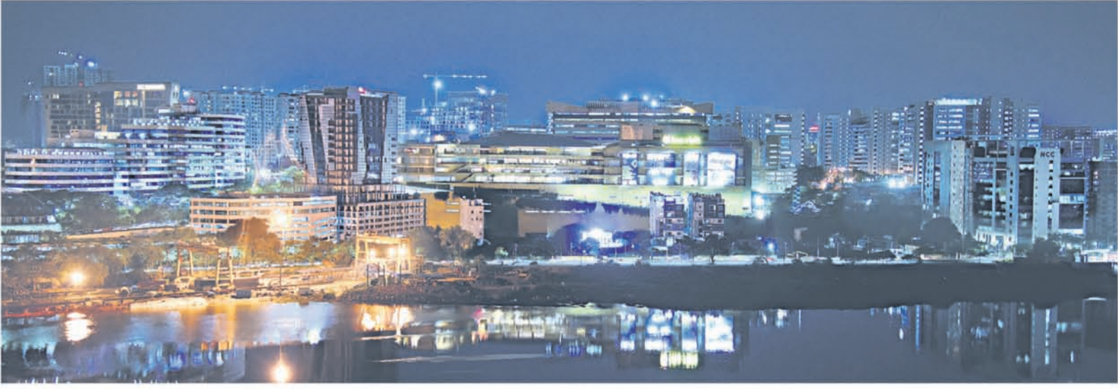
Hyderabad has emerged as the most preferred destination off IT and ITES companies. Industry-friendly policies of the government has been attracting big companies to the State Capital.

ରାଜ୍ୟରେ ହାଇଟେକ୍ ସିଟିରେ ପ୍ରଥମ ଆଇଟି ପ୍ରତିଷ୍ଠାନ ପାଦଦେବା ପରଠାରୁ ଏହା କ୍ରମଶଃ ବୃଦ୍ଧି ପାଇବାରେ ଲାଗିଛି। ଏହା ସହ ତେଲଙ୍ଗାନା ଏବେ ସାରା ଦେଶର ଆଇଟି କ୍ଷେତ୍ରରେ ଏକ ପାଖୁର ହାତୀୟରେ ପରିଣତ ହୋଇଛି। କହିବାକୁ ଗଲେ ତେଲଙ୍ଗାନାକୁ ଏବେ ଆଇଟି ପୃଷ୍ଠପଟିମାନଙ୍କ ସ୍ରୋତ ଛୁଟିବାରେ ଲାଗିଛି।