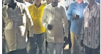
ନନ୍ଦପୁର, ୧୬(ଡି.ଏନ୍.ଏ.) ନନ୍ଦପୁର ଜିଲ୍ଲାର ବିଧାୟକଙ୍କ ପକ୍ଷରୁ ଅଗ୍ନିକାଣ୍ଡ କ୍ଷତିଗ୍ରସ୍ତଙ୍କୁ ସହାୟତା ଦେବାକୁ ନିର୍ଦ୍ଦେଶ ଦିଆଯାଇଥିଲା।