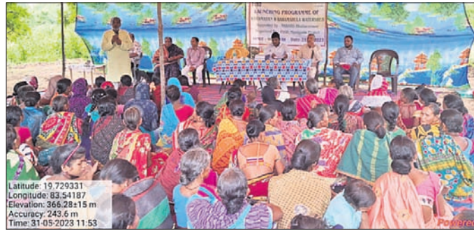
କାର୍ଯ୍ୟକ୍ରମରେ ଯୋଗ ଦେଇଥିବା ଅତିଥି ଓ ଅନ୍ୟମାନେ।

ରାୟଗଡ଼ା ଜିଲ୍ଲା ପୁନିଗୁଡ଼ା ବ୍ଲକ୍ ଯୋଜନାକୁ ଗ୍ରାମ ଉପକଣ୍ଠରେ ଗୁରୁତ୍ୱ ଦେଇ କାର୍ଯ୍ୟକ୍ରମ ଆରମ୍ଭ କରିଛନ୍ତି।