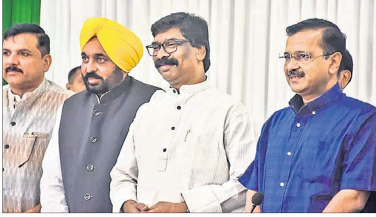
ରାଷ୍ଟ୍ରପତିଙ୍କୁ ଭେଟିବା ପରେ ଏଏପିକୁ ଜେଏମ୍ଏମ୍‌ର ସମର୍ଥନ ଦେବା ପାଇଁ ପ୍ରଶ୍ନାବଳୀ ପାଇଁ କେନ୍ଦ୍ର ଆଣିଥିବା ଅଧ୍ୟାଦେଶ ବିରୋଧରେ ଆମ୍ଭ ଆର୍ଦ୍ରା ପାଟି (ଏଏପି) ଚଳାଇଥିବା ଲଢ଼େଇରେ ଝାଡ଼ଖଣ୍ଡ ପୁଲି ମୋର୍ଚ୍ଚା (ଜେଏମ୍‌ଏମ୍) ସମର୍ଥନ ଯୋଗାଇଦେବ। ଝାଡ଼ଖଣ୍ଡ ମୁଖ୍ୟମନ୍ତ୍ରୀ ହେମନ୍ତ ଘୋଷେଇଙ୍କୁ ଶୁଭାଶୀର୍ବାଦ ଦେବା ପାଇଁ କେନ୍ଦ୍ରର ଝାଡ଼ଖଣ୍ଡ ମୁଖ୍ୟମନ୍ତ୍ରୀ ତଥା ଏଏପି ଆବାହକ ଅରବିନ୍ଦ କେଜ୍‌ରିୱାଲଙ୍କୁ ଭେଟିବା ପାଇଁ କେନ୍ଦ୍ରର ଅଧ୍ୟାଦେଶକୁ ରାଜ୍ୟ ସଭାରେ ଖାରଜ କରିବା ପାଇଁ ସମର୍ଥନ ଲୋଡ଼ିଥିଲେ। ଗଣତନ୍ତ୍ର ଉପରେ କେନ୍ଦ୍ରର ଆକ୍ରମଣ ଗଣତନ୍ତ୍ର ଚିନ୍ତାର