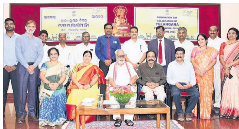
ତେଲଙ୍ଗାନା ଦିବସ ପାଳନ ଅବସରରେ ରାଜଭବନରେ ଉପସ୍ଥିତ ରାଜ୍ୟପାଳ ଓ ଅନ୍ୟ ଅତିଥିଗଣ।

ରାଜଭବନରେ ଶୁକ୍ରବାର ତେଲଙ୍ଗାନା ଦିବସ ପାଳିତ ହୋଇଛି। ତେଲଙ୍ଗାନା ଦିବସ ଉତ୍ସବ ଅବସରରେ ରାଜ୍ୟପାଳ ପ୍ରଫେସର ଗଣେଶୀ ଲାଲ କହିଛନ୍ତି, ଭାରତ ସମଗ୍ର ବିଶ୍ୱକୁ ଆଲୋଚିତ କରୁଛି। ଭାରତୀୟତାରେ ଅଛି ବିଶ୍ୱଜନନୀତା। ଏହା ଅସୀମ ଓ ଅନନ୍ତ ଆନନ୍ଦର ଉତ୍ସାହ ଭାରତ ବିଶ୍ୱବ୍ରତର ମର୍ଯ୍ୟାଦା ହାସଲ କରିବାକୁ ଯାଉଛି। ଏହି କାର୍ଯ୍ୟକ୍ରମରେ ଭୁବନେଶ୍ୱର ନିବାସୀ ତେଲଙ୍ଗାନାର ବ୍ୟକ୍ତିବିଶେଷ ସେମାନଙ୍କର ଅନୁକୃତି ଓ ଅଭିଜ୍ଞତା ପ୍ରକାଶ କରିଥିଲେ। ଓଡ଼ିଶା ଏକ ଶାନ୍ତିପୂର୍ଣ୍ଣ ରାଜ୍ୟ ଓ ଏହାର ଆତିଥ୍ୟ