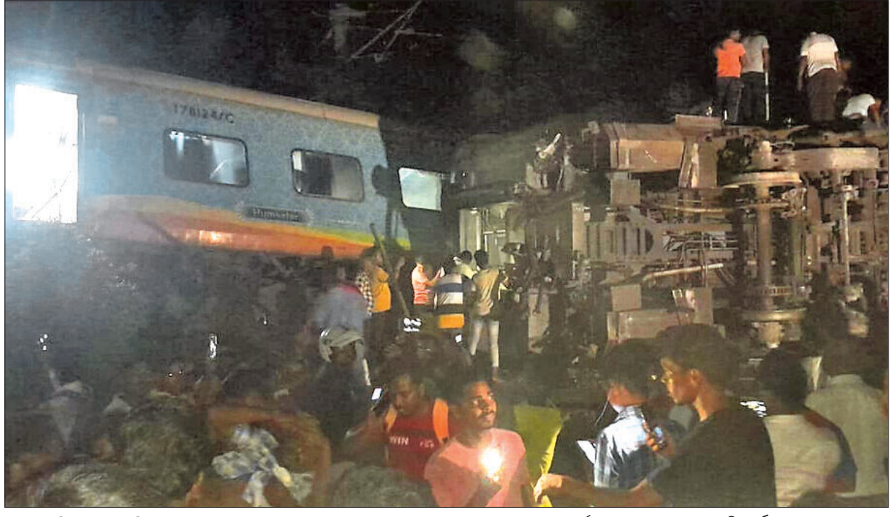
ଭାଇଶ୍ୱର ଜିଲା ବାହାନଗା ନିକଟରେ ଶୁକ୍ରବାର କରମଞ୍ଜର-ଯଶୋବନ୍ତପୁର ଟ୍ରେନ୍-ମାଲଗାହା ଟ୍ରେନ୍ ମଧ୍ୟରେ ଭୟଙ୍କର ଦୁର୍ଘଟଣା ପରର ଦୃଶ୍ୟ। (ଅଧିକ ରିପୋର୍ଟ ଓ ଫଟୋ: ପୃଷ୍ଠା-୧୦)