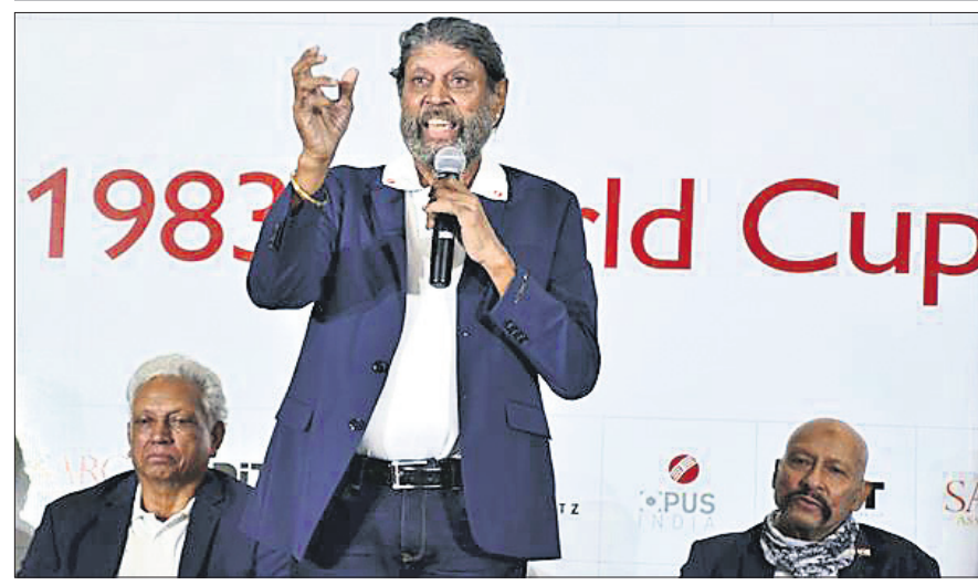
୧୯୮୩ ବିଶ୍ୱକପ୍ ବିଜୟୀ ଦଳର ସଦସ୍ୟ କପିଳ ଦେବ, ମହିନ୍ଦର ଅମରନାଥ ଓ ସୟଦ କର୍ମାନୀ ।

ପୁନିଆ ସମେତ ବହୁ କୁସ୍ତିଯୋଦ୍ଧା ବାବିକରି ଆସୁଛନ୍ତି । ଗତ ମେ' ୩୦ରେ ସେମାନେ ସମର୍ଥକମାନଙ୍କ ସହ ହରିଦ୍ୱାରରେ ବିଶ୍ୱୋତ୍ତମ ପ୍ରଦର୍ଶନ କରିବା ସହ ତୁରନ୍ତ ଦାବି ପୂରଣ ନ ହେଲେ ସେମାନେ ପବିତ୍ର ଗଙ୍ଗା ନଦୀରେ ସେମାନଙ୍କ ପଦକକୁ ବିସର୍ଜନ କରିଦେବେ ବୋଲି ଧମକ ଦେଇଥିଲେ । ସୂଚନାଯୋଗ୍ୟ, ଗତ ମେ' ୨୮ରେ ଆନ୍ଦୋଳନକାରୀ କୁସ୍ତିଯୋଦ୍ଧାମାନେ ନୂଆ ପାଲ୍‌ମେଞ୍ଚ୍ ଭବନ ଆଡକୁ ଅଗ୍ରସର ହେଉଥିବା ବେଳେ ଆଇନ ଶୃଙ୍ଖଳା ଭଙ୍ଗ ଅଭିଯୋଗରେ ପୋଲିସ୍ ସେମାନଙ୍କୁ ଗିରଫ କରି