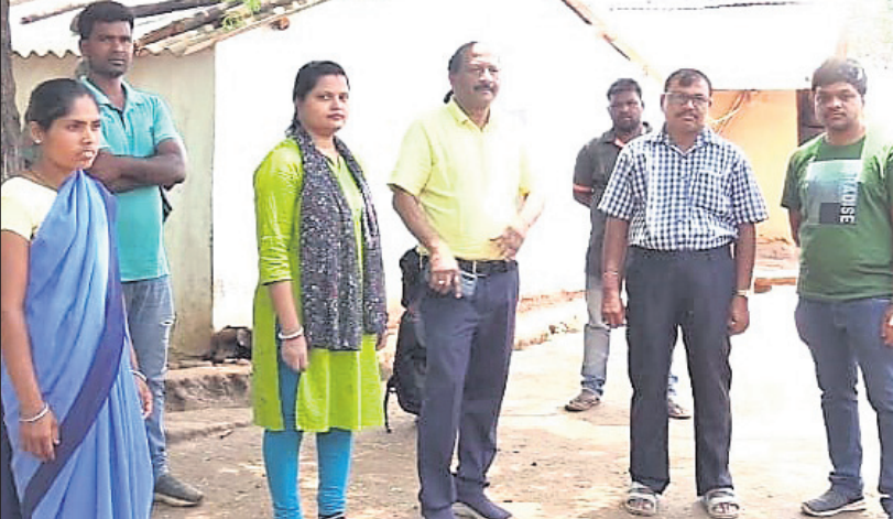
ତନ୍ୟଯୋଡ଼ି ଗ୍ରାମରେ ପହଞ୍ଚିଥିବା ସ୍ୱାସ୍ଥ୍ୟ ବିଭାଗର ଡିଏମ୍।