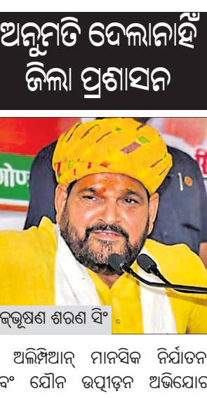
ବ୍ରିଜଭୂଷଣ ଶରଣ ସିଂ

ଆଣି ତାଙ୍କୁ ଚଳୁଥିବା ଅଧିକ ପଦରୁ ହଟାଇବା ସହ ଗିରଫ କରିବା ଦାବିରେ ଅଡ଼ିଭିକ୍ସିଟି ପୁସ୍ତିକାକୋଟକ ହସ୍ତକ୍ଷେପ ପରେ ବ୍ରିଜଭୂଷଣଙ୍କ ବିରୋଧରେ ଦୁଇଟି ମାମଲା ରୁଜୁ ହୋଇଥିଲେ। ଅନ୍ୟପକ୍ଷେ ପ୍ରଭାବଶାଳୀ ଭାଜପା ନେତା ବ୍ରିଜଭୂଷଣ ରାଷ୍ଟ୍ରଧ୍ୟ ସ୍ୱାଧିକାରୀଙ୍କୁ ଏକାଠି କରିଛନ୍ତି।