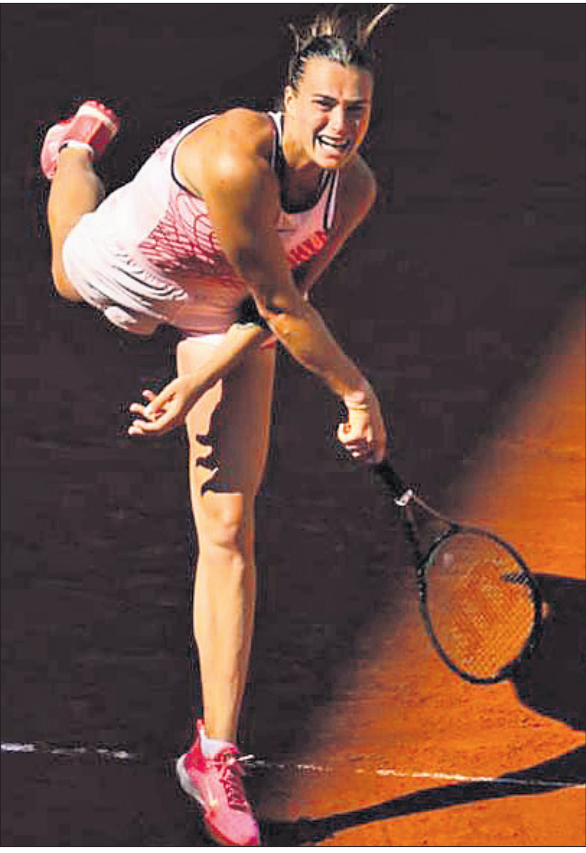
ଫ୍ରେଞ୍ଚ ଓପନ ଚେନିସ ଦୂତୀୟ ରାଉଣ୍ଡ ଅବସରରେ ଆରିନା ସାବାଲେଙ୍କା ।