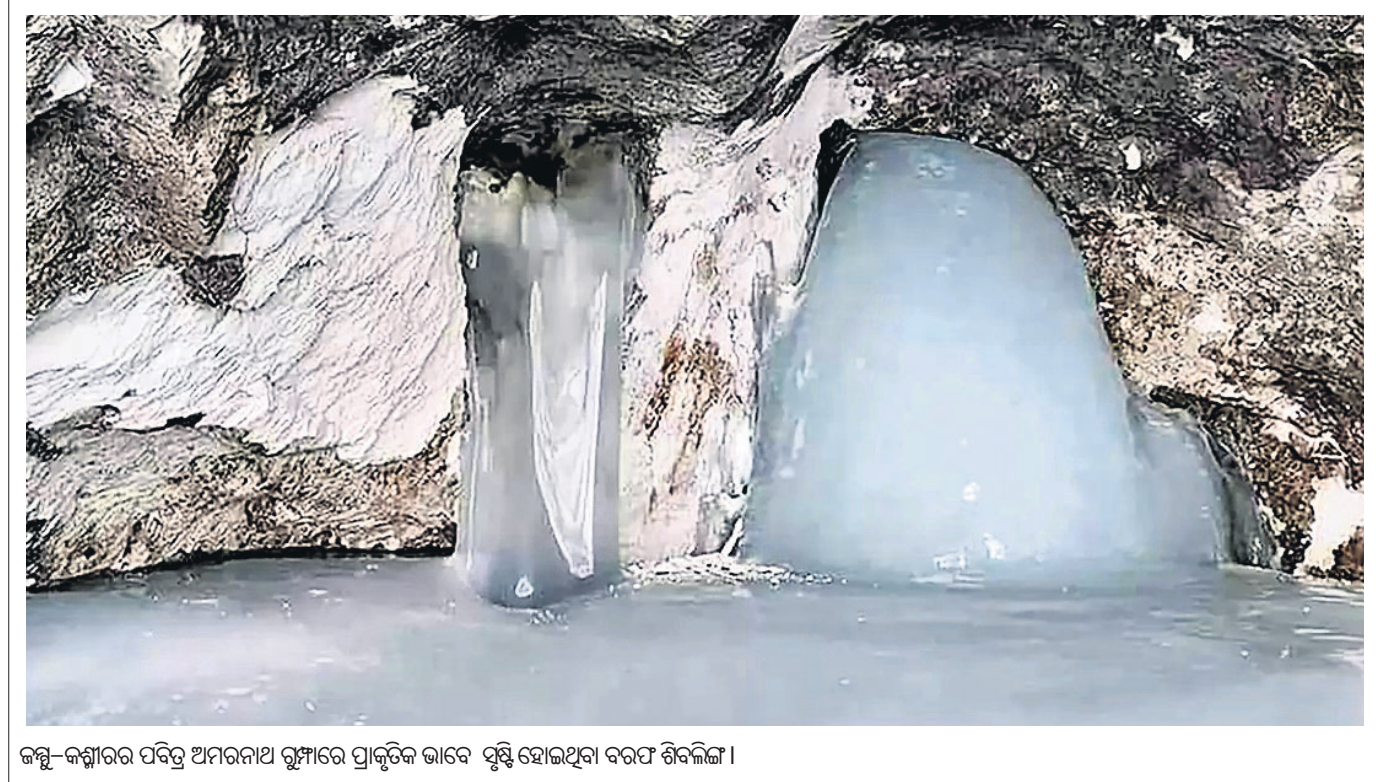
କମ୍ପୋରର ପବିତ୍ର ଅମରନାଥ ଗୁମ୍ଫାରେ ପ୍ରାକୃତିକ ଭାବେ ସୃଷ୍ଟି ହୋଇଥିବା ବରଫ ଶିବଲିଙ୍ଗ ।