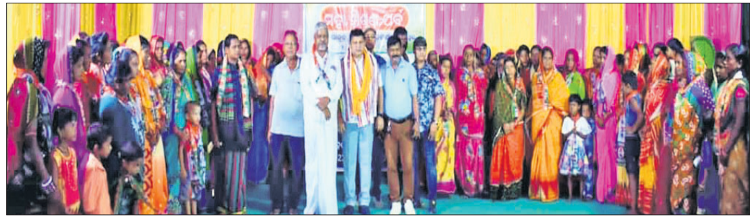
କଂଗ୍ରେସରେ ସାମିଲ କର୍ମୀଙ୍କୁ ସ୍ୱାଗତ କରାଯାଇଛି।

କଂଗ୍ରେସରେ ଭାଜପା ଓ ବିଜେଡି କର୍ମୀଙ୍କୁ ସ୍ୱାଗତ କରାଯାଇଛି। ଯୋଗଦେବା ପରେ କର୍ମୀମାନଙ୍କୁ ଉତ୍ସାହ ଦେଇ କଂଗ୍ରେସରେ ସାମିଲ ହେବାକୁ କୁହାଯାଇଛି।