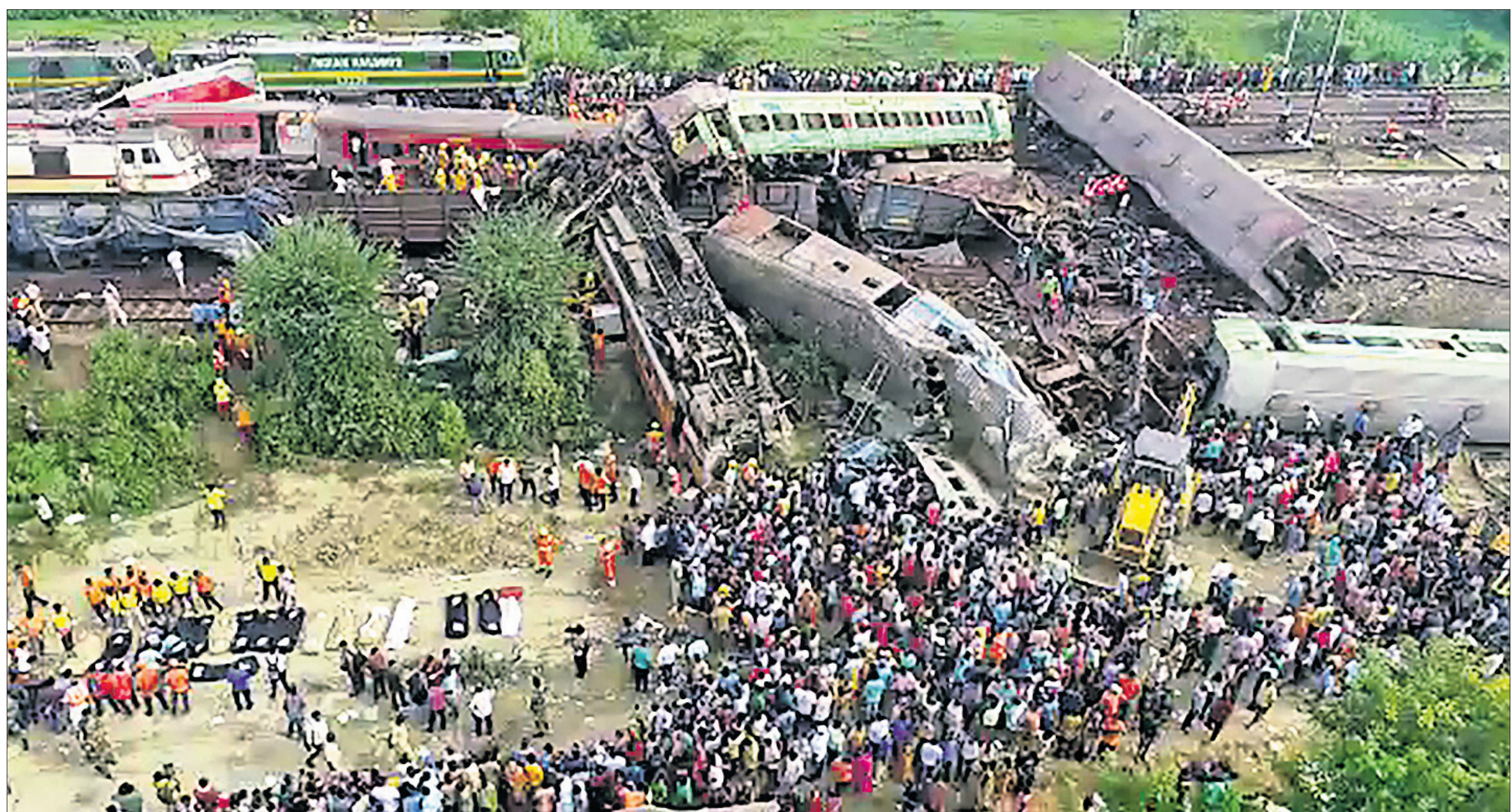
ଅପରାଧ ପରେ ସମ୍ପୂର୍ଣ୍ଣ ଅଞ୍ଚଳ ଲୋକାବରଣ୍ୟ।