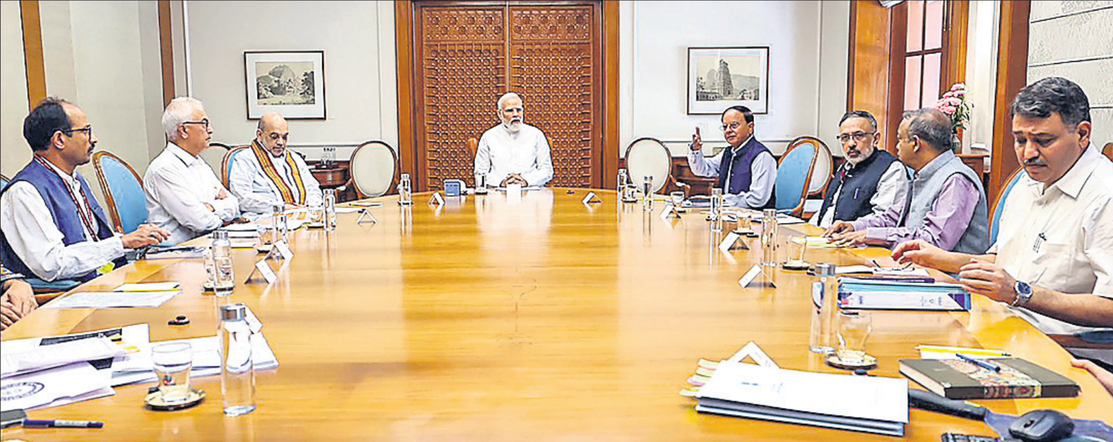
ନୂଆଦିଲ୍ଲୀଠାରେ ପ୍ରଧାନମନ୍ତ୍ରୀ ନରେନ୍ଦ୍ର ମୋଦିଙ୍କ ଅଧ୍ୟକ୍ଷତାରେ ଅନୁଷ୍ଠିତ ସମୀକ୍ଷା ବୈଠକରେ ସ୍ୱରାଷ୍ଟ୍ର ମନ୍ତ୍ରୀ ଅମିତ ଶାହା, ପ୍ରଧାନମନ୍ତ୍ରୀଙ୍କ ପ୍ରମୁଖ ସଚିବ ପି.କେ. ମିଶ୍ରଙ୍କ ସମେତ ଅନ୍ୟାନ୍ୟ ବରିଷ୍ଠ ପଦାଧିକାରୀ ।