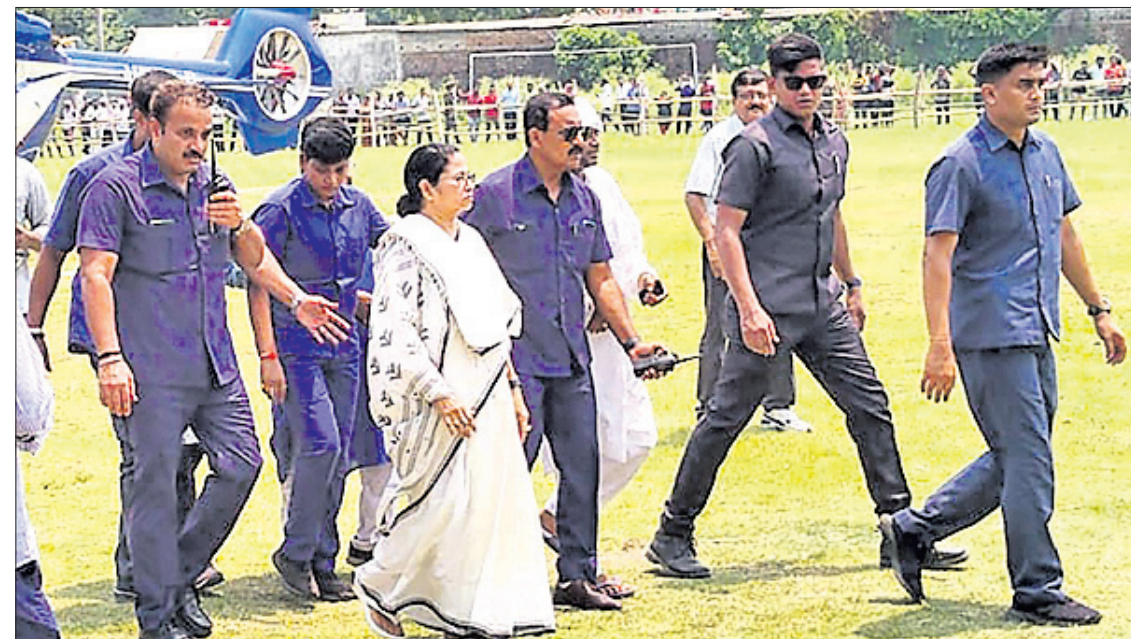
ବାହାନଗାରେ ପହଞ୍ଚି ଦୁର୍ଘଟଣାସ୍ଥଳକୁ ଯାଇଛନ୍ତି ପଶ୍ଚିମବଙ୍ଗ ମୁଖ୍ୟମନ୍ତ୍ରୀ ମମତା ବାନାର୍ଜୀ ।