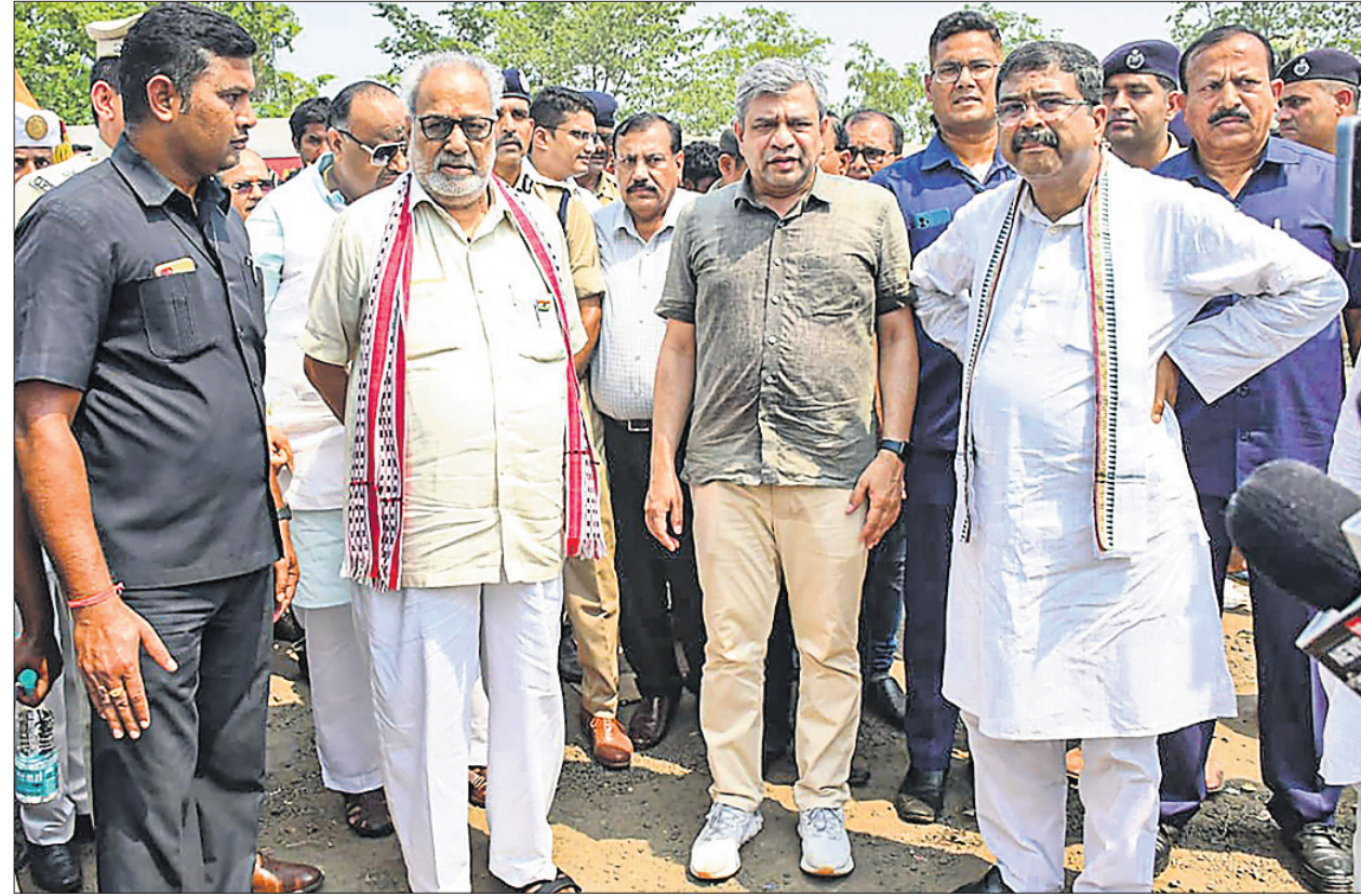
ଦୁର୍ଘଟଣାସ୍ଥଳରେ ରାଜ୍ୟପାଳ ପ୍ରଫେସର ଗଣେଶୀ ଲାଲ, ରେଳମନ୍ତ୍ରୀ ଅଶ୍ୱିନୀ ବୈଷ୍ଣବ ଓ କେନ୍ଦ୍ର ଶିକ୍ଷାମନ୍ତ୍ରୀ ଧର୍ମେନ୍ଦ୍ର ପ୍ରଧାନ ।