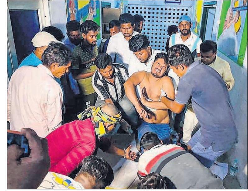
ଜଣେ ଆହତ ଯାତ୍ରୀଙ୍କୁ ଚିକିତ୍ସା ପାଇଁ ନିଆଯାଉଛି।