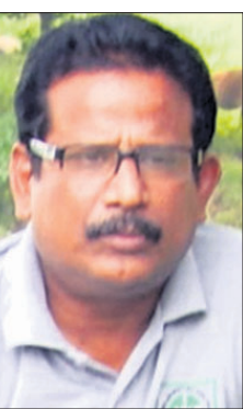
ଦିଲ୍ଲୀ ପଦକାୟକ ଠାକୁର ବଞ୍ଚାଇ ଦେଲେ

ଠାକୁର ବଞ୍ଚାଇ ଦେଲେ ଠାକୁର ବଞ୍ଚାଇ ଦେଲେ ଠାକୁର ବଞ୍ଚାଇ ଦେଲେ