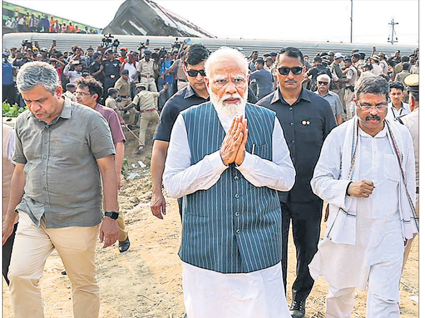
ଶନିବାର ଅପରାହ୍ନରେ ବାଲେଶ୍ୱର ଜିଲ୍ଲା ବାହାନଗା ନିକଟ ଟ୍ରେନ୍ ଦୁର୍ଘଟଣାସ୍ଥଳ ପରିଦର୍ଶନ କରୁଛନ୍ତି ପ୍ରଧାନମନ୍ତ୍ରୀ ନରେନ୍ଦ୍ର ମୋଦି, ରେଳମନ୍ତ୍ରୀ ଅଶ୍ୱିନୀ ବୈଷ୍ଣବ ଓ କେନ୍ଦ୍ରମନ୍ତ୍ରୀ ଧର୍ମେନ୍ଦ୍ର ପ୍ରଧାନ।

ବାଲେଶ୍ୱର ଅଧିକାରୀ, ୩।୬ ବାହାନଗାରେ ଦୁର୍ଘଟଣାସ୍ଥଳ ଏବଂ ବାଲେଶ୍ୱର ଜିଲ୍ଲା ମୁଖ୍ୟ ଡାକ୍ତରଖାନାରେ ରୋଗୀକୁ ଭେଟିବା ପରେ ପ୍ରଧାନମନ୍ତ୍ରୀ ନରେନ୍ଦ୍ର ମୋଦି ପ୍ରତିକ୍ରିୟାରେ କହିଛନ୍ତି ଯେ, ବାହାନଗାରେ ଘଟିଥିବା ୨ଟି ଏକ୍ସପ୍ରେସ୍ ଟ୍ରେନ୍ ଦୁର୍ଘଟଣାରେ ଆମେ ଯେଉଁମାନଙ୍କୁ ହରାଇଛେ, ସେମାନଙ୍କୁ ଆଉ ପାଇପାରିବା ନାହିଁ। ସରକାରଙ୍କ ପାଇଁ ଏହି ଘଟଣା ଗମ୍ଭୀର ତଥା ସମ୍ବେଦନଶୀଳ। ଘଟଣାର ତଦନ୍ତ ନିର୍ଦ୍ଦେଶ ଦିଆଯାଇଛି। ଏହି ଭୟଙ୍କର ଦୁର୍ଘଟଣା ପାଇଁ ଯେଉଁମାନେ ଦୋଷୀ ପ୍ରମାଣିତ ହେବେ, ସେମାନଙ୍କ ବିରୋଧରେ ଦୃଢ଼ କାର୍ଯ୍ୟାନୁଷ୍ଠାନ ନିଆଯିବ। ସରକାରଙ୍କ ପାଖରେ ଯେତିକି ବ୍ୟବସ୍ଥା ଥିଲା, ତାହାର ମାଧ୍ୟମରେ ଉଦ୍ଧାର କାର୍ଯ୍ୟ କରିଛନ୍ତି। ପ୍ରଶାସନିକ ଅଧିକାରୀଙ୍କ ସହିତ କଥା ହୋଇଛି। ସେମାନେ ସକଟ ସମୟରେ ବହୁ ପରିଶ୍ରମ କରି ଉଦ୍ଧାର କାର୍ଯ୍ୟ କରି ରଖିଥିଲେ। ସାଧାରଣ ଜନତା ମଧ୍ୟ ଉଦ୍ଧାର କାର୍ଯ୍ୟରେ ନିୟୋଜିତ ହୋଇଥିଲେ। ଏଠାକାର ନାଗରିକ ଓ ମୁରବରୀ ଦୁର୍ଘଟଣା ପରେ ରାତିସାରା ଉଦ୍ଧାର କାର୍ଯ୍ୟରେ ସହଯୋଗ କରିଛନ୍ତି। ସାଧାରଣ ଜନତା ଡାକ୍ତରଖାନାକୁ ପୁଞ୍ଜା-୪