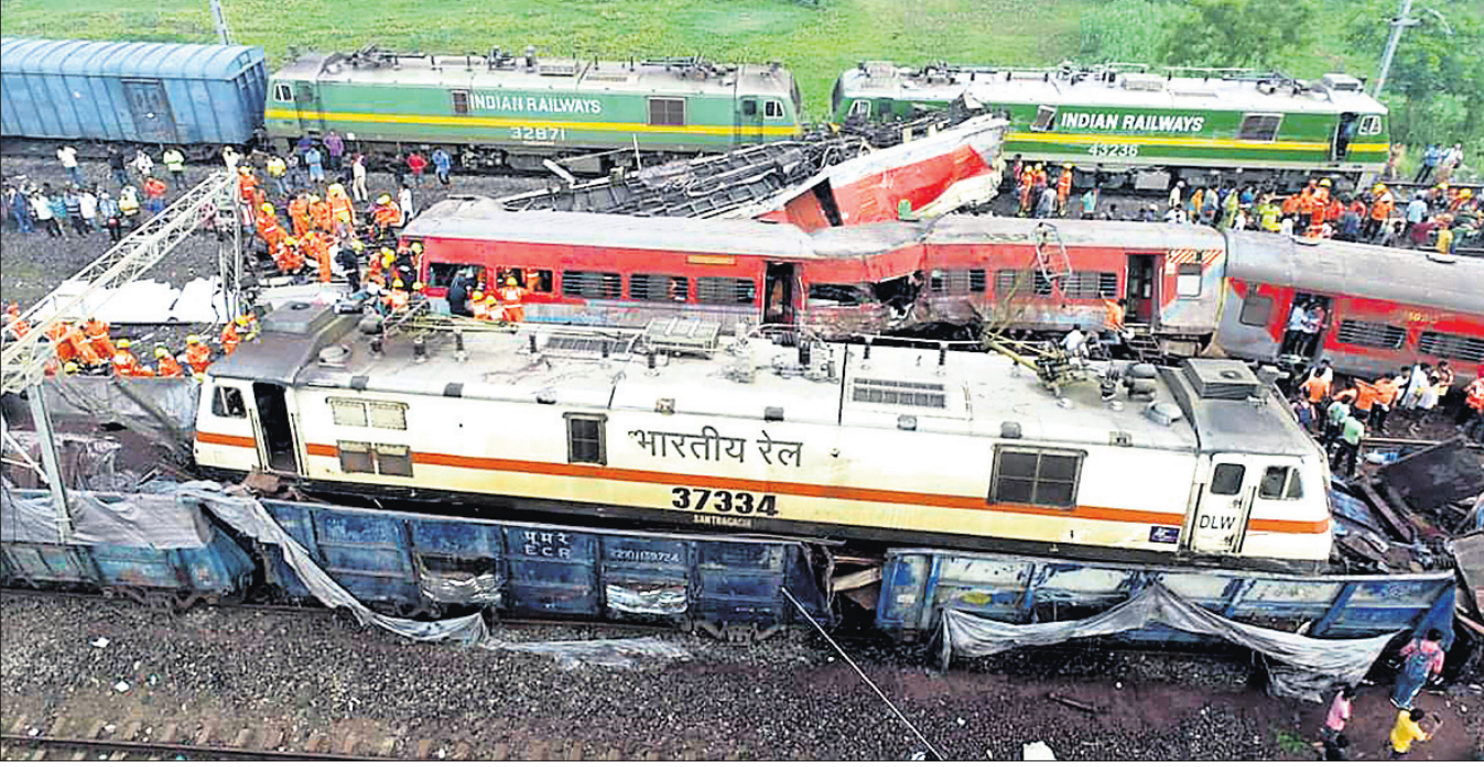
ଦୁର୍ଘଟଣାରେ କ୍ଷତିଗ୍ରସ୍ତ ୩ ଟ୍ରେନ୍ ।