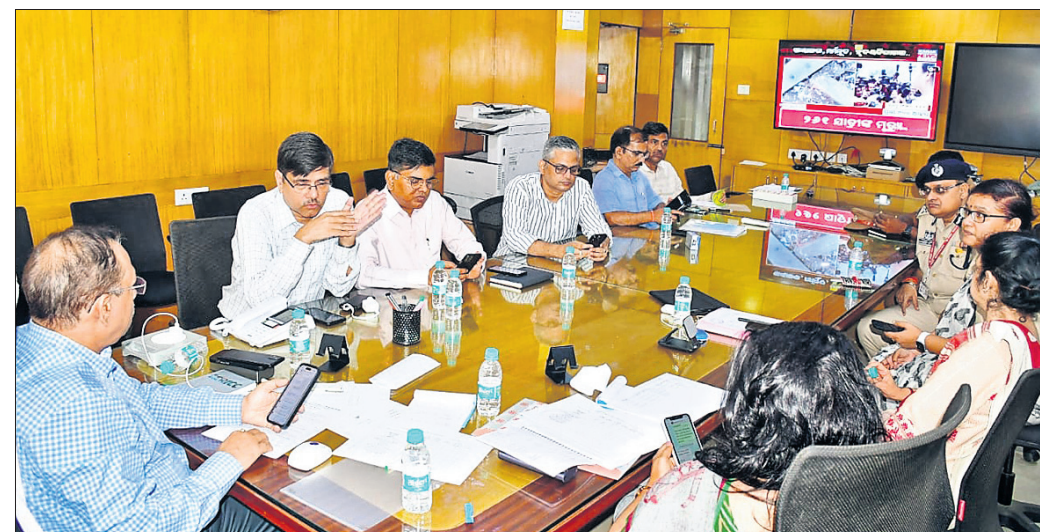
ଏଆର୍ସିକ କାର୍ଯ୍ୟାଳୟଠାରେ ସମୀକ୍ଷା ବୈଠକରେ ମୁଖ୍ୟ ଶାସନ ସଚିବ ପ୍ରତାପ ଜେନା ଓ ଅନ୍ୟ ଅଧିକାରୀମାନେ ।