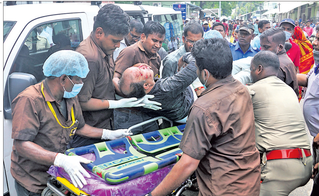
ଗୁରୁତର ଯାତ୍ରୀଙ୍କୁ କଟକ ବଡ଼ମେଡିକାଲ ଭିତରକୁ ନିଆଯାଉଛି।