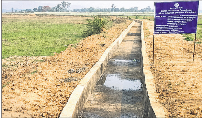
ନିର୍ମାଣଧୀନ କ୍ଷୁଦ୍ର ଜଳସେଚନ ପ୍ରକଳ୍ପ ।

କେନ୍ଦୁଝର ସଦର ତହସିଲ ରାଜସ୍ୱାଆଁ ରାଜସ୍ୱ ନିରୀକ୍ଷକ ଅନ୍ତର୍ଗତ କ୍ଷୁଦ୍ର ଜଳସେଚନ ବିଭାଗର ରାଜସ୍ୱାଆଁ-ଗୋପାଳାପୁର-ସିଲପୁଆଁ ମୁଖ୍ୟ କେନାଲ କମିଟି ଜବରଦସ୍ତୀ ଭାବେ କେନାଲ ନିର୍ମାଣରେ ବାଧକ ଦେଖାଦେଇଛି । ପ୍ରାୟ ୫୯ ଲକ୍ଷ ୬୫ ହଜାର ଟଙ୍କା ବ୍ୟୟ ଅବକଳରେ ନିର୍ମାଣ ହେଉଥିବା କେନାଲ ୫ ମେ, ୨୦୨୨ ରେ ଆରମ୍ଭ ହୋଇ ୪ ଏପ୍ରିଲ ୨୦୨୩ ରୁଖା ସରିବା ପାଇଁ ସମୟ ଧାର୍ଯ୍ୟ ହୋଇଥିବା ସୂଚନା ଫଳରେ ଉଲ୍ଲେଖ ରହିଛି ।