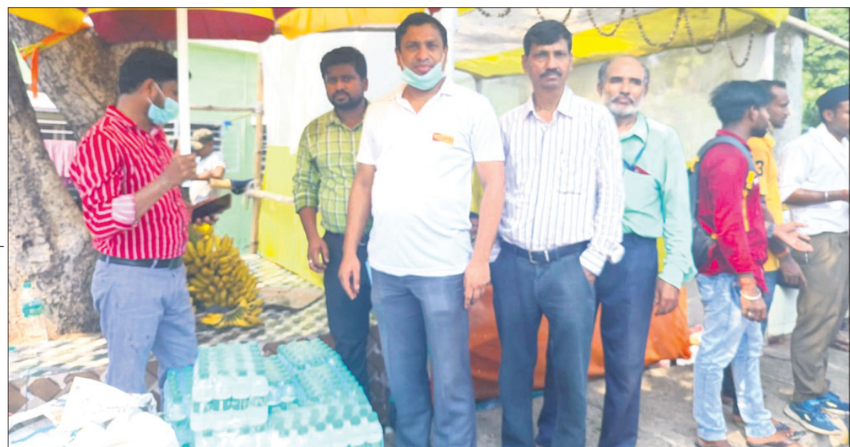
ପଞ୍ଜାବ ନ୍ୟାଶନାଲ ବ୍ୟାଙ୍କ (ପିଏନ୍‌ସି)ର ବାଲେଶ୍ୱର ମଣ୍ଡଳ ପକ୍ଷରୁ ବାହାନଗା ଟ୍ରେଡ୍ ଫୁର୍ନିଚର ଶିକାର ହୋଇଥିବା ଯାତ୍ରୀଙ୍କର ସମ୍ପର୍କୀୟ, ସ୍ୱାସ୍ଥ୍ୟକର୍ମୀ ଏବଂ ଅନ୍ୟାନ୍ୟ କର୍ମଚାରୀମାନଙ୍କୁ ବାଲେଶ୍ୱର ହସ୍ପିଟାଲରେ ପାଣି ଖୋତକ, ଫଳ ଆଦି ବଣ୍ଟନ କରାଯାଇଛି।

ବିଗତ କିଛି ମାସ ହେବ ରାଜ୍ୟରେ ଜମି କିଣାବିକା ଓ ଆପାର୍ଟମେଣ୍ଟ ମାଲିକାନାକୁ ନେଇ ସବୁପ୍ରକାର ସମସ୍ୟା ସୃଷ୍ଟି ହୋଇଥିଲା।