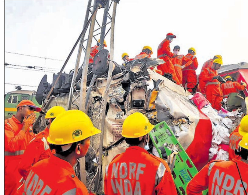
ଉଦ୍ଧାର କାର୍ଯ୍ୟରେ ନିଯୋଜିତ ଏନ୍ଡିଆନ୍ ନେସନାଲ ରିଲିଫ୍ ଫୋର୍ସ ।