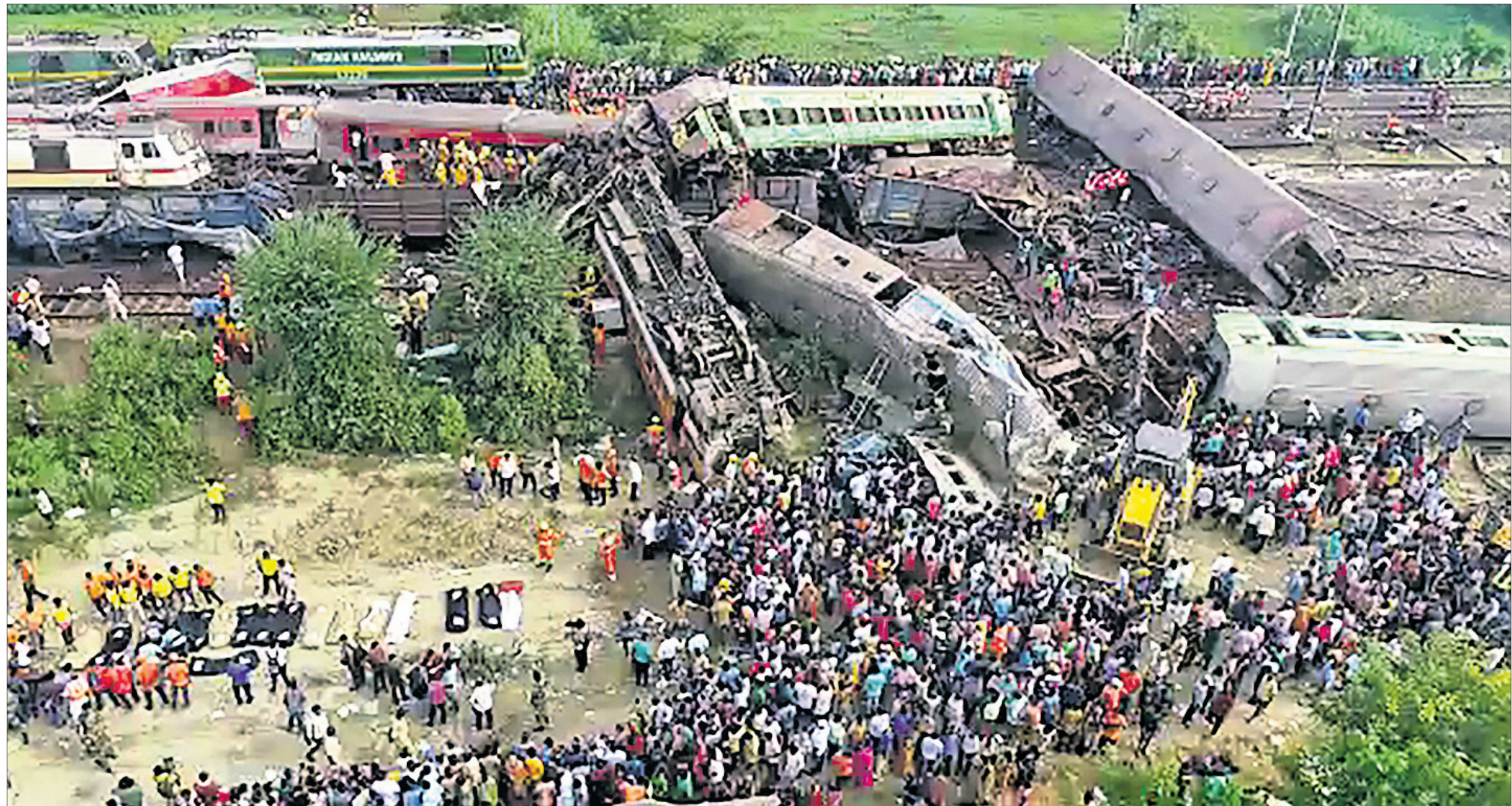
ଅଘଟଣ ପରେ ସମ୍ପୂର୍ଣ୍ଣ ଅଞ୍ଚଳ ଲୋକାବରଣ୍ୟ।