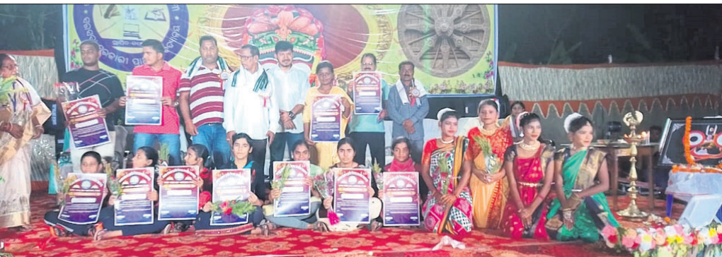
ସମାରୋହରେ ଅତିଥିଙ୍କ ସହ ପୁରସ୍କୃତ ଛାତ୍ରଛାତ୍ରୀ ।