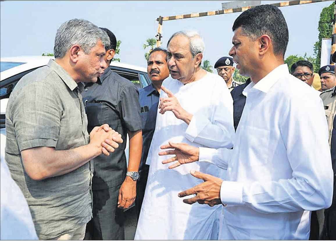
ବାହାନଗା ଷ୍ଟେଶନରେ ମୁଖ୍ୟମନ୍ତ୍ରୀ ନବୀନ ପଟ୍ଟନାୟକ, ରେଳମନ୍ତ୍ରୀ ଅଶ୍ୱିନୀ ବୈଷ୍ଣବ ଓ ୫-ଟି ସଚିବ ଭି.କେ. ପାଣିଆନ୍ ଆଲୋଚନାରେ ।