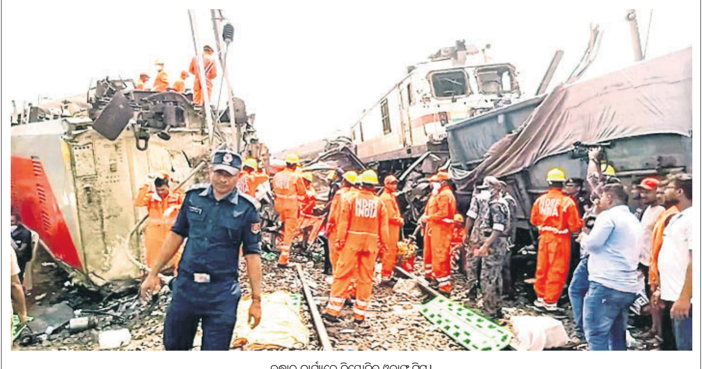
ଉଦ୍ଧାର କାର୍ଯ୍ୟରେ ନିୟୋଜିତ ଓଡ୍ରାଫ୍ ଟିମ୍।