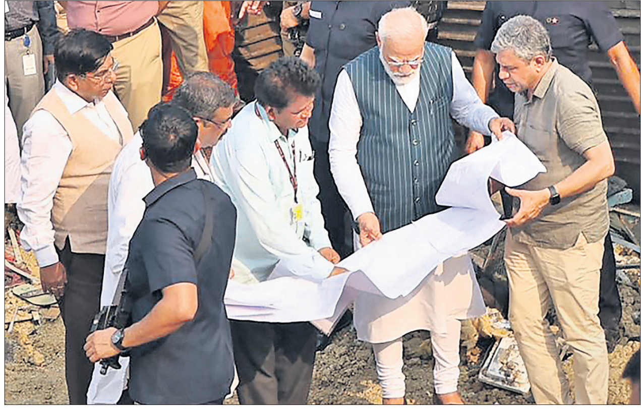
ଦୁର୍ଘଟସ୍ଥଳରେ ରେଳମନ୍ତ୍ରୀ, ଶିକ୍ଷାମନ୍ତ୍ରୀ ଓ ଅନ୍ୟ ଅଧିକାରୀଙ୍କ ସହ ନକ୍ସା ଦେଖୁଛନ୍ତି ପ୍ରଧାନମନ୍ତ୍ରୀ।