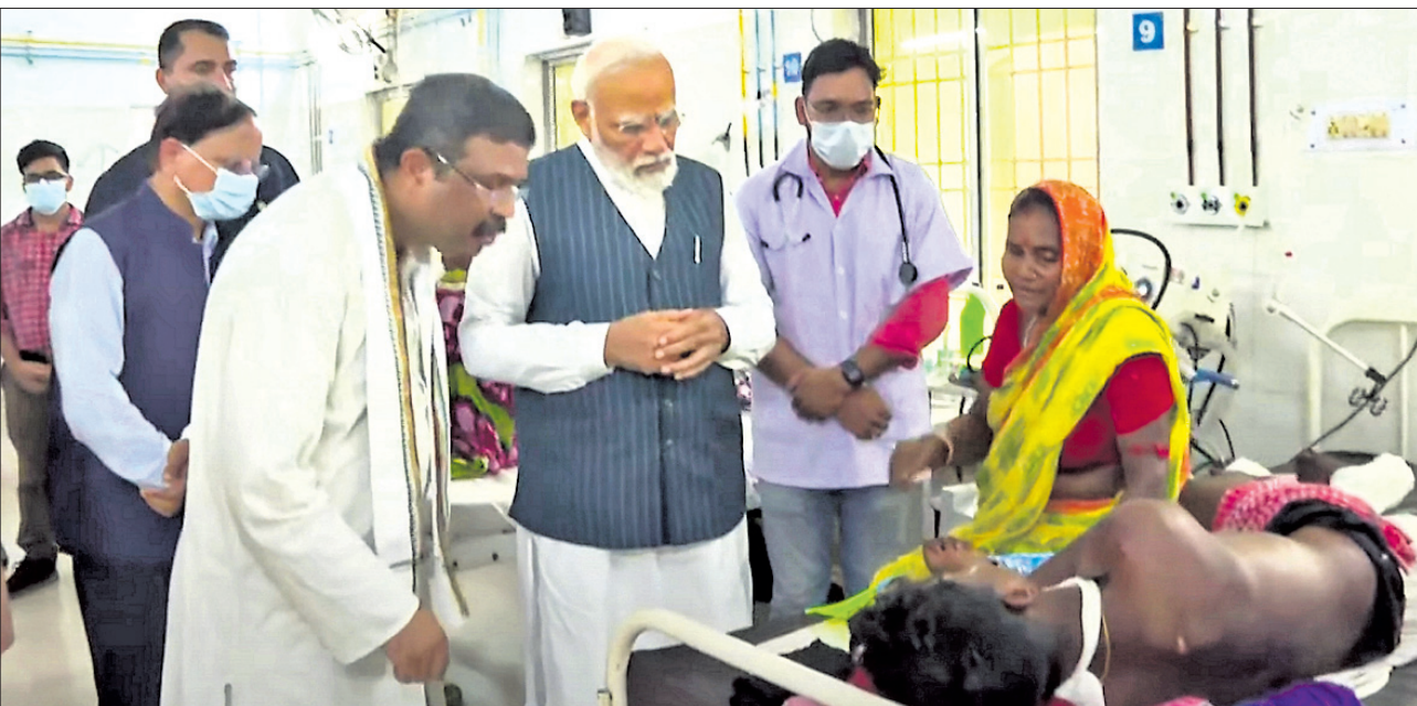
ବାଲେଶ୍ୱର ଜିଲ୍ଲା ମୁଖ୍ୟ ଚିକିତ୍ସାଳୟରେ ଆହତଙ୍କୁ ଭେଟୁଛନ୍ତି ପ୍ରଧାନମନ୍ତ୍ରୀ ନରେନ୍ଦ୍ର ମୋଦି । ନିକଟରେ ଅଛନ୍ତି କେନ୍ଦ୍ର ଶିକ୍ଷାମନ୍ତ୍ରୀ ଧର୍ମେନ୍ଦ୍ର ପ୍ରଧାନ ଓ ଅନ୍ୟମାନେ ।