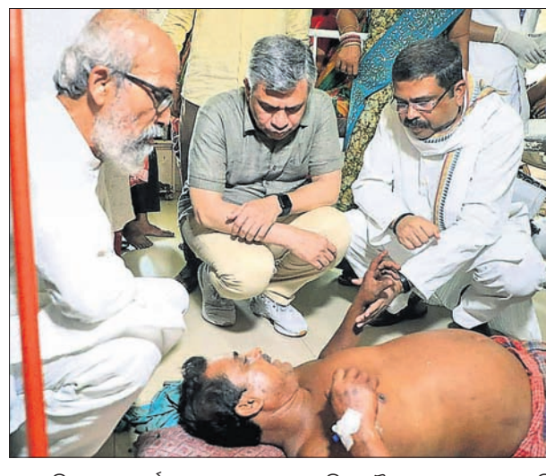
କେନ୍ଦ୍ର ଶିକ୍ଷାମନ୍ତ୍ରୀ ଧର୍ମେନ୍ଦ୍ର ପ୍ରଧାନ, ରେଳମନ୍ତ୍ରୀ ଅଶ୍ୱିନୀ ବୈଷ୍ଣବ ଓ ବାଲେଶ୍ୱର ଏମ୍ବି ପ୍ରତାପ ଷଡ଼ଙ୍ଗୀ ଆହତମାନଙ୍କୁ ଭେଟି ସ୍ୱାସ୍ଥ୍ୟାବସ୍ଥା ସମ୍ପର୍କରେ ପଚାରି ରୁହୁଛନ୍ତି ।