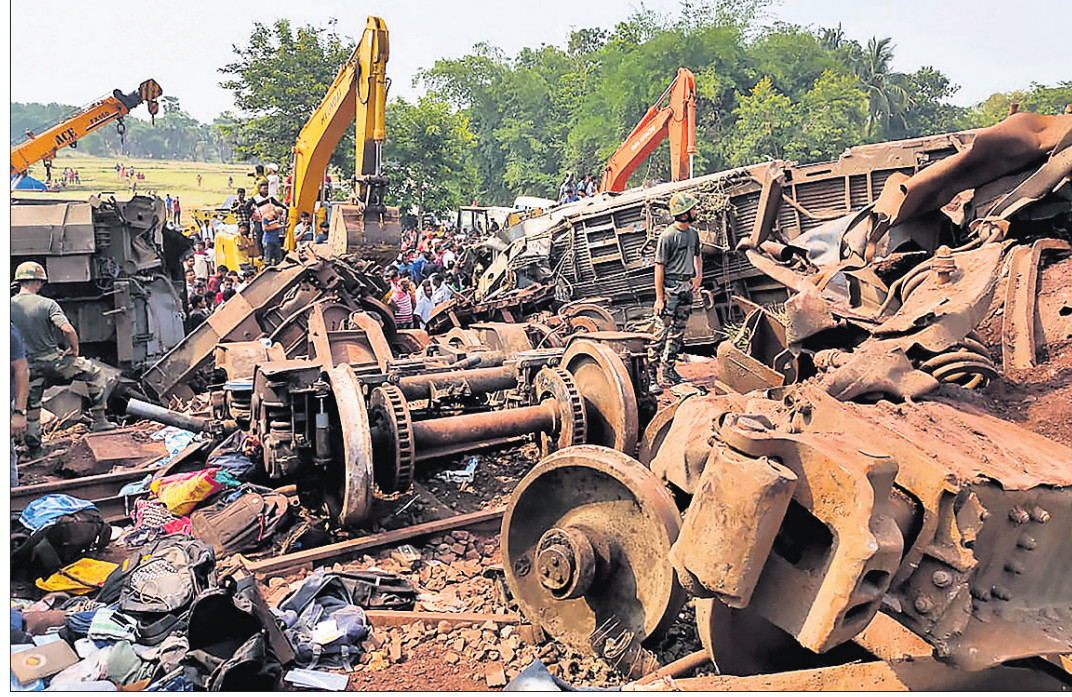
ଭାଙ୍ଗିଭୁଜି ଯାଇଥିବା ଏକ ବଗି ।