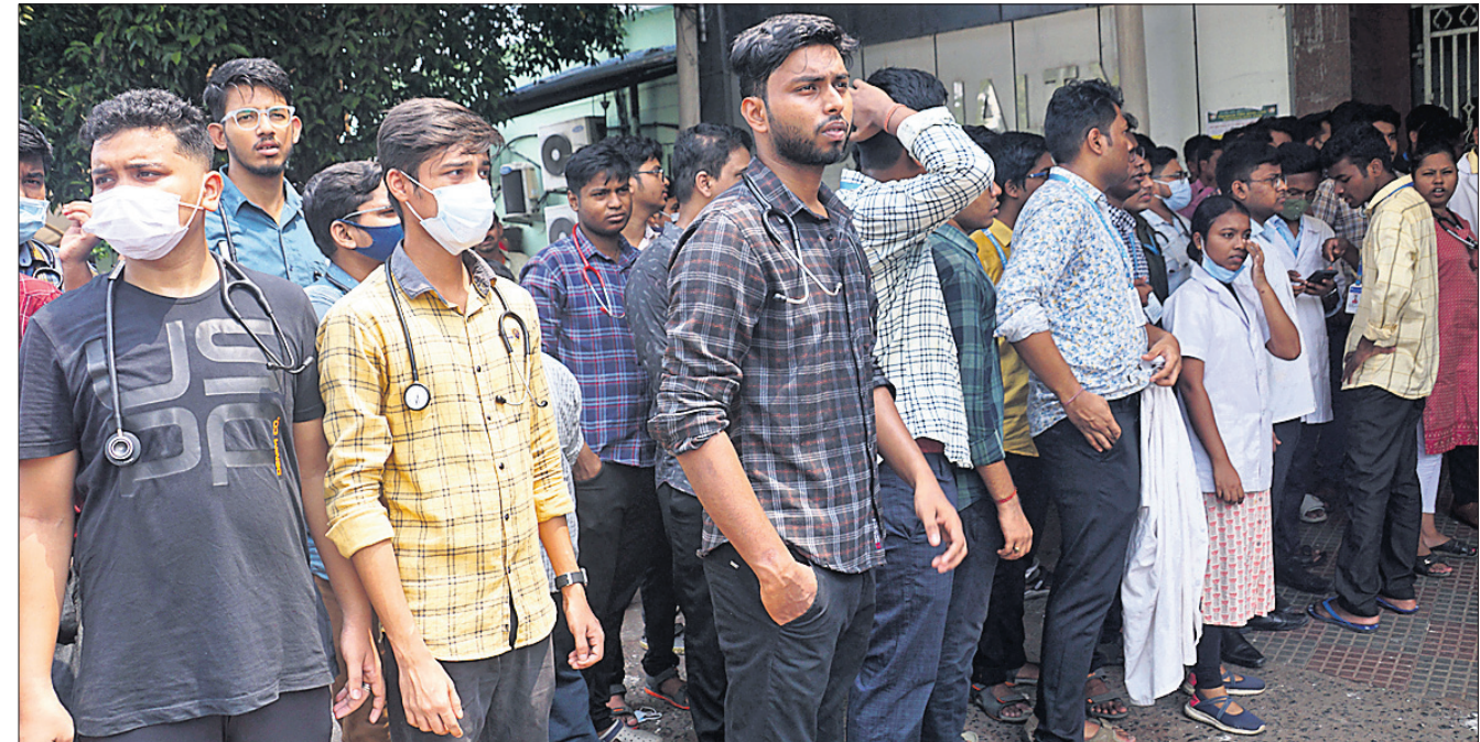
ଏସ୍‌ସିବି ମେଡିକାଲ କଲେଜ ଆଃ୍ ହସ୍ପିଟାଲରେ ଡାକ୍ତରୀ ଛାତ୍ରମାନେ ଆହତଙ୍କ ଚିକିତ୍ସା ଲାଗି ଅପେକ୍ଷାକୃତ।