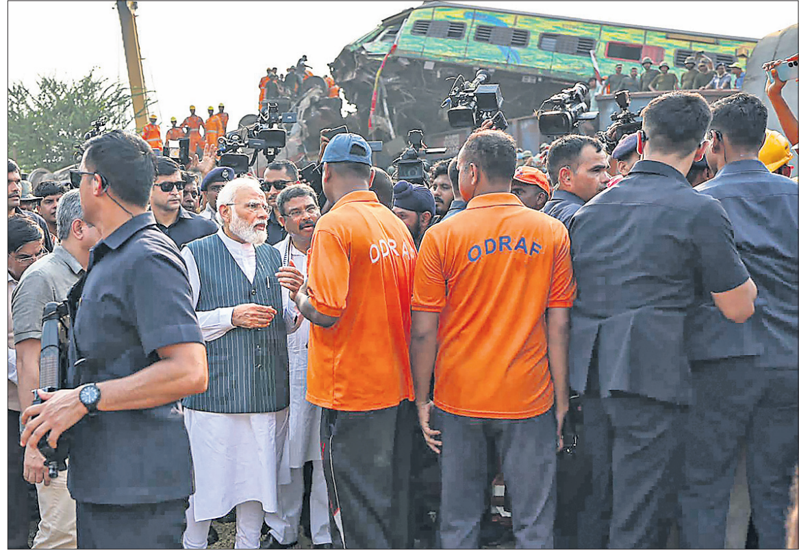
ଦୁର୍ଘଟସ୍ଥଳରେ ଓଡ୍ରାଫ୍ ଟିମ୍ ସହ ଆଲୋଚନା କରୁଛନ୍ତି ପ୍ରଧାନମନ୍ତ୍ରୀ।