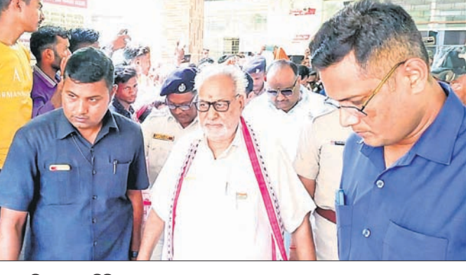
ଭଦ୍ରକ ଜିଲ୍ଲା ମୁଖ୍ୟ ଚିକିତ୍ସାଳୟରେ ରାଜ୍ୟପାଳ ପ୍ରଫେସର ଗଣେଶ ଲାଲ। ଆହତଙ୍କୁ ଭେଟିଲେ ରାଜ୍ୟପାଳ

ଭଦ୍ରକ ଅଫିସ, ୩୬ ଉଦ୍ଧାର ପାଇବା ପରେ ଉପହାର ଦେବା ପାଇଁ ଗୃହମନ୍ତ୍ରାଳୟ, ଚାଲିଗଲା ଜୀବନ ଆହତଙ୍କୁ ଭେଟିଲେ ରାଜ୍ୟପାଳ