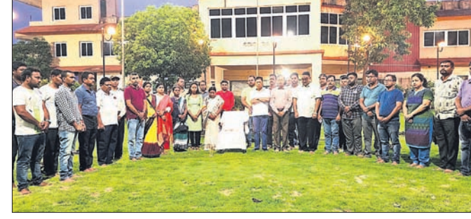
ଯୋଡ଼ା ପୌରପାଳିକା ଅଧ୍ୟକ୍ଷ, କାଉନ୍ସିଲର ଓ ଅନ୍ୟମାନେ।