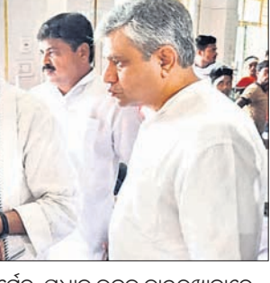
କେନ୍ଦ୍ରମନ୍ତ୍ରୀ ଅଶ୍ୱିନୀ ବୈଷ୍ଣବ ଓ କେନ୍ଦ୍ର ଶିକ୍ଷାମନ୍ତ୍ରୀ ଧର୍ମେନ୍ଦ୍ର ପ୍ରଧାନ ଭଦ୍ରକ ଡାକ୍ତରଖାନାରେ ଚିକିତ୍ସାଧୀନ ଜଣେ ଆହତଙ୍କ ସହ କଥା ହେଉଛନ୍ତି।

ବାହାନଗା ରେଳ ଦୁର୍ଘଟଣାରେ ଆହତ ହୋଇ ଭଦ୍ରକ ଜିଲ୍ଲା ମୁଖ୍ୟ ଚିକିତ୍ସାଳୟରେ ଚିକିତ୍ସାଧୀନ ଥିବା ଯାତ୍ରୀମାନଙ୍କୁ ରବିବାର ଦୁଇ କେନ୍ଦ୍ରମନ୍ତ୍ରୀ ଭେଟିଛନ୍ତି। ରେଳମନ୍ତ୍ରୀ ଅଶ୍ୱିନୀ ବୈଷ୍ଣବ, କେନ୍ଦ୍ର ଶିକ୍ଷା ଓ ଦକ୍ଷତା ବିକାଶ ମନ୍ତ୍ରୀ ଧର୍ମେନ୍ଦ୍ର ପ୍ରଧାନ ଚିକିତ୍ସାଧୀନ ୩୭ ଯାତ୍ରୀଙ୍କୁ ଭେଟି ସେମାନଙ୍କ ସ୍ୱାସ୍ଥ୍ୟାବସ୍ଥା ଓ ଚିକିତ୍ସା ବ୍ୟବସ୍ଥା ସମ୍ପର୍କରେ ପଚାରି ଚୁକିଥିଲେ। ସୁସ୍ଥ ହେବା ପରେ ଯାତ୍ରୀମାନଙ୍କୁ ସେମାନଙ୍କ ଘରେ ପହଞ୍ଚାଇବା ପାଇଁ ସମସ୍ତ ବ୍ୟବସ୍ଥା କରିବାକୁ ରେଳ ବିଭାଗର ୨ କର୍ମଚାରୀଙ୍କୁ ରେଳମନ୍ତ୍ରୀ ନିର୍ଦ୍ଦେଶ ଦେଇଛନ୍ତି।