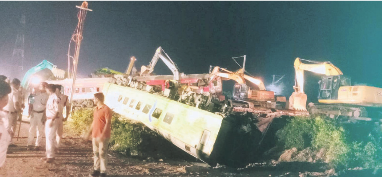
ମେଣିନ ବ୍ଲକ୍ ବଗିଚାସ୍ଥଳରେ ସହ ରେଳ ଧାରଣା ମରାମତି କରାଯାଇଛି।