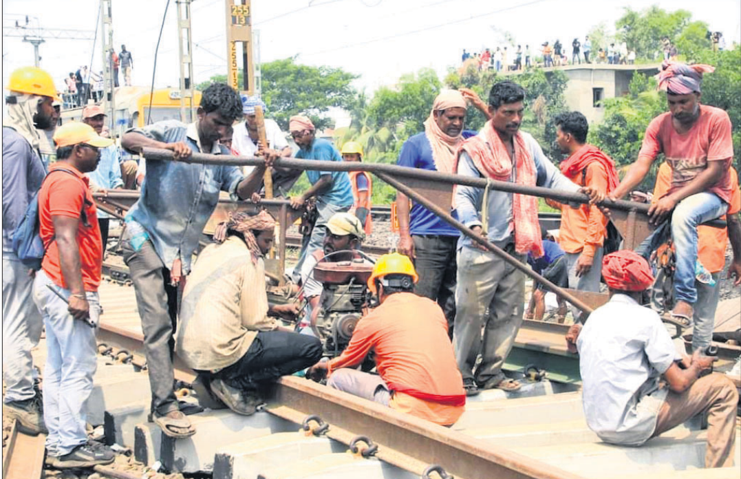
ବାହାନଗାଠାରେ ଦୁର୍ଘଟଣାଗ୍ରସ୍ତ ରେଳ ଲାଇନ୍‌କୁ ସଜାଡ଼ି ଯାଉଛନ୍ତି।