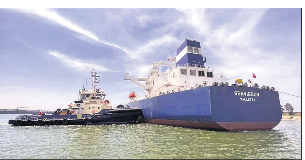
ମାଲଦୀବ ତୈଳବାହୀ ଜାହାଜରେ ମାନ୍ଦିକ ତ୍ରୁଟି ଯୋଗୁଁ ସୁଏଜ୍ କେନାଲର ୧୨ କି.ମି. ଭିତରେ ସିଙ୍ଗଲ୍ ଲେନ୍‌ସରେ ଅଟକ ହୋଇଯାଇଛି।

କରାଯାଇ ନାହିଁ ବୋଲି ପ୍ରିୟଙ୍କା ଗୁରୁତ୍ୱ ଦେଇଛନ୍ତି। ବିଶେଷଜ୍ଞ, ପାଲିମେଣ୍ଟାରୀ କମିଟି ଏବଂ ସିଏସ୍‌ଜିଏସ୍ ପ୍ରସ୍ତାବକୁ ଅଣଦେଖା କରିବାରେ କିଏ ଦାୟୀ?