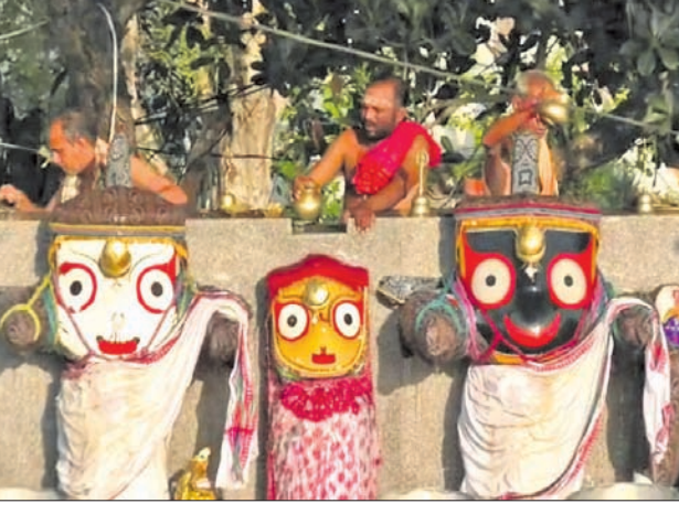
ସ୍ନାନମଣ୍ଡପରେ ଚତୁର୍ଦ୍ଧାମୂର୍ତ୍ତିର ଦେଖାଯିବାକୁ ମିଳିଛି।