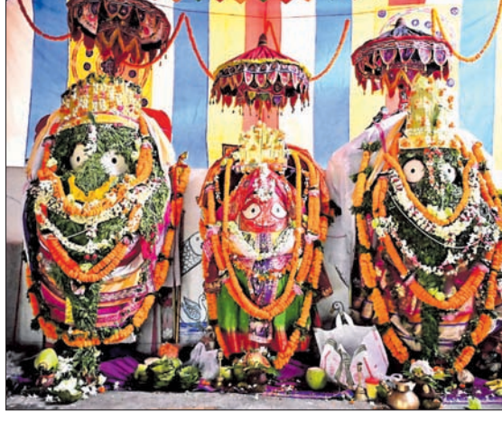
କେନ୍ଦୁଝର ବନବେଦନାରେ ଗଜାନନ ବେଶ।