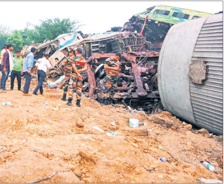
ବାହାନଗା ଟ୍ରେନ୍ ଦୁର୍ଘଟଣାସ୍ଥଳରେ ଉଦ୍ଧାର କାର୍ଯ୍ୟ ଚାଲିଛି।

କେନ୍ଦୁଝର, ୪।୬(ସ.ପ୍ର.): କେନ୍ଦୁଝର ଜିଲ୍ଲାର ଆରାଧ୍ୟ ଶ୍ରୀଶ୍ରୀ ବନବେଦନାଙ୍କ ସ୍ନାନମଣ୍ଡପରେ ପାଳିତ ହୋଇଯାଇଛି। ଶ୍ରୀ ଜିଉଙ୍କୁ ସକାଳ ପୂଜାର୍ଚ୍ଚନା ପରେ ପହଞ୍ଚି କରି ସ୍ନାନ ମଣ୍ଡପକୁ ନିଆଯାଇଥିଲା। ସେଠାରେ ବିଭିନ୍ନ ସୁବାସିତ ଜଳରେ ସ୍ନାନ କରାଯାଇଥିଲା। ଅପରାହ୍ନରେ ଶ୍ରୀ ଜିଉନାମକ ଗଜ ବେଶ ଅନୁଷ୍ଠିତ ହୋଇଥିଲା। ତୁଳସୀ, ଅଁଳା ଆଦି ପତ୍ରରେ ଶ୍ରୀ ଜିଉଙ୍କୁ ସଜ୍ଜିତ କରାଯାଇ ପରେ ସ୍ନାନ ବେଦୀରେ ପୂଜାର୍ଚ୍ଚନା କରାଯାଇଛି। ଶ୍ରୀ ଜିଉଙ୍କ ଗଜ ବେଶ ଦେଖିବାକୁ ଭକ୍ତ ଭିଡ଼ ଲାଗିଥିଲା। ଭକ୍ତଙ୍କ ସୁରକ୍ଷା ଓ ଶ୍ରୀଜିଉଙ୍କ ଦର୍ଶନ ପାଇଁ ମନ୍ଦିର ପକ୍ଷରୁ ବ୍ୟାପକ ବ୍ୟବସ୍ଥା କରାଯାଇଥିଲା।