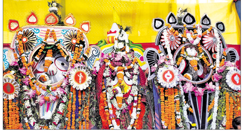
ନାଳଗିରିରେ ମହାପ୍ରଭୁଙ୍କ ଗଜାନନ ବେଶ।

ସ୍ନାନମଣ୍ଡପରେ ଚତୁର୍ଦ୍ଧାମୂର୍ତ୍ତିର ଦେଖାଯିବାକୁ ମିଳିଛି। ସ୍ନାନମଣ୍ଡପରେ ଚତୁର୍ଦ୍ଧାମୂର୍ତ୍ତିର ଦେଖାଯିବାକୁ ମିଳିଛି। ସ୍ନାନମଣ୍ଡପରେ ଚତୁର୍ଦ୍ଧାମୂର୍ତ୍ତିର ଦେଖାଯିବାକୁ ମିଳିଛି।