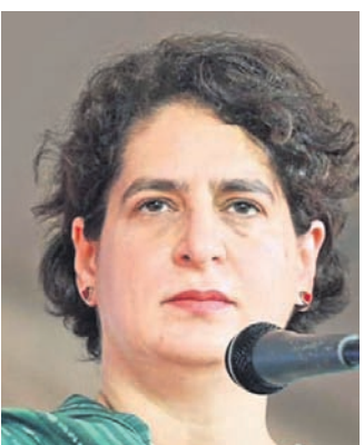
ବିଶେଷଜ୍ଞ, ପାଲିମେଣ୍ଟାରୀ କମିଟି ଏବଂ ସିଏସ୍‌ଜିଏସ୍ ପ୍ରସ୍ତାବକୁ ଅଣଦେଖା କରିବାରେ କିଏ ଦାୟୀ: ପ୍ରିୟଙ୍କା

ବାହାନଗା ତ୍ରିପଲ ଗ୍ରେନ୍ ଗ୍ରାଜେଟିକୁ ନେଇ ରାଜଦାମି ଆରମ୍ଭ ହୋଇଛି। ରେଳମନ୍ତ୍ରୀ ନୈତିକତା ଦୃଷ୍ଟିରୁ ଇସ୍ତଫା ଦିଅନ୍ତୁ ବୋଲି କଂଗ୍ରେସ ଦାବି କରିଛି।