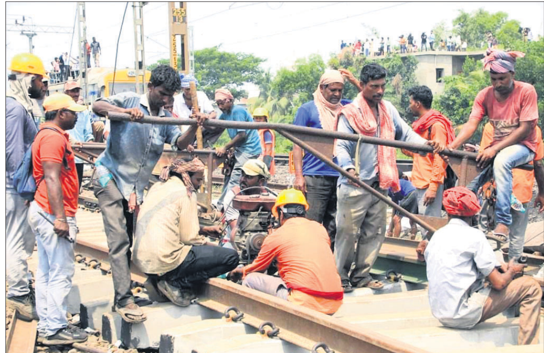
ବାହାନଗାଠାରେ ଦୁର୍ଘଟଣାଗ୍ରସ୍ତ ରେଳ ଲାଇନ୍‌କୁ ସଜଡ଼ା ଯାଉଛି।