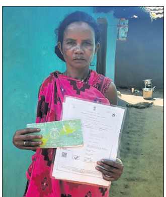
ଅଭିଯୋଗ କରିବା ସତରଞ୍ଜିତ ।

ସତେତନତା ଅଭାବର ସୂଚକ ରୂପେ ନେଇ ଦଲାଲମାନେ ଶ୍ରମିକ ବୀମା ଟଙ୍କା ହତୁପ କରିଥିବା ଅଭିଯୋଗ ଆସିଛି । ଜଣେ ଶ୍ରମିକଙ୍କ ମୃତ୍ୟୁ ଘଟଣା ଟଙ୍କା ନାମରେ ଆସିଥିବା ୨ ଲକ୍ଷ ୫ ହଜାର ଦିନା ଟଙ୍କାକୁ ଦଲାଲମାନେ ହତୁପ କରି ନେଇଥିବା ଶ୍ରମିକଙ୍କ ପକ୍ଷୀ ସତରଞ୍ଜିତ ଅଭିଯୋଗ କରିଛନ୍ତି । ନବରଙ୍ଗପୁର ଜିଲ୍ଲା ସଦର ବ୍ଲକ୍ ଚଟାହାଣ୍ଡି ପଞ୍ଚାୟତ ଅଧିକାରୀ ଚିନ୍ତା ରୁଟା ଗାଁରୁ ଏଭଳି ଅଭିଯୋଗ ଆସିଛି ।