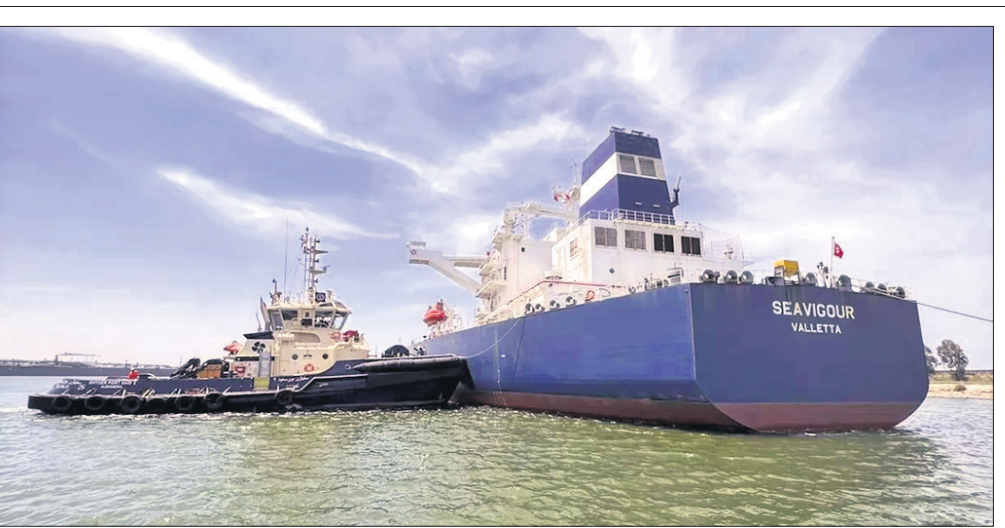
ମାଲଦୀବ ତୈଳବାହୀ ଜାହାଜରେ ମାନ୍ୟତା ଦେଇ ଗ୍ରହଣ କରାଯାଇ ୧୨ କି.ମି. ଭିତରେ ସିଙ୍ଗାଲ ଲେନ୍‌ସ୍‌ରେ ଅଟକ ହୋଇଯାଇଛି।