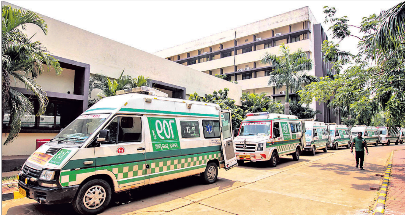
ଟ୍ରେନ୍ ଦୁର୍ଘଟଣାରେ ମୃତ ଯାତ୍ରୀଙ୍କୁ ଚିହ୍ନଟ ପାଇଁ ମୃତଦେହ ଧରି ଏମ୍ବୁରେ ପହଞ୍ଚିବା ଆହୁଲାସୁ ଧାଡ଼ିରେ ରହିଛି।

ମୁଖ୍ୟମନ୍ତ୍ରୀ ଯୋଷଣା କଲେ ଅନୁକମ୍ପା ରାଶି ମୃତକଙ୍କ ପରିବାରକୁ ୫ ଲକ୍ଷ, ଗୁରୁତରଙ୍କୁ ୩ଲକ୍ଷ ଟଙ୍କା।