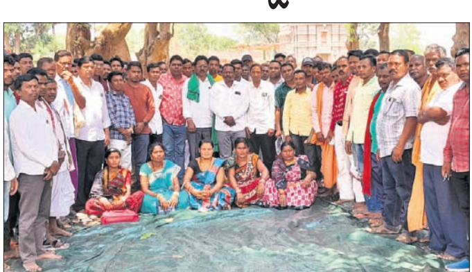
ଋଣେଶ କରାଯାଇଛି ।

ଋଣେଶ କରାଯାଇଛି । ଏଥିସହିତ ଆଦିବାସୀ ବିକାଶ ପରିଷଦ ପକ୍ଷରୁ ଋଣେଶ କରାଯାଇଛି । ଏଥିସହିତ ଆଦିବାସୀ ଭବନ ନିର୍ମାଣ ପାଇଁ ୩୦ଲକ୍ଷ ମଞ୍ଜୁର କରାଯାଇଥିବା ବେଳେ ସ୍ଥାନ ନିରୂପଣ ସମ୍ପର୍କରେ ଆଲୋଚନା କରାଯାଇଥିଲା ।