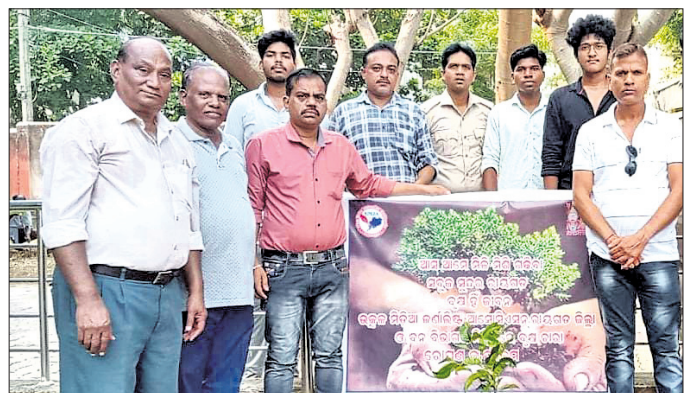
ଚାରା ରୋପଣ ଅବସରରେ ଏସିଏଫ୍ ଓ ଅନ୍ୟମାନେ ।

ବାଲେଶ୍ୱରର ବାହାନଗାଠାରେ ହୋଇଥିବା ରେଳ ଦୁର୍ଘଟଣାରେ ମୃତକଙ୍କ ଆତ୍ମାର ସନ୍ତତି ନିମନ୍ତେ ଡେକ୍ଟିଭିଟି ବ୍ଲକ୍ ଖାତିଗୁଡ଼ାରେ ବିଭିନ୍ନ ଅନୁଷ୍ଠାନ ସମ୍ମୁଖେ ଶୋକସଭା ତଥା କ୍ୟାଣ୍ଡେଲ ଶୋଭାଯାତ୍ରା ଆୟୋଜିତ ହୋଇଯାଇଛି ।