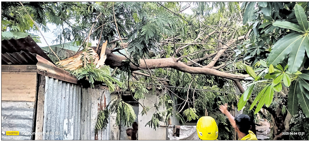
ଇନ୍ଦ୍ରପାଦ ଶୁଭିକ୍ଷମ ନିକଟରେ ସର୍ବସ୍ୱ ଚାନ୍ଦ ଛିଡ଼ି ପଡ଼ିଛି ।

ରାୟଗଡ଼ା ଓ ଏହାର ଆଖାପାଖି ଅଞ୍ଚଳରେ ରବିବାର କାଳବୈଶାଖୀର କରାଳ ବୃତ୍ତ ଦେଖିବାକୁ ମିଳିଛି । ଅପରାହ୍ଣ ପ୍ରାୟ ୩ଟାରେ ଜିଲ୍ଲାର ବିଭିନ୍ନ ସ୍ଥାନରେ ପ୍ରବଳ ବର୍ଷା ପାଣ୍ଡୁ କୋରରେ ପବନ ବହିବା ଦେଖିବାକୁ ମିଳିଛି । ଫଳରେ ରାୟଗଡ଼ା ସହର ସମେତ ଜିଲ୍ଲାର ପ୍ରାୟ ସ୍ଥାନରେ ବଡ଼ ବଡ଼ ଗଛ ଭାଙ୍ଗିବା ସହ ବିଦ୍ୟୁତ୍ ସରବରାହ ବନ୍ଦ ରହିଛି ।