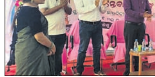
ଉଦ୍‌ଘାଟନା ଉତ୍ସବରେ ଅତିଥି କଣ୍ଠା ସମାପନ କରୁଛନ୍ତି ।

ଗତ ମେ ମାସ ୩୧ ତାରିଖଠାରୁ ଶିଶୁଗୃହର ଅନ୍ତେବାସୀଙ୍କୁ ନେଇ ଆରମ୍ଭ ହୋଇଥିବା ଗ୍ରାମ୍ୟାଳୀନ ଶିବିର-୨୦୨୩ ରବିବାର ଉଦ୍‌ଘାଟିତ ହୋଇଯାଇଛି ।