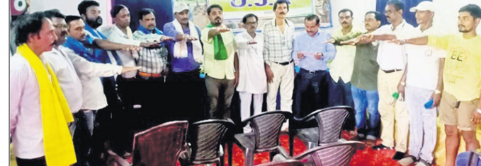
ଶବ୍ଦବାଦୀମାନେ ଶପଥପଠା କରୁଛନ୍ତି ।