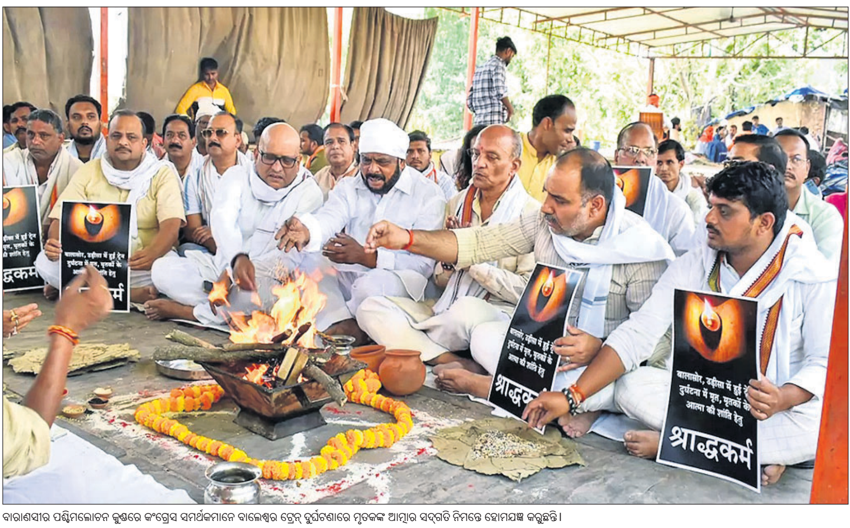
ବାରାଣସୀର ପଶ୍ଚିମଲୋତନ କୁଣ୍ଡରେ କଂଗ୍ରେସ ସମର୍ଥକମାନେ ବାଲେଶ୍ୱର ଗ୍ରେନ୍ ଦୁର୍ଘଟଣାରେ ମୃତକଙ୍କ ଆତ୍ମୀୟ ସଦ୍‌ଗତି ନିମନ୍ତେ ହୋମଯଜ୍ଞ କରୁଛନ୍ତି।

ବାଲୁମେର, ୪୫: ରାଜସ୍ଥାନର ବାଲୁମେର ଜିଲାର ମଣ୍ଡଲି ଷ୍ଟେଶନ ଅଞ୍ଚଳରେ ଜଣେ ମହିଳା ନିଜର ୪ ପିଲାଙ୍କୁ ଧନ ଧୂଳି ଭିତରେ ପୁରାଇ ବନ୍ଦ କରିଦେବା ପରେ ନିଜ ଆତ୍ମହତ୍ୟା କରିଛନ୍ତି।