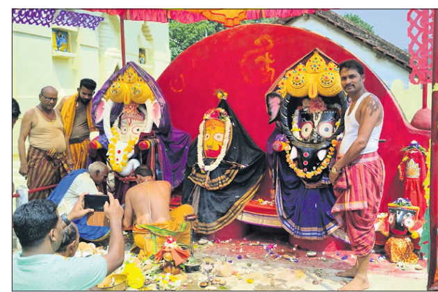
ରବିବାର ଦେବସ୍ନାନ ପୂର୍ଣ୍ଣିମା ଅବସରରେ କୋରାପୁଟ ଶାବର ଶ୍ରୀକ୍ଷେତ୍ର, ଜୟପୁର ଓ ନନ୍ଦପୁରରେ ଚତୁର୍ଦ୍ଧାପୂର୍ଣ୍ଣି ହାତୀ ବେଶରେ ଶ୍ରଦ୍ଧାଳୁଙ୍କୁ ଦର୍ଶନ ଦେଉଛନ୍ତି ।