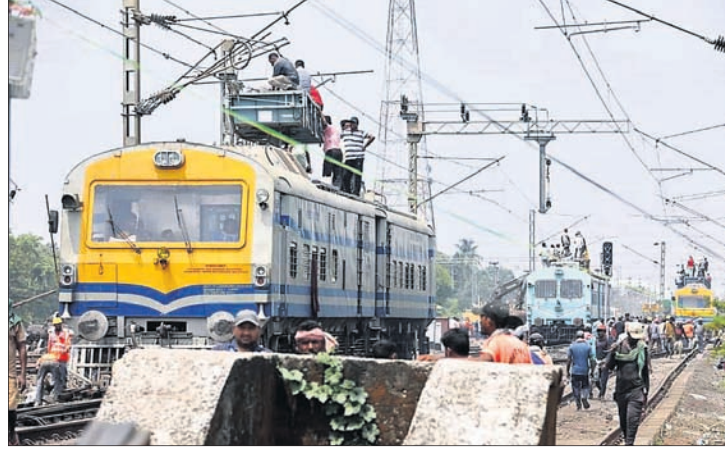
ବାହାନଗା ଟ୍ରେନ୍ ଦୁର୍ଘଟଣାସ୍ଥଳରେ ରେଳଲାଲନ୍ ଏବଂ ବିଦ୍ୟୁତ ମରାମତି କାର୍ଯ୍ୟ ଚାଲିଛି।

ଘଟୁଛି ବୋଲି ବିଶେଷଜ୍ଞମାନେ କହିଛନ୍ତି। ୨୦୨୨ ସେପ୍ଟେମ୍ବରରେ ସିଏଜିକି ଭାରତୀୟ ରେଳପଥ ସମ୍ପର୍କରେ ଅଭିଭାବନା ପାଲିମେଣ୍ଟରେ ଉପସ୍ଥାପନ କରାଯାଇଥିଲା। ଏଥିରେ ଟ୍ରେନ୍ ଲାଇନ୍‌ରୁ ଅଧିକ ସୁରକ୍ଷା ଏହାକୁ ଦେବା ଲାଗି ଅନେକ ପ୍ରସ୍ତାବ ଦିଆଯାଇଥିଲା। କିନ୍ତୁ ସେଗୁଡ଼ିକୁ ରେଳ ମନ୍ତ୍ରାଳୟ କାର୍ଯ୍ୟକାରୀ କରିନାହିଁ। ଏପରି କି ପରିବର୍ତ୍ତନ ଅଭାବ, ଦୁର୍ଘଟଣାଗୁଡ଼ିକ ପରେ ପୁଣ୍ୟ-୪