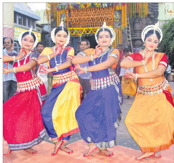
ଶ୍ରୀମନ୍ଦିର ସମ୍ମୁଖରେ ନୃତ୍ୟଶିଳ୍ପୀଙ୍କ ନୃତ୍ୟ ପରିବେଷଣ ।

ରଥ, ସ୍ନାନବେଦି ଆଗରେ ସେଲ୍ଫି ନେଲେ ମହାପ୍ରଭୁଙ୍କ ଦର୍ଶନ କରିବାକୁ ଆସିଥିବା ଅନେକ ଭକ୍ତ ବଡ଼ଦାଣ୍ଡରେ ଠିଆ ହୋଇ ସେଲ୍ଫି ନେଉଥିବା ଦେଖିବାକୁ ମିଳିଥିଲା । ବିଶେଷ କରି ପୁରୀ ଯୁବକମାନେ ଏହି ଦିନଟିକୁ ମନେ ରଖିବା ପାଇଁ ମନ୍ଦିର ଏବଂ ସ୍ନାନବେଦି ସହ ସେଲ୍ଫି ନେଇଥିଲେ । କେହି ପରିବାର ସହିତ ତ କିଏ ସାଙ୍ଗ ସାଥୀଙ୍କ ସହ ସେଲ୍ଫି ନେବାକୁ ଭୁଲୁ ନ ଥିଲେ । ଅନେକ ଶ୍ରଦ୍ଧାଳୁ ରଥ ସହ ସେଲ୍ଫି ନେଉଥିବା ମଧ୍ୟ ଦେଖିବାକୁ ମିଳିଥିଲା ।