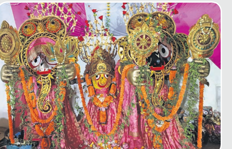
ଦେବସ୍ନାନ ପୂର୍ଣ୍ଣିମା ଅବସରରେ ରବିବାର କଟକ ଚାନ୍ଦିନୀଚୌକ, ବୋଲପୁଣ୍ଡାଳ, କାଜିବଜାର ଜଗନ୍ନାଥବଲ୍ଲଭ ମଠରେ ଶ୍ରୀକୀର୍ତ୍ତକ ଗଜାନନ ବେଶ ।