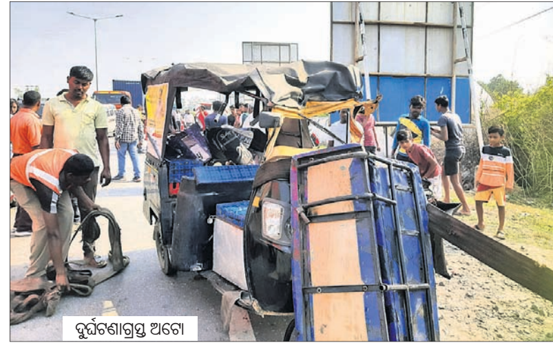
ଦୁର୍ଘଟଣାଗ୍ରସ୍ତ ଅଟୋ ଷ୍ଟେଶନକୁ ଟ୍ରେନ୍ ଧରିବା ପାଇଁ ଯାଉଥିଲେ। ଟୋଲପ୍ଲାକା ନିକଟରେ ରାସ୍ତାକଡ଼ରେ ଛିଟା ଯାଇଥିବା ଅଟୋଟିଏ ଏକ ହାଇଡ୍ରା ଲେଭେଲ୍ ୧୦ ଟିଟି ୮୬୭୭କୁ ପଛପଟୁ ଅଟୋ ଧକ୍କା ଦେଇଥିଲା। ଫଳରେ ସମସ୍ତେ ଗୁରୁତର ଆହତ ହୋଇଥିଲେ। ଶାସନ ପୋଲିସ୍, ଟୋଲ୍ ପ୍ଲାକା କର୍ମଚାରୀ ଓ ସ୍ଥାନୀୟ ଲୋକେ ସେମାନଙ୍କୁ ଉଦ୍ଧାର କରି ଆତ୍ମଲାଗୁରେ ବୁଲାଇ ଦାଖଲ କରାଯାଇଥିଲା।

■ ୬ ଗୁରୁତର ■ ଦଶାହ କାର୍ଯ୍ୟରେ ଯୋଗଦେବାକୁ ଯାଉଥିଲେ ■ ହାଇଦ୍ରାବାଦ ପହଞ୍ଚୁ ଧନ୍ଦା ଦେଲା ଅଟୋ