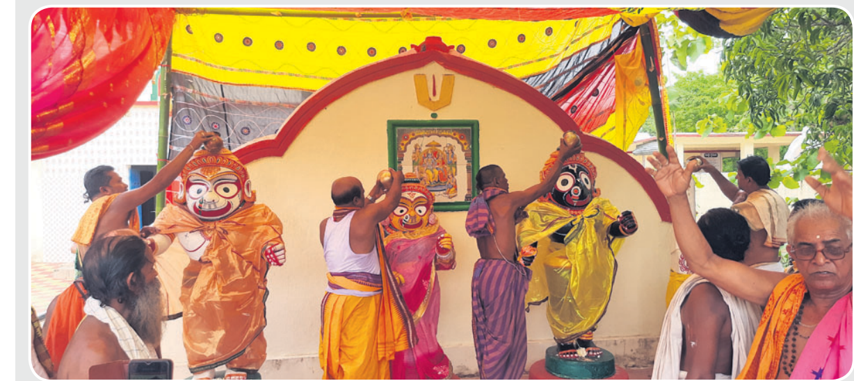
ଖୋର୍ଦ୍ଧା କାଗୁଲିପାଟଣା ସ୍ଥିତ ଶ୍ରୀଅନନ୍ତ ପୁରୁଷୋତ୍ତମ(ପୂର୍ଣ୍ଣ ବିଗ୍ରହ)ଙ୍କୁ ସ୍ନାନ କରାଯାଉଛି ।

ବାଲେଶ୍ୱର ଜିଲାର ବାହାନଗା ଷ୍ଟେସନରେ ହୋଇଥିବା ଟ୍ରେନ୍ ଦୁର୍ଘଟଣାର ପ୍ରଭାବ ପରିଲକ୍ଷିତ ହୋଇଛି । କୋଲକତାରୁ ପୁରୀକୁ ଟ୍ରେନ୍ ଚଳାଚଳ ସ୍ୱାଭାବିକ ହୋଇ ପାରି ନ ଥିବାରୁ ଅନେକ ବନ୍ଦୀୟ ଭକ୍ତ ପୁରୀ ଆସିପାରିନାହାନ୍ତି । ତେଣୁ ଚଳିତ ବର୍ଷ ମହାପ୍ରଭୁଙ୍କ ସ୍ନାନଯାତ୍ରାରେ ବନ୍ଦୀୟ ପର୍ଯ୍ୟଟକଙ୍କ ସଂଖ୍ୟା କମ୍ ରହିଥିବା ଦେଖିବାକୁ ମିଳିଥିଲା । ପୂର୍ବରୁ ସ୍ନାନଯାତ୍ରାରେ ସାମିଲ ହେବା ପାଇଁ ଚୁନା ବୁକ୍ କରିଥିବା ଅନେକ ବନ୍ଦୀୟ ଭକ୍ତ ଚୁନା ବାତିଲ କରିଥିବା ଜଣାପଡ଼ିଛି ।