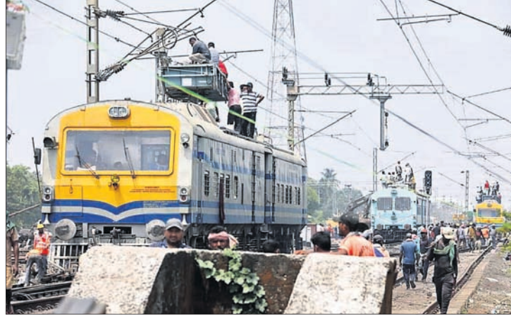
ବାହାନଗା ଟ୍ରେନ୍ ଦୁର୍ଘଟଣାସ୍ଥଳରେ ରେଳଲାଲନ୍ ଏବଂ ବିଦ୍ୟୁତ ମରାମତି କାର୍ଯ୍ୟ ଚାଲିଛି।

ଘଟୁଛି ବୋଲି ବିଶେଷଜ୍ଞମାନେ କହିଛନ୍ତି। ୨୦୨୨ ସେପ୍ଟେମ୍ବରରେ ସିଏଜିର ଭାରତୀୟ ରେଳପଥ ସମ୍ପର୍କରେ ଅଭିଭାବନା ପାଲିମେଣ୍ଟରେ ଉପସ୍ଥାପନ କରାଯାଇଥିଲା। ଏଥିରେ ଟ୍ରେନ୍ ଲାଇନ୍‌ରୁଟ ଓ ଧକା ହେବା ଭଳି ଦୁର୍ଘଟଣା ଏଡ଼ାଇବା ଲାଗି ଅନେକ ପ୍ରସ୍ତାବ ଦିଆଯାଇଥିଲା। କିନ୍ତୁ ସେଗୁଡ଼ିକୁ ରେଳ ମନ୍ତ୍ରାଳୟ କାର୍ଯ୍ୟକାରୀ କରିନାହିଁ। ଏପରି କି ପରିବର୍ତ୍ତନ ଅଭାବ, ଦୁର୍ଘଟଣାଗୁଡ଼ିକ ପରେ