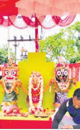
ଗଜା: ସ୍ନାନପଣ୍ଡପରେ ଶ୍ରୀଜୀଉ।