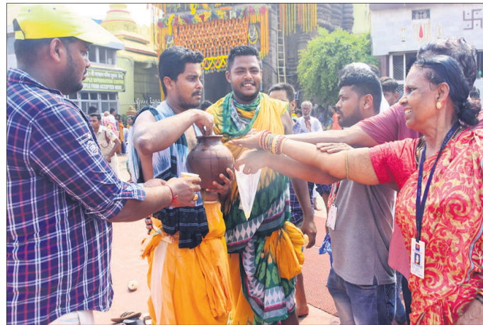
ସ୍ନାନକଳ ନେବା ପାଇଁ ଆସୁଛନ୍ତି ।