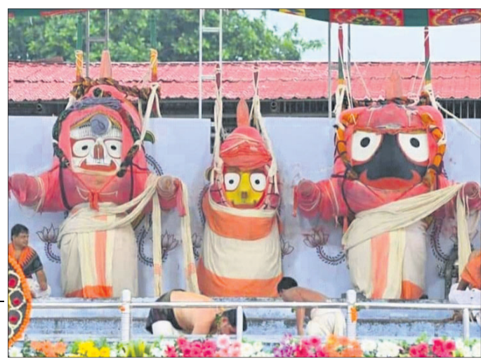
ଅବକାଶ ବେଶରେ ତିନିଠାକୁର ।