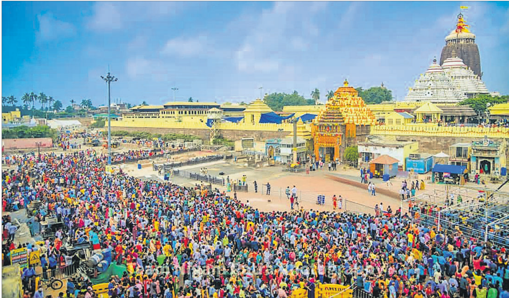
ପୁରୀ ଶ୍ରୀମନ୍ଦିର ସ୍ନାନବେଦିରେ ଚତୁର୍ଦ୍ଧାମୂର୍ତ୍ତିଙ୍କ ଦର୍ଶନ ପାଇଁ ଶ୍ରଦ୍ଧାଳୁଙ୍କ ଭିଡ଼ ।