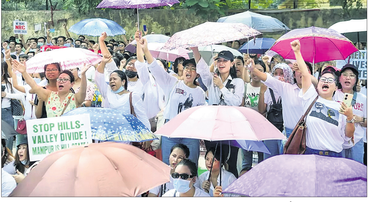
ନୂଆଦିଲ୍ଲୀର ଯତନପତ୍ରରେ ମଣିଷ୍ଟର ମେଲି ସମ୍ପ୍ରଦାୟ ଛାତ୍ରଛାତ୍ରୀମାନେ ରିଭିବର ବିଶେଷ ପ୍ରଦର୍ଶନ କରୁଛନ୍ତି ।

କେନ୍ଦ୍ର ଗଞ୍ଜମ, ୪୬: ଦକ୍ଷିଣ ଆଫ୍ରିକାର ଡର୍ବନ ସହର ନିକଟରେ ଥିବା ଏକ ପୁରୁଷ ହଷ୍ଟେଲରେ ଗୁଳିକାଣ୍ଡ ଘଟି ୮ ଜଣଙ୍କ ମୃତ୍ୟୁ ହେବା ସହ ଅନ୍ୟ ୨ ଜଣ ଆହତ ହୋଇଛନ୍ତି । ଶନିବାର ଭୋର ସମୟରେ ଉପଲାଭି ସହରରେ ଥିବା ହଷ୍ଟେଲ ପ୍ରକୋଷ୍ଠ ମଧ୍ୟକୁ କେତେଜଣ ବନ୍ଧୁକଧାରୀ ପ୍ରବେଶ କରି ଗୁଳି ଚଳାଇଥିଲେ । ଘଟଣାସ୍ଥଳରେ ୭ ଜଣଙ୍କ ମୃତ୍ୟୁ ହୋଇଥିବାବେଳେ ରିଭିବର ଅନ୍ୟ ଜଣଙ୍କ ମୃତ୍ୟୁ ଘଟିଛି । ଭୁଜଙ୍ଗ ଆହତ ହଷ୍ଟେଲରେ ଚିକିତ୍ସିତ ହେଉଛନ୍ତି । ସେମାନଙ୍କ ମଧ୍ୟରୁ ଜଣେ ଗୁଳିକାଣ୍ଡ ବର୍ତ୍ତା ଲାଗି ହଷ୍ଟେଲ ଚୁକ୍ ଡେରା ଦେଇ ତଳକୁ ଡେଇଁପଡ଼ିଥିଲେ । ପୋଲିସ୍ କହିବା ଅନୁଯାୟୀ ଗୁଳିକାଣ୍ଡ ବେଳେ ହଷ୍ଟେଲ ଚୁକ୍ ୧୨ ଜଣ ମଦ ପିଉଥିଲେ । ଦକ୍ଷିଣ ଆଫ୍ରିକାରେ ଗୁଳିକାଣ୍ଡ ନୂଆ ନୁହେଁ । ଗତ ଏପ୍ରିଲରେ ଘଟିଥିବା ଗୁଳିକାଣ୍ଡରେ ଜଣେ ଶିଶୁଙ୍କ ସମେତ ପରିବାର ୧୦ ଜଣଙ୍କ ମୃତ୍ୟୁ ହୋଇଥିଲା । ସେହିପରି ଜାମ୍ବୁଜାମ୍ବୀରେ ଏକ ଜନ୍ମଦିନ ପାର୍ଟିରେ ଗୁଳିକାଣ୍ଡ ହେବାକୁ ୮ ଜଣଙ୍କ ଜୀବନ ଯାଇଥିଲା ।