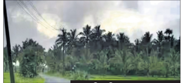
ନୂଆଦିଲ୍ଲୀ, ୪୬ ୩/୫ ଦିନ ବିଳମ୍ବ ହୋଇପାରେ

ଦକ୍ଷିଣ-ପଶ୍ଚିମ ମୌସୁମୀ ଛୁଇଁ ଧରଣ କେରଳ ଛୁଇଁବ ବୋଲି ଭାରତୀୟ ପାଣିପାଗ ବିଭାଗ (ଆଇଏମ୍‌ଡି) ପୂର୍ବାନୁମାନ କରିଥିଲା । ତେବେ ରିଭିବର ମୌସୁମୀ କେରଳରେ ପହଞ୍ଚିପାରି ନାହିଁ । ଏହା ଆଉ ୩/୪ ଦିନ ବିଳମ୍ବ ହୋଇପାରେ ବୋଲି ପାଣିପାଗ ବିଭାଗ କହିଛି । ସାଧାରଣତଃ ଛୁଇଁ ୧ରେ ମୌସୁମୀ କେରଳ ଛୁଇଁଥିବାବେଳେ ଏଥର ସପ୍ତାହେ ବିଳମ୍ବ ହେବାକୁ ଯାଇଛି । ଦକ୍ଷିଣ ଆରବ ସାଗର ଉପରେ ପଶ୍ଚିମା