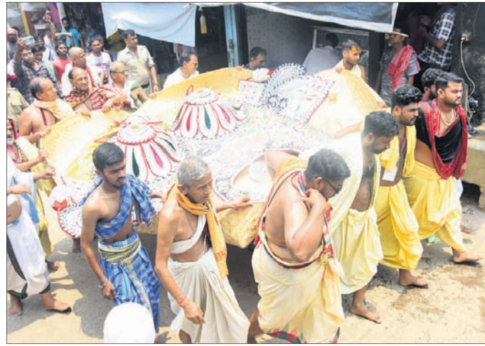
ଗୋପାଳତୀର୍ଥ ମଠରୁ ମହାପ୍ରଭୁଙ୍କ ହାତୀବେଶ ନିଆଯାଉଛି ।