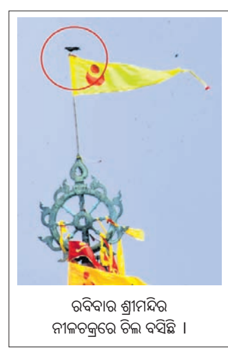
ରବିବାର ଶ୍ରୀମନ୍ଦିର ନୀଳଚକ୍ରରେ ଚଳ ବସିଛି।

ଅଏଲ ଇଣ୍ଡିଆ କମ୍ପାନୀ ପକ୍ଷରୁ ଏହି ପଥରକୁ ରିମ ମେଶିନ ଅତିକ୍ରମ କରିବା ପାଇଁ ବ୍ୟାପକ ଉଦ୍ୟମ କରାଯାଇଥିଲା। ହେଲେ କୌଣସି ସୁଫଳ ମିଳିଲା ନାହିଁ। ଶେଷରେ ଅଏଲ ଇଣ୍ଡିଆ କମ୍ପାନୀ ଚିତରା ଗ୍ରାମରେ ଥିବା ଅତ୍ୟାଧୁନିକ ମେଶିନଗୁଡ଼ିକୁ ଅପସାରଣ କରାଯାଇଥିବା ଦେଖିବାକୁ ମିଳିଛି। ଏ ସମ୍ପର୍କରେ ଅଏଲ ଇଣ୍ଡିଆ କମ୍ପାନୀର ଜଣେ ଅଧିକାରୀ ତାଙ୍କ ନାମ ଗୋପନ ରଖି କହିଛନ୍ତି, ପଥରକୁ ଭଙ୍ଗା ଯିବା ପରେ କାର୍ଯ୍ୟ କରାଯିବ।