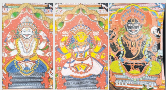
ଅନନ୍ତ ବାସୁଦେବ ମା' ଭୁବନେଶ୍ୱରୀ ଅନନ୍ତ ନାରାୟଣ

ବ୍ରହ୍ମଗିରି, ୪:୩୭(ଡି.ଏନ୍.ଏ.): ପୁରୀ ଧାମରେ ମହାପ୍ରଭୁ ଚତୁର୍ଦ୍ଧାମୂର୍ତ୍ତି ସ୍ନାନପୂର୍ଣ୍ଣିମାରେ ୧୦୮ କଳସ ଜଳରେ ସ୍ନାନ କରିବା ପରେ ଅଣସର ପିଣ୍ଡରେ ବିଜେ କରିଛନ୍ତି । ଏହି ସମୟରେ ରତ୍ନବେଦୀରେ ମହାପ୍ରଭୁ ଜଗନ୍ନାଥ, ବଳଭଦ୍ର ଓ ସୁଭଦ୍ରାଙ୍କୁ ଭକ୍ତମାନେ ଦର୍ଶନ କରିପାରି ନ ଥିଲେ । ଫଳରେ ଶ୍ରୀଜୀଉଙ୍କ ଆଉ ଏକ ଲୀଳାକ୍ଷେତ୍ର ବ୍ରହ୍ମଗିରି ବୃତ୍ତୀୟ ଶ୍ରୀକ୍ଷେତ୍ର ଭାବେ ଚଳଚଞ୍ଚଳ ହୋଇଥାଏ । ବାଭୁବିଗ୍ରହଙ୍କ ବଦଳରେ ଶ୍ରୀବାହୁମାନେ ଶିଳାନାରାୟଣ ଅଲାରନାଥଙ୍କୁ ଦର୍ଶନ କରି ସମପତ୍ନୀ ପ୍ରାପ୍ତ ହୋଇଥାନ୍ତି । ତେଣୁ ସୋମବାର ଠାରୁ ୧୪ଦିନ ପର୍ଯ୍ୟନ୍ତ ଶ୍ରଦ୍ଧାଳୁ ବ୍ରହ୍ମଗିରିସ୍ଥିତ ଅଲାରନାଥଙ୍କୁ ଦର୍ଶନ କରିପାରିବେ । ଠାକୁରଙ୍କୁ ଦର୍ଶନ ପାଇଁ ସ୍ୱତନ୍ତ୍ର ବ୍ୟାରିକେଡ୍ ବ୍ୟବସ୍ଥା କରାଯାଇଛି । ଶାନ୍ତିଶୃଙ୍ଖଳା ରକ୍ଷା ପାଇଁ ଏକ ପ୍ଲୁଟ୍ଟ ପୋଲିସ ଫୋର୍ସ ମୁତୟନ ହେବେ । ଏଥିସହ ବୃକ୍ଷାବୃକ୍ଷଙ୍କ ପାଇଁ ସ୍ୱତନ୍ତ୍ର ବ୍ୟବସ୍ଥା କରାଯାଇଛି ବୋଲି ସ୍ଥାନୀୟ ପ୍ରଣାସନ ଓ ମନ୍ଦିର କମିଟି ପକ୍ଷରୁ କୁହାଯାଇଛି ।