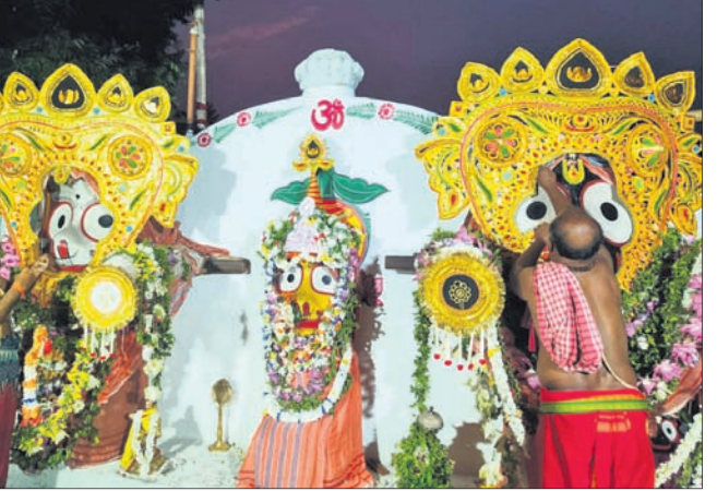
ବାଣପୁରରେ ଶ୍ରୀଜୀଉଙ୍କ ଗଜାନନ ବେଶ।