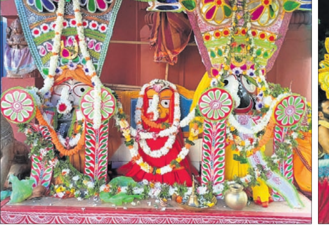
ହାତୀବେଶରେ ଦର୍ଶନ ଦେଲେ ଚତୁର୍ଦ୍ଧାବିଗ୍ରହ।

ଯାଇଥିଲା। ସଂକୀର୍ତ୍ତନ କାର୍ଯ୍ୟକ୍ରମ ସହ ଭକ୍ତ ସାଲବେଗ ସ୍ମୃତି କଳାମନ୍ଦିର ପକ୍ଷରୁ ଭଜନ ସମାବେଶ ଅନୁଷ୍ଠିତ ହୋଇଥିଲା। ରାତି ୧୧ଟା ପରେ ଆଳତି ହୋଇ ବଳଭଦ୍ର ଓ ସୁଭଦ୍ରାଙ୍କୁ ଗୋଟି ପହଞ୍ଚିରେ ଅଣସର ଘରକୁ ବିଜେ କରାଯିବା ବେଳେ ଜଗନ୍ନାଥଙ୍କୁ ଏକ ସ୍ୱତନ୍ତ୍ର ପିଣ୍ଡରେ ଦକ୍ଷିଣାମୂଳରେ ଉପବିଷ୍ଣୁ କରି ପଣା ଲାଗି ଓ ବିଭାଷଣ ଦର୍ଶନ ଆଳତି କରାଯାଇ ଅଣସରକୁ ନିଆଯାଇଛି ବୋଲି ପୂଜ୍ୟ ସେବାୟତ କହିଛନ୍ତି।