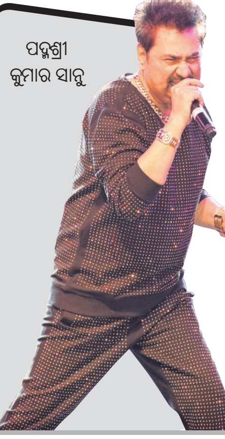
ପଦ୍ମଶ୍ରୀ କୁମାର ସାହୁ