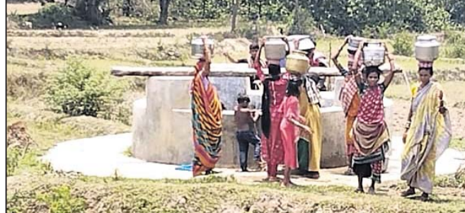
ସମସ୍ୟାରେ ଜର୍ଜରିତ ଖାରିଗୁମା ରଙ୍ଗମାଟି ସାହି

ପାରଳାଖେମୁଣ୍ଡି/ମୋହନ, ୨୬ (ଡି.ଏନ.ଏ.) ଗଜପତି ଜିଲା ମୋହନ ରୁକ୍ ବଡ଼ସିନ୍ଧବା ପଞ୍ଚାୟତ ଅନ୍ତର୍ଗତ ଖାରିଗୁମା ଗ୍ରାମ ନିକଟ ରଙ୍ଗମାଟି ସାହି ଲୋକେ ନାହିଁନଥିବା ଦୁର୍ଦ୍ଦଶା ଭୋଗୁଛନ୍ତି। ଏହି ସାହିରେ ୭ଟି ପରିବାରର ୫୦ ଜଣ ଲୋକ ବ୍ୟବସାୟ କରନ୍ତି। ସମସ୍ତେ ଗରିବ ଶ୍ରେଣୀର। କୁଳି ମାଜୁରୀ ଖର୍ଚ୍ଚ ଓ ଜଳାଳାଭାବ ପ୍ରକାଶ ସଂଗ୍ରହ କରି ପରିବାର ପ୍ରତିପୋଷଣ କରନ୍ତି। ଗ୍ରାମବାସୀ ମୌଳିକ ସୁବିଧାକୁ ବଞ୍ଚିତ । ପାନୀୟ ଜଳର ଉତ୍ତମ ଅଭାବ ସାଙ୍ଗକୁ ରାସ୍ତା, ବିଦ୍ୟୁତ୍, ଆବାସ ଯୋଜନା ଓ