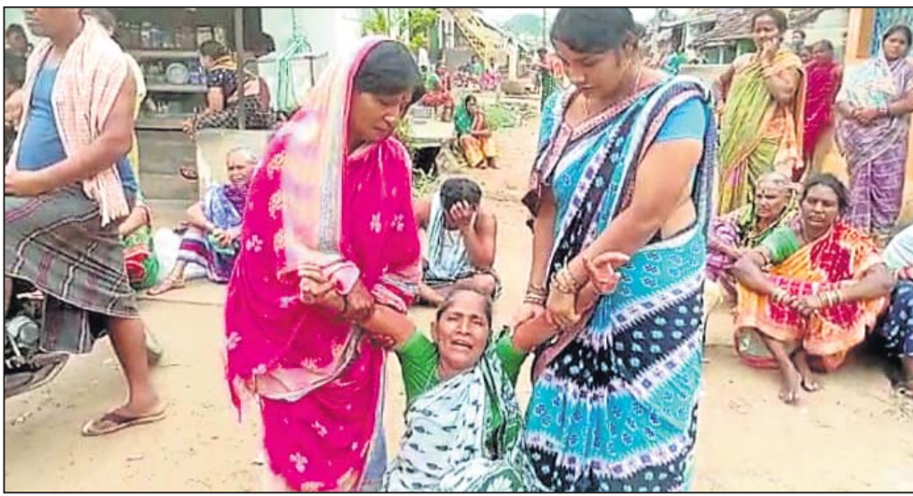
ଶିଶୁ ମୃତ୍ୟୁରେ ପ୍ରିୟମାଣା ମହିଳା

ପୁରୁଣାପାଟଣା ଡାକ୍ତରଖାନାରେ ଚିକିତ୍ସା କରାଯାଇଥିଲା। ହେଲେ ସାକ୍ଷ୍ୟ ଅବସ୍ଥା ଅନୁରୂପ ଚିକିତ୍ସା ଶୁଭିଳାଭାବରେ ପ୍ରାପ୍ୟ ହେବା ସମ୍ଭାବନା କମ୍ ହୋଇଥିଲା। ଚିକିତ୍ସା ପାଇଁ ନିଆଯାଇଥିଲା। ଯେଠାରେ ଅବସ୍ଥା ସମ୍ବନ୍ଧୀୟ ହେବାକୁ ଅବଗତ କରାଯାଇଥିଲା। ଶିଶୁକୁ ପ୍ରାଣେ ଜିଲା ମୁଖ୍ୟ ଚିକିତ୍ସାଳୟ ପରେ ଆନ୍ତର