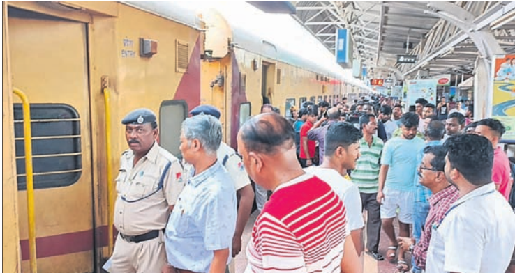
ବ୍ରହ୍ମପୁର ଷ୍ଟେଶନରେ ସିକନ୍ଦରାବାଦ-ଅଗରତାଲା ଏକ୍ସପ୍ରେସରୁ ଓହ୍ଲାଇ ପଡ଼ିଥିବା ଯାତ୍ରୀମାନେ ।

ବ୍ରହ୍ମପୁର ଅଫିସ/ଭୁବନେଶ୍ୱର (ବ୍ୟୁରୋ) ୬/୬ ଗଞ୍ଜାମ ଜିଲ୍ଲା ବ୍ରହ୍ମପୁର ରେଳ ଷ୍ଟେଶନରେ ମଙ୍ଗଳବାର ସିକନ୍ଦରାବାଦ-ଅଗରତାଲା ଏକ୍ସପ୍ରେସ ବି-୫ ଏସି ବଗିଚା ଧୁଆଁ ବାହାରିବା ପରେ ଯାତ୍ରୀମାନେ ଭୟଭୀତ ହୋଇ ଓହ୍ଲାଇ ପଡ଼ିଥିଲେ। ଭୁବନେଶ୍ୱର ରେଳସ୍ଟେସନରୁ ବିଭାଗର କର୍ମଚାରୀମାନେ ପହଞ୍ଚି ଧୁଆଁକୁ ଆୟତ୍ତ କରିଥିଲେ ମଧ୍ୟ ଯାତ୍ରୀମାନେ ସେହି ଟ୍ରେନ୍ରେ ଯିବାକୁ ରାଜି ହୋଇ ନ ଥିଲେ। ରେଳସ୍ଟେସନ କର୍ତ୍ତୃପକ୍ଷ ପହଞ୍ଚି ବୁଝାଶୁଝା କରିବାରୁ