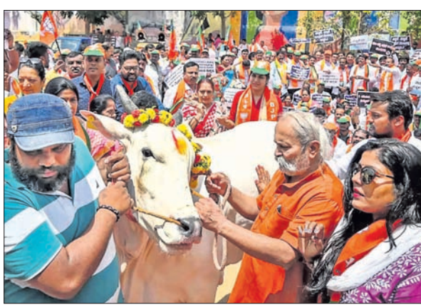
କର୍ମଚକ ସରକାର ଗୋହତ୍ୟା ନିରୋଧୀ ନିୟମକୁ ଛାଡ଼ିବାକୁ ନେଇ ରିପୋର୍ଟ ପ୍ରକାଶ ପାଇବା ପରେ ଭାଜପା ସମର୍ଥକମାନେ ଏହାକୁ ବିରୋଧ କରି ବେଙ୍ଗାଳୁରୁରେ ଗୋ ପୂଜା କରୁଛନ୍ତି।

ତଥା ମୁଖ୍ୟମନ୍ତ୍ରୀ ଅଶୋକ ଚୋପରାଙ୍କୁ ନେତା ଭାବେ ନିର୍ବାଚନ ପୂର୍ବରୁ ନୂଆ ଦଳ ଗଢ଼ିପାରନ୍ତି ପାଇଲଟ୍ ବୋଲି କେନ୍ଦ୍ରୀୟ ନେତାମାନେ କହିଛନ୍ତି।