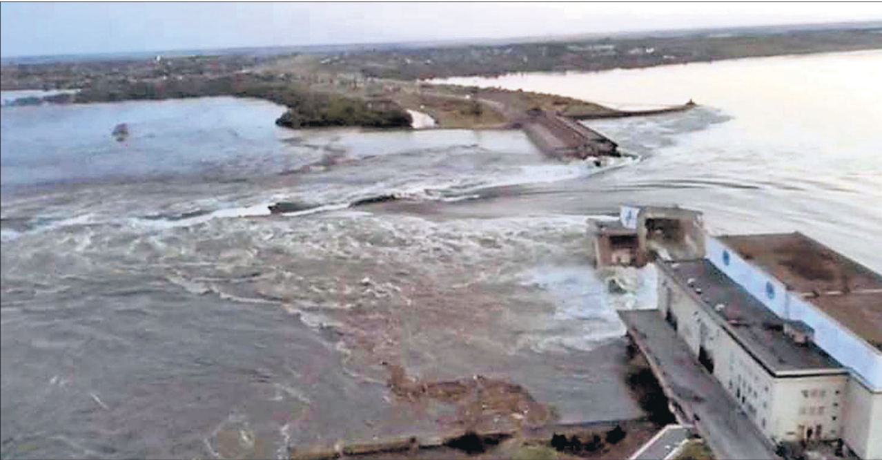
କୃଷି ମୁକ୍ତେନ୍ ଓ ଗୁଣ୍ଡିଆ ମଝିରେ ଥିବା ଯୋଡ଼ିବନ୍ଦ ଅମଳର ବିଶାଳକାୟ ନୋକା କାଖୋଲୁକା ତ୍ୟାମର ଏକ ବଡ଼ ଅଂଶ ଭୁବନେଶ୍ୱରରେ ବନ୍ୟା ସ୍ଥିତି ଉପୁଜିବାକୁ ଖେରସର ଅଞ୍ଚଳ ଅଧୀନ ୧୪ ଗ୍ରାମର ୨୨,୦୦୦ ଲୋକ ସୁରକ୍ଷିତ ସ୍ଥାନକୁ ପଳାୟନ କରିବାକୁ ବାଧ୍ୟ ହୋଇଛନ୍ତି । ତ୍ୟାମ୍ ଭୁବନେଶ୍ୱର ପରେ ଗୁଣ୍ଡିଆ ଓ କୁନ୍ତଳୁ ଏହି ଅନ୍ତର୍ଗତ କାର୍ଯ୍ୟ ପାଇଁ ପରସ୍ପରକୁ ଦାୟୀ କରିଛନ୍ତି । (ବିଷ୍ଣୁ ଚିତ୍ରୋତ୍ତର: ପୃଷ୍ଠା-୨)