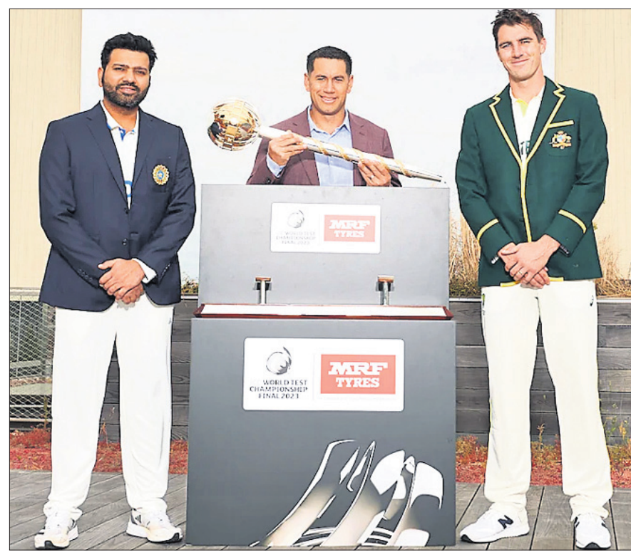
ଆଇସିସି ଟେଷ୍ଟ ମେଚ୍ ସହ ରୋହିତ ଶର୍ମା, ରଞ୍ଜିତ୍ କେରୀ ଓ ପ୍ୟାଟ୍ କ୍ଲୁମ୍ପି ।

ବିଶ୍ୱର ଶ୍ରେଷ୍ଠ ଟେଷ୍ଟ ଦଳ ନିର୍ଦ୍ଧାରଣ ପାଇଁ ବୁଧବାରଠାରୁ ଆରମ୍ଭ ହେବାକୁ ଯାଉଛି ବିଶ୍ୱ ଟେଷ୍ଟ ଚାମ୍ପିୟନସିପ୍ (ଡବ୍ଲ୍ୟୁଟିସି) ଫାଇନାଲ । ଇଂଲଣ୍ଡର ଓଭାଲରେ ଖେଳାଯିବ ଏହି ମହାସମର । ଭାରତ କ୍ରମାଗତ ଦ୍ୱିତୀୟ ଥର ପାଇଁ ଫାଇନାଲ ଖେଳିବାକୁ ଯାଉଥିବା ବେଳେ ପ୍ରଥମ ଥର ପାଇଁ ଅଷ୍ଟ୍ରେଲିଆ ଫାଇନାଲ ଖେଳିବ । ଆଇସିସି ଟ୍ରଫି