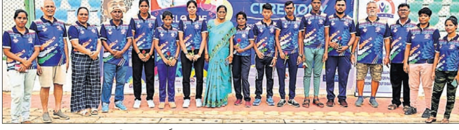
ବିଦାୟ ସମ୍ବର୍ଦ୍ଧନା ଉତ୍ସବରେ ଅତିଥିଙ୍କ ସହ ଖେଳାଳିମାନେ ।