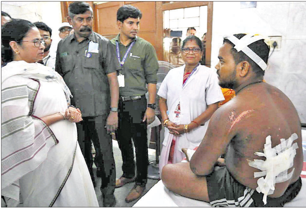
ପଶ୍ଚିମବଙ୍ଗ ମୁଖ୍ୟମନ୍ତ୍ରୀ ମମତା ବାନାର୍ଜୀ ଏସିଏସି ମେଡିକାଲରେ ଆହତଙ୍କ ସ୍ୱାସ୍ଥ୍ୟାବସ୍ଥା ପଚାରି ଚୁକ୍ତିଛନ୍ତି ।