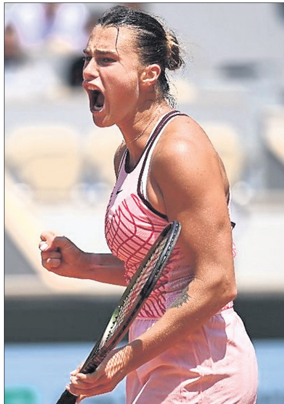
ମ୍ୟାଚ ଜିତିବାପରେ ଆରିନା ସାବାଲେଙ୍କାଙ୍କ ପ୍ରତିକ୍ରିୟା ।

ସର୍ଭରେ ୮୨ ପ୍ରତିଶତ ପଏଣ୍ଟ ହାସଲ କରିବା ସହିତ ସାବାଲେଙ୍କା ୬-୪, ୬-୪ରେ ସହଜ ବିଜୟ ହାସଲ କରିଥିଲେ । ଦ୍ୱିତୀୟ କ୍ୱାର୍ଟରେ କାରୋଲିନା ମୁଚୋଭା ମଧ୍ୟ ସାବାଲେଙ୍କା ସେଟରେ ବିଜୟ ହାସଲ କରିଥିଲେ । ଦ୍ୱିତୀୟ କ୍ୱାର୍ଟରେ କାରୋଲିନା ମୁଚୋଭା ମଧ୍ୟ ସାବାଲେଙ୍କା ସେଟରେ ବିଜୟ ହାସଲ କରିଥିଲେ । ଦ୍ୱିତୀୟ କ୍ୱାର୍ଟରେ କାରୋଲିନା ମୁଚୋଭା ମଧ୍ୟ ସାବାଲେଙ୍କା ସେଟରେ ବିଜୟ ହାସଲ କରିଥିଲେ ।