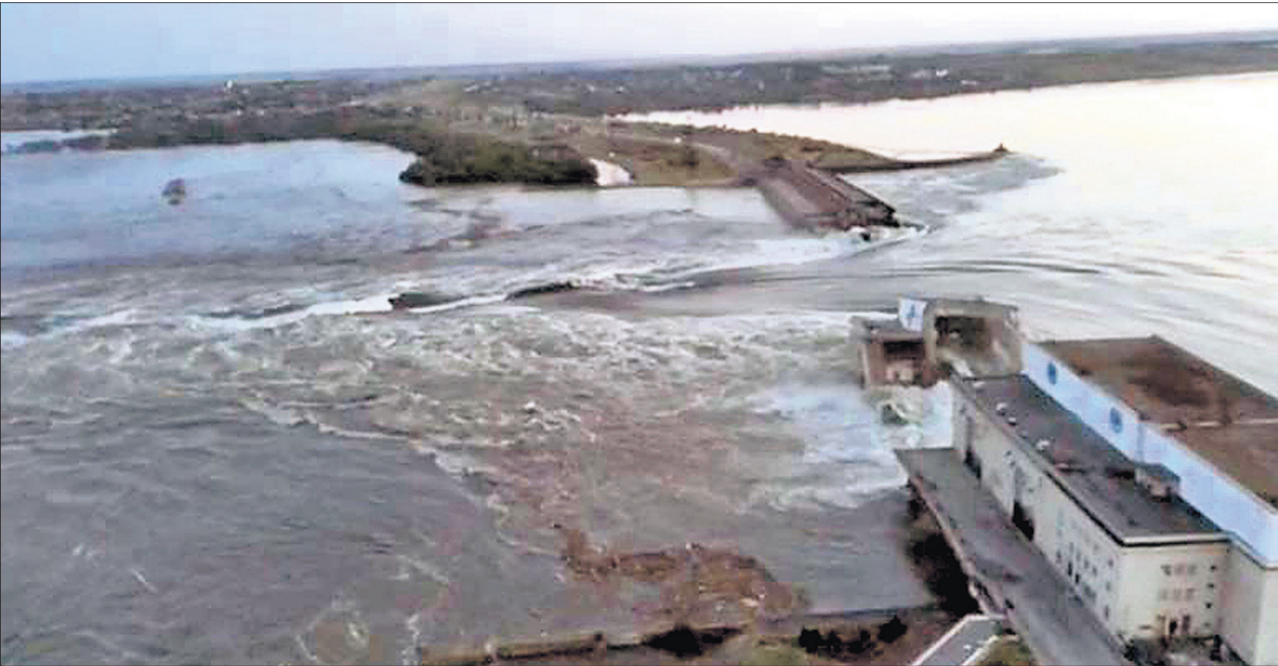
କୃଷି ମୁକ୍ତେନ୍ ଓ ରୁଷିଆ ମଝିରେ ଥିବା ଯୋଡ଼ିବର୍ ଅମଳର ବିଶାଳକାୟ ନୋକା କାଝୋଲୁକା ତ୍ୟାମର ଏକ ବଡ଼ ଅଂଶ ଭୁବନେଶ୍ୱର ସାମାଜିକ ସେବା ସମିତି ଉପକ୍ରମିତ ଭାବେ ଖେରସର ଅଞ୍ଚଳ ଅଧୀନ ୧୪ ଗ୍ରାମର ୨୨,୦୦୦ ଲୋକ ସୁରକ୍ଷିତ ସ୍ଥାନକୁ ପଳାୟନ କରିବାକୁ ବାଧ୍ୟ ହୋଇଛନ୍ତି । ତ୍ୟାମ୍ ଭୁବନେଶ୍ୱର ପରେ ରୁଷିଆ ଓ ହୁବୁନ୍ଦ୍ର ଏହି ଅନ୍ତର୍ଗତ କାର୍ଯ୍ୟ ପାଇଁ ପରସ୍ପରକୁ ଦାୟୀ କରିଛନ୍ତି । (ବିଷ୍ଣୁ ଚିତ୍ରୋତ୍: ପୃଷ୍ଠା-୨)