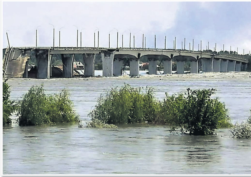
ନୋଭା କାଝୋଭୁକା ତ୍ୟାମ୍ ଭୁଗୁଡ଼ିବା ପରେ ଜଳମଗ୍ନ ଅଞ୍ଚଳ।

ନୂଆଦିଲ୍ଲୀ, ୨୬: ୨୦୨୨ର ବାୟୁ ପ୍ରଦୂଷଣ ସୂଚକାଙ୍କରେ ଭାରତ ଅଷ୍ଟମ ସ୍ଥାନରେ ରହିଛି। ଏହି ତାଲିକାରେ ଚୀନ୍, ଇଣ୍ଡୋନେସିଆ, ଫିଲିପାଇନ୍, ବାହାରିନ ଏବଂ ବାଙ୍ଗଳାଦେଶ ସର୍ବାଧିକ ପ୍ରଦୂଷିତ ରାଷ୍ଟ୍ର।