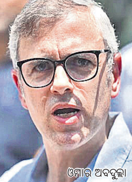
ଓମାର ଅବସ୍ଥା କହିଛନ୍ତି। ଶ୍ରୀନଗରରେ ଜି୨୦ ବୈଠକ କରାଯାଇ କର୍ମାଚରକୁ ବାହାର ଦୁନିଆ ଆଗରେ ପ୍ରଦର୍ଶନ କରାଗଲା। ତେବେ ବାସ୍ତବତା କ'ଣ ଜନସାଧାରଣ ଜାଣିବା ଆବଶ୍ୟକ ବୋଲି ଏହି ନେତା କହିଛନ୍ତି।

ନିର୍ବାଚନ ଜନସାଧାରଣଙ୍କ ଅଧିକାର। ଜନ୍ମ-କର୍ମାଚର ନିର୍ବାଚନ କରାଇବା ପାଇଁ କାହା ପାଖରେ ହାତ ପତାଇବୁ ନାହିଁ ବୋଲି ପୂର୍ବତନ ମୁଖ୍ୟମନ୍ତ୍ରୀ ତଥା ନ୍ୟାଶନାଲ କମ୍ପେଟିଟିଭ୍ ଉପାଧ୍ୟକ୍ଷ