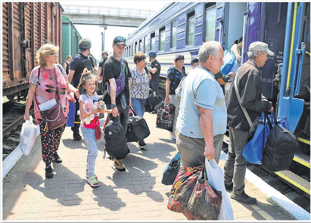
ଖେରସନ୍ଦ୍ର ପୁରସିତ ସ୍ଥାନକୁ ପଳାୟନ କରୁଛନ୍ତି ଲୋକେ।