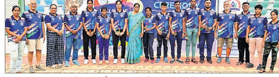
ବିଦାୟ ସମ୍ବର୍ଦ୍ଧନା ଉତ୍ସବରେ ଅତିଥିଙ୍କ ସହ ଖେଳାଳିମାନେ ।