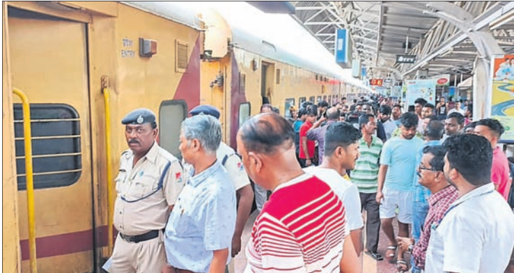
ବ୍ରହ୍ମପୁର ଷ୍ଟେଶନରେ ସିକନ୍ଦରାବାଦ-ଅଗରତାଲା ଏକ୍ସପ୍ରେସରୁ ଓହ୍ଲାଇ ପଡ଼ିଥିବା ଯାତ୍ରୀମାନେ ।

ଗଞ୍ଜାମ ଜିଲ୍ଲା ବ୍ରହ୍ମପୁର ରେଳ ଷ୍ଟେଶନରେ ମଙ୍ଗଳବାର ସିକନ୍ଦରାବାଦ-ଅଗରତାଲା ଏକ୍ସପ୍ରେସ ବି-୫ ଏସି ବଗିଚା ଧୁଆଁ ବାହାରିବା ପରେ ଯାତ୍ରୀମାନେ ଭୟଭୀତ ହୋଇ ଓହ୍ଲାଇ ପଡ଼ିଥିଲେ। ଭୁବନେଶ୍ୱର ଅଗ୍ରଣୀୟ ବିଭାଗର କର୍ମଚାରୀମାନେ ପହଞ୍ଚି ଧୁଆଁକୁ ଆୟତ୍ତ କରିଥିଲେ ମଧ୍ୟ ଯାତ୍ରୀମାନେ ସେହି ଟ୍ରେନ୍ରେ ଯିବାକୁ ରାଜି ହୋଇ ନ ଥିଲେ। ରେଳଘେ କର୍ତ୍ତୃପକ୍ଷ ପହଞ୍ଚି ବୁଝାଶୁଝା କରିବାରୁ