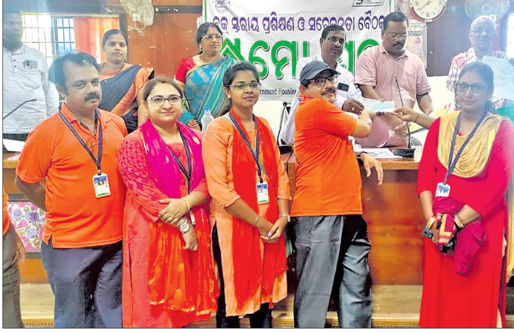
କାର୍ଯ୍ୟକ୍ରମରେ ନିମାପତ୍ରା ପଞ୍ଚାୟତ ସମିତି ପକ୍ଷରୁ ନୟାସବେରା ସୁଅପ୍ରସ୍ତୁତ କର୍ମକର୍ତ୍ତାଙ୍କୁ ସମର୍ଥନ କରାଯାଇଛି ।

ଚଳିତ ମାସ ୨୦ ତାରିଖରେ ବିଶ୍ୱନିର୍ମାଣ ବିଶ୍ୱପ୍ରସିଦ୍ଧ ରଥଖଳା ପ୍ରସ୍ତୁତ ହେବ । ଏଥିପାଇଁ ଶ୍ରୀମନ୍ଦିର ଅଧିକାରୀ ଉପକାରୀ ତିନି ରଥ ନିର୍ମାଣ କାର୍ଯ୍ୟ ତୁରନ୍ତ ଆରମ୍ଭ ହୋଇଛି । ମଙ୍ଗଳବାର ମହାରଣା ସେବକାମଳାଙ୍କ ଦ୍ୱାରା ରଥଖଳାରେ ପୋଟଳ ନିର୍ମାଣ କାର୍ଯ୍ୟ ଆରମ୍ଭ ହୋଇଛି । ସନ୍ଧ୍ୟା ପୂଜା ନିର୍ମାଣ କାର୍ଯ୍ୟ ଶେଷବେଳକୁ ବୃଦ୍ଧପରା ବା ବଡ଼ ଛତା ପୋଟଳକୁ ମିଶାଇ ଛଅଟି ଲେଖାଏ ପୋଟଳ ନିର୍ମାଣ ହେବ । ପ୍ରଥମ 'ବଡ଼ ଧରା' ପୋଟଳ ରଥରେ ସେବିକା ପାଇଁ ତିନିରଥର ତୃତୀୟ ଭୂଇଁ ଉପରେ ୪ଟି ଲେଖାଏ ପୋଟଳ ଖଣ୍ଡ ଏବଂ ଦୁଇଟି ଲେଖାଏ ଶେଣା ସେବିକା ହୋଇଛି । ଏହି ପୋଟଳ ୧୩ ପରସ୍ତ ବିଶିଷ୍ଟ, ଏହା ରଥର ଶେଷଭୂଇଁ ଉପରୁ ନିର୍ମାଣ ହୋଇଥାଏ । ଏହାର ଗଠନ ଶୈଳୀ ଶ୍ରୀମନ୍ଦିର ଶୀର୍ଷଭାଗ ଅଂଶ ପରି ଦୃଶ୍ୟମାନ ହୁଏ । ତିନିରଥର ପ୍ରଥମ ଭୂଇଁରେ କନକପୁଷ୍ପ ବସିବା ପାଇଁ ଖୋଦେଇ ତଥା ବିଶ୍ୱ କାର୍ଯ୍ୟ ହେବ । ତିନିରଥର ମୂଳ କଳିଙ୍ଗ ବା ଚାରି ନାହାକା କଳିଙ୍ଗ ପଡ଼ିବା ପାଇଁ ୧୬ ଫୁଟର ଗାଠି ଲେଖାଏ କଳିଙ୍ଗ କାଠରେ ବିଶ୍ୱ ତଥା କାପ ନିର୍ମାଣ ହେବ । ରୂପକାର ସେବକାମଳା 'ଚାର ପରିଛା'ରେ ପଦ୍ମ ତାଳି ଲତା ଖୋଦେଇ ଶେଷ କରିବା ପରେ ମହାରଣା ସେବକା, ଓଷା ସେବକା ଏବଂ ଭୋଇ ସେବକାଙ୍କ ସହାୟତାରେ ତିନି ରଥ ସମ୍ପୂର୍ଣ୍ଣ ଭାଗ ଦକ୍ଷା ପୂର୍ଣ୍ଣାବେଳେ ସେବିକା ହୋଇଥିବା ସାଲଗୁଡ଼ରେ କଣ୍ଠା ବାଡ଼େଇ ସେବିକା କରାଯାଇଛି । ରୂପକାର ସେବକାମଳା ତିନି ରଥର ଗାଠପରିଛାରେ ଖୋଦେଇ ଶେଷ କରି ନାଟଗୋଡ଼ରେ କର୍ମପୂର୍ଣ୍ଣ ଖୋଦେଇ ଲାଗି ରଖିଛନ୍ତି । ଚିତ୍ରକାର ସେବକାମଳା ପାଖି ଦେବଦେବୀଙ୍କ ରଙ୍ଗ କାର୍ଯ୍ୟ ଲାଗି ରଖିବା ସହ ରଥ ବାହ୍ୟ ଅଂଶଗୁଡ଼ିକର ରଙ୍ଗ ପାଇଁ ଚକ, ଗୁଳ, ଦକ୍ଷା ଇତ୍ୟାଦିରେ ପ୍ରାଣମର ଦେବା ଆରମ୍ଭ କରିଛନ୍ତି ।