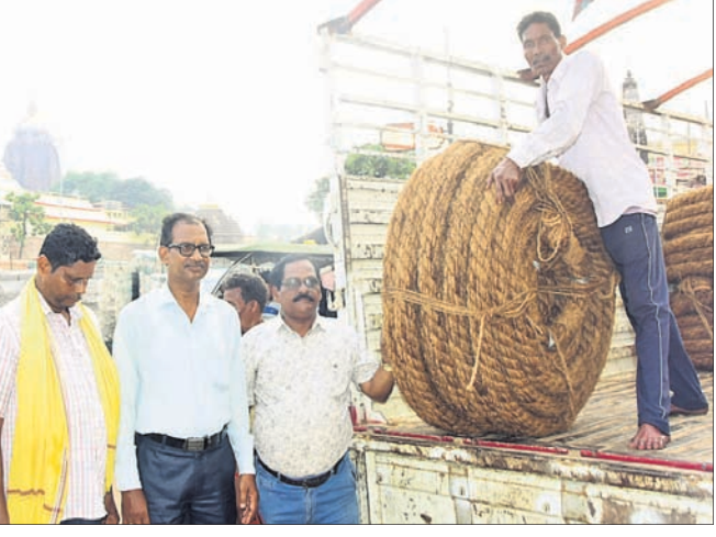
ରାଜ୍ୟ ସମବାୟ କଟା ନିଗମ ପକ୍ଷରୁ ଆସିଥିବା ରଥ ଦଉଡ଼ି।