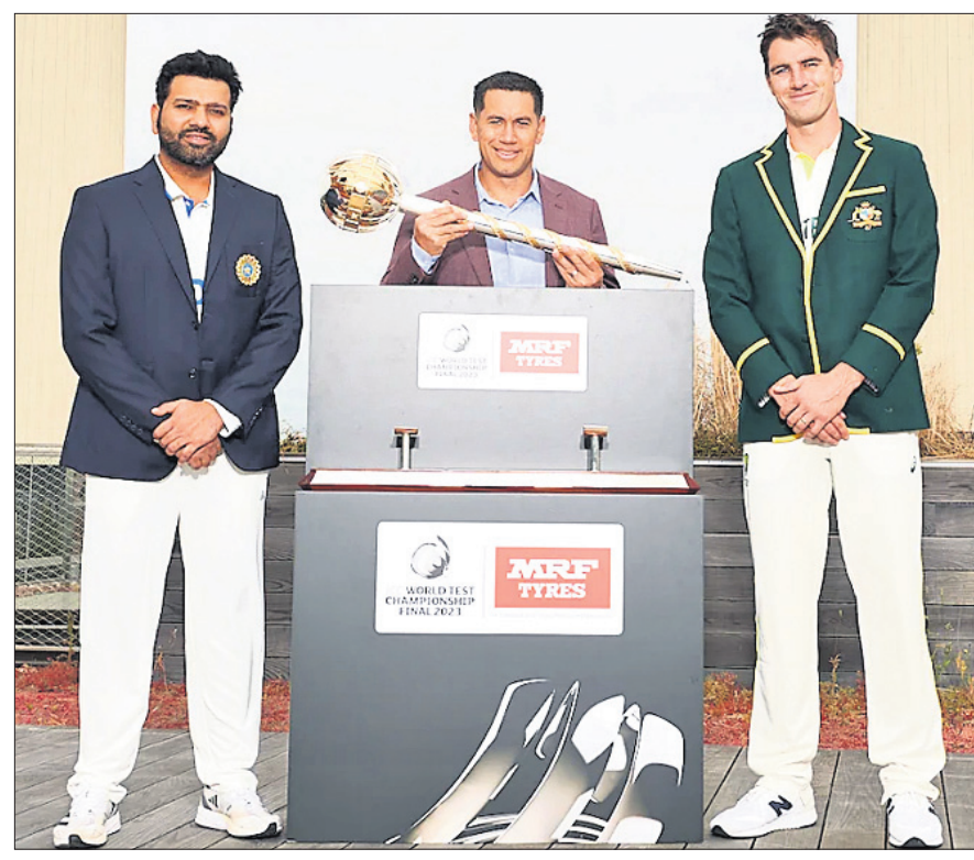
ଆଇସିସି ଟେଷ୍ଟ ମେଚ୍ ସହ ରୋହିତ ଶର୍ମା, ରଞ୍ଜିତ ଚୋପରା ଓ ପ୍ୟାଟ୍ କୁମ୍ଭିର୍ସ୍ତୁ।

ବିଶ୍ୱର ଶ୍ରେଷ୍ଠ ଟେଷ୍ଟ ଦଳ ନିର୍ଦ୍ଧାରଣ ପାଇଁ ବୁଧବାରଠାରୁ ଆରମ୍ଭ ହେବାକୁ ଯାଉଛି ବିଶ୍ୱ ଟେଷ୍ଟ ଚାମ୍ପିୟନସିପ୍ (ଡବ୍ଲ୍ୟୁଟିସି) ଫାଇନାଲ। ଇଂଲଣ୍ଡର ଓଭାଲରେ ଖେଳାଯିବ ଏହି ମହାସମର। ଭାରତ କ୍ରମାଗତ ଦ୍ୱିତୀୟ ଥର ପାଇଁ ଫାଇନାଲ ଖେଳିବାକୁ ଯାଉଥିବା ବେଳେ ପ୍ରଥମ ଥର ପାଇଁ ଅଷ୍ଟ୍ରେଲିଆ ଫାଇନାଲ ଖେଳିବ। ଆଇସିସି ତୃତୀ