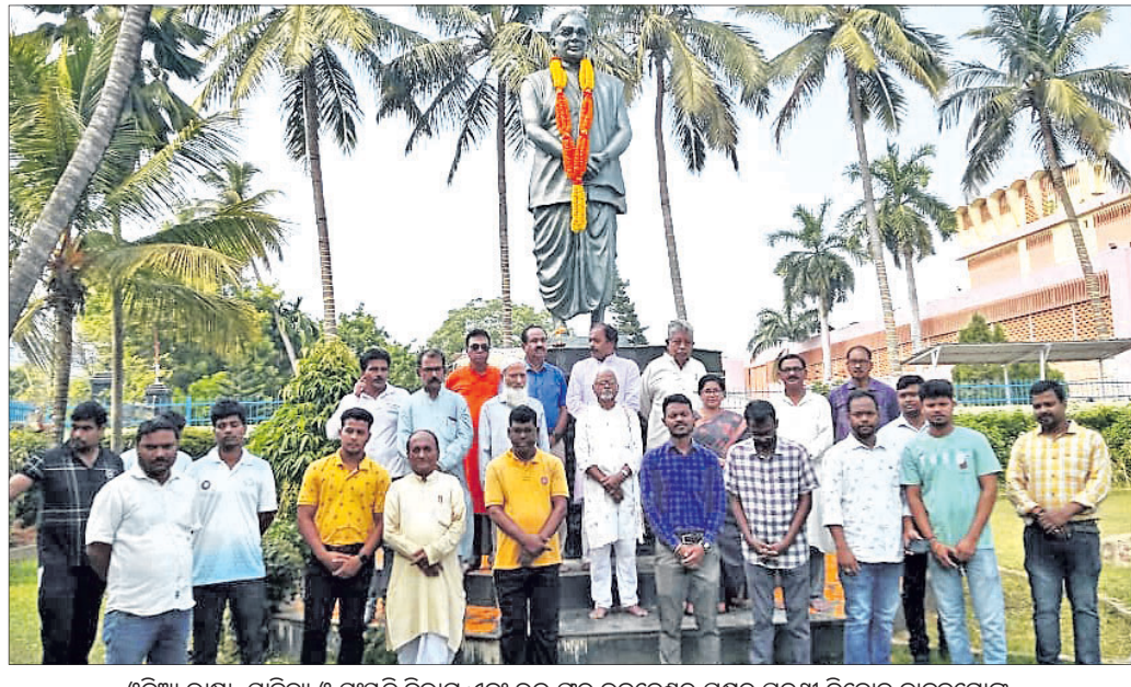
ଓଡ଼ିଆ ଭାଷା, ସାହିତ୍ୟ ଓ ସଂସ୍କୃତି ବିଭାଗ ଏବଂ ଉଚ୍ଚ ମଢ଼ ଭୁବନେଶ୍ୱର ପକ୍ଷରୁ ପଦ୍ମଶ୍ରୀ ବିନୋଦ କାନୁନ୍‌ଗୋଙ୍କ ୧୧୦ତମ ରାଜ୍ୟପୁରୀୟ ଜୟନ୍ତୀ ଅବସରରେ ରାଜ୍ୟ ଅଭିଲେଖାଗାର ପରିସରରେ ତାଙ୍କ ପ୍ରତିମୂର୍ତ୍ତିର ମାଲ୍ୟାପର୍ଚ୍ଚା କରାଯାଇଛି।