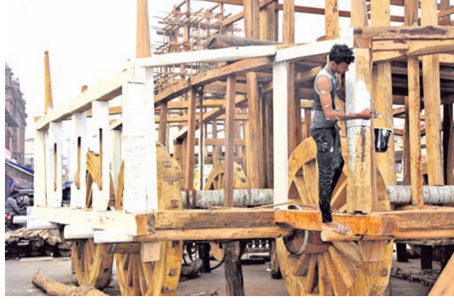
ପୁରୀ ଅଧିକ, ୬:୨୬