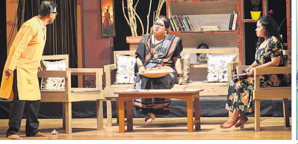
ଭୁବନେଶ୍ୱର ରବାନ୍ତ ମଞ୍ଚପରେ ମଙ୍ଗଳବାର ଅନୁଷ୍ଠିତ ଜଙ୍ଗଲ, ପରିବେଶ ଓ ଜଳବାୟୁ ପରିବର୍ତ୍ତନ ବିଭାଗ ସାଂସ୍କୃତିକ ପରିଷଦର ବାର୍ଷିକ ଉତ୍ସବରେ ପରିବେଷିତ ନାଟକ 'ଗା କପୁରେ ବଡ଼'ର ଏକ ଦୃଶ୍ୟ।

ସେଲଫି ପଠାଇବା ସମୟରେ ନିଜର ନାମ ଏବଂ ମୋବାଇଲ ନମ୍ବର ଦେବାକୁ ଭୁଲନ୍ତୁ ନାହିଁ। ଯୋଗ୍ୟ ବିବେଚିତ ଫଟୋ ପ୍ରକାଶ ପାଇବ।