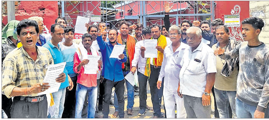
ଜିଲା ଶିକ୍ଷାଧିକାରୀଙ୍କ କାର୍ଯ୍ୟାଳୟ ସମ୍ମୁଖରେ ଗ୍ରାମବାସୀ ଧାରଣା ଦେଇଛନ୍ତି।

ଜାଲ୍ ସାର୍ଟିଫିକେଟ୍ ଦେଇ ମାହାଙ୍ଗା ବୃକ୍ଷ ଅନ୍ତର୍ଗତ ଗୋକନ ଉଚ୍ଚ ବିଦ୍ୟାଳୟରେ ଜଣେ ସହକାରୀ ଶିକ୍ଷୟିତ୍ରୀ ଭାବେ ଚାକିରି କରୁଥିବା ଅଭିଯୋଗ ହୋଇଥିଲା।