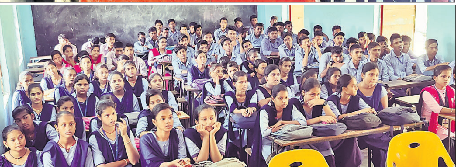
ବକ୍ସି ପ୍ରତିଯୋଗିତାର ବିଚାରକ ଓ ଅତିଥିଙ୍କ ସହ କୃତୀ ଛାତ୍ରାଛାତ୍ରୀ (ଉପର), ପ୍ରତିଯୋଗିତାରେ ଉପସ୍ଥିତ ଥିବା ଛାତ୍ରାଛାତ୍ରୀମାନେ ।

ରାଜ୍ୟମଧ୍ୟରୁ ହେଉଛି ଏକ କାର୍ଯ୍ୟକ୍ରମ ପ୍ରସାରୀ। ସମସ୍ତ ଗଣତନ୍ତ୍ର ପାଇଁ ଗଣମାଧ୍ୟମ ରକ୍ଷାକବଚ ପାଳିଛି।