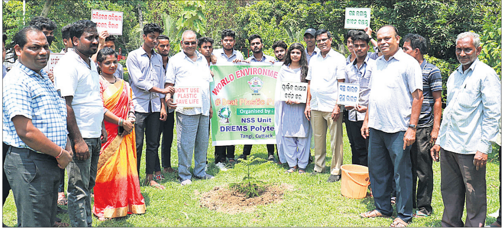
ତ୍ରିପୁରେ ଅନୁଷ୍ଠିତ କାର୍ଯ୍ୟକ୍ରମରେ ଉପସ୍ଥିତ ଛାତ୍ରୀଛାତ୍ର ଓ ଅତିଥିମାନେ।