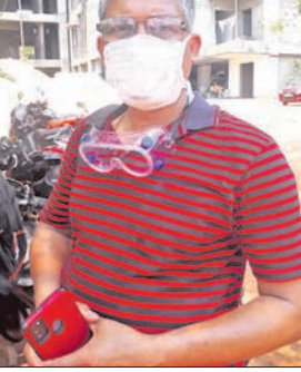
ଦୁର୍ଘଟଣାରେ ସେ ସମସ୍ତ ମୃତକଙ୍କ ଫଟୋ ଉଠାଇବାକୁ ଚେଷ୍ଟା କରୁଥିଲେ।

ଭୁବନେଶ୍ୱର, ୬/୬ (ବୁଧବାର): ବାଲେଶ୍ୱର ବାହନଗାରେ ଟ୍ରେନ୍ ଦୁର୍ଘଟଣା ହୋଇଥିବା ଖବର ପାଇ ଯୁଁ ସଙ୍ଗେ ସଙ୍ଗେ ଯେଠାରେ ପହଞ୍ଚିଥିଲେ। ହେଲେ ସେହି ବେଳରୁ କିଛି ଦୃଶ୍ୟ ଦେଖି କିଛି ସମୟ ଲାଗି ଯୁଁ ଶୁଣି ହୋଇଯାଇଥିଲେ।