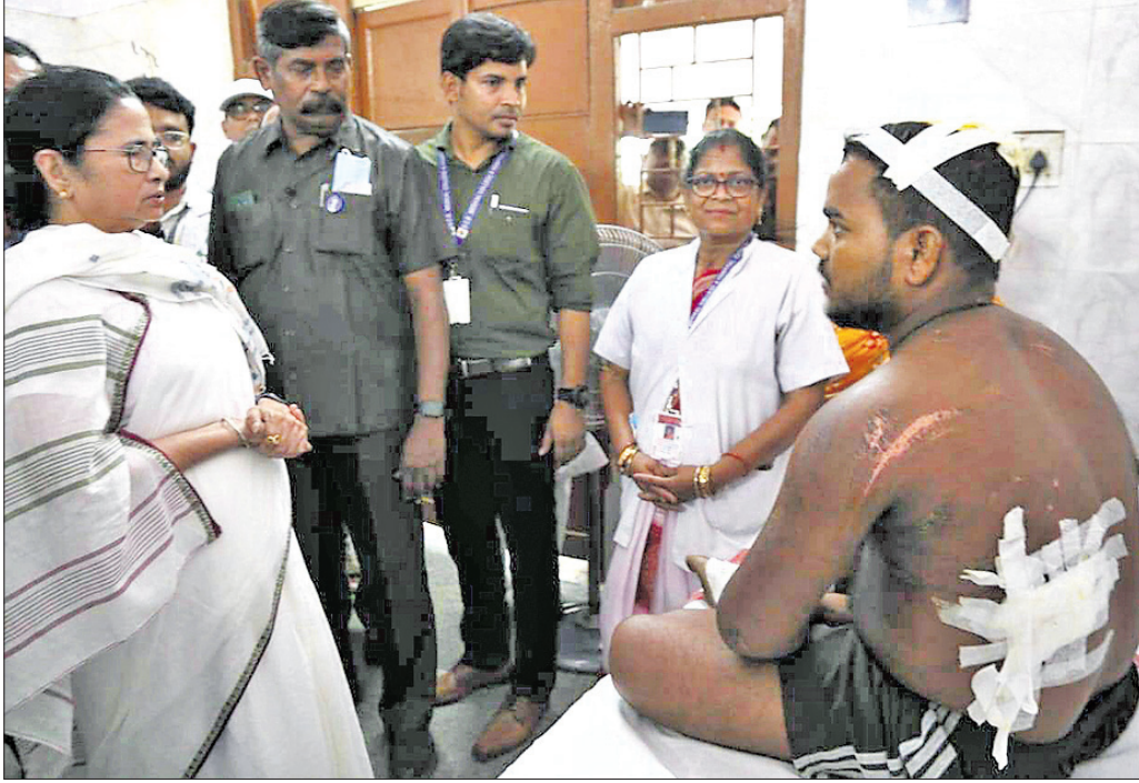
ପଶ୍ଚିମବଙ୍ଗ ମୁଖ୍ୟମନ୍ତ୍ରୀ ମମତା ବାନାର୍ଜୀ କଟକ ଏସିବି ମେଡିକାଲରେ ଆହତଙ୍କ ସାମ୍ବ୍ୟାବସ୍ଥା ପତାରି ବୁଝୁଛନ୍ତି।

ସେମାନଙ୍କ ଓ ମଙ୍ଗଳବାର ଏମ୍ବୁସକୁ ମୃତଦେହ ଟିକିଟ୍ କରିବାକୁ ଆସିଥିବା ପରିବାର ଓ ସମ୍ପର୍କୀୟମାନେ ଏଥିପାଇଁ ହତହତା ହେଉଥିବା ଦେଖିବାକୁ ମିଳିଥିଲା। କେତେଜଣ କହୁଥିଲେ ମୋ ବାପାଙ୍କ ମୃତଦେହ ଆଉ କିଏ ନେଇଯାଇଛି। ଆଉ କିଏ କହୁଥିଲେ ବାଲେଶ୍ୱରରୁ ଭୁବନେଶ୍ୱର ଯାଏ ଆମ ଲୋକଙ୍କୁ ଖୋଜୁଥିଲେ ମଧ୍ୟ କେଉଁଠୁ ବି ମିଳୁନି। ମୃତଦେହ ରଖାଯାଇଥିବା ଏମ୍ବୁସ, କ୍ୟାମ୍ପିଙ୍ଗ ଲାଗି ହଇରାଣ ହେଉଛି ବୋଲି ନିରାଶ ସାରିଲୁଣି, କିନ୍ତୁ କେଉଁଠି ହେଲେ ପାଇନାହିଁ।