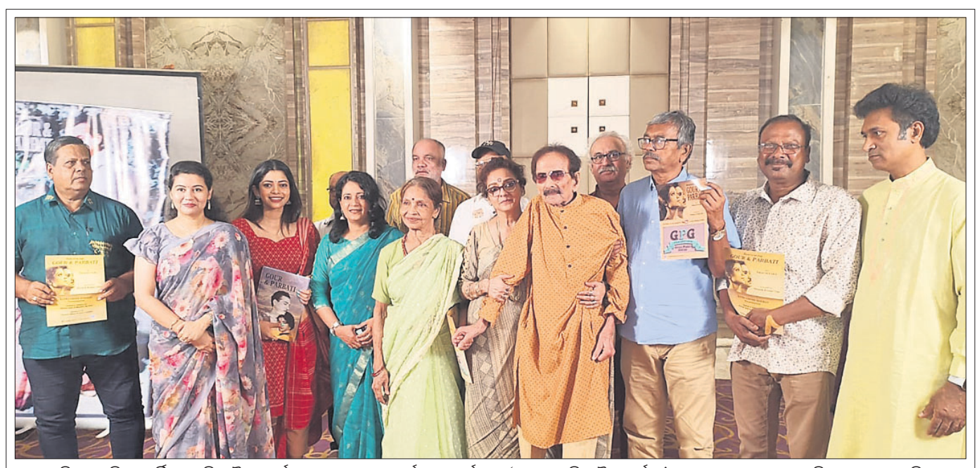
ଓଡ଼ିଆ ଚଳଚ୍ଚିତ୍ର ଗୌର ପାର୍ବତୀ-ପାର୍ବତୀ ଉପରେ ଏକ ବାର୍ତ୍ତାକାପ କାର୍ଯ୍ୟକ୍ରମ 'ମନେ ପଡ଼ନ୍ତି ଗୌର ପାର୍ବତୀ' ସ୍ୱରୂପେ ତ୍ୟାଗେଇ ପ୍ରସାରିତ ହେବାକୁ ଯାଉଛି। ଏ ସମ୍ପର୍କରେ ଭୁବନେଶ୍ୱରରେ ଏକ ହୋଟେଲରେ ଏ ସମ୍ପର୍କରେ ସୂଚନା ଦିଆଯିବା ଅବସରରେ ଅଭିନେତା, ଅଭିନେତ୍ରୀ, ଗୀତିକାର ଓ ଅନ୍ୟ କଳାକାରମାନେ।

ବନ୍ୟଜନ୍ତୁ, କଳକାରଖାନା ଚାଲିବା ପାଇଁ ପାଣି ବରକାର। ମହାନଦୀ ସହ ରାଜ୍ୟର ପ୍ରମୁଖ ୧୧ଟି ନଦୀକୁ ପୁନର୍ଜୀବିତ କରିବା, ନଦୀର ପୂର୍ବ ପ୍ରବାହ ସୁନିଶ୍ଚିତ କରିବା, ପ୍ରଦୂଷଣ ରୋକିବା, ସହର, ମେଡିକାଲ, ପ୍ଲାଷ୍ଟିକ ଓ ଶିଳ୍ପ ଆବର୍ଜନା, ବିଷାକ୍ତ ଜଳକୁ ନଦୀକୁ ଛାଡିବାକୁ ବାରଣ କରିବା, ନଦୀ ଜଳର ଉପଯୁକ୍ତ ପରିଚାଳନା, ନଦୀ ପ୍ରାଚୀନସ୍ଥଳକୁ ଆରମ୍ଭ କରି କୂଳରେ ବ୍ୟାପକ ବୃକ୍ଷ ରୋପଣ କରି ପୂର୍ଣ୍ଣିକା ସଂରକ୍ଷଣ, ବାଲି ଓ ପାଚୁଟାଟି ସଫା କରିବା ଆଦି ଦାବି ରଖାଯାଇଛି।