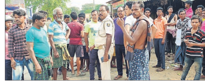
ପୋଲିସ ଉତ୍ତମ ଲୋକକୁ ବୁଝାଣୁଣା କରୁଛି।