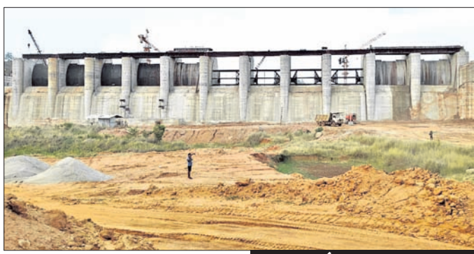
ନିର୍ମାଣାଧୀନ ଲୋକପ୍ରିୟ ସୁକ୍ଷ୍ମକଳା ତ୍ୟାମ ।

ବଲାଙ୍ଗୀର ଅଧିକ, ୬/୬ ବଲାଙ୍ଗୀର ଜିଲ୍ଲାବାସୀଙ୍କ ଦୀର୍ଘ ଦଶନ୍ଧିର ସ୍ୱପ୍ନର ପ୍ରକଳ୍ପ ଲୋକପ୍ରିୟ ସୁକ୍ଷ୍ମକଳା ତ୍ୟାମ କାମ ଶେଷ ପର୍ଯ୍ୟାୟରେ ପହଞ୍ଚିଛି । ଏବେ ବାସ୍ତବ ରୂପ ନେଉଛି ଏହି ବହୁପ୍ରତୀକ୍ଷିତ ଜଳସେଚନ ପ୍ରକଳ୍ପ । ତ୍ୟାମର ଶିଳ୍ପକ୍ଷେତ୍ର ଏବଂ ମାଟିବନ୍ଧ କାମ ସମ୍ପୂର୍ଣ୍ଣ ହେବା ଉପରେ ରହିଛି । ମୁଖ୍ୟକାଳୀନ ଭିତ୍ତିରେ ଗାଳିଛି ଶିଳ୍ପକ୍ଷେତ୍ର ଓ ମାଟିବନ୍ଧ ମଧ୍ୟ ଗ୍ୟାପ୍ ଫିଲ୍ଡ କାମ । ମିଳିଥିବା ସୂଚନା ଅନୁଯାୟୀ ଚଳିତ ଜୁନ ଶେଷଭାଗ ଏହି କାମ ସମ୍ପୂର୍ଣ୍ଣ ହୋଇଯିବ । ଏହା ପରେ ଚଳିତବର୍ଷର ବର୍ଷାପାଣିକୁ ସୁକ୍ଷ୍ମକଳା ଜଳଭଣ୍ଡାରରେ ସଂରକ୍ଷିତ ରଖାଯିବା ଯୋଜନା ସହିଛି । ଏବେ ତ୍ୟାମ କାମ ସହ ସମାପ୍ତକାଳ ଭାବେ ଗାଳିଛି ଜଳସେଚନ ପ୍ରକଳ୍ପ କାମ । ଓଡ଼ିଶାର ପ୍ରଥମ ପ୍ରକଳ୍ପ ଭାବେ ଲୋକପ୍ରିୟ ସୁକ୍ଷ୍ମକଳା ଜଳସେଚନ ପ୍ରକଳ୍ପରେ ଖୋଲା କେନାଲ ପରିବର୍ତ୍ତେ ଚାପଯୁକ୍ତ ବିସ୍ମୟ ସଂରକ୍ଷିତ ଭୂତଳ ପାଇଁ (ସୁକ୍ଷ୍ମକଳା) ପ୍ରଶାଳାରେ ଜଳସେଚନ କରାଯିବ । ଏହାଦ୍ୱାରା ଅଧିକ ଜଳ ସଂରକ୍ଷିତ କରାଯାଇପାରିବ । ସୁକ୍ଷ୍ମକଳା ତ୍ୟାମର ମୂଳ ପ୍ରକଳ୍ପରେ ଜଳସେଚନ ପାଇଁ ଖୋଲା କେନାଲ ନିର୍ମାଣ ବ୍ୟବସ୍ଥା ରହିଥିଲା । ଏହାଦ୍ୱାରା ବଲାଙ୍ଗୀର ଜିଲାର