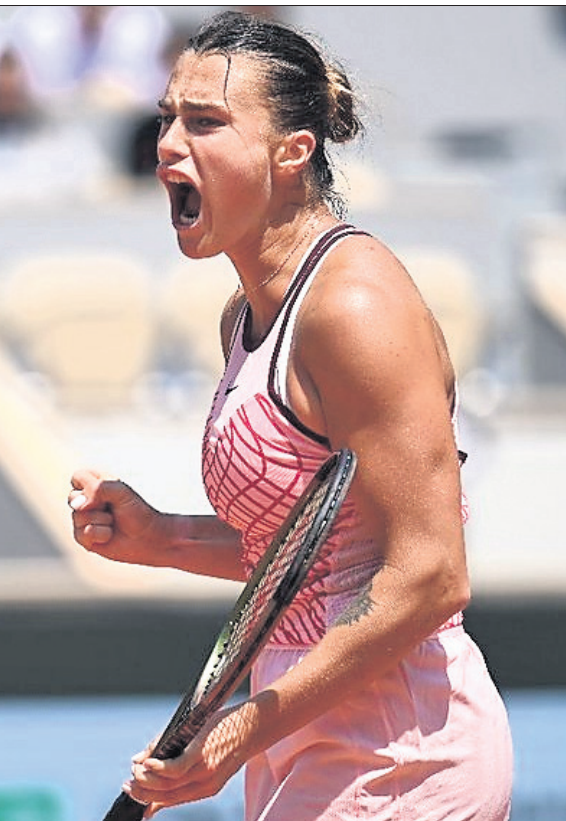
ମ୍ୟାଚ ଚିତ୍ରାପରେ ଆରିନା ସାବାଲେଙ୍କାଙ୍କ ପ୍ରତିକ୍ରିୟା।

ଦ୍ୱିତୀୟ ମ୍ୟାଚରେ ଚେକ୍ ରିପବ୍ଲିକର କାରୋଲିନା ମୁଚୋଭା ୭-୫ ଓ ୬-୨ ସେଟ୍ରେ ଆନାସ୍ତାସିଆ ପାକୁଟେକୋଭାଙ୍କୁ ପରାସ୍ତ କରିଥିଲେ। ଏଲିନା ସ୍ୱିଡୋଲିନାଙ୍କ ବିପକ୍ଷରେ ସମ୍ପୂର୍ଣ୍ଣ ପ୍ରାଧାନ୍ୟ ବିସ୍ତାର କରି ଖେଳିଥିଲେ ସାବାଲେଙ୍କା। ସେକେଣ୍ଡ ସର୍ଭରେ ୮୨ ପ୍ରତିଶତ ପଏଣ୍ଟ ହାସଲ କରିବା ସହିତ ସାବାଲେଙ୍କା ୬-୪, ୬-୪ରେ ସହଜ ବିଜୟ ହାସଲ କରିଥିଲେ। ଦ୍ୱିତୀୟ କ୍ୱାର୍ଟରରେ କାରୋଲିନା ମୁଚୋଭା ମଧ୍ୟ ସାବାଲେଙ୍କା ସେଟରେ