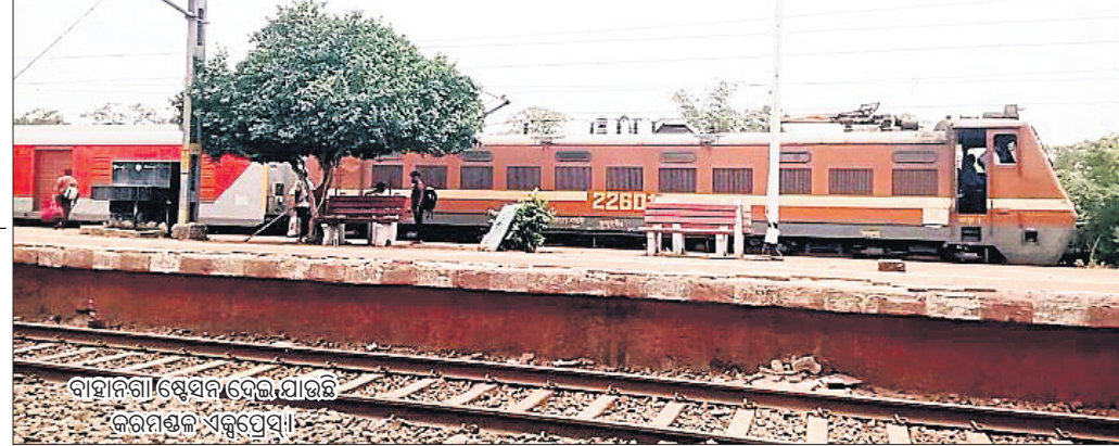
ବାହାନଗା ଟ୍ରେନ୍ ଦୁର୍ଘଟଣାରେ ଘଟିଥିବା ଟ୍ରେନ୍ ଦୁର୍ଘଟଣାରେ ମୃତକଙ୍କ ସଂଖ୍ୟା ୨୮୮କୁ ବୃଦ୍ଧିପାଇଛି।

ବାଲେଶ୍ୱର ଅଫିସ/ ବାହାନଗା, ୨୬ (ବି.ଏନ.ଏ.) ବାଲେଶ୍ୱର ଜିଲ୍ଲାର ବାହାନଗା ସ୍ୱେଚ୍ଛା ନିକଟରେ ହୋଇଥିବା ରେଳ ଦୁର୍ଘଟଣାକୁ ମଙ୍ଗଳବାର ପୁଲିସ୍ ୪ ଦିନ ରେଳମନ୍ତ୍ରୀ ଅଶ୍ୱିନୀ ଦେବିଙ୍କ ଚକ୍ରାବଧାନରେ ଦୁର୍ଘଟଣାର ୫୧ଦିନ ମଧ୍ୟରେ ରେଳ ଲାଇନ ଠିକ୍ କରାଯାଇଥିଲା। ୪ ଦିନ ପରେ ଯାତ୍ରାକୁ ନେଇ ପୁଣି କରମଣ୍ଡଳ