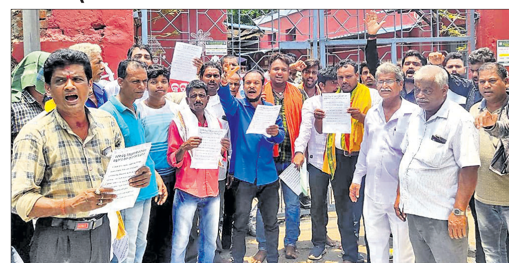
ଜିଲ୍ଲା ଶିକ୍ଷାଧିକାରୀଙ୍କ କାର୍ଯ୍ୟାଳୟ ସମ୍ମୁଖରେ ଗ୍ରାମବାସୀ ଧାରଣା ଦେଇଛନ୍ତି।