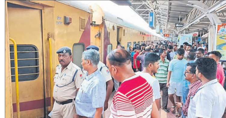
ବ୍ରହ୍ମପୁର ଅଫିସ/ଭୁବନେଶ୍ୱର (ବ୍ୟୁରୋ) ୬।୬ ଗଞ୍ଜାମ ଜିଲ୍ଲା ବ୍ରହ୍ମପୁର ରେଳ ଷ୍ଟେଶନରେ ମଙ୍ଗଳବାର ସିକନ୍ଦରାବାଦ-ଅଗରତାଲା ଏକ୍ସପ୍ରେସ ବି-୫ ଏସି ବଗିଚୁ ଧୂଆଁ ବାହାରିବା ପରେ ଯାତ୍ରୀମାନେ ଭୟଭୀତ ହୋଇ ଓହ୍ଲାଇ ପଡ଼ିଥିଲେ। ଭୁବନେଶ୍ୱର ଷ୍ଟେଶନରେ କର୍ମଚାରୀମାନେ ପହଞ୍ଚି ଧୂଆଁକୁ ଆୟତ୍ତ କରିଥିଲେ ମଧ୍ୟ ଯାତ୍ରୀମାନେ ସେହି ଟ୍ରେନ୍‌ରେ ଯିବାକୁ ରାଜି ହୋଇ ନ ଥିଲେ। ରେଳଠାରୁ କର୍ତ୍ତୃପକ୍ଷ ପହଞ୍ଚି ବୁଝାଶୁଝା କରିବାରୁ ବ୍ରହ୍ମପୁର ଷ୍ଟେଶନରେ ସିକନ୍ଦରାବାଦ-ଅଗରତାଲା ଏକ୍ସପ୍ରେସକୁ ଓହ୍ଲାଇ ପଡ଼ିଥିବା ଯାତ୍ରୀମାନେ। ପ୍ରାୟ ୧ ଘଣ୍ଟା ପରେ ଟ୍ରେନ୍‌ଟି ଯାତ୍ରୀଙ୍କୁ ଧରି ବ୍ରହ୍ମପୁର ଷ୍ଟେଶନ ଛାଡ଼ିଥିଲା। ଶର୍ତ୍ତ ସର୍ବନିମ୍ନ ଧୂଆଁ ବାହାରିଥିଲା ଏବଂ ଚାହାକୁ ଠିକ୍ କରି ଦିଆଯାଇଛି ବୋଲି ରେଳ ବିଭାଗ ପକ୍ଷରୁ ସ୍ପଷ୍ଟ କରାଯାଇଛି। କ୍ଷେତ୍ରପୁଷ୍ପା-୪