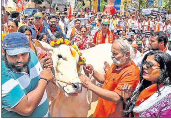
କର୍ମଚକ ସରକାର ଗୋହତ୍ୟା ନିରୋଧୀ ନିୟମକୁ ଛାଡ଼ିବାକୁ ନେଇ ରିପୋର୍ଟ ପ୍ରକାଶ ପାଇବା ପରେ ଭାଜପା ସମର୍ଥକମାନେ ଏହାକୁ ବିରୋଧ କରି ବେଙ୍ଗାଳୁରୁରେ ଗୋ ପୂଜା କରୁଛନ୍ତି ।

ତଥା ମୁଖ୍ୟମନ୍ତ୍ରୀ ଅଶୋକ ରେହଲଟ୍ଙ୍କର ଭାଜପା ସହ ବୁଝାମଣା ଥିବାରୁ ସେ ବସୁନ୍ଧରାଙ୍କ ବିରୋଧରେ କାର୍ଯ୍ୟାନୁଷ୍ଠାନ ଗ୍ରହଣ କରୁ ନ ଥିବା ପାଇଲଟ୍ ଅଭିଯୋଗ କରିଛନ୍ତି, ଯାହାକୁ ଭାଜପା ଖଣ୍ଡନ କରିଛି । ତେବେ ନିଷ୍ପତ୍ତି ଦଳର କେନ୍ଦ୍ରୀୟ ନେତୃତ୍ୱ ନେବାକୁ ଥିବାରୁ ପାଇଲଟ୍ ସେଥିପାଇଁ ବିଚଳିତ ଅପେକ୍ଷା କରିବେ ବୋଲି ତାଙ୍କ ନିଜ ମହଲରୁ କୁହାଯାଇଛି । ଗତ ମାସରେ ଉଭୟ ନେତା ଦଳର ଅଧ୍ୟକ୍ଷ ମଲିକାର୍ଜୁନ ଖାର୍ଗେ ଓ ରାହୁଲ ଗାନ୍ଧୀଙ୍କ ସହ ଦୀର୍ଘ ୪ ଘଣ୍ଟା ଆଲୋଚନା କରିଥିଲେ । ମଧ୍ୟ ସମାଧାନର ସ୍ୱତ୍ୱ ବାହାରିପାରି ନ ଥିଲା । ଦଳ ଏକାଠି ନିର୍ବାଚନ ଲଢ଼ିବ ବୋଲି ହାଇକମାଣ୍ଡ କହିଥିଲେ ମଧ୍ୟ ବୁଲ୍ ନେତାଙ୍କ ମଧ୍ୟରେ ତିକ୍ତତା ଦୂର ହୋଇନାହିଁ ।