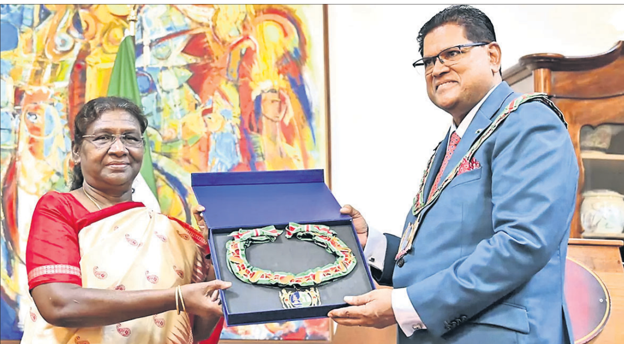
ରାଷ୍ଟ୍ରପତି ଡ୍ରୌପଦୀ ମୁର୍ମୁଙ୍କୁ ସୁରିନାମର ସର୍ବୋଚ୍ଚ ବେସାମରିକ ସମ୍ମାନ ମିଳିଛି। ବିପାକ୍ଷିକ ସହଯୋଗ ବୃଦ୍ଧିରେ ମୁର୍ମୁଙ୍କ ଅବଦାନକୁ ନେଇ ସୁରିନାମ ରାଷ୍ଟ୍ରପତି ଚନ୍ଦ୍ରିକାପ୍ରସାଦ ସତ୍ତୋଧୀ ତାଙ୍କୁ ଏକ ଭବ୍ୟ ସମାରୋହରେ 'ଗ୍ରାଣ୍ଡ ଅର୍ଡର ଅଫ୍ ଦି ବେନୁ ଅଫ୍ ଯଲୋ ଷ୍ଟାର' ପ୍ରଦାନ କରିଛନ୍ତି। ମୁର୍ମୁ ରବିବାର ଚିନିଦିଆ ସୁରିନାମ ଗସ୍ତରେ ଯାଇଥିଲେ। ଗତବର୍ଷ ଜୁଲାଇରେ ରାଷ୍ଟ୍ରପତି ହେବା ପରେ ଏହା ସୁରିନାମକୁ ଚାକ୍ଚା ପ୍ରଥମ ଗସ୍ତ। ଏହି ଅବସରରେ ସେ ପ୍ରତିପକ୍ଷ ସତ୍ତୋଧୀ ଏବଂ ସୁରିନାମ ସରକାରଙ୍କୁ ଧନ୍ୟବାଦ ଦେଇଛନ୍ତି।

ଚେକ୍ ରିପର୍ଟିଂ କାରୋଲିନା ମୁରୋତା ଫ୍ରେଣ୍ଡ୍‌ସ୍ ଓପନ ଗ୍ରାଣ୍ଡସ୍ଲାମ ଚେମ୍ପିୟନ ମହିଳା ସିଙ୍ଗଲ୍ସ ସେମିଫାଇନାଲରେ ପ୍ରବେଶ କରିଛନ୍ତି।