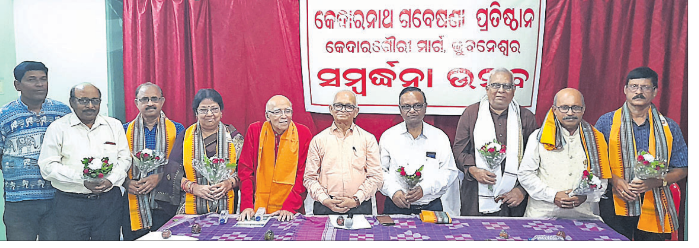
ପୁରୁଣା ଭୁବନେଶ୍ୱରର କେଦାରନାଥ ଗବେଷଣା ପ୍ରତିଷ୍ଠାନରେ ମଙ୍ଗଳବାର ଆୟୋଜିତ ସମ୍ବର୍ଦ୍ଧନା ଉତ୍ସବରେ ସମ୍ବର୍ଦ୍ଧିତ ବ୍ୟକ୍ତିଗଣ ସହ ଅତିଥିମାନେ।