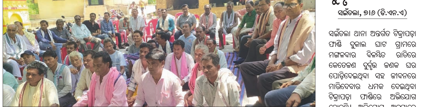
ବୈଠକରେ ବିଭିନ୍ନ ସମାଜର କର୍ମକର୍ତ୍ତା, ଦେବାଦତ୍ତ କମିଟି ସଦସ୍ୟ ଉପସ୍ଥିତ ।

ବୈଠକରେ ଅଧିକାରୀ ଉପସ୍ଥିତ ରହିଛନ୍ତି । ଖପ୍ରାଖୋଳ, ୭।୬ (ତି.ଏନ.ଏ.) ବଲାଙ୍ଗୀର ଜିଲ୍ଲା ଖପ୍ରାଖୋଳ ବ୍ଲକ ହରିଶଙ୍କର ମନ୍ଦିର ପାରିପାର୍ଶ୍ୱିକ ଉନ୍ନୟନ ପାଇଁ ଏକ ବୈଠକ ବସାଯାଇଛି । ବିଭିନ୍ନ ସମାଜର କର୍ମକର୍ତ୍ତା, ଦେବାଦତ୍ତ କମିଟି ସଦସ୍ୟ ଉପସ୍ଥିତ ରହିଛନ୍ତି । ଠିକିଆଗଡ଼, ୭।୬ (ତି.ଏନ.ଏ.) ଠିକିଆଗଡ଼ରେ ଉନ୍ନୟନ ପାଇଁ ଏକ ବୈଠକ ବସାଯାଇଛି । ବିଭିନ୍ନ ସମାଜର କର୍ମକର୍ତ୍ତା, ଦେବାଦତ୍ତ କମିଟି ସଦସ୍ୟ ଉପସ୍ଥିତ ରହିଛନ୍ତି ।