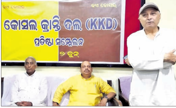
କେକେଡ଼ି ପ୍ରତିଷ୍ଠା ସମ୍ମିଳନୀରେ ମହାସଭା ଅତିଥି ଓ କାର୍ଯ୍ୟକର୍ତ୍ତା ।

କୋସଲ କ୍ରାନ୍ତି ଦଳର ୧୭ତମ ପ୍ରତିଷ୍ଠା ସମ୍ମିଳନୀ କୋସଲ କ୍ରାନ୍ତି ଦଳର ୧୭ତମ ପ୍ରତିଷ୍ଠା ସମ୍ମିଳନୀ କୋସଲ କ୍ରାନ୍ତି ଦଳର ୧୭ତମ ପ୍ରତିଷ୍ଠା ସମ୍ମିଳନୀ