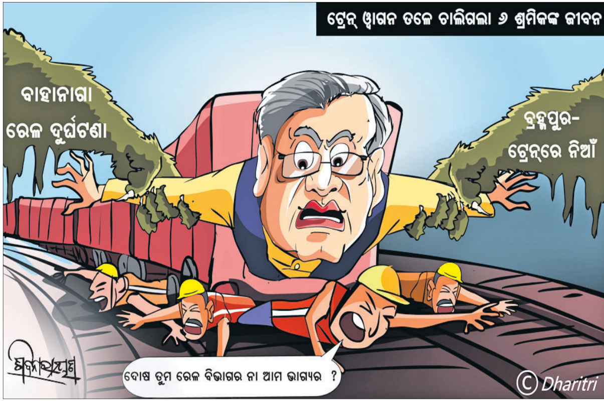
ଟ୍ରେନ୍ ଖାଲି ତଳେ ଚାଲିଗଲା ୬ ଶ୍ରମିକଙ୍କ ଜୀବନ

ଓଡ଼ିଆ ଜଗତମାଳି ଓ ଲୋକଗୀତ - ପ୍ରେକ୍ଷ୍ୟ ପଦ୍ମଶର୍ମା