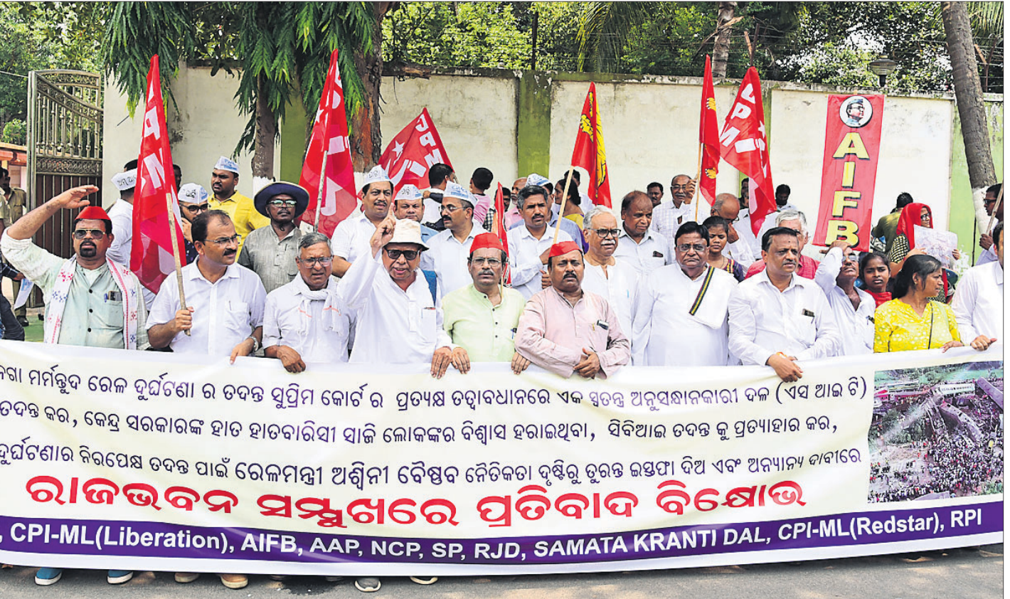
ବାଲେଶ୍ୱର ବାହାନଗା ରେଳ ଦୁର୍ଘଟଣାର ସିବିଆଇ ତଦନ୍ତକୁ ପ୍ରତ୍ୟାହାର କରି ପ୍ରମୁଖମନ୍ତ୍ରୀଙ୍କ ପ୍ରତ୍ୟକ୍ଷ ତତ୍ତ୍ୱାବଧାନରେ ଏସ୍ଆଇଟି ଦ୍ୱାରା ତଦନ୍ତ, ରେଳମନ୍ତ୍ରୀଙ୍କ ଇସ୍ତଫା ଆଦି ଦାବି କରି ନେଇ ବିଭିନ୍ନ ଦଳର ପକ୍ଷରୁ ଭୁବନେଶ୍ୱରସ୍ଥିତ ରାଜଭଙ୍ଗ ସମ୍ମୁଖରେ ବିରୋଧ ।