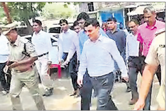
ରେକ ଦୁର୍ଘଟଣା ସ୍ଥଳରେ ସିବିଆଇ ଓ ଫୋରେନସିକ୍ ଟିମ୍‌ର ତଦନ୍ତ।