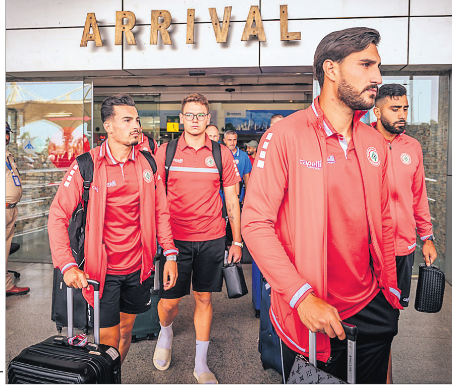
ଭୁବନେଶ୍ୱରରେ ପହଞ୍ଚିବାପରେ ଲେବାନନ୍ ଦଳର ଖେଳାଳି।