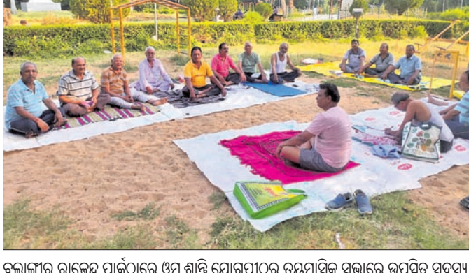
କୋସଲ କ୍ରାନ୍ତି ଦଳ ଓମ୍ ଶାନ୍ତି ଯୋଗପୀଠର ଉନ୍ନୟନ ପାଇଁ ସଭା ସମ୍ପାଦନା ।

କୋସଲ କ୍ରାନ୍ତି ଦଳ (KKD) ପ୍ରତିଷ୍ଠା ସମ୍ମିଳନୀ କୋସଲ କ୍ରାନ୍ତି ଦଳ (KKD) ପ୍ରତିଷ୍ଠା ସମ୍ମିଳନୀ