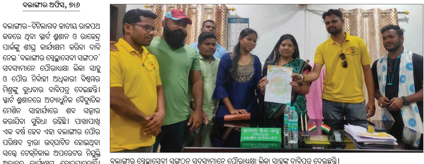
ବଲାଙ୍ଗୀର ସେକ୍ସାସେବା ସଙ୍ଗଠନ ସଦସ୍ୟମାନେ ପୌରାଧିକାରୀଙ୍କୁ ଦାବିପତ୍ର ଦେଖାଉଛନ୍ତି ।