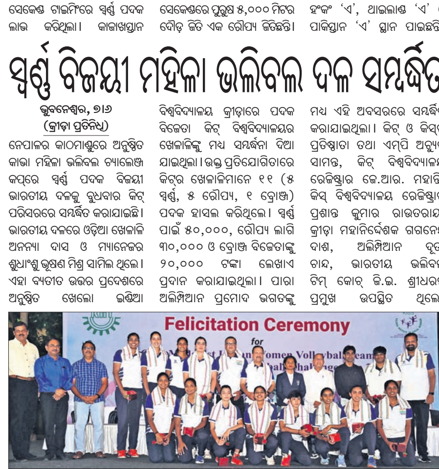
ସମ୍ବର୍ଦ୍ଧିତ ହେବା ଅବସରରେ ଅତିଥିକ ଗହଣରେ ସ୍ୱର୍ଣ୍ଣ ପଦକ ବିଜୟୀ ଭାରତୀୟ ମହିଳା ଭଲିବଲ ଦଳ।