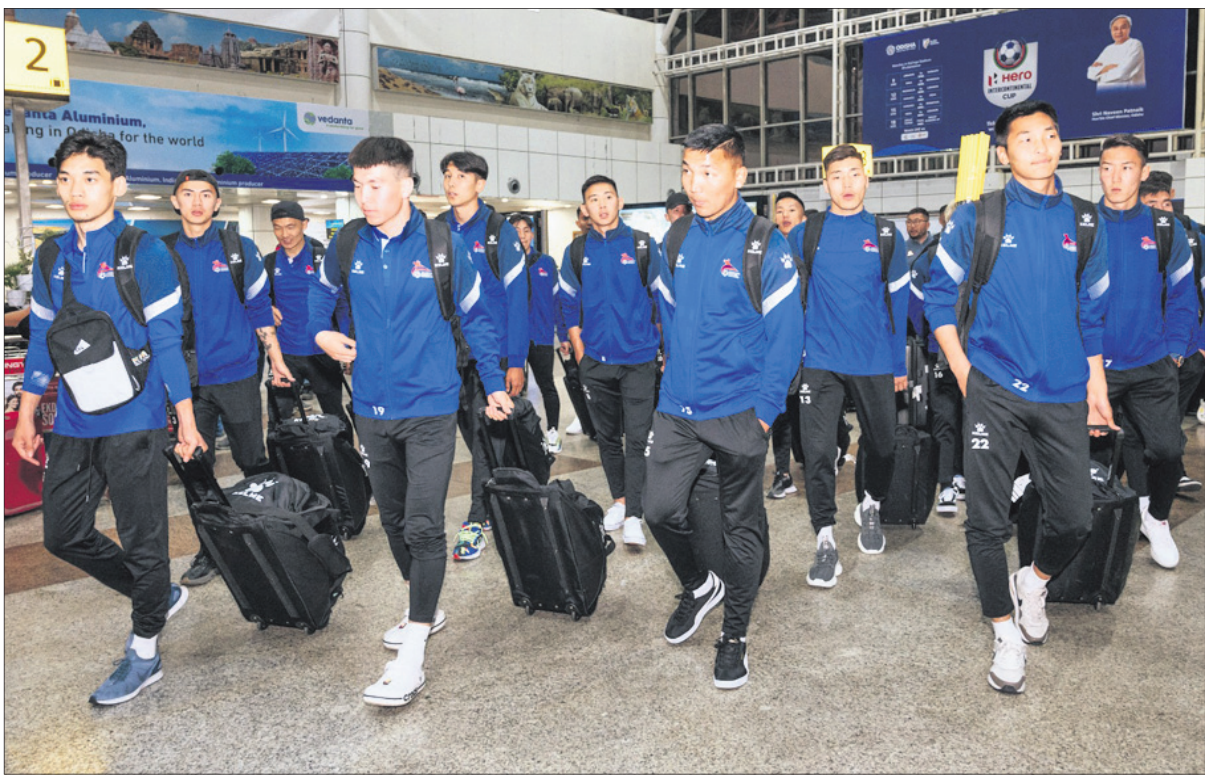
ଭୁବନେଶ୍ୱର ବିମାନବନ୍ଦରରେ ମଙ୍ଗୋଲିଆ ଦଳ।

ଇଣ୍ଡିଆନ୍ କ୍ରିକେଟ୍ ଟିମ୍ ପ୍ରଥମ ସଂସ୍କରଣ ୨୦୧୮ରେ ପ୍ରଥମ ସଂସ୍କରଣ ହୋଇଥିଲା। ଏଥିରେ ଭାରତ ଚାମ୍ପିୟନ ହୋଇଥିଲା। ସେତେବେଳେ ଷ୍ଟେଡିୟମ୍ କନସ୍ଟ୍ରକ୍ସନ୍ ଭାରତୀୟ ଦଳର ପୁଷ୍ପ କୋର୍