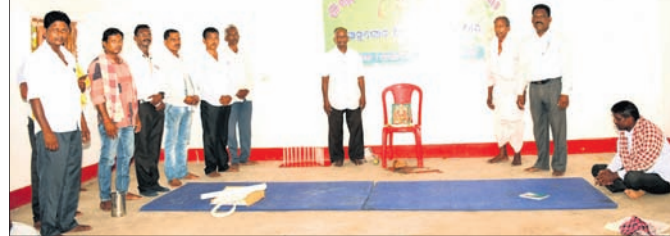
ବୈଠକରେ ଉପସ୍ଥିତ ଶଙ୍ଖାରା ସମାଜର ସଦସ୍ୟମାନେ।

ବନ୍ଧୁ,୭।୬(ଡି.ଏନ.ଏ.) କିଶୋରନଗର ବ୍ଲକ୍ ଗୁରୁକାନ୍ତର କଲ୍ୟାଣ ମଣ୍ଡଳ ପରିସରରେ ମଙ୍ଗଳବାର ଶଙ୍ଖାରା ସମାଜର ଜିଲ୍ଲାସ୍ତରୀୟ ସମାଜ ବୈଠକ ଅନୁଷ୍ଠିତ ହୋଇଯାଇଛି।