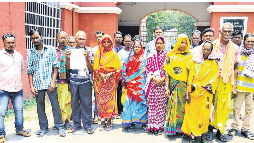
ଜିଲ୍ଲାପାଳଙ୍କୁ ଦାବିପତ୍ର ପ୍ରଦାନ କରିବାକୁ ଆସିଥିବା ଗ୍ରାମବାସୀ।

ବିକ୍ଷୋଭ ପ୍ରଦର୍ଶନ କରିଥିଲେ। ବିଭିନ୍ନ କାର୍ଯ୍ୟାଳୟରେ ମଧ୍ୟ ଆନ୍ଦୋଳନର ପ୍ରଭାବ ପରିଲକ୍ଷିତ ହୋଇଥିଲା। ତାଳଚେର ସ୍ୱେଚ୍ଛା, ତେରା, ହାଣ୍ଡିଆ, ଶର୍ମାଛକ, ହାଟତୋଟା, ତାଳଚେର ଚାଉଳ ଆଦିରେ ଦୋକାନ ବଜାର ବନ୍ଦ ରଖି ବ୍ୟବସାୟୀମାନେ ଏହି ଆନ୍ଦୋଳନକୁ ସମର୍ଥନ ଜଣାଇଥିଲେ।