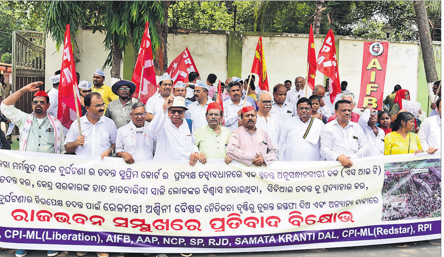
ବାଲେଶ୍ୱର ବାହାନଗା ଟ୍ରେନ୍ ଦୁର୍ଘଟଣାର ବିଭିନ୍ନ ତଦନ୍ତକୁ ପ୍ରତ୍ୟାହାର କରି ସୁପ୍ରିମକୋର୍ଟଙ୍କ ପ୍ରତ୍ୟକ୍ଷ ତତ୍ତ୍ୱାବଧାନରେ ଏସ୍ଆଇଟି ଦ୍ୱାରା ତଦନ୍ତ, ରେଳମନ୍ତ୍ରୀଙ୍କ ଇସ୍ତଫା ଆଦି ଦାବି କରି ନେଇ ବିଭିନ୍ନ ଦଳର ପକ୍ଷରୁ ଭୁବନେଶ୍ୱରସ୍ଥିତ ରାଜଭଙ୍ଗ ସମ୍ମୁଖରେ ବିରୋଧ ।