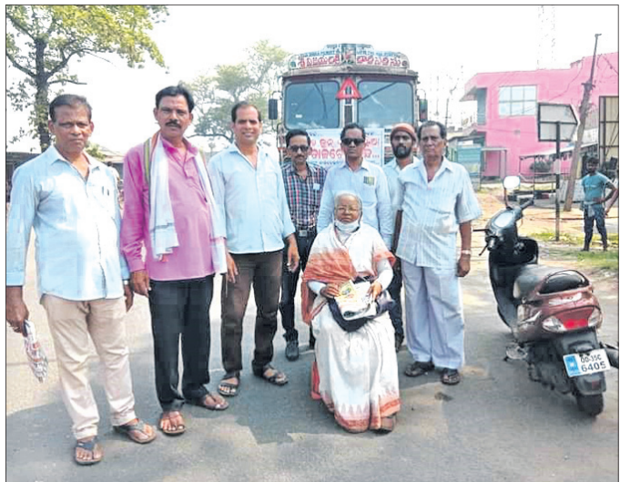
ବନ୍ଦ ପାଳନକାରୀଙ୍କ ଦ୍ୱାରା ରାସ୍ତା ଅବରୋଧ କରାଯାଇଛି।