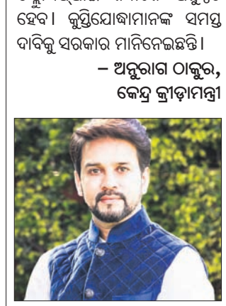
ଅନୁରାଗ ଠାକୁର, କେନ୍ଦ୍ର କ୍ରୀଡ଼ାମନ୍ତ୍ରୀ