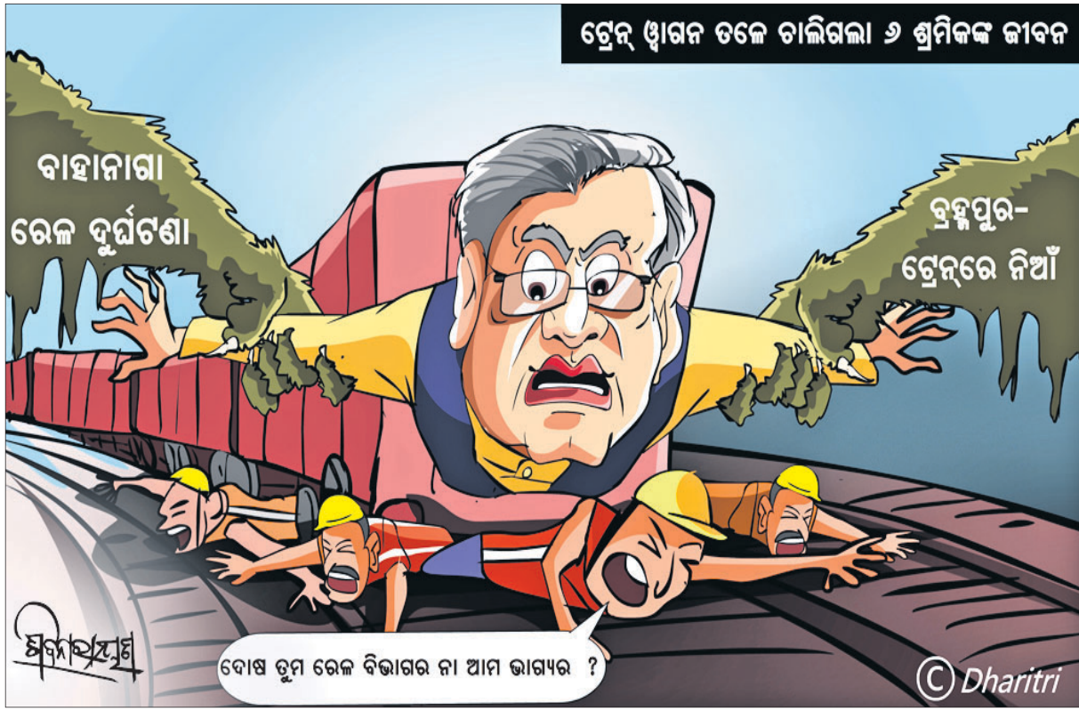
ଟ୍ରେନ୍ ଖାଲି ତଳେ ଚାଲିଗଲା ଓ ଶ୍ରମିକଙ୍କ ଜୀବନ

ଓଡ଼ିଆ ଜଗତମାଳି ଓ ଲୋକଗୀତ - ପ୍ରେକ୍ଷ୍ୟ ପଦ୍ମଶର୍ମା