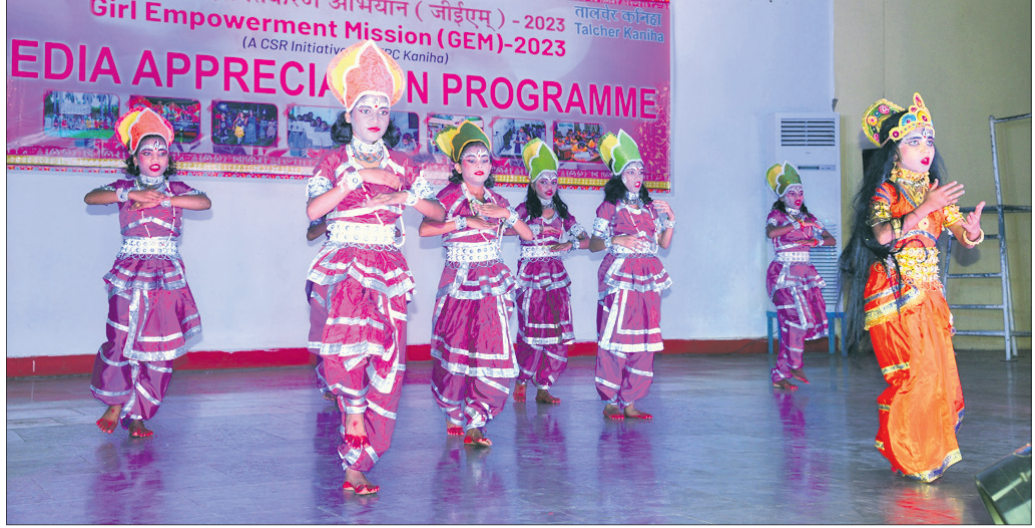
ଛାତ୍ରୀମାନଙ୍କ ପକ୍ଷରୁ ସାଂସ୍କୃତିକ କାର୍ଯ୍ୟକ୍ରମ ପରିବେଷଣ କରାଯାଇଛି।

ଆନ୍ତେଦକର ପାରଭେଶନ ପକ୍ଷରୁ ଆନ୍ଦୋଳନ କରାଯାଇଛି। ଘାନରେ ମଠ, ମନ୍ଦିର, ଧର୍ମାନ୍ୱୟାନ ସମକାଳୀନ ଭାବରେ ରହିଥିଲେ ମଧ୍ୟ ତାହା ଉଲ୍ଲେଦ କରାଯାଉନାହିଁ।