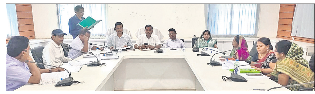
ବିଠକରେ ଜନପ୍ରତିନିଧି ଏବଂ ପ୍ରଶାସନିକ ଅଧିକାରୀମାନେ।