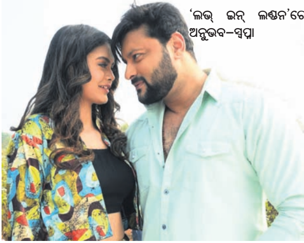
'ଲଡ଼ ଲଡ଼ ଲଢ଼େଇ'ରେ ଅନୁଭବ-ସ୍ୱପ୍ନା