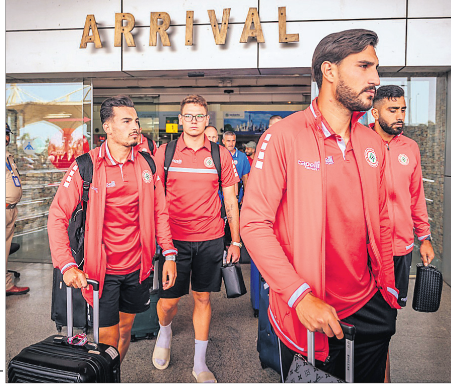
ଭୁବନେଶ୍ୱରରେ ପହଞ୍ଚିବାପରେ ଲେବାନନ୍ ଦଳର ଖେଳାଳି।

ସଂକ୍ଷିପ୍ତ ଫୋର ଆଫଗାନିଷ୍ଟାନ: ୨୨.୨ ଓଭରରେ ୧୧୬/ଅଳ୍ପଆଉଟ (ମହମ୍ମଦ ନବି-୨୩, ଇସ୍ରାହିଲ ଛାତ୍ରୀ-୨୨; ଚାମ୍ପିୟନ-୪/୨୩, ହସରଜା-୩/୭, ଲାହିରୁ କୁମାରୀ-୨/୨୯)। ଶ୍ରୀଲଙ୍କା: ୧୬ ଓଭରରେ ୧୨୦/୧( କରୁଣାରତ୍ନେ-୫୬, ନାସାକା-୫୧; ଗୁଲ୍‌ବାଦିନ ନାଭ-୧/୧୯)।