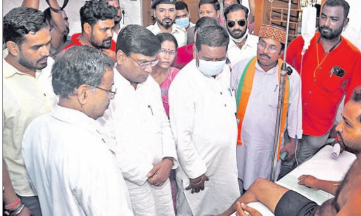
କେନ୍ଦ୍ରମନ୍ତ୍ରୀ ବିଶ୍ୱେଶ୍ୱର ଗୁଡୁ ଏସ୍‌ସିଏସି ମେଡିକାଲରେ ଆହତଙ୍କୁ ସାଲ୍ଲାବନ୍ଧା ପରୀକ୍ଷା କରୁଛନ୍ତି।