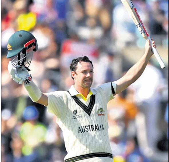
ଶତକ ହାସଲ ପରେ ଗ୍ରୀଷ୍ମ ହେଡ଼।

ଲଣ୍ଡନ, ୭।୭ ଭାରତ ଓ ଅଷ୍ଟ୍ରେଲିଆ ମଧ୍ୟରେ ବିଶ୍ୱ ଚେଷ୍ଟା ଚାମ୍ପିୟନଶିପ୍ (ଡବ୍ଲ୍ୟୁସିସି)ର ଫାଇନାଲ ରୁଧିରା ୧୦ ଓଭାଲ ଗ୍ରାଉଣ୍ଡରେ ଆରମ୍ଭ ହୋଇଛି। ଗ୍ରୀଷ୍ମ ହେଉଁଙ୍କ ଶତକ ଏବଂ ସ୍କେଜେଟ୍ ସ୍ମିଥଙ୍କ ଦୃଢ଼ ବ୍ୟାଟିଂ ବଳରେ ଅଷ୍ଟ୍ରେଲିଆ ବଡ଼ ଷ୍ଟୋର ଦିଗରେ ଅଗ୍ରସର ହୋଇଛି। ପ୍ରଥମ ଦିବସ ଷ୍ଟ୍ରେସ୍ ବେକକ୍ ଅଷ୍ଟ୍ରେଲିଆ ୩ ଉଇକେଟ ହରାଇ ୩୨୭ ରନ ସଂଗ୍ରହ କରିଛି। ହେଡ଼ ୧୪୬ ଓ ସ୍କେଜେଟ୍ ୯୫ ରନରେ ଅପରାଜିତ ରହିଛନ୍ତି।