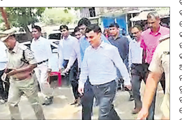
ରେଳ ଦୁର୍ଘଟଣା ସ୍ଥଳରେ ସିବିଆଇ ଓ ପୋରେନସିବି ଟିମ୍‌ର ତଦନ୍ତ।