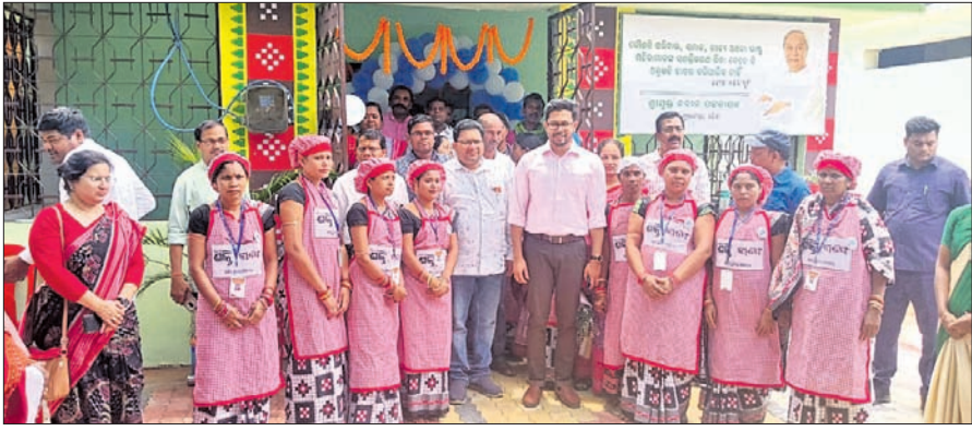
କାଫେ ଉଦଘାଟନ ଅବସରରେ ବିଧାୟକ, ଜିଲାପାଳ ଓ ଅନ୍ୟମାନେ।