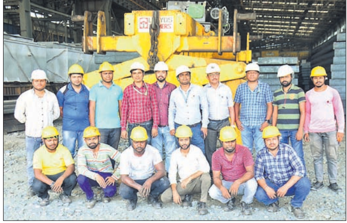
ଉଚ୍ଚ ମନ୍ତ୍ରୀପକରଣ ସହ ଆରବ୍‌ସି କର୍ମଚାରୀମାନେ।

ପରେ ବନବିଭାଗ କର୍ମଚାରୀ ପହଞ୍ଚି ବୃକ୍ଷମାନଙ୍କୁ ସୁରକ୍ଷା ଦେବା ପାଇଁ ଚେଷ୍ଟା କରିଥିଲେ।