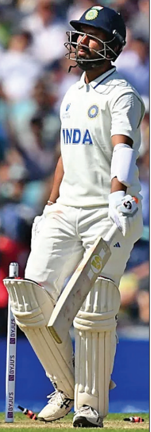
ଆଉଟ୍ ହେବା ପରେ ବିରାଟ କୋହଲି ଓ ଚେତେଶ୍ୱର ପୂଜାରା।

ବୋଲି ପ୍ରଭାବହୀନ ରହିଥିବା ବେଳେ ଦ୍ୱିତୀୟ ଦିନ ଆରମ୍ଭରୁ ଭାରତୀୟ ଖେଳାଳି ଚମତ୍କାର ବୋଲି କରିଥିଲେ। ବିଶେଷ କରି ଦୁଇ ଟୁଟ ବୋଲର ମହମ୍ମଦ ସିରାଜ ଓ ମହମ୍ମଦ ଶାମି ସମଗ୍ର ପ୍ରଭାବିତ କରିଥିଲେ। ମହମ୍ମଦ ସିରାଜ ୧୦୮ ରନ୍‌ରେ ୪ ଉଇକେଟ ନେଇଥିବା ବେଳେ ଶାମି ଓ ଶାର୍ଦୂଳ ଦୁଇଟି ଲେଖାଏ ଉଇକେଟ ନେଇଥିଲେ। ଗ୍ରାଭିସ୍