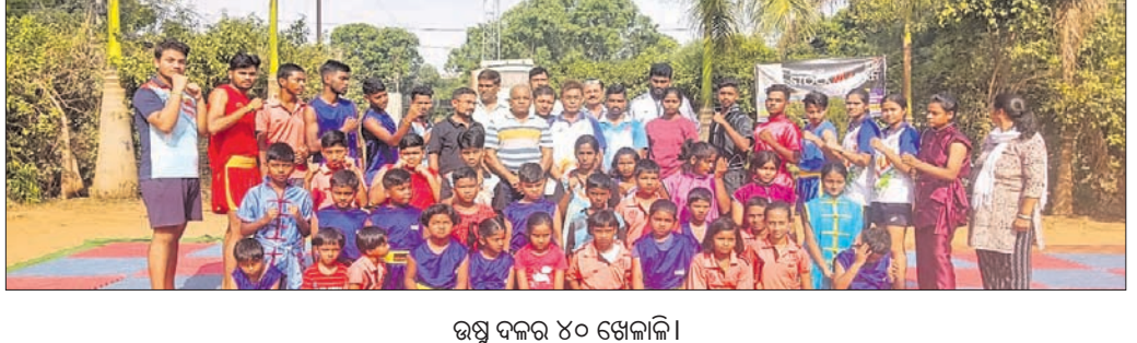
ଉଷ୍ଣ ଦଳର ୪୦ ଖେଳାଳି।