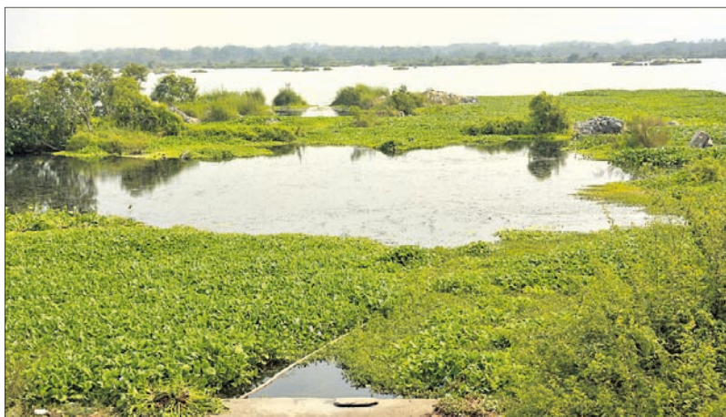
ସମ୍ବଲପୁର ମହାନଦୀ ଘାଟ ଆବର୍ଜନା ପରିପୂର୍ଣ୍ଣ।

ସମ୍ବଲପୁର, ୮୬(ବୁଧରୋ) ମହାନଦୀକୁ ଓଡ଼ିଶାର ଜୀବନରେଖା ବୋଲି କୁହାଯାଇଥାଏ। ଏପରିକି ନଦୀ ପ୍ରବାହିତ ହେଉଥିବା ଆରମ୍ଭରୁ ଶେଷ ପର୍ଯ୍ୟନ୍ତ ବିଭିନ୍ନ ସମସ୍ୟା ଲାଗିରହିଛି। କେଉଁଠାରେ ବ୍ୟାରେଜ ନିର୍ମାଣ ତ କେଉଁଠି କଳକାରଖାନାକୁ ପାଣି ଦେବା, ନର୍ଦ୍ଦମା ପାଣି ମହାନଦୀରେ ଛାଡ଼ିବା, ତଟବେଶରେ ରହିଥିବା କଳକାରଖାନାରୁ ନିର୍ଗତ ପାଉଁଶ ସିଧାସଳଖ ପାଣିରେ ମିଶିବା ଭଳି ଘଟଣାବଳୀ ଦେଖିବାକୁ ମିଳୁଛି। ଏହାକୁ ନେଇ ସର୍ବୋଚ୍ଚ ବିଭିନ୍ନ ସଂସ୍ଥା ଓ ପରିବେଶବିତ୍ ଅଭିଯୋଗ କରିଆସୁଛନ୍ତି। ହେଲେ ସରକାରୀ ପ୍ରସ୍ତାବ ମହାନଦୀ ସୁରକ୍ଷା ନେଇ ପଦକ୍ଷେପ ଗ୍ରହଣ କରାଯାଉ ନ ଥିବାରୁ ଏବେ ପ୍ରଦୂଷିତ ଓ ଅସୁରକ୍ଷିତ ହୋଇପଡ଼ିଛି। ସମ୍ବଲପୁର ସହର ଦେଇ ପ୍ରବାହିତ ହେଉଥିବା ନଦୀକୁ ଦେଖିଲେ ସହଜରେ ଅନୁମେୟ କରି ହେଉଛି। ମହାନଦୀ ସୁରକ୍ଷା ନେଇ ଯୋଜନା କରାଯାଇଛି। ଗ୍ରାମ ମହାନଦୀ ଯୋଜନାରେ କୋଟି ଟଙ୍କା ଖର୍ଚ୍ଚ ମଧ୍ୟ ହୋଇଛି। ହେଲେ ବର୍ଷ ବର୍ଷ ବିତିଯିବା ସତ୍ତ୍ୱେ ମହାନଦୀ ପ୍ରଦୂଷଣ ପୂର୍ଣ୍ଣ ହୋଇନାହିଁ। ମହାନଦୀ ଶଯ୍ୟା ଅନାବନା ଗଛଲତାରେ ପରିପୂର୍ଣ୍ଣ। ଏହା ସତ୍ତ୍ୱେ ନଦୀ କୂଳରେ ବସବାସ କରୁଥିବା ଜନସାଧାରଣ ଏହି ପାଣି ବ୍ୟବହାର କରିବାକୁ ବାଧ୍ୟ ହେଉଛନ୍ତି। ଫଳରେ ସେମାନେ ଚର୍ମ ରୋଗର ଶିକାର ହେଉଛନ୍ତି।