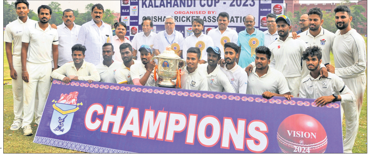
ଅତିଥିକ୍ ରାହଣରେ କଳାହାଣ୍ଡି କପ୍ ଚାମ୍ପିୟନ୍ କଟକ-ଏ ଦଳ ଟ୍ରଫି ସହ।