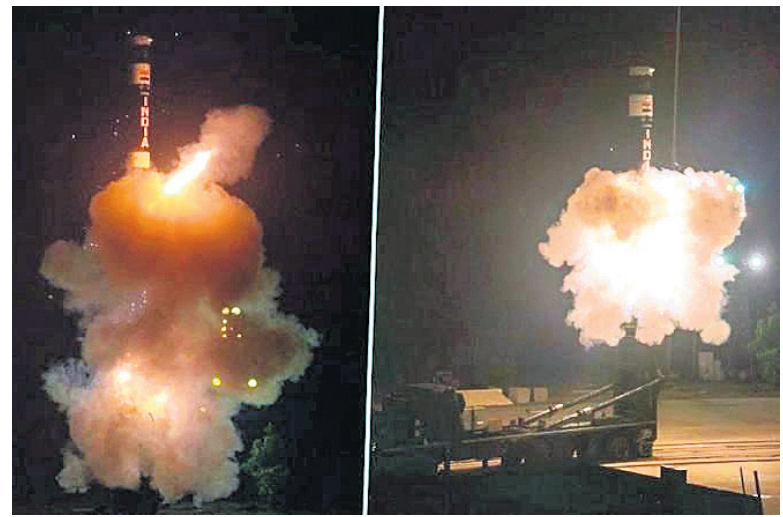
ପରୀକ୍ଷଣ ହୋଇଥିବା 'ଅଗ୍ନି ପ୍ରାଇମ୍' ମିଶାଇଲ।

ଭଦ୍ରକ ଜିଲ୍ଲା ଧାମରା ନିକଟସ୍ଥ ଅବତୁଳା କାଳୀମ ହାପୁଡ଼ା ବ୍ଲକ୍‌ରେ ରାତିରେ ଅତ୍ୟାଧୁନିକ ବାଲିଷ୍ଟିକ ମିଶାଇଲ 'ଅଗ୍ନି ପ୍ରାଇମ୍'ର ପରୀକ୍ଷଣ କରାଯାଇଛି। ଏହି ପରୀକ୍ଷଣ ସଫଳ ହୋଇଥିବା ତଥ୍ୟର ଉପରେ ପ୍ରତିଶ୍ରୁତି ଦିଆଯାଇଛି।