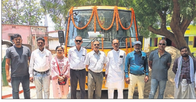
ନୂତନ ବସ୍ ଉଦ୍‌ଘାଟନ ଅବସରରେ ଉପସ୍ଥିତ ଅତିଥି ଓ ପୂଜକ।

ସୁନ୍ଦରଗଡ଼ ଜିଲ୍ଲା ବଡ଼ଗାଁ ବ୍ଲକ୍ ଅଞ୍ଚଳରେ ରାଉରକେଲା ହାଇଡ୍ରୋ ପୋଡିକାଲ କଲେଜ ଓ ହସ୍ପିଟାଲ ପକ୍ଷରୁ ରୋଗୀଙ୍କ ପାଇଁ ନିଃଶୁଳ୍କ ବସ୍ ସେବା ଗୁରୁବାରଠାରୁ ଆରମ୍ଭ ହୋଇଛି।