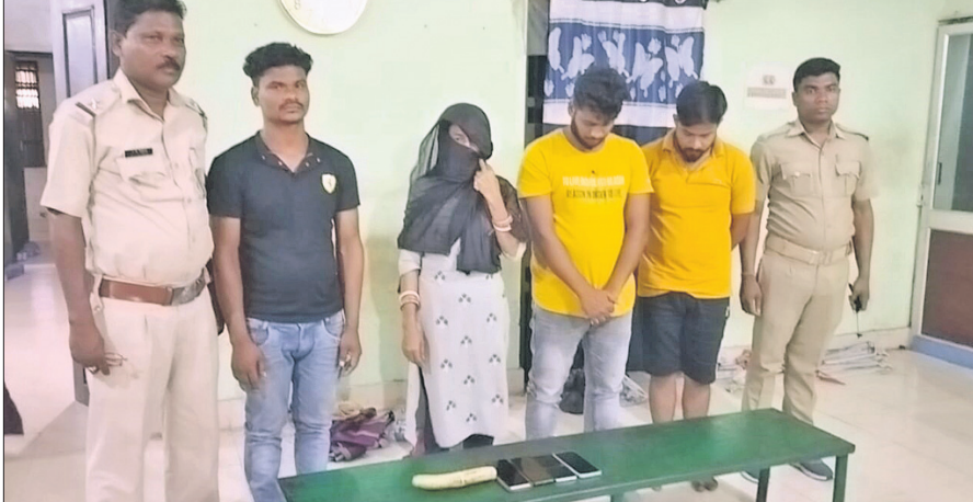
ଛବତ ହାତୀବାଡ଼ ସହ ଗିରଫ ୪ ଅଭିଯୁକ୍ତ ।