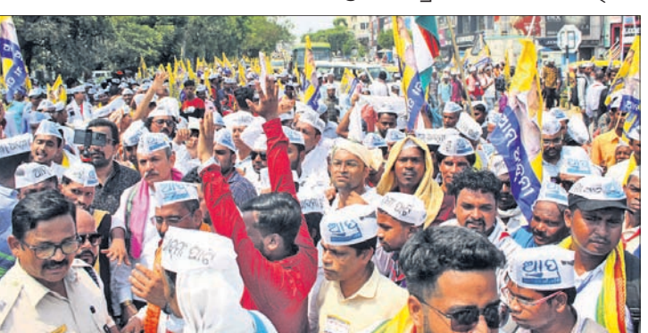
ଆମ୍ଭ ଆନ୍ଦୋଳନ ଆରମ୍ଭ କରିବା ପାଇଁ ଆଜି ଶୋଭାଯାତ୍ରା କରାଯାଇଥିଲା।