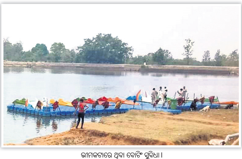
ଭୀମକଣ୍ଠାରେ ଥିବା ବୋଟିଂ ସୁବିଧା।