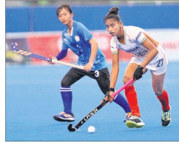
ଭାରତ ଓ ଚାଇନିଜ ଟାଇପେ ମଧ୍ୟରେ ଅନୁଷ୍ଠିତ ମ୍ୟାଚ୍।

ଭାରତୀୟ କୁନିୟର ମହିଳା ହକି ଦଳ ଏସିଆ କପ୍ ସେମିଫାଇନାଲରେ ପ୍ରବେଶ କରିଛି। ଦଳ ଗୁରୁବାର ଏହାର ଅତିମ ପୂର୍ବ ମ୍ୟାଚରେ ଚାଇନିଜ ଟାଇପେକୁ ୧୧-୦ ଗୋଲରେ ପରାସ୍ତ କରିଛି। ଏହି ବିଜୟ ଦ୍ୱାରା ଦଳ ପୂର୍ବ 'ଏ'ରେ