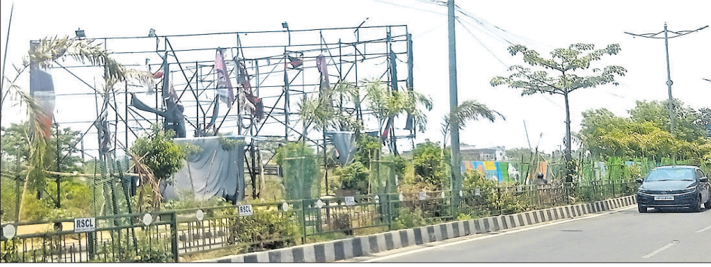
ପାନପୋଷ ମୁଖ୍ୟ ଛକରେ ଲାଗିଥିବା ହୋର୍ଡିଂ ଫାଟି ହୋଇଯାଇଛି।