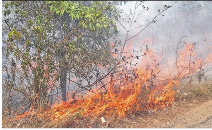
କାଚୁ ବଗିଚାରେ ନିଆଁ ଲାଗିଥିବାର ଦୃଶ୍ୟ।

ସୁନ୍ଦରଗଡ଼ ଜିଲ୍ଲା କୁଡୁ ପତ୍ରାପତ୍ରା ନିକଟ ପ୍ରାୟ ୧୦ ଏକର କାଚୁ ବଗିଚାରେ ନିଆଁ ଲାଗି ବ୍ୟାପକ କ୍ଷୟକ୍ଷତି ହୋଇଛି।