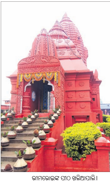
ଭାଗଦାଣ୍ଡ ପାଠ ଖଲିଆପାଲି।

ସୋନପୁର, ୮।୬ (ବି.ପ୍.) ସୁବର୍ଣ୍ଣପୁର ଜିଲ୍ଲା ସଦର ମହକୁମାଠାରୁ ପଶ୍ଚିମକୁ ୨୨ କିଲୋମିଟର ଗଲେ ଖଲିଆପାଲି ଗ୍ରାମରେ ରହିଛି ସରକାରୀ ଭାଗଦାଣ୍ଡ ଆଶ୍ରମ। ଏହି ମହିଳା ଆଶ୍ରମ ଥିଲା କବିଙ୍କ କର୍ମସ୍ଥଳ। ବହୁ ସ୍ଥାନ ବୁଲିବା ପରେ ଶେଷରେ କବି ଖଲିଆପାଲିକୁ ହିଁ ନିଜ ଅତି ପ୍ରିୟ ଓ ସର୍ବଶ୍ରେଷ୍ଠ ସ୍ଥାନ ବୋଲି ଗ୍ରହଣ କରି ନେଇଥିଲେ।