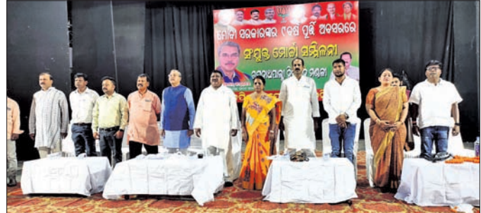
ସଂଯୁକ୍ତ ମୋର୍ଚ୍ଚା ବୈଠକରେ ମହାସଭା ଅତିଥିବୃନ୍ଦ।