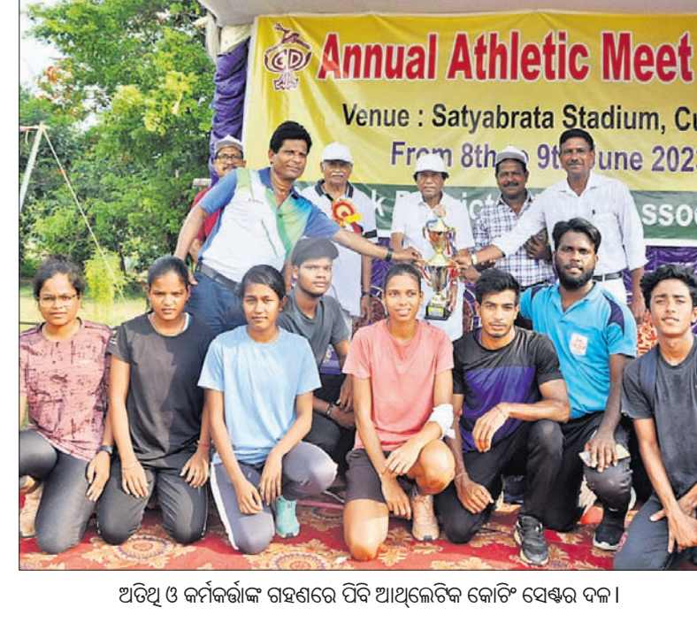
ଅତିଥି ଓ କର୍ମଚାରୀଙ୍କ ସମ୍ମାନରେ ପିବି ଆଥଲେଟିକ କୋଟିଂ ସେଣ୍ଟର ଦଳ।

ଭୁବନେଶ୍ୱର, ୯୬ (ସ୍ପୋର୍ଟ୍‌ସ୍‌ସ୍‌ପେ) କଟକ ଜିଲ୍ଲା କ୍ରୀଡ଼ା ସଂସଦ ଆନୁକୁଲ୍ୟରେ ଦୁଇ ଦିନ ଧରି କଟକସ୍ଥିତ ସତ୍ୟବ୍ରତ ସ୍ମୃତିୟମରେ କଟକ ଜିଲ୍ଲା ବାର୍ଷିକ ଆଥଲେଟିକ ନିର୍ଦ୍ଦେଶକ ହୋଇଛନ୍ତି।