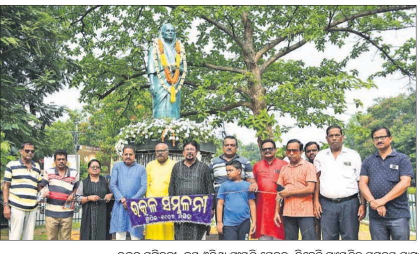
ଉତ୍କଳ ସମ୍ମିଳନୀ, ଜୟ ଓଡ଼ିଶା ସଂସ୍କୃତି ସେବକ, ବିଜେଡି ସଂସ୍କୃତିକ ସମନ୍ୱୟ ସାମ୍ବନ୍ଧୀୟ ପକ୍ଷରୁ ଶ୍ରଦ୍ଧାଞ୍ଜଳି ଅର୍ପଣ କରାଯାଇଛି ।