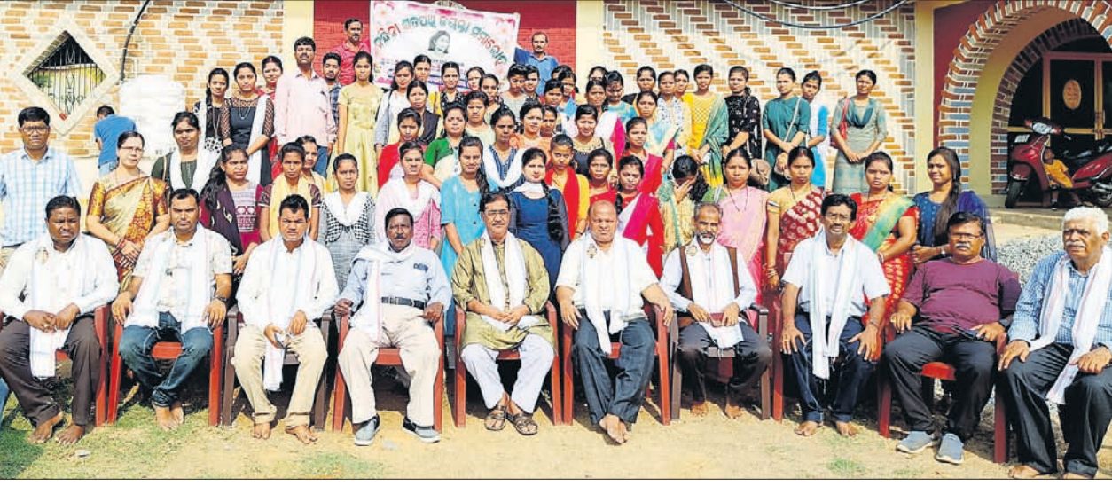
ଗଞ୍ଜାମ ଜିଲ୍ଲା ଭଞ୍ଜନଗରର ନନ୍ଦିନୀ ଶତପଥୀ ସ୍ମୃତି ସଂସଦ ପକ୍ଷରୁ ସାଧୁ ବୁଦ୍ଧୁଙ୍କୁ ଆବାସିକ ବିଦ୍ୟାଳୟ ପରିସରରେ ଶୁକ୍ରବାର ଆୟୋଜିତ ପୂର୍ବତନ ମୁଖ୍ୟମନ୍ତ୍ରୀ ନନ୍ଦିନୀ ଶତପଥୀଙ୍କ ଜନ୍ମଦିନ ପାଳନ ଅବସରରେ ଯୋଗଦେଇଥିବା ଅତିଥି ଓ ସଂସଦର ସଦସ୍ୟ ।