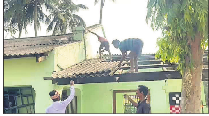
ବାହାନଗା ହାଇସ୍କୁଲ ଗୃହର ଆକବେଷ୍ଟସ ଖୋଲାଯାଇଛି।