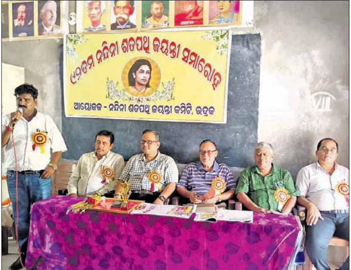
ଉତ୍କଳ ନନ୍ଦିନୀ ଶତପଥୀ ଜୟନ୍ତୀ କମିଟି ପକ୍ଷରୁ ଭଞ୍ଜନଗରର ବୁକ୍ ଶାଳା ବିଦ୍ୟାଳୟରେ ଶୁକ୍ରବାର ଆୟୋଜିତ ନନ୍ଦିନୀ ଦେବୀଙ୍କ ଜୟନ୍ତୀ ଉତ୍ସବରେ ଉପସ୍ଥିତ ଅତିଥିମାନେ ।