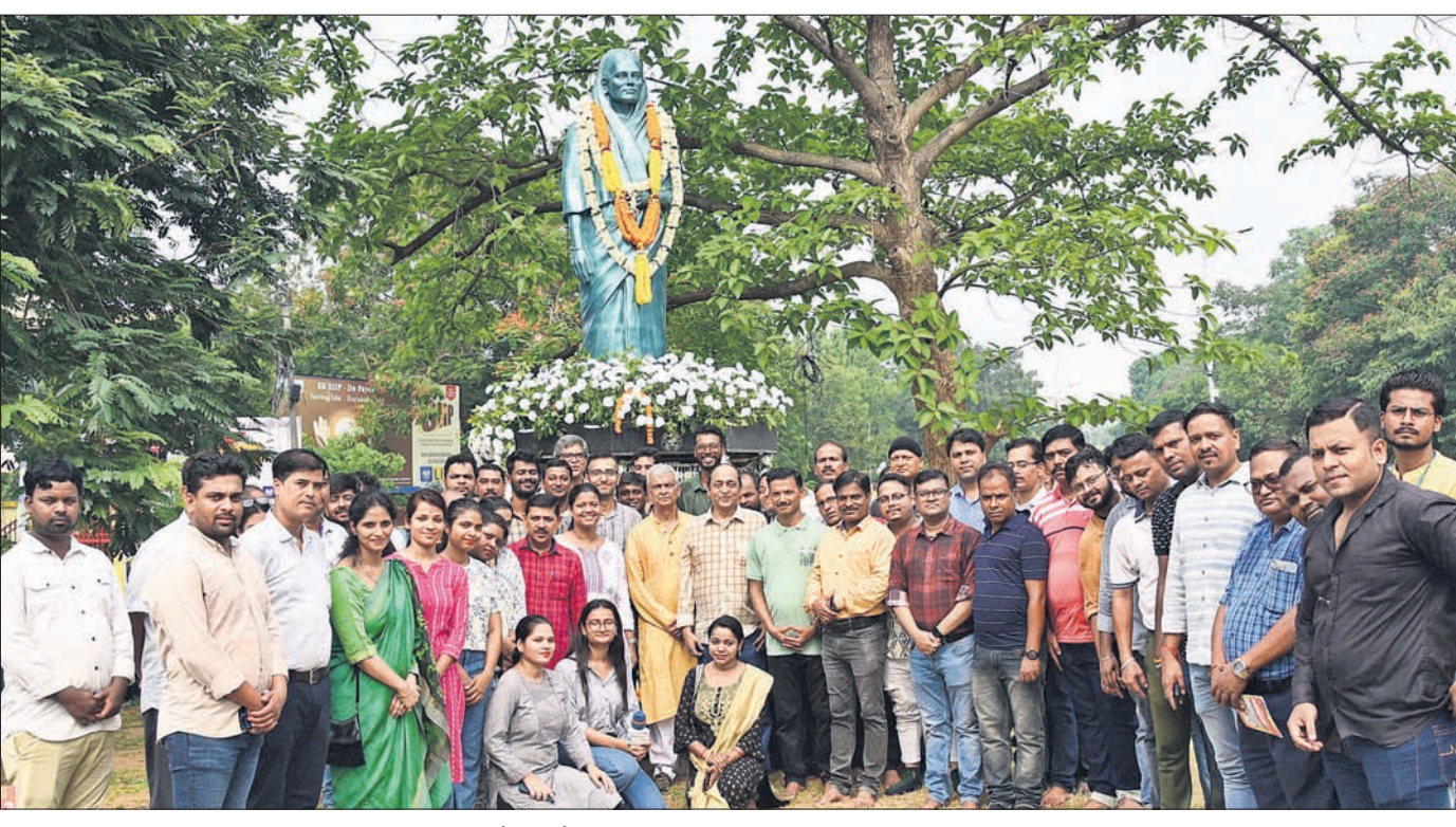
ମାଲ୍ୟାପର୍ଯ୍ୟ କାର୍ଯ୍ୟକ୍ରମରେ ଉପସ୍ଥିତ ଧରିତ୍ରୀ ଏବଂ ଓଡ଼ିଶା ପୋଷ୍ଟର ପରିବାର ।