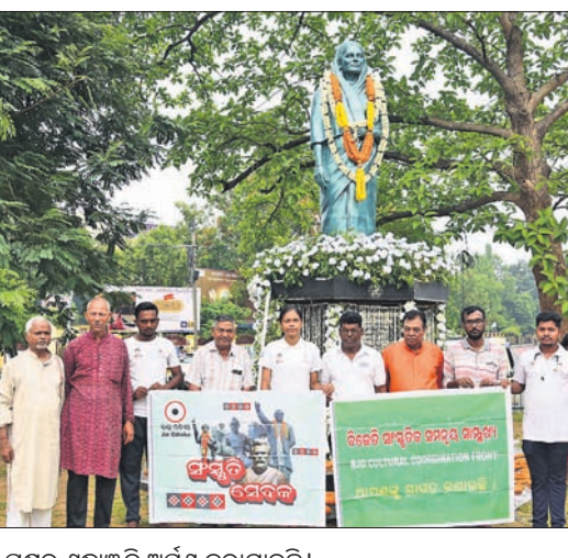
ଉତ୍କଳ ସମ୍ମିଳନୀ, ଜୟ ଓଡ଼ିଶା ସଂସ୍କୃତି ସେବକ, ବିଜେଡି ସଂସ୍କୃତିକ ସମନ୍ୱୟ ସାମ୍ବନ୍ଧୀୟ ପକ୍ଷରୁ ଶ୍ରଦ୍ଧାଞ୍ଜଳି ଅର୍ପଣ କରାଯାଇଛି ।