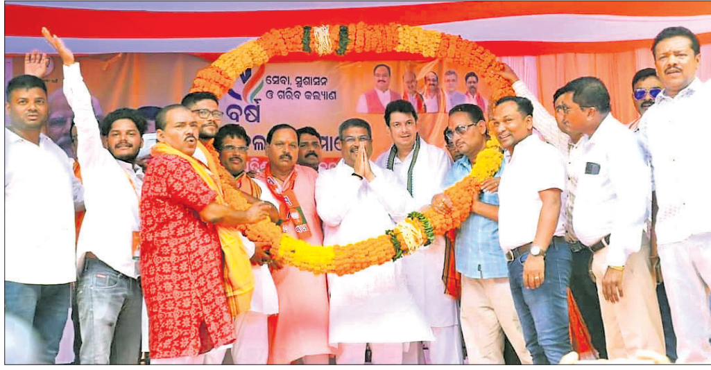
ଦେବଗଡ଼ ଜିଲ୍ଲା ଭାଜପା ପକ୍ଷରୁ ଗରିବ କଲ୍ୟାଣ ସମାବେଶରେ କେନ୍ଦ୍ର ଶିକ୍ଷା ମନ୍ତ୍ରୀ ଧର୍ମେନ୍ଦ୍ର ପ୍ରଧାନ।

ମୋଦୀ ସରକାରର ୯ ବର୍ଷ ପୂର୍ବ ଅବସରେ ଦେବଗଡ଼ ଜିଲ୍ଲା ଭାଜପା ପକ୍ଷରୁ ସ୍ଥାନୀୟ ବଡ଼ ବରିଚାଠାରେ ଗରିବ କଲ୍ୟାଣ ସମାବେଶ ଶନିବାର ଅନୁଷ୍ଠିତ ହୋଇଥିଲା।