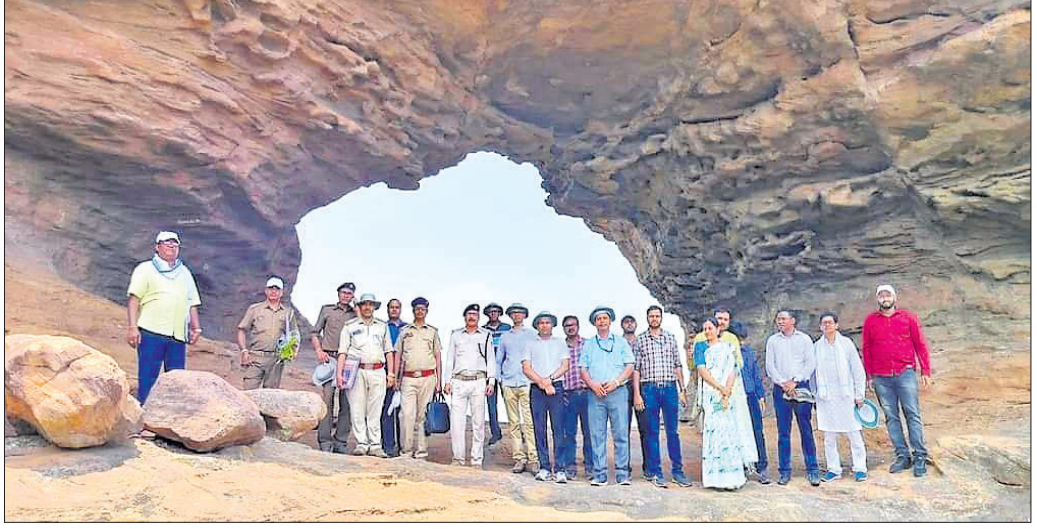
ଐତିହ୍ୟ ସ୍ଥଳରେ ଭୂତତ୍ୱ ବିଜ୍ଞାନୀ ଓ ବନବିଭାଗ ଅଧିକାରୀ।

ଆବିଷ୍କାର ହେଲା ୧୨ହଜାର ନିୟୁତ ବର୍ଷ ପୂର୍ବରୁ ପ୍ରାକୃତିକ ଐତିହ୍ୟ ଛେଙ୍ଗା ପାହାଡ଼। ଏହି ପାହାଡ଼ ବନ୍ଧରେ ଦିନେ ନଦୀ ପ୍ରବାହିତ ହେଉଥିବା କଥା ଭୂତତ୍ୱ ବୈଜ୍ଞାନିକମାନେ ଗବେଷଣାକୁ ଚାଲି ପାରିଛନ୍ତି।