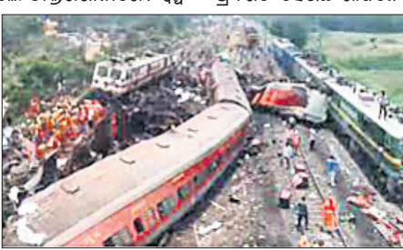
ଓଡ଼ିଶାରେ ଘଟିଥିବା ଟ୍ରେନ ଘଟଣାର ସ୍ଥଳ

ଏସମିତ ରେକମାନ୍ତାକୁ ନେଇ ଦେଶରେ ଆରମ୍ଭ ହୋଇଯାଇଛି ଆଗୋପ ପ୍ରତ୍ୟାଗୋପ। ସମ୍ପୂର୍ଣ୍ଣ ହେଉଛି ରାଜନେତାଙ୍କ ନିକ୍ଷୁ ରାଜନୀତିର ନଗ୍ନ ନିଦର୍ଶନ। ପ୍ରତିପକ୍ଷ ପୁହରେ ଏକ ଦମ୍ଭବୀର ପୃଥ୍ୱିବ ଦେଇ ତାକୁ ଛୁପିତ କରିବାକୁ ଯେପରି ସୁଯୋଗ ଅପେକ୍ଷା ଥିଲା ତାହା ପ୍ରତିଦ୍ୱନ୍ଦ୍ୱୀ, ନିଦର୍ଶନ।