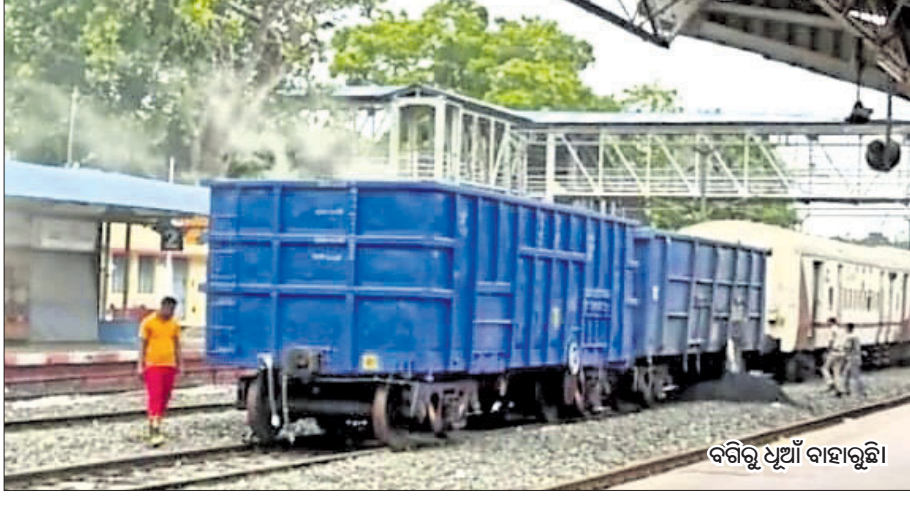
ବଗିରୁ ଧୂଆଁ ବାହାରୁଛି।