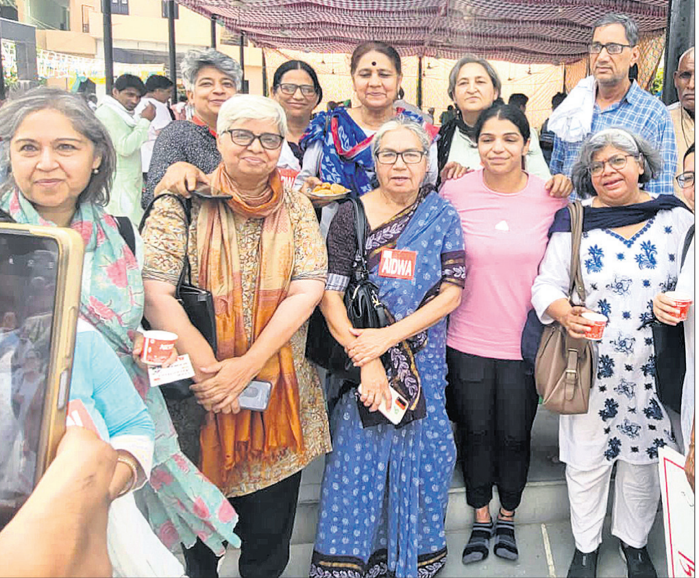
ସୋନେପତ୍‌ରେ କୃଷକ ଆନ୍ଦୋଳନର ନେତାଙ୍କ ସହ ସାକ୍ଷୀ ମିଳିକା

ନୂଆଦିଲ୍ଲୀ, ୧୦୬୬(ପି.ଟି.) ଭାରତୀୟ ରେଭଲିଂ ମହାସଂଘର ପୂର୍ବତନ ସଭାପତି ବ୍ରଜଭୂଷଣ ଶରଣ ସିଂହ ମାମଲାରେ ସମାଧାନ ନ ହେଲେ ଖେଳାଳି ମାନେ ଏସିଆନ ଗେମ୍ସରେ ଅଂଶଗ୍ରହଣ କରିବେ ନାହିଁ ବୋଲି କହିଛନ୍ତି ସାକ୍ଷୀ ମିଳିକା। ସୋନେପତ୍‌ରେ କୃଷକ ସଙ୍ଗଠନର