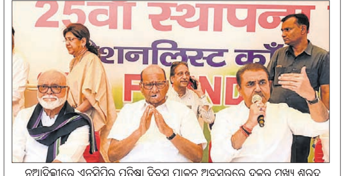
ନୂଆଦିଲ୍ଲୀରେ ଏନ୍‌ସିପିର ପ୍ରତିଷ୍ଠା ଦିବସ ପାଳନ ଅବସରରେ ଦଳର ମୁଖ୍ୟ ଶରଦ ପାଠ୍ୟପୁସ୍ତକ ସହ ନେତା ଛନ୍ଦନ ଭୁଜବଳ ଓ ପ୍ରଫୁଲ୍ଲ ପଟ୍ଟେଲ।

ଝିଅ ସୁପ୍ରିୟା ସୁଲେଙ୍କୁ ଏନ୍‌ସିପି ପାଠ୍ୟପୁସ୍ତକ ଅଧକ୍ଷ କରିବା ପାଇଁ ପ୍ରଫୁଲ୍ଲ ପଟ୍ଟେଲ ଏହି ପ୍ରସ୍ତାବ ଦେଇଥିଲେ। ଏହି ପ୍ରସ୍ତାବକୁ ସମର୍ଥନ ଦେଖାଇବା ପରେ ଏନ୍‌ସିପି ମୁଖ୍ୟ ଶରଦ ପାଠ୍ୟପୁସ୍ତକ ସହ ନେତା ଛନ୍ଦନ ଭୁଜବଳ ଓ ପ୍ରଫୁଲ୍ଲ ପଟ୍ଟେଲ ଏହି ପ୍ରସ୍ତାବକୁ ସମର୍ଥନ ଦେଖାଇଥିଲେ।