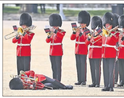
ରାଜ୍ୟ ଆନୁଷ୍ଠାନିକ ଜନ୍ମଦିନ ସ୍ଵରୂପ ପ୍ରତିବର୍ଷ ମାର୍ଚ୍ଚରେ ବାର୍ଷିକ ସାମରିକ ପରେ ଡ଼ ଟ୍ରିପ୍‌ସ୍ ଦି କଲର ଅନୁଷ୍ଠିତ ହୋଇଥାଏ। ଆସନ୍ତା ୧୭ ତାରିଖରେ କିଙ୍ଗ୍ ଚାଲିସ୍ ୩ୟ ଉକ୍ତ ପରେ ଡ଼ରେ ଅଭିବାଦନ ଗ୍ରହଣ କରିବେ। ଏଥିପାଇଁ ଶନିବାର ବୃତ୍ତାନ୍ତ ରିହସ୍ୟାଳ ଚାଲିଥିଲା।

ଯାଇଥିଲେ। କଲୋନେଲ୍‌ସ୍ ବିଭିନ୍ନ ନାମରେ ଉକ୍ତ ସେନା ପରେ ଡ଼ରେ ହାତସଞ୍ଚାଲୁ ତିନିଜଣ ଏବଂ ରୟାଲ୍ ହର୍ସ୍ ଆର୍ଟିଲେରିର ୧,୪୦୦ରୁ ଉର୍ଦ୍ଧ୍ଵ ସୈନ୍ୟ ଯୋଗ ଦେଇଥିଲେ। ପ୍ରତ୍ୟେକ ଚୈତ୍ରପାପ ମଧ୍ୟରେ ସୈନ୍ୟମାନେ ପରେ ଡ଼ରେ ସାମିଲ ହୋଇଥିବାକୁ ଫ୍ରିଲିୟମ୍ ରୁଜ୍‌ଜ୍ କରି ସେମାନଙ୍କୁ ଧନ୍ୟବାଦ ଜଣାଇଛନ୍ତି।