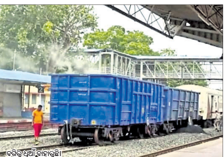
ବଗିକୁ ଧୂଆଁ ବାହାରୁଛି