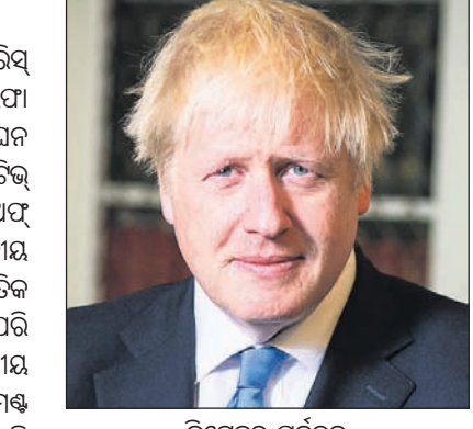
ବ୍ରିଟେନର ପୂର୍ବତନ ପ୍ରଧାନମନ୍ତ୍ରୀ ବୋରିସ୍ ଜନ୍‌ସନ ବିରୋଧରେ ପ୍ରମାଣ ପାଇଥିଲେ ୧୦ ଦିନ ପାଇଁ ତାଙ୍କ ସଦସ୍ୟତା ରଦ୍ଦ କରିବାକୁ ସୁପାରିସ୍ କରିଥିବା ଥିଲା। କିନ୍ତୁ ଏପରି ଅପମାନିତ ହେବା ପୂର୍ବରୁ ସେ ନିଜ ଆଡୁ ଇସ୍ତଫା ଦେଇଛନ୍ତି।

ବ୍ରିଟେନର ପୂର୍ବତନ ପ୍ରଧାନମନ୍ତ୍ରୀ ବୋରିସ୍ ଜନ୍‌ସନ ଶୁକ୍ରବାର ଏମ୍‌ପି ପଦରୁ ଇସ୍ତଫା ଦେଇଛନ୍ତି। କୋଭିଡ୍-୧୯ ନିୟମ ଉଲ୍ଲଙ୍ଘନ ଅଭିଯୋଗରେ ସମାଲୋଚିତ କଞ୍ଚରଭେଟିଙ୍ଗ୍ ପାର୍ଟି ସଦସ୍ୟ ବୋରିସ୍ ହାଉସ୍ ଅଫ୍ କମନ୍ସକୁ ବିକ୍ରାନ୍ତ କରିଥିବା ନେଇ ସଂସଦୀୟ ତଦନ୍ତ ଚାଲିଥିବାବେଳେ ନିଜ ରାଜନୈତିକ କ୍ୟାରିୟରକୁ ନେଇ ସନ୍ଦିହାନ ହୋଇ ଏମ୍‌ପି ପଦକ୍ଷେପ ନେଇଥିବା କୁହାଯାଇଛି।