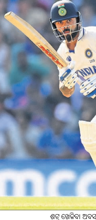
ଶର୍ଟ ଖେଳିବା ଅବସରରେ ବିରାଟ କୋହଲି

ଉଇକେଟ୍ ହରାଇଥିଲା। ଲାବୁସେନ ନିଜ ପୂର୍ବଦିନର ଷ୍ଟୋର ୪୧ ରନ୍‌ରେ ହିଁ ଆଉଟ୍ ହୋଇଥିଲେ। ଉମେଶ ଯାଦବ ଏହି ଉଇକେଟ୍ ପାଇଥିଲେ। କାମେରନ ବ୍ରାନ୍ ୨୫ ରନ୍ କରିଥିବାବେଳେ ରବୀନ୍ଦ୍ର ଜାଡେଜାଙ୍କ ବଲରେ ବୋଲ୍ ହୋଇଥିବାରୁ ଅଷ୍ଟ୍ରେଲିଆ ୧୬୭ ରନ୍‌ରେ ୬ଷ୍ଠ ଉଇକେଟ୍ ହରାଇଥିଲା। ତେବେ ମିଚେଲ ଷ୍ଟାର୍କ ଓ ଆଲେକ୍ସ କାରେ ୬୮ ଉଇକେଟ୍‌ରେ ୯୩ ରନ୍‌ର ମୂଲ୍ୟବାନ୍ ଆଗାଧାରି ରହି ଅଷ୍ଟ୍ରେଲିଆକୁ ଦୃଢ଼ସ୍ଥିତିରେ ପହଞ୍ଚାଇ ଦେଇଥିଲେ। ୫୭ ବଲରୁ ୪୧ ରନ୍ କରିଥିବା ଷ୍ଟାର୍କଙ୍କୁ ମହମ୍ମଦ ଶାମି ଆଉଟ୍ କରିବାକୁ ଏହି ଯୋଡ଼ି ଭାଙ୍ଗିଥିଲା। ଅଧିନାୟକ ପ୍ୟାଟ୍ କୁମିନ୍‌ସ୍ ୫ ରନ୍ କରି ଆଉଟ୍ ହେବା ସହିତ ଅଷ୍ଟ୍ରେଲିଆ ଦ୍ୱିତୀୟ ଲକ୍ଷ୍ୟ ଘୋଷଣା କରିଥିଲା। ଅଷ୍ଟ୍ରେଲିଆ ଲକ୍ଷ୍ୟରେ ମେଗ୍‌ରୁଦେଶ୍ ଆଲୋକ୍ଷିତ ଆଲୋକ୍ଷ କାରେ। ସେ ୧୦୫ଟି ବଲ୍‌ର ସମ୍ପୂର୍ଣ୍ଣାନ୍ତ ହୋଇ ୮ ଚୋକା ସହିତ ୬୬ ରନ୍‌ରେ ଅପରାଜିତ ରହିଥିଲେ। ଭାରତ ପକ୍ଷରୁ ରବୀନ୍ଦ୍ର ଜାଡେଜା ୩ଟି, ଉମେଶ ଯାଦବ ଓ ମହମ୍ମଦ ଶାମି ୨ଟି ଲେଖାଏ ଏବଂ ମହମ୍ମଦ ସିରାଜ ଗୋଟିଏ ଉଇକେଟ୍ ନେଇଥିଲେ। ସଂକ୍ଷିପ୍ତ ଷ୍ଟୋର ଅଷ୍ଟ୍ରେଲିଆ ପ୍ରଥମ ଲକ୍ଷ୍ୟ: ୪୪୪। ଭାରତ ପ୍ରଥମ ଲକ୍ଷ୍ୟ: ୨୯୦। ଅଷ୍ଟ୍ରେଲିଆ ଦ୍ୱିତୀୟ ଲକ୍ଷ୍ୟ: ୨୭୦/୮/ଘୋଷଣା (ଆଲୋକ୍ଷ କାରେ-୬୬, ମିଚେଲ ଷ୍ଟାର୍କ-୪୧, ମାର୍ଟିନ୍ ଲାବୁସେନ-୪୧, ଷ୍ଟିଭେନ୍ ଫ୍ଲିମି-୩୪, କାମେରନ ବ୍ରାନ୍-୨୫, ରବୀନ୍ଦ୍ର ଜାଡେଜା-୩/୫୮, ମହମ୍ମଦ ଶାମି-୨/୩୯, ଉମେଶ ଯାଦବ-୨/୫୪, ମହମ୍ମଦ ସିରାଜ-୧/୮୦)। ଭାରତ ଦ୍ୱିତୀୟ ଲକ୍ଷ୍ୟ: ୧୬୪/୩।