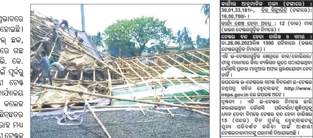
କାଳବୈଶାଖୀରେ ଭାଙ୍ଗିଲା ଚେଷ୍ଟ

ଶିବିରରେ ଅପରାହ୍ନରେ କାଳବୈଶାଖୀ ପ୍ରଭାତରେ ପ୍ରବଳ ବେଗରେ ପବନ ସାଙ୍ଗକୁ ବର୍ଷା ହୋଇଛି। ପବନରେ ଭଦ୍ରକ ସହରର ଚାଉଳ ହଲ୍ ଛକ, ଏସ୍.ପି. କାର୍ଯ୍ୟାଳୟ ନିକଟ ଆଦି ସ୍ଥାନରେ ଗଛ ଭାଙ୍ଗିପଡ଼ିଛି।