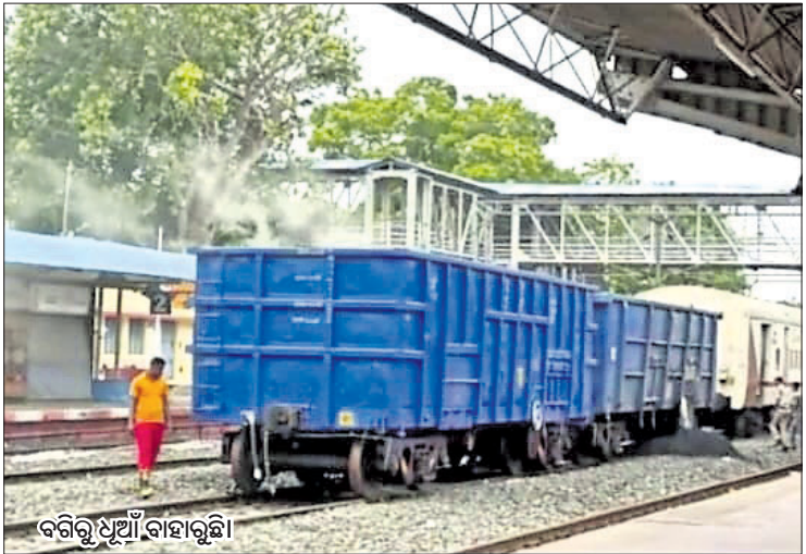
ବଗିକୁ ଧୁଆଁ ବାହାରୁଛି ବାଲେଶ୍ୱର ଅଫିସ/ ରୂପସା, ୧୦୧୭(ଡି.ଏନ.ଏ.)

ବାହାନଗା ଟ୍ରେନ ଦୁର୍ଘଟଣା ଓ ଯାଜପୁର ରୋଡରେ ଟ୍ରେନରେ କଟି ଶକ୍ତିକ ମୃତ୍ୟୁ ଘଟଣା ମନରୁ ନ ଲିଭିଣୁ ଦୈନିକ ଟ୍ରେନରେ ନିଆଁ ଲାଗୁଥିବା ଖବର ସାମ୍ନାକୁ ଆସୁଛି। ଅନେକ ଲୋକ ଏବେ ଟ୍ରେନରେ ଯାତ୍ରା କରିବାକୁ ଭୟ କରୁଛନ୍ତି। ଶନିବାର ଦକ୍ଷିଣ ପୂର୍ବ ରେଳପଥର ଖଡ଼ଗପୁର ଡିଭିଜନ ଅଧୀନ ବାଲେଶ୍ୱର ଜିଲ୍ଲା ରୂପସା ରେଳ ଷ୍ଟେଶନରେ ଥିବା ଏକ କୋଇଲା ବୋଝେଇ ବଗିରେ ନିଆଁ ଲାଗିଯାଇଥିଲା। ଅଗ୍ନିଶମ ବିଭାଗ