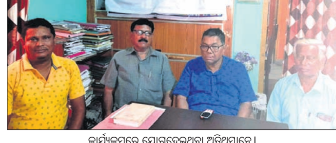
କାର୍ଯ୍ୟକ୍ରମରେ ଯୋଗଦେଇଥିବା ଅତିଥିମାନେ।

କରିଥିବା ବୋଲି ମତପ୍ରକାଶ ପାଇଥିଲା। ପ୍ରଫେସର ସ୍ତ୍ରୀରୋଗ ଚକ୍ର ନାୟକ, ଓଡ଼ିଶା ଗର୍ଭାବସ୍ଥା ଶିବିରରେ ଉପସ୍ଥାନ କରିବା ପାଇଁ ସମସ୍ତଙ୍କୁ ଆହ୍ୱାନ କରାଯାଇଛି।