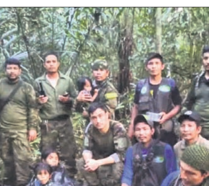
ମେ' ୧ରେ ଦୁର୍ଘଟଣାଗ୍ରସ୍ତ ବିମାନ। ଉଦ୍ଧାର ୪ ପିଲାଙ୍କ ସହ ଅପରେଶନ 'ହୋପ୍' ଚଳାଉ ସଦସ୍ୟ। ବୋଗୋଟା, ୧୦/୬

ମେ' ୧ରେ ଦକ୍ଷିଣ ଆମେରିକୀୟ ରାଷ୍ଟ୍ର କଲମ୍ବିଆର ଦକ୍ଷିଣ ଭାଗରେ ଥିବା ଆମାଜନ ଜଙ୍ଗଲରେ ଏକ ଛୋଟ ବିମାନ ଦୁର୍ଘଟଣାଗ୍ରସ୍ତ ହୋଇଥିଲା। ବିମାନରେ ଯାତ୍ରା କରୁଥିବା ପାଇଲଟ୍ ଓ ଜଣେ ମହିଳାଙ୍କ ସମେତ ୩ ବୟସ୍କଙ୍କ ମୃତ୍ୟୁ ଘଟିଥିଲା। କିନ୍ତୁ ସେଇଦିନରେ ସେମାନଙ୍କ ସହ ଯାତ୍ରା କରୁଥିବା ଆଦିବାସୀ ସମ୍ପ୍ରଦାୟର ୩ ନାବାଳିକା ଓ ଜଣେ ଶିଶୁ ଏଥିରୁ ବଞ୍ଚିଯାଇଥିଲେ। ବହୁ ଖୋଜାଖୋଜି ପରେ ମଧ୍ୟ ସେମାନଙ୍କ ପତ୍ନୀ ମିଳି ନ ଥିଲା। ସେନା ପକ୍ଷରୁ ରାଜିଥିବା 'ଅପରେଶନ ହୋପ୍'ର ୪୦ ଦିନ ପରେ ନିଖୋଜ ୪ ଶିଶୁଙ୍କୁ ଦୁର୍ଘଟଣାସ୍ଥଳରୁ ୫ କି.ମି. ପରେ ଠାବ କରାଯାଇଛି। ଶୁକ୍ରବାର