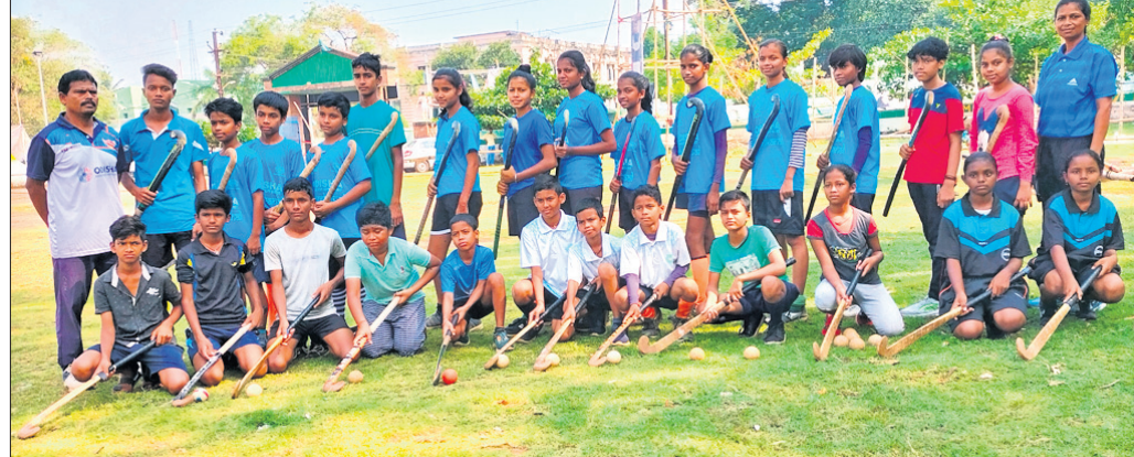
କୋର୍ଟ୍ ଗହଣରେ ହକି ପ୍ରଶିକ୍ଷଣ ନେଉଥିବା କ୍ରୀଡ଼ାବିତ୍ତାମାନେ।