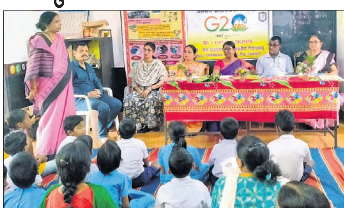
କାର୍ଯ୍ୟକ୍ରମରେ ଛାତ୍ରାଛାତ୍ରୀ ଓ ଶିକ୍ଷକ।

ଡେକାନାଲ ଅଫିସ, ୧୦୧୬ ଡେକାନାଲ ଜିଲ୍ଲା ଉଚ୍ଚ ପ୍ରାଥମିକ ବିଦ୍ୟାଳୟରେ ଶୁକ୍ରବାର ପୋଲିସ ଲାଇନ କ୍ୟୁରର ଏସ୍.ଏଲ.ଏନ୍. ଜନଭାଗାଦାରି କାର୍ଯ୍ୟକ୍ରମ-୨୦୨୩ ଅନୁଷ୍ଠିତ ହୋଇଯାଇଛି।