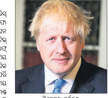
ବ୍ରିଟେନ୍‌ର ପୂର୍ବତନ ପ୍ରଧାନମନ୍ତ୍ରୀ ବୋରିସ୍‌ଙ୍କ ଇସ୍ତଫା

ବ୍ରିଟେନ୍‌ର ପୂର୍ବତନ ପ୍ରଧାନମନ୍ତ୍ରୀ ବୋରିସ୍‌ଙ୍କ ଇସ୍ତଫା ଦେଇଛନ୍ତି। କୋଭିଡ୍-୧୯ ନିୟମ ଉଲ୍ଲଙ୍ଘନ ଅଭିଯୋଗରେ ସମାଲୋଚିତ କଞ୍ଚରଭେଟିଙ୍ଗ୍ ପାର୍ଟି ସଦସ୍ୟ ବୋରିସ୍‌ଙ୍କ ହାତରୁ ଅଫ୍‌କମ୍‌ମିଟ୍ଟି ବିକ୍ରାନ୍ତ କରିଥିବା ନେଇ ସଂସଦୀୟ ତଦନ୍ତ ଚାଲିଥିବାବେଳେ ନିଜ ରାଜନୈତିକ କ୍ୟାରିୟରକୁ ନେଇ ସମିହାନ ହୋଇ ଏପରି ପଦକ୍ଷେପ ନେଇଥିବା କୁହାଯାଇଛି। ୫୮ ବର୍ଷୀୟ ବୋରିସ୍‌ଙ୍କ ଏକ ବିବୃତିରେ କହିଛନ୍ତି, ପାର୍ଲିମେଣ୍ଟ୍ ଛାଡିବା (ଅନ୍ତତଃ ବର୍ତ୍ତମାନ ପାଇଁ) ନିଶ୍ଚିତ ତାଙ୍କୁ ଦୁଃଖ ଦେଇଛି। ତାଙ୍କ ବିରୋଧରେ ଦିଲ୍ଲି ପ୍ରମାଣ ନ ଥିବା ସତ୍ତ୍ୱେ କେତେଜଣ ହାତଗଣତି ବ୍ୟକ୍ତିଙ୍କ ଯୋଗୁ ସେ ଇସ୍ତଫା ଦେବାକୁ ବାଧ୍ୟ ହୋଇଛନ୍ତି। ପାର୍ଟିରେ ମାମଲାରେ ପାର୍ଲିମେଣ୍ଟ୍ ପ୍ରତିଲେଇ କମିଟି ବୋରିସ୍‌ଙ୍କ