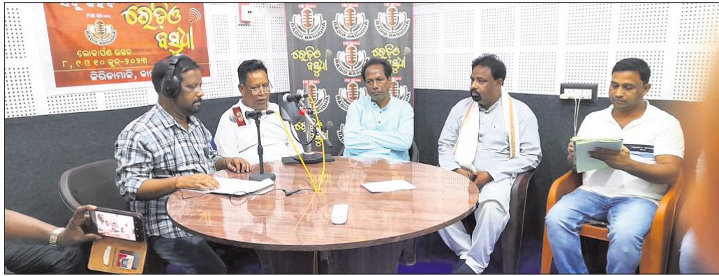
କାର୍ଯ୍ୟକ୍ରମରେ ମନ୍ତ୍ରୀ, ଏମ୍ପି, ନଗରପାଳଙ୍କ ସମେତ ଅନ୍ୟମାନେ।