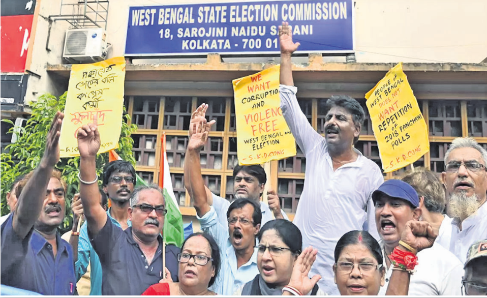
ପଶ୍ଚିମବଙ୍ଗରେ ପଞ୍ଚାୟତ ନିର୍ବାଚନ ପୂର୍ବରୁ ପୂର୍ଣ୍ଣବାଦୀ ଦଳରେ ଜଣେ କଂଗ୍ରେସ କର୍ମୀଙ୍କୁ ହତ୍ୟା କରାଯାଇଛି। ଏହାର ପ୍ରତିବାଦରେ କଂଗ୍ରେସ ସମର୍ଥକମାନେ ଶନିଦାର ଭୋଲକାଟାସ୍ଥିତ ରାଜ୍ୟ ନିର୍ବାଚନ କମିଶନ କାର୍ଯ୍ୟାଳୟ ଆଗରେ ବିରୋଧ କରୁଛନ୍ତି।