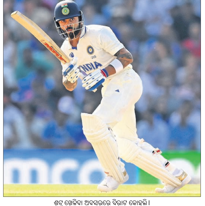
ଶର୍ବ୍ ଖେଳିବା ଅବସରରେ ବିରାଟ କୋହଲି।

ଉଇକେଟ୍ ହରାଇଥିଲା। ଲାଗୁସେନ ନିଜ ପୂର୍ବଦିନର ଘୋର ୪୧ ରନ୍‌ରେ ହିଁ ଆଉଟ୍ ହୋଇଥିଲେ। ଉପେଶ ଯାଦବ ଏହି ଉଇକେଟ୍ ପାଇଥିଲେ।