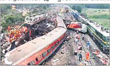
ନଗ୍ନ ନିର୍ଦ୍ଦଶନା ପ୍ରତିପକ୍ଷ ପୁହରେ ଏକ ଦମ୍ଭବୀର ପୃଥିବୀ ଦେଇ ତାକୁ ଛୁପିତ କରିବାକୁ ଯେପରି ସୁଯୋଗ ଅପେକ୍ଷା କରେ ଆଦି ପ୍ରତିହତ୍ୟା