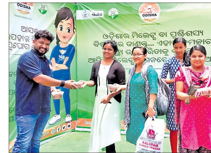
ପ୍ରତିଯୋଗୀଙ୍କୁ ପୁରସ୍କୃତ କରାଯାଇଛି।

ଓଡ଼ିଶା ମିଲେଟ୍ ମିଶନ ପକ୍ଷରୁ ଶନିବାର ସଚେତନା ସୃଷ୍ଟି ନିମନ୍ତେ 'ଫାର୍ମ ଟୁ ପ୍ଲେଟ୍' କାର୍ଯ୍ୟକ୍ରମ ଅନୁଷ୍ଠିତ ହୋଇଯାଇଛି।