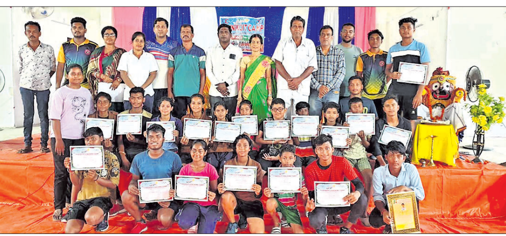
ଅତିଥିମାନଙ୍କ ଗହଣରେ ସମ୍ମାନିତ ଚେନିକଏଟ୍ ଖେଳାଳି।