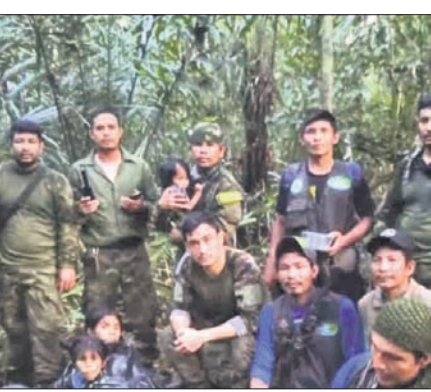
ମେ' ୧ରେ ଦୁର୍ଘଟଣାଗ୍ରସ୍ତ ବିମାନ। ଉଦ୍ଧାର ୪ ପିଲାଙ୍କ ସହ ଅପରେଶନ 'ହୋପ୍' ଚଳାଉ ସଦସ୍ୟ।

ବୋଗୋଟା, ୧୦/୬ ମେ' ୧ରେ ଦକ୍ଷିଣ ଆମେରିକୀୟ ରାଷ୍ଟ୍ର କଲମ୍ବିଆର ଦକ୍ଷିଣ ଭାଗରେ ଥିବା ଆମାଜନ ଜଙ୍ଗଲରେ ଏକ ଛୋଟ ବିମାନ ଦୁର୍ଘଟଣାଗ୍ରସ୍ତ ହୋଇଥିଲା। ବିମାନରେ ଯାତ୍ରୀ କରୁଥିବା ପାଇଲଟ୍ ଓ ଜଣେ ମହିଳାଙ୍କ ସମେତ ୩ ବୟସ୍କଙ୍କ ମୃତ୍ୟୁ ଘଟିଥିଲା। କିନ୍ତୁ ସେଇଭିତ୍ତୀକାଳରୁ ସେମାନଙ୍କ ସହ ଯାତ୍ରୀ କରୁଥିବା ଆଦିବାସୀ ସମ୍ପ୍ରଦାୟର ୩ ନାବାଳିକା ଓ ଜଣେ ଶିଶୁ ଏଥିରୁ ବର୍ତ୍ତିଯାଇଥିଲେ। ବହୁ ଖୋଜାଖୋଜି ପରେ ମଧ୍ୟ ସେମାନଙ୍କ ପତ୍ତା ମିଳି ନ ଥିଲା। ସେନା ପକ୍ଷରୁ ରାଜ୍ୟର 'ଅପରେଶନ ହୋପ୍'ର ୪୦ ଦିନ ପରେ ନିଖୋଜ ୪ ଶିଶୁଙ୍କୁ ଦୁର୍ଘଟଣାସ୍ଥଳରୁ ୫ କି.ମି. ପରେ ଠାବ କରାଯାଇଛି। ଶୁକ୍ରବାର