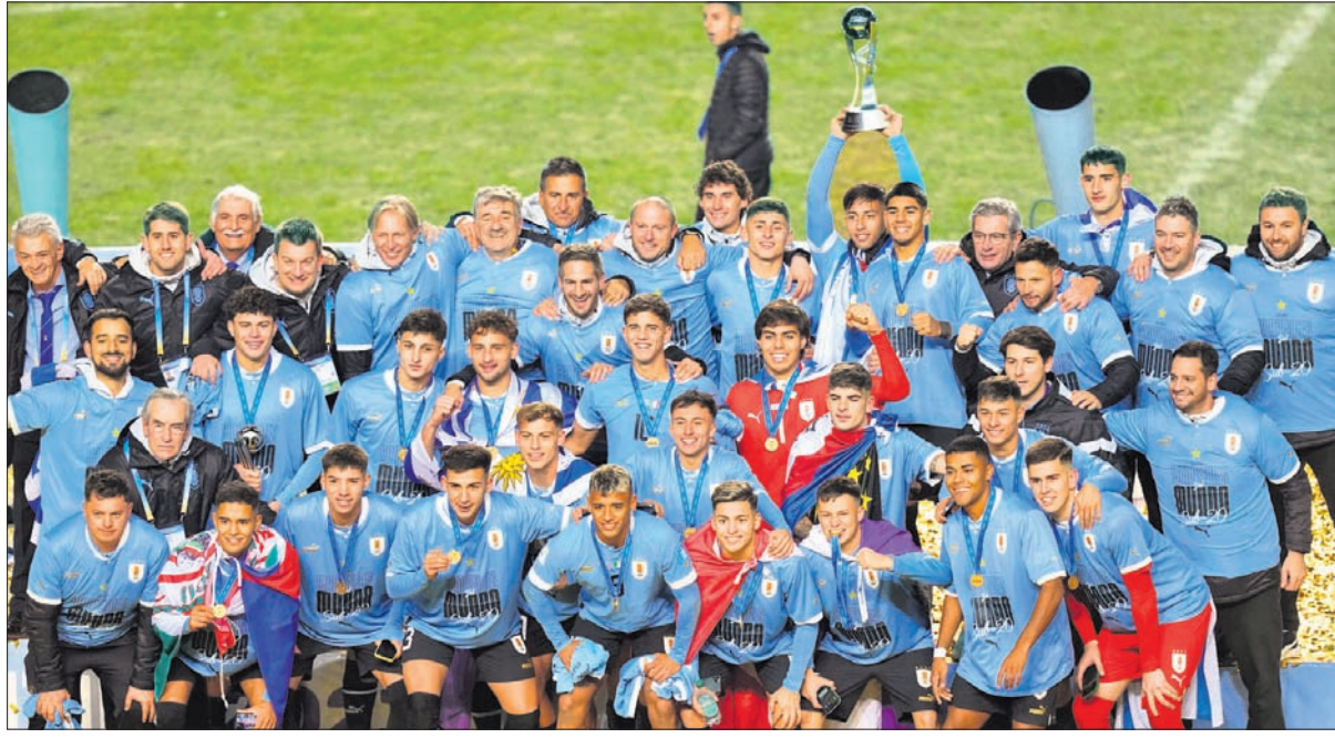
ତ୍ରୱି ସହ ଚାମ୍ପିୟନ ଉରୁଗୁଏ ଦଳ।

ଲା ପ୍ଲାଟା (ଆର୍ଜେଣ୍ଟିନା), ୧୨୬ (ପି.ଟି.) ଆର୍ଜେଣ୍ଟିନାରେ ଅନୁଷ୍ଠିତ ୨୦ ବର୍ଷରୁ କମ୍ ପୁରସ୍କାର ବିଶ୍ୱକପରେ ଚାମ୍ପିୟନ ଆଖ୍ୟା ଅର୍ଜନ କରିଛି ଉରୁଗୁଏ।