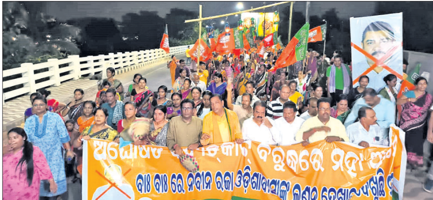
ଅଯୋଧ୍ୟା ବିଦ୍ୟୁତ୍ କାର୍ ବିରୋଧରେ ନିବାସ ନିବାସ ଘେରାଉ ଉଦ୍ୟମରେ ଭାଙ୍ଗପା ପକ୍ଷରୁ ବାହାରିଥିବା ଶୋଭାଯାତ୍ରା।

ଲକ୍ଷ୍ମଣ, ବିଜ୍ଞାପନ କରିଲେ ଅଭିନବ ପ୍ରତିବାଦ ଅସହ୍ୟ ଗରମ ଓ ରୁକ୍ମକୁଳି ରାଜ୍ୟବାସୀଙ୍କୁ ଯେତେ କଷ୍ଟ ଦେଇନାହିଁ, ଅଯୋଧ୍ୟା ବିଦ୍ୟୁତ୍ କାର୍ ଓ ବିଦ୍ୟୁତ୍ ବିଭାଗ ତାଠାରୁ ଅଧିକ ନିର୍ଦାୟୀ ଦେଉଛି। ଗରମ ଭିତରେ ବିଦ୍ୟୁତ୍ କାର୍ ଲୋକଙ୍କୁ ଅସୁବିଧା ସୃଷ୍ଟି କରିପାରେ। ଗ୍ରାମାଞ୍ଚଳରେ ପ୍ରତିଦିନ ୫ରୁ ୬ ଘଣ୍ଟା ବିଦ୍ୟୁତ୍ କାର୍ ହେଉଛି। ସରକାର କେତେବେଳେ ବି ବିଦ୍ୟୁତ୍ କର୍ମାନ୍ତର ଭଲ ଲୋକଙ୍କୁ ଯାଚୁଛି। ଗ୍ରାମାଞ୍ଚଳରେ ବିଦ୍ୟୁତ୍ କାର୍ ସାଙ୍ଗକୁ ଲୋ-ଭୋଲଟେଜ୍ ସମସ୍ୟା ବି ହ୍ରସ୍ୱସକ୍ତ କରୁଛି। ଗ୍ରାମାଞ୍ଚଳରେ ଆରମ୍ଭ କରି ସହରାଞ୍ଚଳ ପର୍ଯ୍ୟନ୍ତ ଅଭିନବ ବିଦ୍ୟୁତ୍ କାର୍ କାୟା ବିଦ୍ୟାର କରିସାରିଛି। ଏଭଳି ସମୟରେ ରାଜ୍ୟ ଶକ୍ତି ବିଭାଗ