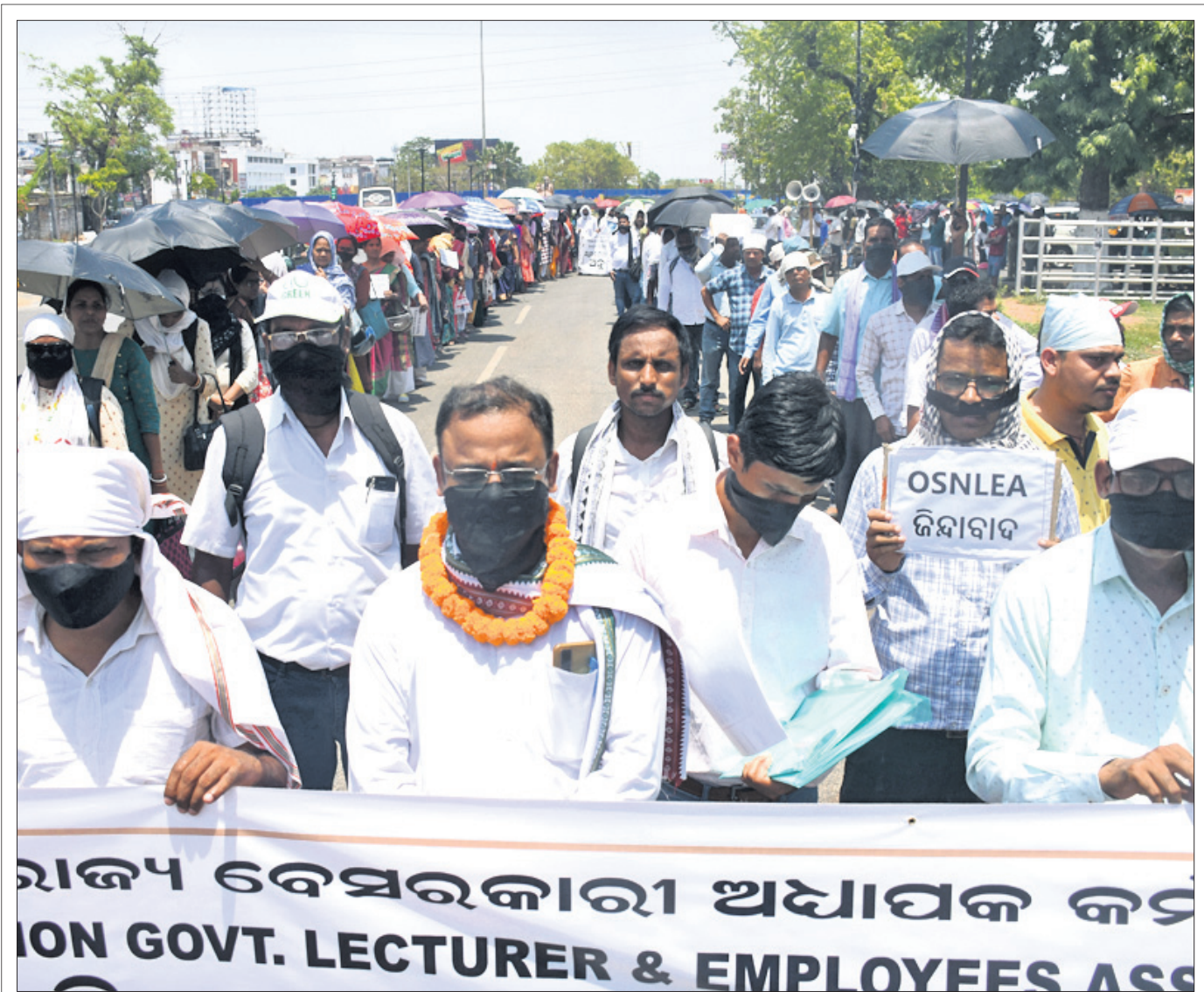
ଅନୁଦାନ ବାବିରେ ଓଡ଼ିଶା ରାଜ୍ୟ ବେସରକାରୀ ଅଧ୍ୟାପକ କର୍ମଚାରୀ ସଂଘ ପକ୍ଷରୁ ୨୦୦୮ ମସିହା ପରବର୍ତ୍ତୀ ଅଧ୍ୟାପକ ଓ କର୍ମଚାରୀମାନେ ମୁହଁରେ କଳାପତ୍ରି ବାନ୍ଧି ଭୁବନେଶ୍ୱର ଲୋୟର ପିଏମ୍‌ଜିରେ ଅଭିନବ ବିଶୋଭ ପ୍ରଦର୍ଶନ କରୁଛନ୍ତି।