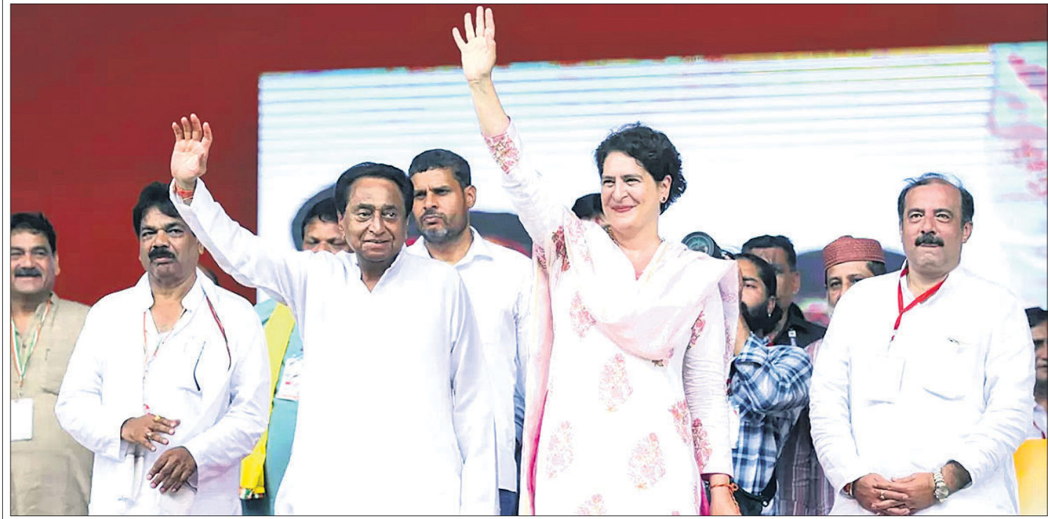
ମଧ୍ୟପ୍ରଦେଶର ଜବଲପୁରଠାରେ ଯୋଗଦାନ ଏକ ନିର୍ବାଚନୀୟଭାବେ କଂଗ୍ରେସର ସାଧାରଣ ସମାବେଶ ପ୍ରୟତ୍ନ। ଗାନ୍ଧୀ ଭଦ୍ରାଙ୍କ ସହ ରାଜ୍ୟ କଂଗ୍ରେସ ସଭାପତି କମଳ ନାଥ ଓ ଦକ୍ଷିଣ ନେତୃତ୍ୱ।

ଓଡ଼ିଆ ଲୋକ ମୋଦିଙ୍କୁ ଚାଗେଟ କଲେ। ମୋଦିଙ୍କୁ ଚାଗେଟ କରିବା ପାଇଁ ଓଡ଼ିଆ ଲୋକ ମୋଦିଙ୍କୁ ଚାଗେଟ କଲେ। ମୋଦିଙ୍କୁ ଚାଗେଟ କରିବା ପାଇଁ ଓଡ଼ିଆ ଲୋକ ମୋଦିଙ୍କୁ ଚାଗେଟ କଲେ।