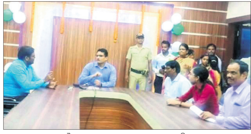
ଐପଦା ବୁକର ସମୀକ୍ଷା ଗୃହ ଉଦ୍ଘାଟନ କରାଯାଇଛି।