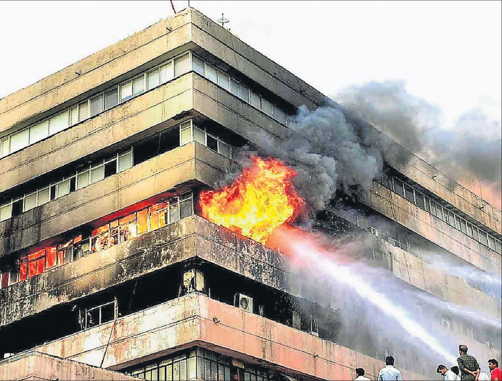
ଦୁର୍ନୀତି ପ୍ରମାଣ ନଷ୍ଟ ପାଇଁ ନିଆଁ