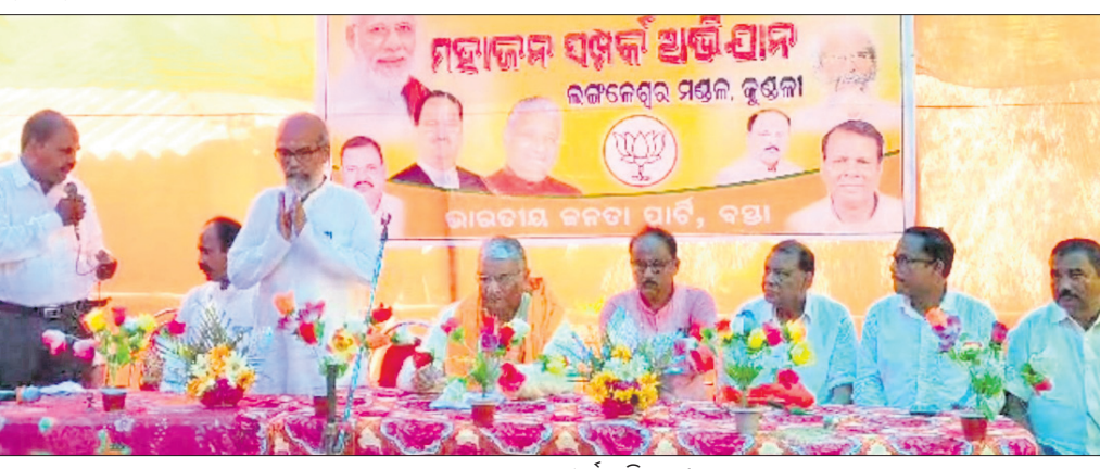
ଭାଜପାର ମହାଜନସମ୍ମିଳନୀ ଅଭିଯାନ।

ଲକ୍ଷ୍ମଣନାଥ, ୧୩।୬ (କମଳାକାନ୍ତ ଦାସ/ବାଞ୍ଛାନିଧି ଦେ) ବାଲେଶ୍ୱର ଜିଲ୍ଲା ବସ୍ତା ନିର୍ବାଚନପନ୍ଥା ଅଧୀନ କୁଶୁଳୀ ପଞ୍ଚାୟତର ଉପସଭା ଗ୍ରାମରେ ଭାଜପାର 'ବେଷ୍ଟ ପୁଅ' ଉପକ୍ରମର ମହାଜନସମ୍ମିଳନୀ ଅଭିଯାନ ଆରମ୍ଭ ହୋଇଛି।