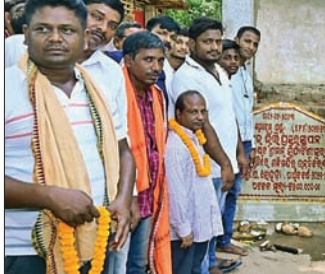
ସୋହାର୍ଦ୍ଦରେ ବିଧାନସଭା ଦ୍ୱାରା ଭିତ୍ତିପ୍ରସ୍ତର ସ୍ଥାପନ କରାଯାଇଛି।

ଆମନର, ୧୩।୬ (ବେବେନ୍ଦ୍ର ଆଦିଆ) ଭିତ୍ତିପ୍ରସ୍ତର ସ୍ଥାପନ ସହ ଆନନ୍ଦପୁର ଉପସଭା କମିଟିର ସମସ୍ତଙ୍କୁ ଆନନ୍ଦପୁର ବିଧାନସଭାରେ ପ୍ରଦର୍ଶନ କରିଥିଲେ।