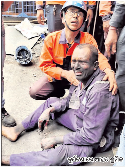
ଦୁର୍ଘଟଣାରେ ଆହତ ଶ୍ରମିକ

ରତନ ନାୟାର/କାର୍ତ୍ତିକ ସାହୁ ଡେକାନାଲ ଅଫିସ/କଟକ ଅଫିସ, ୧୩୬ ଡେକାନାଲ ଜିଲା ଓଡ଼ିଆପଡ଼ା ବ୍ଲକ୍ ନରେନ୍ଦ୍ରପୁରସ୍ଥିତ ଟାଟା ଷ୍ଟିଲ୍ ମେରାମଣ୍ଟାଳ କମ୍ପାନୀରେ ମଙ୍ଗଳବାର ବଡ଼ଧରଣର ଦୁର୍ଘଟଣା ଘଟିଛି। ଅପରାହ୍ଣ ପ୍ରାୟ ୧ଟାରେ କାରଖାନାର ଗ୍ଲାସ୍ ଫର୍ନେସ୍ ଷ୍ଟିଲ୍ ଲାଇନ୍ ଫାଟି ଉତ୍ତପ୍ତ ବାଷ୍ପ ନିର୍ଗମନ ହେବାରୁ ୨ ଅଧିକାରୀଙ୍କ ସମେତ ୧୮ ଶ୍ରମିକ ଗୁରୁତର ହୋଇଛନ୍ତି। ସେମାନଙ୍କ ମଧ୍ୟରେ ଉଭୟ ଓଡ଼ିଆ ଓ ଅଣଓଡ଼ିଆ କୁଶଳୀ, ଅଣକୁଶଳୀ, ଠିକା ଶ୍ରମିକ ଏବଂ କମ୍ପାନୀ କର୍ମଚାରୀ ଅଛନ୍ତି। ସମସ୍ତଙ୍କୁ କଟକର ଏକ ଘରୋଇ ହସ୍ପିଟାଲରେ ଭର୍ତ୍ତି କରାଯାଇଛି। ଅବସ୍ଥା ସଜିନ ଥିବାରୁ ଜଣଙ୍କୁ ଆଇସିୟୁରେ ଏବଂ ଅନ୍ୟ ୬ ଜଣଙ୍କୁ ସେମି ଆଇସିୟୁରେ ଚିକିତ୍ସା କରାଯାଉଛି। ଅବଶିଷ୍ଟ ୧୧ ଜଣ କାନ୍ଥୁଆଳିରେ ଚିକିତ୍ସିତ ହେଉଛନ୍ତି। ସ୍ୱାସ୍ଥ୍ୟାବସ୍ଥା ଅନୁଧ୍ୟାନ କରି ସେମାନଙ୍କୁ ଅନ୍ୟ ଔର୍ଡ଼କୁ ସ୍ଥାନାନ୍ତର କରାଯିବ ବୋଲି ଡାକ୍ତରଖାନା କର୍ତ୍ତୃପକ୍ଷ ସୂଚନା ଦେଇଛନ୍ତି। ଅପରାହ୍ଣରେ ବିଏପ୍ ପାଖର ପ୍ଲାଣ୍ଟ-୨ ଷ୍ଟିଲ୍ ଲାଇନ୍ ନିରୀକ୍ଷଣ କାର୍ଯ୍ୟ ଚାଲିଥିବାବେଳେ ହଠାତ୍ ପାଇପ୍ ଫାଟି ଯାଇଥିଲା। ପ୍ରବଳ ମାତ୍ରାରେ ଉତ୍ତପ୍ତ ବାଷ୍ପ ନିର୍ଗମନ ହୋଇଥିଲା। ଫଳରେ ସେଠାରେ କାର୍ଯ୍ୟରତ ୧୮ ଜଣ ପୋଡ଼ିଯାଇଥିଲେ।