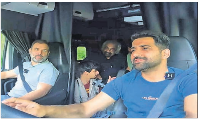
ଓଡ଼ିଶାରେ ମୁସଲମାନ ଗ୍ରାମୀଣଙ୍କ ଗୁମାସ୍ତା ଗଲେ ରାହୁଲ