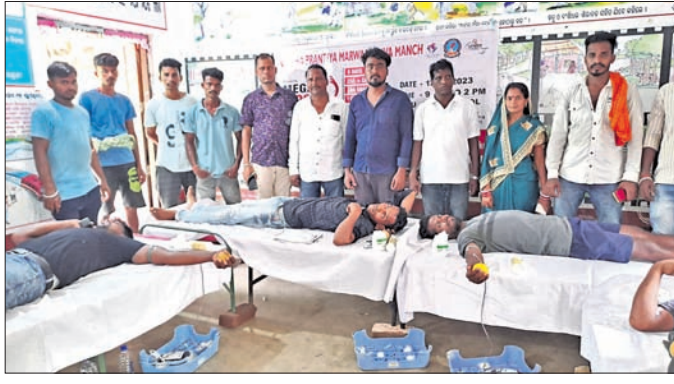
ମୁକ୍ତମାନେ ରକ୍ତଦାନ କରୁଛନ୍ତି।

ଆଜି, ୧୩୬(ବନମାଳୀ ସେନାପତି) ବାହାନଗାଠାରେ ଘଟି ଯାଇଥିବା ମର୍ମହୀନ ରେକର୍ଡ ଦୂର୍ଦ୍ଦଶାରେ ଆହତମାନଙ୍କ ଆରୋଗ୍ୟ କାମନା ସହ ଚିକିତ୍ସା ଲାଭି ଆଜି ବୃକ୍ ବଡ଼ଆଲୋ ଗ୍ରାମରେ ରକ୍ତଦାନ ଶିବିର ଅନୁଷ୍ଠିତ ହୋଇଯାଇଛି।