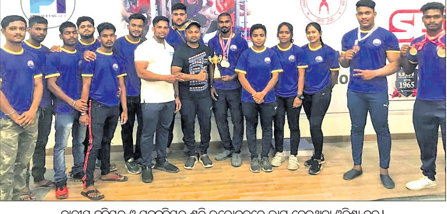
ଜାତୀୟ କୁନିୟର ଓ ସବୁକ୍ରମରେ ଶକ୍ତି ଉତ୍ସୋଳନରେ ଭାଗ ନେଇଥିବା ଓଡ଼ିଶା ଦଳ।