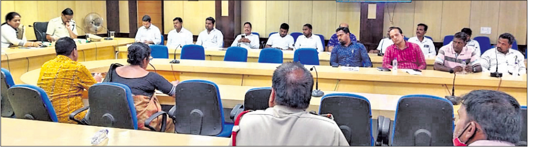
ବୈଠକରେ ଯୋଗଦେଇଥିବା ପ୍ରଶାସନିକ ଅଧିକାରୀ ଓ ଅନ୍ୟମାନେ।

ଜଗତ୍ୱିୟ ପୂର୍ବ ପ୍ରାକୃତିକ ବିପର୍ଯ୍ୟୟ ଲିକା। ବିଭିନ୍ନ ସମୟରେ ଏହି ଲିକାରେ ବାତ୍ୟା ଓ ବନ୍ୟା ଆଦି ଲୋକଙ୍କ ଧନ, ଜୀବନ ହାନି କରିଛି। ଆଗକୁ ବର୍ଷାଦିନ ଆହୁତବାକୁ ତା'ପୂର୍ବରୁ ପ୍ରସ୍ତୁତ ରହିବାକୁ ପଡ଼ିବ। ବାତ୍ୟା ଓ ବନ୍ୟା ଆସିଲେ କିପରି ମୁକାବିଲା କରିବାକୁ ପଡ଼ିବ ସେନେଇ ଚେଷ୍ଟା ଚଳୁ ଏକ୍ସପରାଇଜ୍ ଓ ମକ୍ତୁଲିକା କରାଯିବ।