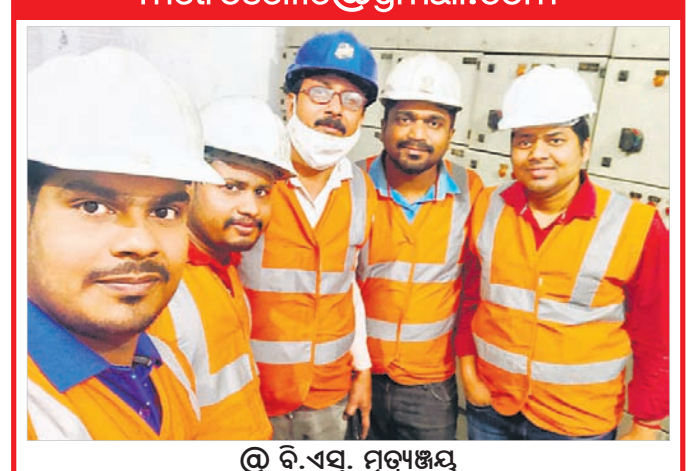
@ ବି.ଏସ୍. ମୃତ୍ୟୁଞ୍ଜୟ