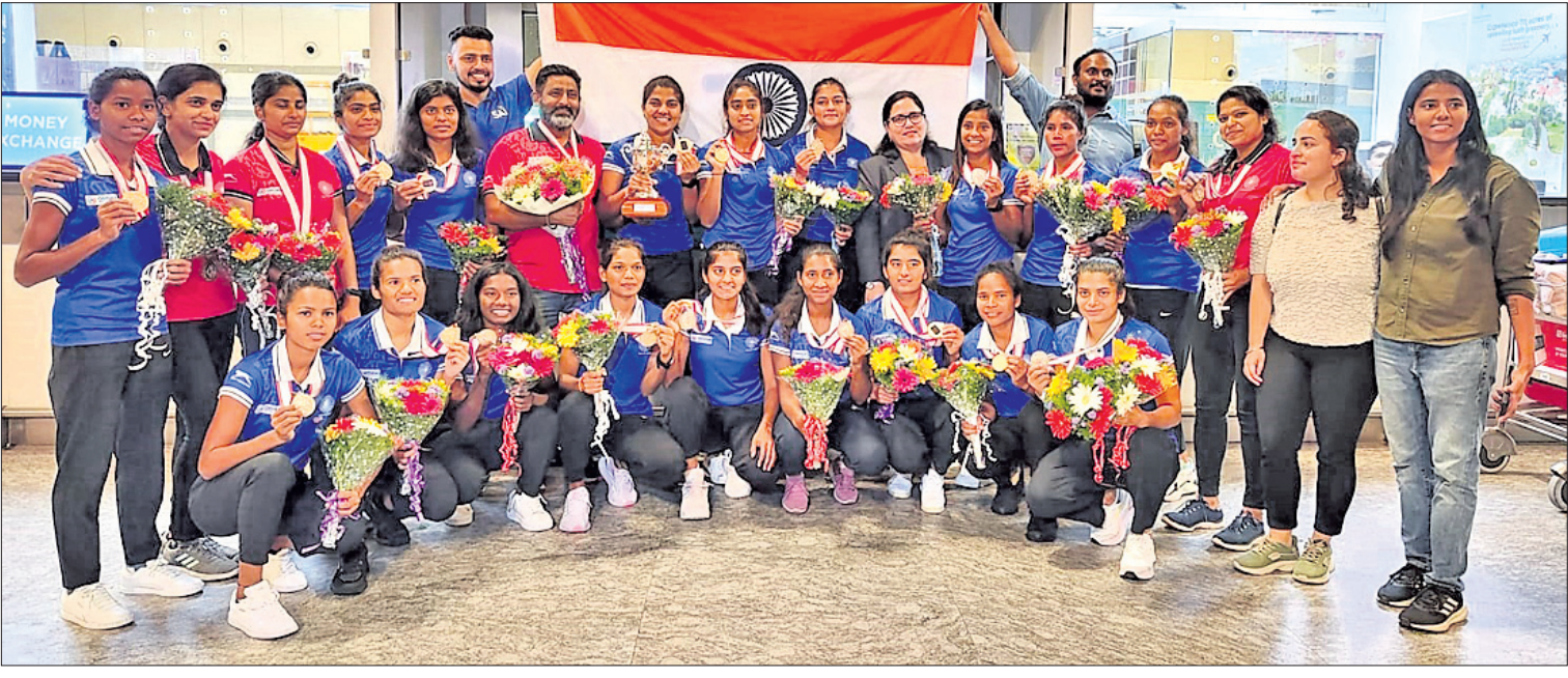
ବେଙ୍ଗାଲୁରୁରୁଥିବ ଷୋର୍ଟ୍ ଅଥଲିଟି ଅଫ ଇଣ୍ଡିଆ ପରିସରରେ ମଙ୍ଗଳବାର ସମର୍ପଣ ହେବା ଅବସରରେ କୁନିୟର ମହିଳା ଏସିଆ କପ୍ ହକି ଚାମ୍ପିୟନ ଭାରତୀୟ ଦଳ। କୁନିୟର ମହିଳା ଏସିଆ କପ୍ରେ ଭାରତର ଏହାଥିଲା ସର୍ବପ୍ରଥମ ସ୍ୱର୍ଣ୍ଣ ପଦକ।

ନୂଆଦିଲ୍ଲୀ, ୧୩।୬ (ପି.ଟି.): ବୟସାଧିକ କାରଣରୁ ଦେଶର ଅନ୍ୟତମ ଦୌଡ଼କ୍ରମ କ୍ରମବନ୍ଧା ଗୁରୁବଚନ ସିଂ ରାଜପୁତ ଆଥଲେଟିକ୍ସ ଫେଡେରେଶନ ଅଫ ଇଣ୍ଡିଆ (ଏଏଫଆଇ) ସିଲେକ୍ସନ କମିଟି ଚେୟାରମ୍ୟାନ ପଦବାରୁ ତାଙ୍କ ଇସ୍ତଫା ପ୍ରଦାନ କରିଛନ୍ତି। ୮୪ ବର୍ଷୀୟ ଗୁରୁବଚନ ୧୯୬୨ ଏସିଆନ ଗେମ୍ସ ଚେୟାରମ୍ୟାନ ଏକ ସ୍ୱର୍ଣ୍ଣ ପଦକ ଜିତିଥିଲେ। ୧୯୬୪ ଅଲିମ୍ପିକ୍ସ ୧୧୦ ମିଟର ହର୍ଟଲୁ ଇଭେଣ୍ଟରେ ସେ ୫ମ ହୋଇଥିଲେ। ବୟସାଧିକ ଯୋଗୁ ସେ ତାଙ୍କ କାର୍ଯ୍ୟ ପାଇଁ ଶତ ପ୍ରତିଶତ ସମୟ ଦେଇପାରୁ ନାହାନ୍ତି। ଗୁରୁବଚନ ଦୀର୍ଘ ୧୮ ବର୍ଷ ଧରି ଏଏଫଆଇ ସିଲେକ୍ସନ କମିଟି ଚେୟାରମ୍ୟାନ ଭାବେ କାର୍ଯ୍ୟ କରିଛନ୍ତି। ଭାରତୀୟ ଆଥଲେଟିକ୍ସ ଏହାର ବିବର୍ତ୍ତନ ଏକ ରୋମାଞ୍ଚକର ପର୍ଯ୍ୟାୟରେ ପହଞ୍ଚିଛି। ଜଣେ ସୁବ୍ୟକ୍ତିବିଶେଷକୁ ଦାୟିତ୍ୱ ହସ୍ତାନ୍ତର କରିବା ସମୟ ଉପନୀତ ହୋଇଛି। ବିଶ୍ୱମାନ ଆମ ପାଖରେ ବୁଲି ବିଶ୍ୱ ଆଥଲେଟିକ୍ସ ଚାମ୍ପିୟନଶିପ୍ ପଦକ ବିଜେତା ଅଷ୍ଟ୍ରି ଏକ ଜର୍ଣ୍ଣାଲିଷ୍ଟ ଓ ନାରଜ ଚୋପ୍ରା ଅଛନ୍ତି। ଆହୁରି ଖୁସିର ବିଷୟ ୨୦୨୦ ଟୋକିଓ ଅଲିମ୍ପିକ୍ସରେ ଚୋପ୍ରା ଦେଶ ପାଇଁ ଏକ ସ୍ୱର୍ଣ୍ଣ ପଦକ ଆଣିଦେଇଛନ୍ତି। ପୂର୍ବରୁ ୧୯୬୦ରେ ମିଲ୍ଲୀମା ସିଂ ଏବଂ ପି.ଟି. ଉଷା ୧୯୮୪ରେ ଅଳ୍ପକ ପଦକରୁ ବଞ୍ଚିତ ହୋଇଥିଲେ।