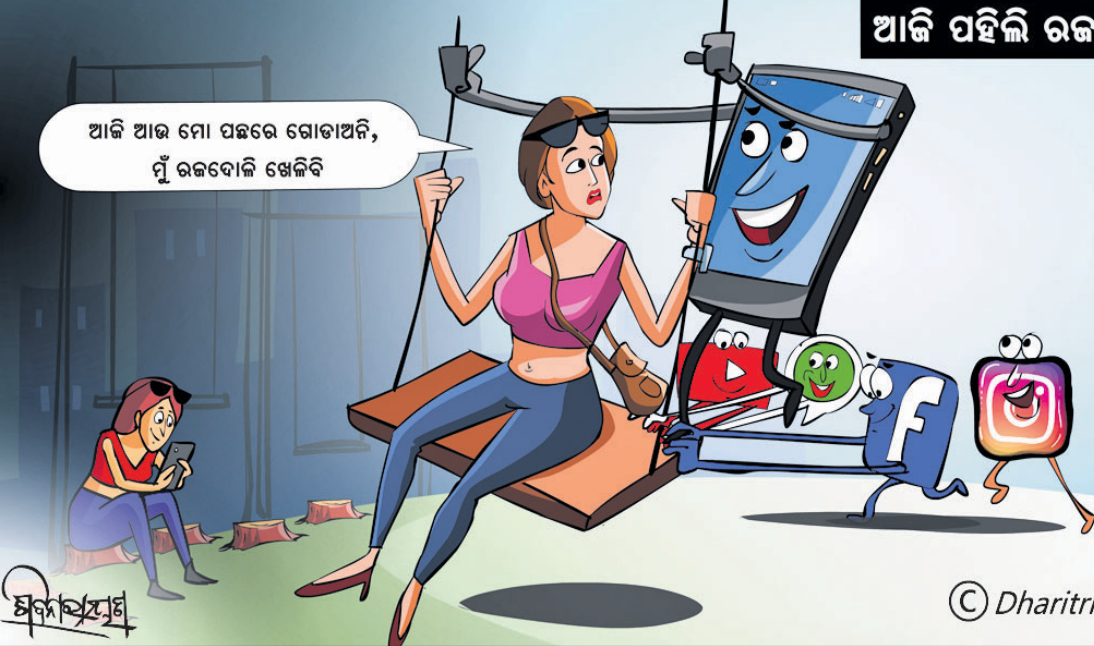
ଆଜି ପହିଲି ରଜ