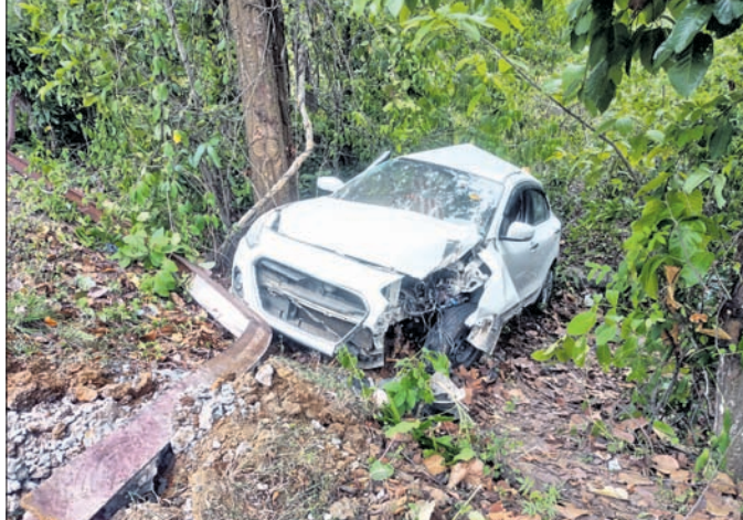
ଦୁର୍ଘଟଣାଗ୍ରସ୍ତ କାର୍ ।

ନୟାଗଡ଼ ଜିଲ୍ଲା ନୂଆଗାଁ ଥାନା ପଞ୍ଚୁପାଣ୍ଡବ ନିକଟରେ ସୋମବାର ରାତିରେ ଏକ କାର ଭାରସାମ୍ୟ ହରାଇ ବିଦ୍ୟୁତ୍ ଖୁଣ୍ଟକୁ ଧକ୍କା ଦେବା ଫଳରେ ୨ ଜଣ ଗୁରୁତର ହୋଇଛନ୍ତି । ନୂଆଗାଁ ଥାନା ପୋଲିସ୍ ଆହତବ୍ୟକ୍ତଙ୍କୁ ଅଗ୍ନିଶମ ବାହିନୀ ଗାଡ଼ିରେ ନୟାଗଡ଼ ମୁଖ୍ୟ ଚିକିତ୍ସାଳୟକୁ ପଠାଇଥିଲା । ସେଠାରେ ସ୍ୱାସ୍ଥ୍ୟବସ୍ଥା ଗୁରୁତର ହେବାରୁ ଉଭୟଙ୍କୁ ଭୁବନେଶ୍ୱର ଗ୍ଲାନୋଷ୍ଟରିଟି କରାଯାଇଛି ।