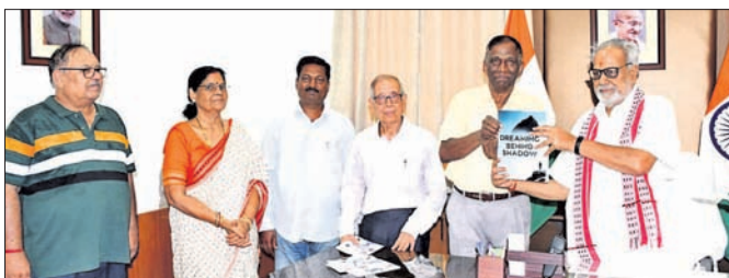
ରାଜ୍ୟପାଳ ପ୍ରଫେସର ଗଣେଶ ଲାଲ ୨ ପୁସ୍ତକକୁ ଉନ୍ମୋଚନ କରୁଛନ୍ତି । ସେବା କ୍ଷେତ୍ରରେ କାର୍ଯ୍ୟ କରୁଥିବା ନିମନ୍ତେ ପଥ ପ୍ରଦର୍ଶକ ହୋଇପାରିବ ବୋଲି ପ୍ରକାଶକ ଆଶାବ୍ୟକ୍ତ କରୁଛନ୍ତି ।

ରାଜ୍ୟପାଳଙ୍କ ଦ୍ୱାରା ୨ ପୁସ୍ତକ ଉନ୍ମୋଚିତ ହୋଇପାରିବ ବୋଲି ପ୍ରକାଶକ ଆଶାବ୍ୟକ୍ତ କରୁଛନ୍ତି । ସେବା କ୍ଷେତ୍ରରେ କାର୍ଯ୍ୟ କରୁଥିବା ନିମନ୍ତେ ପଥ ପ୍ରଦର୍ଶକ ହୋଇପାରିବ ବୋଲି ପ୍ରକାଶକ ଆଶାବ୍ୟକ୍ତ କରୁଛନ୍ତି ।