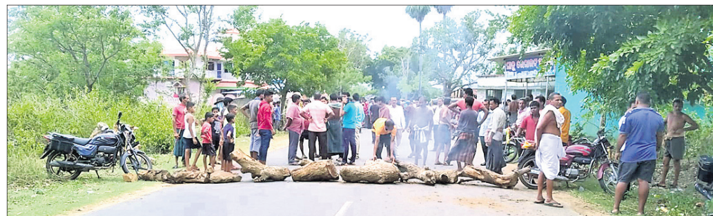
କ୍ଷତିପୂରଣ ବାବଦରେ ଗ୍ରାମବାସୀ ରାସ୍ତାରେ ନିଆଁ ଜାଳି ରାସ୍ତା ଅବରୋଧ କରିଛନ୍ତି ।