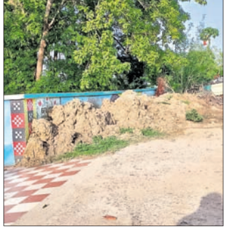
ସ୍କୁଲ ପାଟେରି କଡ଼ରେ ମାଟି ଗଦା କରାଯାଇଛି ।

ଖଣ୍ଡପଡ଼ା ବ୍ଲକ ଅଧୀନ କଣ୍ଠିଲୋ ନୀଳମାଧବ ନୋଡାଲ ବିଦ୍ୟାପୀଠର ରୂପାନ୍ତରୀକରଣ କାମ ସମ୍ପନ୍ନ ହୋଇଛି । ନୂଆ ରୂପରେ ଉଚ୍ଚ ଶିକ୍ଷାନୁଷ୍ଠାନଟିର ପାରିପାଶ୍ୱିକ ସ୍ଥିତି ମନୋଲୋଭା ହୋଇଛି । ସମ୍ପ୍ରତି ଶିକ୍ଷାନୁଷ୍ଠାନ ସ୍ଥିତି ଥିବା ସମୟରେ ଉଚ୍ଚ ପ୍ରାଚୀର ପାଶ୍ୱିକରେ ପକ୍ କାନ୍ଥୁଅ ମିଶା ମାଟି ଗଦା ଯାଇଥିବାରୁ ସାଧାରଣରେ ଅସହାୟତା ସୃଷ୍ଟି ହୋଇଛି । ଏବେ