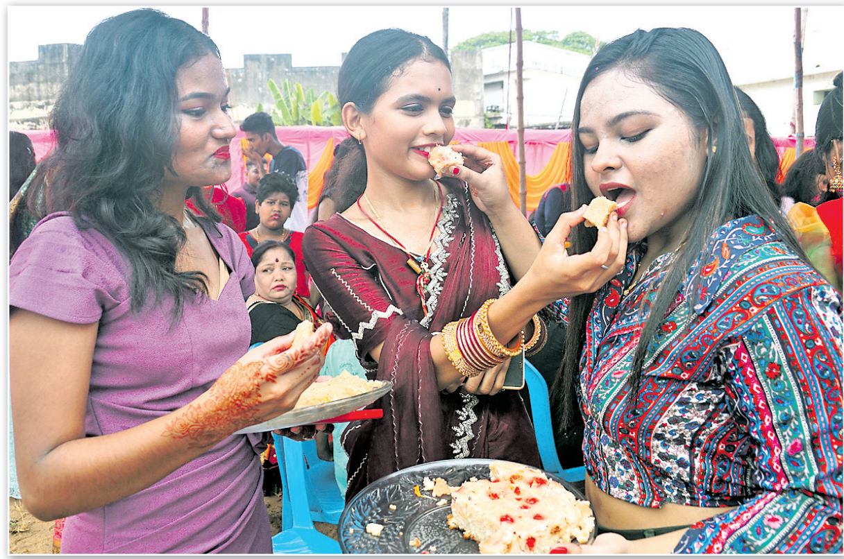
କଟକ ବଳଭଦ୍ରପୁର ଜୟମହାବୀର ପାରମ୍ପରିକ ପକ୍ଷରୁ ଆୟୋଜିତ ରଜ ମହୋତ୍ସବରେ ଯୁବତୀମାନେ ପୋଡ଼ିପିଠା ଖୁଆଇ ରଜ ଭସବ ପାଇଁ କରୁଛନ୍ତି।

ଗଣପର୍ବ ରଜ ପାଇଁ ରାଜଧାନୀ ଭୁବନେଶ୍ୱର ସମେତ ରାଜ୍ୟର ଗାଁ ଓ ସହର ସବୁଠି ଉତ୍ସବର ମାହୋଲ୍ ଆରମ୍ଭ ହୋଇଛି। ବୁଧବାର ପହିଲି ରଜରେ ପିଠା, ମିଠା, ପାନ ସାଙ୍ଗକୁ ବୋଲି ଖେଳରେ ମଜି ଯାଇଛନ୍ତି ଛୋଟ ପିଲାଙ୍କଠାରୁ ଆରମ୍ଭ କରି ଝିଅ, ବୋହୂମାନେ। ବିଶେଷକରି ଡରୁଣାମାନେ ସଜବାଜ ହୋଇ ସାଙ୍ଗସାଥୀଙ୍କ ମେଳରେ ବୁଲାଇ କରିବା ସହ ବିଭିନ୍ନ କାର୍ଯ୍ୟକ୍ରମରେ ସାମିଲ ହୋଇ ରଜର ମଜା ନେଉଛନ୍ତି। ସହରର ବିଭିନ୍ନ ହୋଟେଲ, ଅନୁଷ୍ଠାନ, କୁର୍ ଓ ଘରୋଇ ଭାବେ ସ୍ୱତନ୍ତ୍ର ରଜ ଉତ୍ସବର ଆୟୋଜନ କରାଯାଇଥିବାବେଳେ ରଜଦୋଳି, ଝୋଟି, ରଙ୍ଗୋଲି, ସାଜସଜ୍ଜା, ରଜକୁମାରୀ ପ୍ରତିଯୋଗିତା ସହ ନାଚଗୀତର ଆସର ଖୁବ୍ ଜମୁଛି।