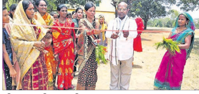
ମହିଳାମାନେ ଦୋଳି ପୂଜା କରୁଛନ୍ତି।