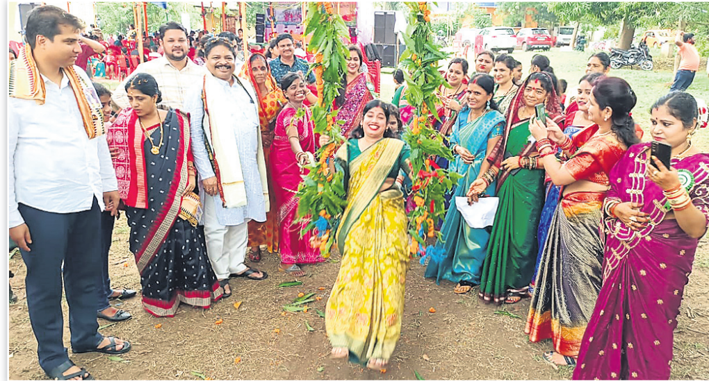
ଧଉଳି ଗୋପାଳୀଧପୁର ମେଳଣ ପଡ଼ିଆରେ ମା' ଦକ୍ଷିଣାଗଣ୍ଡା ମହିଳା ମହାସଂଘ ପକ୍ଷରୁ ଅନୁଷ୍ଠିତ ୭ମ ରଜ ଭସବରେ ଜଣେ ମହିଳା ଦୋଳି ଖେଳୁଛନ୍ତି।