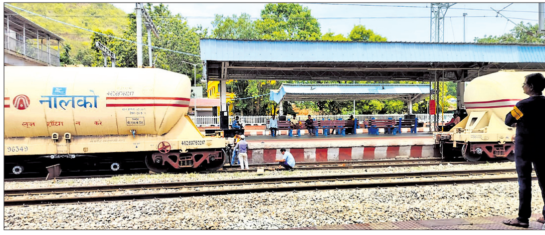
କେସିଙ୍ଗା ଷ୍ଟେଶନରେ ଆଲୁମିନିୟମ ବୋଝେଇ ଟ୍ରେନ୍ ବରିକ୍ ମୋକାନିକ ଦ୍ୱାରା ସଂଯୋଗ କରାଯାଇଛି।

କେସିଙ୍ଗା, ୧୪:୬(ରୁନେଶ୍ୱର ସାହୁ) ବାହାନଗା ପରେ ରାଜ୍ୟରେ ଗୋଟିଏ ପରେ ଗୋଟିଏ ଟ୍ରେନ୍ ଦୁର୍ଘଟଣା ରେକର୍ଡ଼ରେ ଉପରୋଧ କରୁଛି।