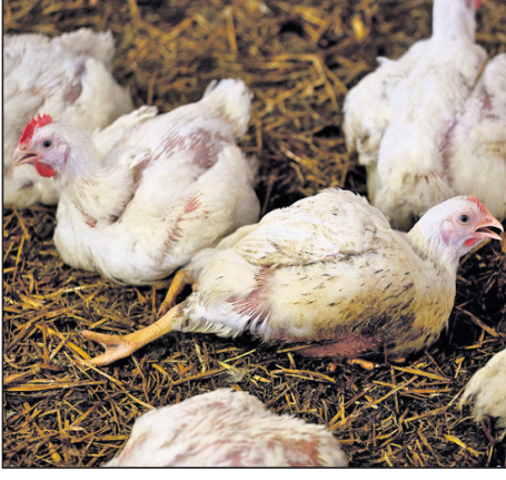
ଓଜନ ସମ୍ପାଦକ ପାଠୁନାହିଁ । ଏହାଦ୍ୱାରା ସେମାନେ ଛୋଟ ଛୋଟ ଯାତ୍ରାରେ ଗବେଷକମାନେ କରିଥିବା ଏକ ଅନୁଧ୍ୟାନରେ ବ୍ୟବହାରିକ ଉଦ୍ଦେଶ୍ୟରେ ପାଳନ କରାଯାଉଥିବା କୁକୁଡ଼ାକୁ ଭୂମିକା ଦେବାକୁ ଉଦ୍ଦେଶ୍ୟରେ ପାଳନ କରାଯାଉଥିବା କୁକୁଡ଼ାକୁ ଶାନ୍ତ ବଢ଼ାଯାଇଛି । ଫଳରେ କୁକୁଡ଼ାଗୁଡ଼ିକର ପୂର୍ଣ୍ଣ ବିକାଶିତ ହୋଇ ନ ଥିବା ଗୋଡ଼ାଘୋଡ଼ାମାନଙ୍କ

ସ୍ୱାଭାବିକତା ଦୃଷ୍ଟିରୁ ଉପରେ ବିଚାର କରିବା ଦରକାର । ଯନ୍ତ୍ରଣା ସହିତ ଆମ ନିଜସ୍ୱ କର୍ତ୍ତବ୍ୟ କିଭଳି ଏହିସବୁ ପ୍ରାଣୀମାନଙ୍କଠାରୁ ଆମେ ଏବଂ ଆମେ କିପରି ବିଭିନ୍ନ ପ୍ରକାରେ ପ୍ରାଣୀମାନଙ୍କୁ ଯନ୍ତ୍ରଣା କରିପାରୁ ? ତେବେ ଯନ୍ତ୍ରଣା ଦୂର କରିବା ଗୁରୁତ୍ୱପୂର୍ଣ୍ଣ ନା ଆଉ କିଛି ବିଷୟ ଯଥା ପ୍ରାଣୀମାନଙ୍କ ଓ ସେମାନଙ୍କୁ ଯନ୍ତ୍ରଣା ଦେବାର ଲୋକମାନଙ୍କ ଭବିଷ୍ୟତର ପସନ୍ଦକୁ ରୋକିବା ଦରକାର, ସେ ବିଷୟରେ ପ୍ରଶ୍ନ କରିବା ଆବଶ୍ୟକ । ଯଦି ଏହି ପସନ୍ଦକୁ ରୋକିବାରେ ଭୁଲ୍ ହୁଏ ତେବେ ମଣିଷ ଓ ଅନ୍ୟ ପ୍ରାଣୀମାନଙ୍କ ମଧ୍ୟରେ ଥିବା ପ୍ରଭେଦ ଅତ୍ୟଧିକ ହୋଇଯିବ । ଆମେରିକାର ଏକ ଥିଲ୍ ଟ୍ୟାକ୍ ରିପୋର୍ଟର ପ୍ରାୟୋଗିକ ଏହି ସବୁ ପ୍ରଶ୍ନ ଉପରେ ଅନୁଧ୍ୟାନ କରିଆସୁଛି । ପ୍ରାଣୀମାନଙ୍କ ଯନ୍ତ୍ରଣା ଯୁଗକୁ ମଣିଷଙ୍କ ଯନ୍ତ୍ରଣା ସହ କିଭଳି ଭୂମିକା କରିବା ଦରକାର ତାହାର ଆଲୋଚନା ପାଇଁ ଏକ ଆଧାର ଯୋଗାଇଦେବାକୁ ଗବେଷକମାନେ ପ୍ରାଣୀମାନଙ୍କୁ ଅନୁଭବ ଉପରେ କରାଯାଇଥିବା ଅନୁଧ୍ୟାନକୁ ସମାପ୍ତ କରିଥିଲେ । ଏହାକୁ ସରଳ କରିବାକୁ ସେମାନେ ସୁଖକୁ ଉଦାହରଣ କରୁଥିବା ଏବଂ ଯନ୍ତ୍ରଣା ଦୂର କରୁଥିବା ଉପଯୋଗୀ ଦୃଷ୍ଟିକୋଣ ଗ୍ରହଣ କରିଥିଲେ । ସେମାନେ କହୁଛନ୍ତି ଯେ, ପ୍ରାଣୀମାନଙ୍କୁ ଯନ୍ତ୍ରଣା ଉପରେ ଆମେ କମ୍ ଯନ୍ତ୍ରଣାକରି ହୋଇଥାଉ କାରଣ ତାହା ମଣିଷ ଚିତ୍ତକୁ ବୋଲି ଆମ ଚିନ୍ତାଧାରାରେ ରହିଥାଏ । ଗବେଷକମାନେ ଦର୍ଶାଇଥିଲେ ଯେ,