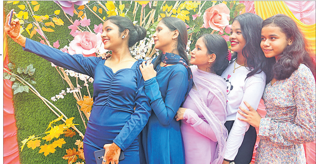
କଟକ ବଳଭଦ୍ରପୁର ଜୟମହାବୀର ପାରମ୍ପରିକ ପକ୍ଷରୁ ଆୟୋଜିତ ରଜ ମହୋତ୍ସବରେ ଯୁବତୀମାନେ ସେଇଠି ନେଉଛନ୍ତି।