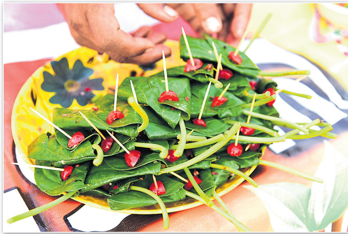
ଭୁବନେଶ୍ୱର ରବୀନ୍ଦ୍ର ମଣ୍ଡପାଠରେ ରାଜ୍ୟସ୍ତରୀୟ ରଜ ମହୋତ୍ସବ ପାଇଁ ଅବସରରେ ଖୋଲାଯାଇଥିବା ପାନ ପସରା।