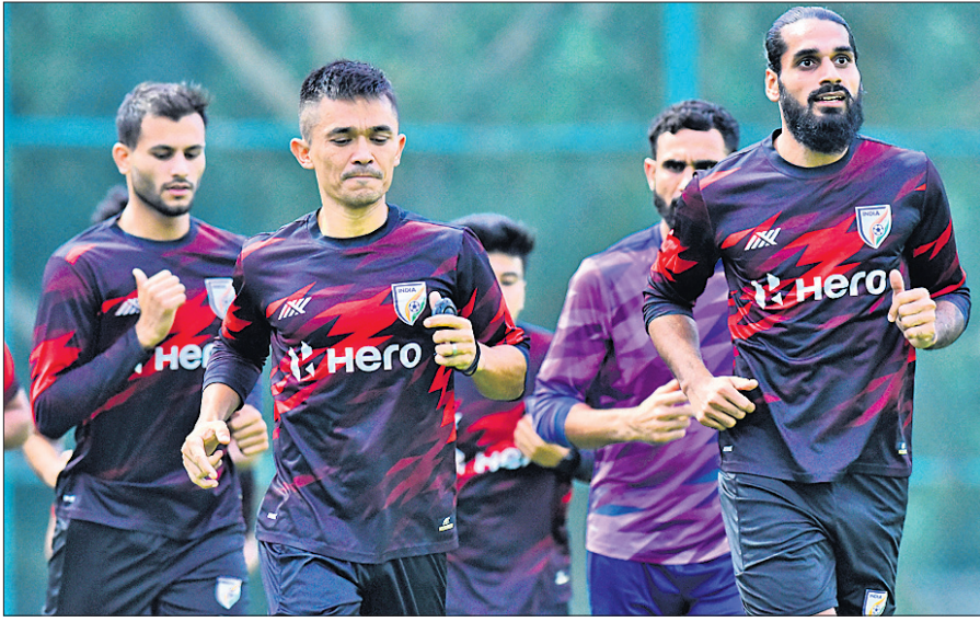
କଳିଙ୍ଗ ଷ୍ଟାଡ଼ିୟମରେ ଅଭାସ୍ୟ ଅବସରରେ ଭାରତୀୟ ଖେଳାଳି ।

କଳିଙ୍ଗ ଷ୍ଟାଡ଼ିୟମରେ ଚାଲିଥିବା ଚତୁର୍ଥାଞ୍ଚା ଲକ୍ଷ୍ୟକ୍ଷେତ୍ରରେ କପ୍ ଫୁଟବଲ ଟୁର୍ନାମେଣ୍ଟର ଶେଷ ଦୁଇଟି ଲିଗ୍‌ମ୍ୟାଚ ଗୁରୁବାର ଅନୁଷ୍ଠିତ ହେବ । ଅପରାହ୍ଣ ୪ଟା ୩୦ରେ ମଙ୍ଗୋଲିଆ ଓ ଭାରତୀୟ ଏବଂ ସନ୍ଧ୍ୟା ୭ଟା ୩୦ରେ ଭାରତ ଓ ଲେବାନନ ମଧ୍ୟରେ ମ୍ୟାଚ ଅନୁଷ୍ଠିତ ହେବ । ଟୁର୍ନାମେଣ୍ଟରେ ଅଂଶଗ୍ରହଣ କରିଥିବା ୪ ଦଳ ମଧ୍ୟରେ ଲେବାନନର ରକାଙ୍କିଙ୍ଗ୍ ସବୁଠୁ ଉପରେ । ତେବେ ଭାରତ ମଧ୍ୟ ବିଶେଷ ପଛରେ ନାହିଁ । ୯୯ ରକାଙ୍କିଙ୍ଗ୍ ଲେବାନନକୁ ଘରୋଇ ପରିବେଶରେ କଡ଼ା ବ୍ୟାଲେଜି ଦେବ ୧୦୧ତମ ସ୍ଥାନରେ ଥିବା ଭାରତ । ଚଳିତ ଟୁର୍ନାମେଣ୍ଟରେ ଭାରତ ଏପର୍ଯ୍ୟନ୍ତ ପ୍ରଭାବୀ ପ୍ରଦର୍ଶନ କରି ଆସିଛି । ନିଜର ପ୍ରଥମ ମ୍ୟାଚରେ ମଙ୍ଗୋଲିଆକୁ ୨-୦ରେ ହରାଇଥିବା ଘରୋଇ ଦଳ ଦ୍ୱିତୀୟ ମ୍ୟାଚରେ ଭାରତୀୟକୁ ୧-୦ ଗୋଲରେ ପରାସ୍ତ କରି ଫାଇନାଲରେ ପ୍ରବେଶ କରି