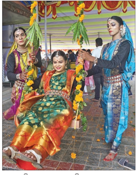
କଟକ ବିକାଶ ଭବନରେ ଅନୁଷ୍ଠିତ ରଜ ମହୋତ୍ସବରେ ଜଣେ ଯୁବତୀ ଦୋଳି ଖେଳୁଛନ୍ତି।