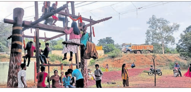
ଯୁବତୀମାନେ କାଠ ଦୋଳିର ମଜା ନେଉଛନ୍ତି।

ହୋଇଛି। ବିଶେଷ କରି ଯୁବତୀମାନେ ପିଠା ପକା ଖାଇ ବିଭିନ୍ନ ପ୍ରକାର ନୂଆ ବସ୍ତ୍ର ପିନ୍ଧି ଦୋଳି ଖେଳି ପ୍ରଥମ ଦିନ କଳାହଞ୍ଜିରି। ବିଭିନ୍ନ ପ୍ରକାର ରଜ ଦୋଳି ଗୀତ, ଭଜନ ଗୀତ ବାଦ୍ୟରେ ଭକ୍ତ ଅଞ୍ଚଳ ଉତ୍ସବପୁଞ୍ଜର ହୋଇ ଉଠିଛି। ଆଖପାଖ ଅଞ୍ଚଳର ଲୋକେ ବୁଲି ଦେଖିବାକୁ ଆସିଥିବା ବେଳେ ଏହା ତିନି ଦିନ ବ୍ୟାପୀ ଚାଲିବ ବୋଲି ଆୟୋଜକଙ୍କ ଠାରୁ ପ୍ରକାଶ। ସେହିପରି କେନ୍ଦ୍ରରେ ଜିଲ୍ଲାର ବିଭିନ୍ନ ଅଞ୍ଚଳରେ ପହଲି ରଜ ଯୁମ୍ପାମାନେ ପାଳିତ ହୋଇଯାଇଛି।