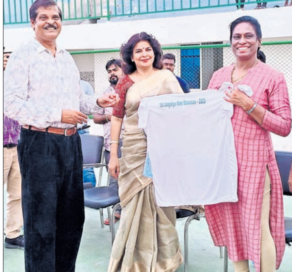
ପି.ଟି. ଉଷାଙ୍କୁ ଉପହାର ସ୍ୱରୂପ କର୍ତ୍ତୃ ପ୍ରଦାନ କରାଯାଇଛି ।