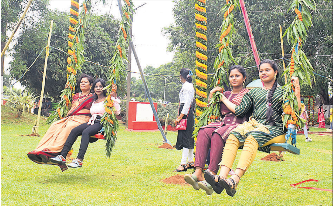
ଭୁବନେଶ୍ୱର ରାଜ୍ୟ ସଂଗ୍ରହାଳୟରେ ବୁଧବାର ଆୟୋଜିତ ରଜ ଭସବରେ ଯୁବତୀମାନେ ବୋଲି ଖେଳୁଛନ୍ତି ।

ମିଳିଥିଲା । ପଟ୍ଟାମୁଣ୍ଡାଲ ଦମକଳ ବାହିନୀଙ୍କ ପାଖରେ ପାଖର ବୋଟ ନ ଥିଲା । ଆଜି ଦମକଳ ବାହିନୀ ଆସି ଘଟଣାସ୍ଥଳରେ ପହଞ୍ଚିବା ପୂର୍ବରୁ ଗ୍ରାମବାସୀ ଆଶୁତୋଷଙ୍କ ମୃତଦେହକୁ କୁଳକୁ ଆଣିସାରିଥିଲେ । ଏହି ଘଟଣା ପରେ ସେଠାରେ ଭଉଜନା ପ୍ରକାଶ ପାଇଥିଲା । ଭୁବନେଶ୍ୱର କୁମ୍ଭୀରକୁ ଧରିବା ପାଇଁ ସାଧାରଣରେ ଦାବି କରାଯିବା ସହିତ ସମସ୍ତ ଭୁଠରେ ବାରିକେନ୍ଦ୍ର କରିବା ପାଇଁ କୋର୍ଟ ଦିଆଯାଇଥିଲା । ସ୍ଥାନୀୟ ଲୋକେ ପଟ୍ଟାମୁଣ୍ଡା-ରାଜନଗର ଉପର ରାସ୍ତାକୁ ଅବରୋଧ କରିଥିଲେ । ଖବର ପାଇ ପଟ୍ଟାମୁଣ୍ଡାଲ ତହସିଲଦାର