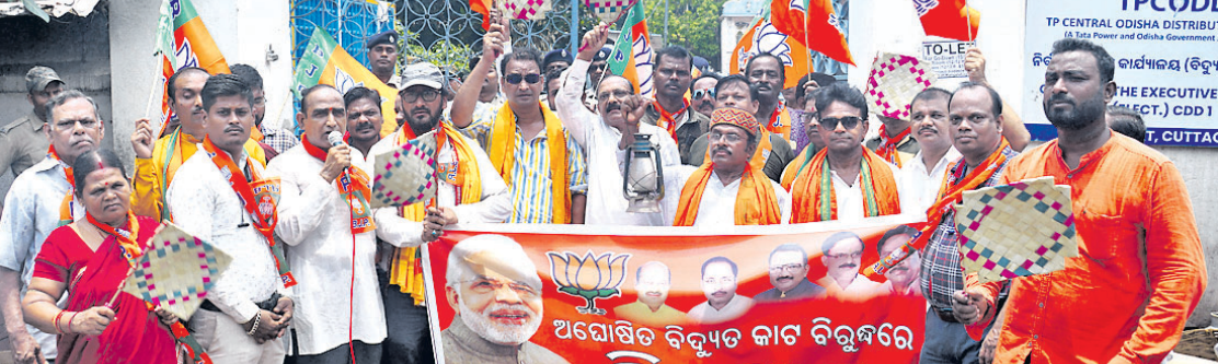
ବିଦ୍ୟୁତ୍ କାଟ ପ୍ରତିବାଦରେ ରୁଧିବାର କଟକ ଚିପିପିଡିଏଲ୍ କାର୍ଯ୍ୟାଳୟ ସମ୍ମୁଖରେ ଭାଜପା ପକ୍ଷରୁ ଦିଆଯାଇଥିବା ଧାରଣା ।