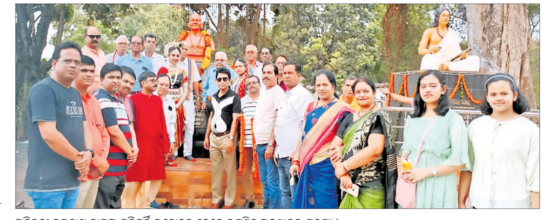
ଅତିବଡ଼ୀ ଜଗନ୍ନାଥ ଦାସଙ୍କ ପ୍ରତିମୂର୍ତ୍ତି ଉନ୍ମୋଚନ ବେଳେ ଉପସ୍ଥିତ ଅନୁଷ୍ଠାନର ସଦସ୍ୟ।