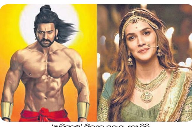
'ଆଦିପୁରୁଷ' ଫିଲ୍ମରେ ପ୍ରଭାସ ଏବଂ କ୍ରିତି

ରାମାୟଣ କଥାବସ୍ତୁକୁ ଆଧାର କରି ନିର୍ମିତ ହୋଇଛି 'ଆଦିପୁରୁଷ' । ଉତ୍ତମ ସିନେମା ଏବଂ ତେଲୁଗୁ ଭାଷାରେ ଏହାକୁ ପ୍ରସ୍ତୁତ କରାଯାଇଛି । ଖାସ୍ କଥା ହେଲା ଫିଲ୍ମଟି ଆସନ୍ତାକାଲି ଅର୍ଥାତ୍ ୧୬ ତାରିଖରେ ପୁଲିଲାଭ କରିବାକୁ ଯାଉଛି । ଏହାର ପ୍ରାରମ୍ଭିକ କାମ ଆରମ୍ଭ ବେଳଠାରୁ ଏହାକୁ ନେଇ ଚର୍ଚ୍ଚା ଲାଗି ରହିଛି । କେତେକ ସିନେ ସମୀକ୍ଷକ ଆକଳନ କରିଛନ୍ତି ଯେ, ଚଳିତ ବର୍ଷ ଏହା ସବୁଠାରୁ ଅଧିକ ଆୟକାରୀ ଫିଲ୍ମ ଭାବରେ ପରିଗଣିତ ହେବ । ଏଥିରେ ରାମ ଭୂମିକାରେ ସାଉଥ୍ ଷ୍ଟାର ପ୍ରଭାସ, ରାବଣ ଚରିତ୍ରରେ ସୈଫ୍ ଅଲୀ ଖାଁ ଏବଂ ସୀତା ରୋଲରେ କ୍ରିତି ସାନନ୍ ଅଭିନୟ କରିଛନ୍ତି । ଫିଲ୍ମଟିର କାହାଣୀ ଉତ୍ତମ ସହ ନିର୍ଦ୍ଦେଶନାଭାର ବୁଝାଇଛନ୍ତି ଓମ୍ ରାଓଡ଼ । ପ୍ରଯୋଜନା କରିଛନ୍ତି ଟି-ସିରିଜ୍ ଏବଂ ରେଡ଼ିଓଗ୍ଲୋବ୍ । ଅତ୍ୟାଧୁନିକ ଟେକ୍ନୋଲୋଜିରେ ଏହାର ଶୁଟିଂ କରାଯାଇଛି । ଫିଲ୍ମଟିର ବଜେଟ୍ ରହିଛି ୬୦୦ କୋଟି । ୧୯୯୨ରେ ରିଲିଜ୍ ହୋଇଥିବା କାପାଳୀ ଫିଲ୍ମ 'ରାମାୟଣ' : ୧ ଲିଜେଣ୍ଡ ଅଫ୍ ପ୍ରିୟ ରାମ'କୁ ଦେଖିବା ପରେ 'ଆଦିପୁରୁଷ' ନିର୍ମାଣ କରିବାକୁ ମନ ବଳାଇଥିଲେ ଓମ୍ । ଫିଲ୍ମଟିର ଟିକର ରିଲିଜ୍ ହେବା ପରେ ତାହା ଏତେ ଲୋକପ୍ରିୟ ହେଲା ଯେ ପୂର୍ବ ବଜେଟ୍ ୪୦୦ କୋଟିକୁ ଟପି ଏହା ୬୦୦ କୋଟିରେ ପହଞ୍ଚି ଯାଇଥିଲା । ଏ ନେଇ ଓମ୍ କୁହନ୍ତି, 'ଏଥିରେ ରାମ-ସୀତା-ରାବଣ ଚରିତ୍ର ନାମକୁ ବଦଳାଇ 'ରାହସ୍ୟ-ଜାନକୀ-ଲକ୍ଷ୍ମଣ' ରଖାଯାଇଛି । ଆଦିପୁରୁଷ ଅର୍ଥ ହେଲା ପ୍ରଥମ ପୁରୁଷ । କିନ୍ତୁ ଏହି ଟାଇଟଲର ଅର୍ଥ ହେଉଛି ବେଷ୍ଟ ମ୍ୟାନ୍ ବା ଶ୍ରେଷ୍ଠ ପୁରୁଷ । ସୀତା ଭୂମିକା ପାଇଁ କ୍ରିତିଙ୍କୁ ସାଇନ କରିବା ପୂର୍ବରୁ ଆଉ କେତେଜଣ ଅଭିନେତ୍ରୀ-ଅନୁଷ୍ଠା ସେଜି, ଅନୁଷ୍ଠା ଶର୍ମା, କିଆରୀ ଆୟୁଜୀ ଏବଂ କାରି ସୁରେଶଙ୍କ ନାମ ବିଚାରକୁ ନିଆଯାଇଥିଲା ।' ଏହି ଫିଲ୍ମରେ ଅଭିନୟ କରିବା ଲାଗି ପ୍ରଭାସ ପାରିଶ୍ରମିକ ଆକାରରେ ୧୫୦ କୋଟି ନେଇଛନ୍ତି ।