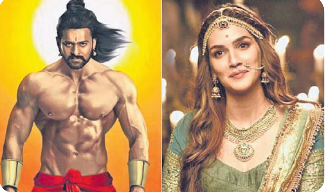
'ଆଦିପୁରୁଷ' ଫିଲ୍ମରେ ପ୍ରଭାସ ଏବଂ କ୍ରିତି

ରାମାୟଣ କଥାବସ୍ତୁକୁ ଆଧାର କରି ନିର୍ମିତ ହୋଇଛି 'ଆଦିପୁରୁଷ' । ଉତ୍ତମ ହିନ୍ଦୀ ଏବଂ ତେଲୁଗୁ ଭାଷାରେ ଏହାକୁ ପ୍ରସ୍ତୁତ କରାଯାଇଛି । ଖାସ୍ କଥା ହେଲା ଫିଲ୍ମଟି ଆସନ୍ତାକାଲି ଅର୍ଥାତ୍ ୧୬ ତାରିଖରେ ପୁଲିଲାଭ କରିବାକୁ ଯାଉଛି । ଏହାର ପ୍ରାରମ୍ଭିକ କାମ ଆରମ୍ଭ ବେଳଠାରୁ ଏହାକୁ ନେଇ ଚର୍ଚ୍ଚା ଲାଗି ରହିଛି । କେତେକ ସିନେ ସମୀକ୍ଷକ ଆକଳନ କରିଛନ୍ତି ଯେ, ଚଳିତ ବର୍ଷ ଏହା ବକ୍ସଠାରୁ ଅଧିକ ଆୟକାରୀ ଫିଲ୍ମ ଭାବରେ ପରିଗଣିତ ହେବ । ଏଥିରେ ରାମ ଭୂମିକାରେ ସାଉଥ୍ ଥିରୁ ପ୍ରଭାସ, ରାବଣ ଚରିତ୍ରରେ ସୈଫ୍ ଅଲୀ ଖାଁ ଏବଂ ସୀତା ରୋଲରେ କ୍ରିତି ସାନନ୍ ଅଭିନୟ କରିଛନ୍ତି । ଫିଲ୍ମଟିର କାହାଣୀ ଉତ୍ତମ ସହ ନିର୍ଦ୍ଦେଶନାଭାର ବୁଝାଇଛନ୍ତି ଓମ୍ ରାଓ । ପ୍ରଯୋଜନା କରିଛନ୍ତି ଟି-ଭିଭିଏ ଏବଂ ରେଡ୍‌ସ୍ଟାର୍ ଫିଲ୍ମସ୍ । ଅତ୍ୟାଧୁନିକ ଟେକ୍ନୋଲୋଜିରେ ଏହାର ଶୁଟିଂ କରାଯାଇଛି । ଫିଲ୍ମଟିର ବଜେଟ୍ ରହିଛି ୨୦୦ କୋଟି । ୧୯୯୨ରେ ରିଲିଜ୍ ହୋଇଥିବା କାପାଳୀ ଫିଲ୍ମ 'ରାମାୟଣ' :