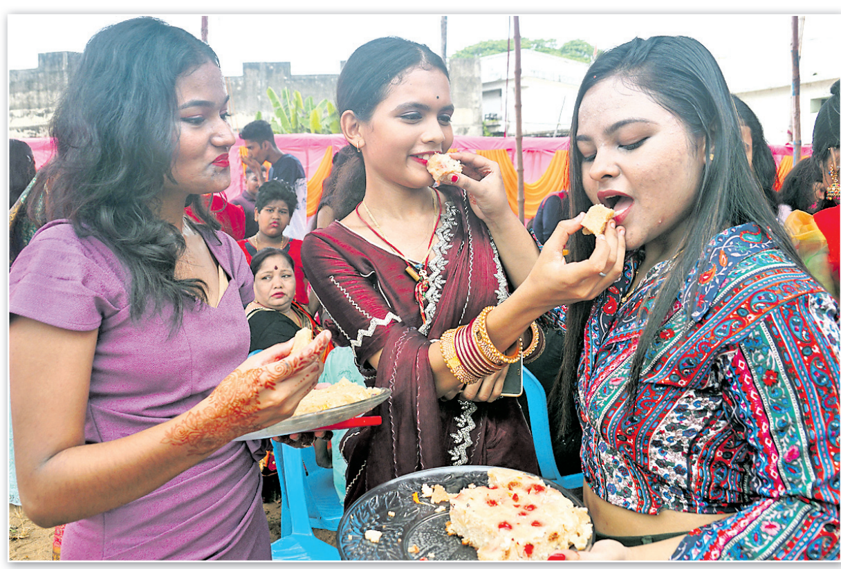
ଭୁବନେଶ୍ୱର ରବୀନ୍ଦ୍ର ମଣ୍ଡପଠାରେ ରାଜ୍ୟସ୍ତରୀୟ ରଜ ମହୋତ୍ସବ ପାଳନ ଅବସରରେ ଖୋଲାଯାଇଥିବା ପାନ ପସରା ।