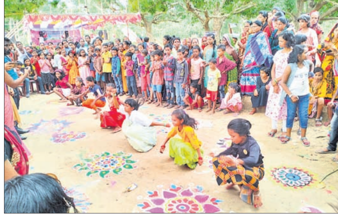
ରଜ ମହୋତ୍ସବ ଉପଲକ୍ଷେ ଅନୁଷ୍ଠିତ ପ୍ରତିଯୋଗିତାରେ ଝିଅମାନେ ପୂତି ଖେଳିଛନ୍ତି।