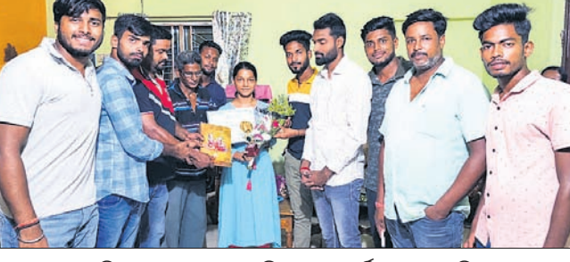
ଜିଲ୍ଲା ଚମ୍ପର ଗାୟତ୍ରୀ ପାଣିଗ୍ରାହୀଙ୍କୁ ସମର୍ଥନ କରାଯାଇଛି।