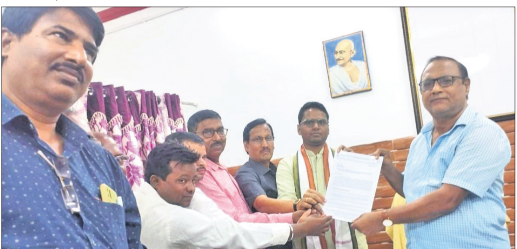
ସିଡିଏମ୍‌ଙ୍କୁ କଂଗ୍ରେସ ନେତାମାନେ ଦାବିପତ୍ର ପ୍ରଦାନ କରୁଛନ୍ତି।

ତେଣୁ ଅତି କମରେ ଏବେ ୬ଜଣ ନର୍ସଙ୍କୁ ନିଯୁକ୍ତି ଦିଆଯାଉ। ବଡ଼ କଥା ହେଲା ଅଧିକାଂଶ ସମୟ ପାଖାନ୍ତ କମ୍ ହେଉଛି। ଏଥିପାଇଁ ଚିକିତ୍ସାରେ ବାଧା ସୃଷ୍ଟି ହେବା ସହ ଅସହ୍ୟ ଗ୍ରାସ୍ତ୍ର ଯୋଗୁ ରୋଗୀ ଓ ସେମାନଙ୍କ ସମ୍ପର୍କୀୟମାନେ ଆରତ୍ୟୁପାତରୁ ହୋଇଯାଉଛନ୍ତି। ସ୍ୱାସ୍ଥ୍ୟକେନ୍ଦ୍ର ପକ୍ଷରୁ ଅତ୍ୟନ୍ତ କେନ୍ଦରରେ ସୁଧିଧା କରାଯାଉ। ରଞ୍ଜନାଥପୁର ଗୋଷ୍ଠୀ ସ୍ୱାସ୍ଥ୍ୟକେନ୍ଦ୍ର କଥା ଦେଖିଲେ ଜଣାଯାଏ ସେଠାରେ ମଧ୍ୟ ସ୍ତ୍ରୀ ଓ ପ୍ରସୂତି, ଭେଷଜ ଓ ଶାଳ୍ୟ ବିଭାଗରେ ବିଶେଷଜ୍ଞ ଡାକ୍ତରଙ୍କ ପଦବୀ ଅଭାବ ରହିଛି।