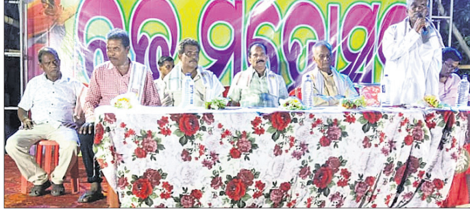
ରଜ ମହୋତ୍ସବରେ ଉପସ୍ଥିତ ଅତିଥିମାନେ।