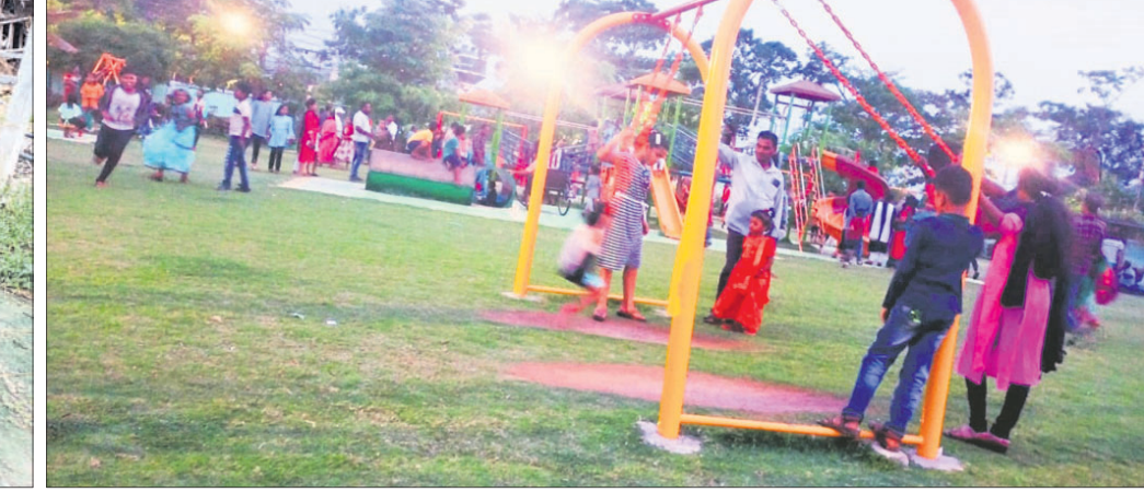
ନୟାଗଡ଼ ପୁରୁଣା ସହର କରନାଥଙ୍କ ରଥ ନିର୍ମାଣ ପାଇଁ ଗତବର୍ଷ ଭକ୍ତମାନେ ଦାନ କରିଥିବା କାଠ ଖତ ଖାଇଛି । ନୂଆଗାଁ ବୁକ ମାଇକେଜି ପଞ୍ଚାୟତ କାରୁଆ ଗାଁରେ ଅସ୍ପାତ୍ସ୍ୟକର ପରିବେଶରେ ଥିବା ଏକ ନଳକୂପ । ବୁଧବାର ପହିଲି ରଜ ପାଇଁ ଓଡ଼ିଶା ରାମସାଗର ପାର୍କରେ ପିଲାମାନଙ୍କ ଭିଡ଼ ।