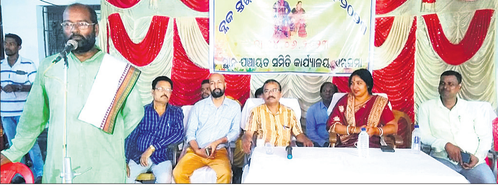
ଏରସମାରେ ଲୋକକଳା ଦିବସ ପାଳନ ଉତ୍ସବରେ ମହାଧିକାରୀ ଅତିଥି।