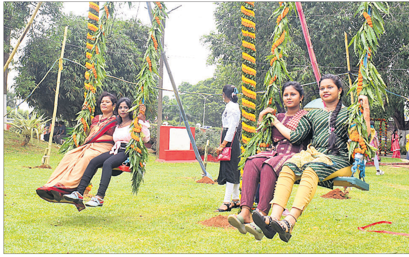
ଭୁବନେଶ୍ୱର ରାଜ୍ୟ ସଂଗ୍ରହାଳୟରେ ବୁଧବାର ଆୟୋଜିତ ରଜ ଭସବରେ ସୁବର୍ଣ୍ଣମାଳାରେ ବୋଲି ଖେଳୁଛନ୍ତି ।

ମିଳିଥିଲା । ପଟ୍ଟାମୁଣ୍ଡାଲ ଦମକଳ ବାହିନୀଙ୍କ ପାଖରେ ପାଖର ବୋଟ ନ ଥିଲା । ଆଜି ଦମକଳ ବାହିନୀ ଆସି ଘଟଣାସ୍ଥଳରେ ପହଞ୍ଚିବା ପୂର୍ବରୁ ଗ୍ରାମବାସୀ ଆଶୁତୋଷଙ୍କ ମୃତଦେହକୁ କୁଳକୁ ଆଣିସାରିଥିଲେ । ଏହି ଘଟଣା ପରେ ସେଠାରେ ଭଉଡ଼େନା ପ୍ରକାଶ ପାଇଥିଲା । ଭୁବନେଶ୍ୱରକୁ ଧରିବା ପାଇଁ ସାଧାରଣରେ ଦାବି କରାଯିବା ସହିତ ସମସ୍ତ ଭୁବନେଶ୍ୱର ବାରିକେଡ୍ କରିବା ପାଇଁ କୋର୍ଟ ଦିଆଯାଇଥିଲା । ସ୍ଥାନୀୟ ଲୋକେ ପଟ୍ଟାମୁଣ୍ଡା-ରାଜନଗର ଉପର ରାସ୍ତାକୁ ଅବରୋଧ କରିଥିଲେ । ଖବର ପାଇ ପଟ୍ଟାମୁଣ୍ଡାଲ ତହସିଲଦାର ୯୨୫-୨