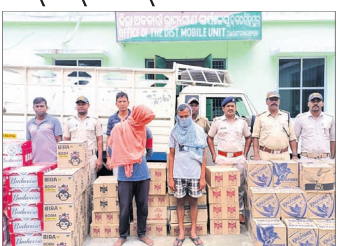
ମଦ ପେଟି ସହ ଗିରଫ ୨ ଅଭିଯୁକ୍ତ।