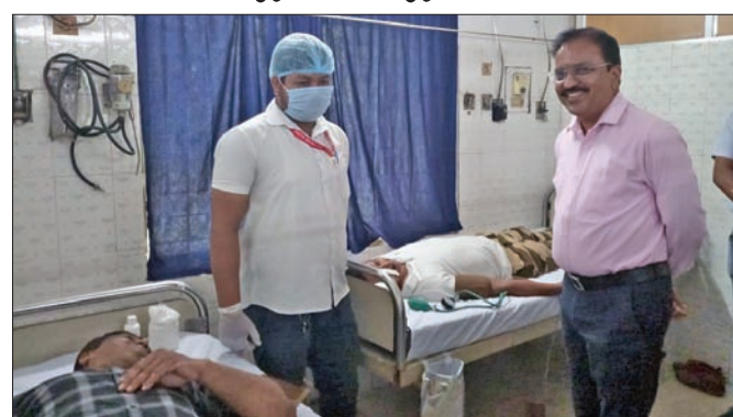
ପାରାଦୀପ, ୧୫୪୬ (ଶରତ ରାଉତ)

ପାରାଦୀପ ବନ୍ଦର ପ୍ରାଧିକରଣ (ପିପିଏ) ଚିକିତ୍ସାଳୟରେ ବୁଧବାର ବିଷ ରକ୍ତଦାନ ଦିବସ କାର୍ଯ୍ୟକ୍ରମ ଅନୁଷ୍ଠିତ ହୋଇଥିଲା। ଏହି ଅବସରରେ ସ୍ୱେଚ୍ଛାସେବୀ ସଙ୍ଗଠନ ଆହ୍ୱାନ କଲ୍ୟାଣସହ ସହଭାଗିତାରେ ରକ୍ତଦାନ କରିବେ ଆୟୋଜନ କରାଯାଇଥିଲା। ଏଥିରେ ୮୧ ଯୁନିଟ୍ ରକ୍ତ ସଂଗ୍ରହ କରାଯାଇ ରାଜ୍ୟ ରକ୍ତ ଭଣ୍ଡାରକୁ ଦିଆଯାଇଛି। ବିଶେଷକରି ବାହାନଗା ରେଳ ଦୁର୍ଘଟଣା ଆହତମାନଙ୍କ ଚିକିତ୍ସାରେ ସହାୟତା ହେବ