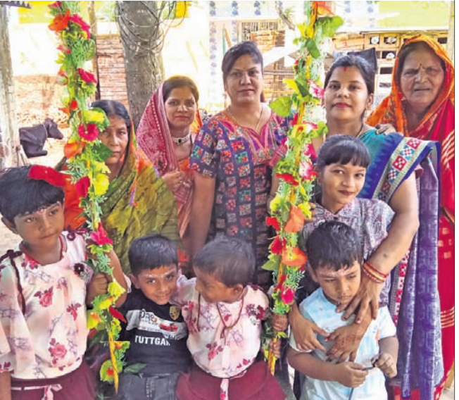
ପିଲାମାନେ ରଜ ବୋଲି ଖେଳୁଛନ୍ତି।