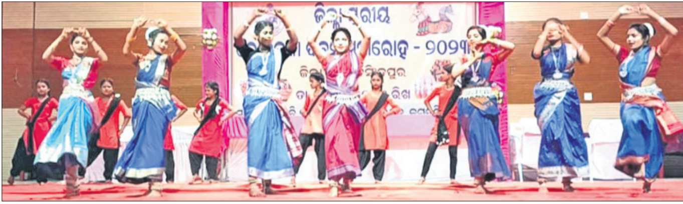
ଅନୁଷ୍ଠିତ ସଂସ୍କୃତିକ କାର୍ଯ୍ୟକ୍ରମରେ କଳାକାରଙ୍କ ଦ୍ୱାରା ନୃତ୍ୟ ପରିବେଷଣ।