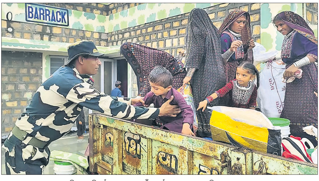
ସାମୁଦ୍ରିକ ଝଡ଼ ବିପର୍ଯ୍ୟୟ ଘଟଣାରେ ଛୁଇଁବା ପୂର୍ବରୁ ଗୁଜରାଟର କଲ୍ଲି ଗୁମାସ୍ତା ଗ୍ରାମରେ ଭଙ୍ଗାର କାର୍ଯ୍ୟରେ ନିଯୋଜିତ ଜଣେ ବିପଦ ସମ୍ଭାବନା ଗ୍ରାହକରୁ ଶିଶୁକୁ ଓହ୍ଲାଇଛନ୍ତି

ଭାରତୀୟ ପାଣିପାଗ ବିଭାଗ (ଆଇଏମ୍‌ଡି)ର ପୂର୍ବଦୂତ ଅନୁସାରେ ଭାରତୀୟ ପାଣିପାଗ ବିଭାଗ