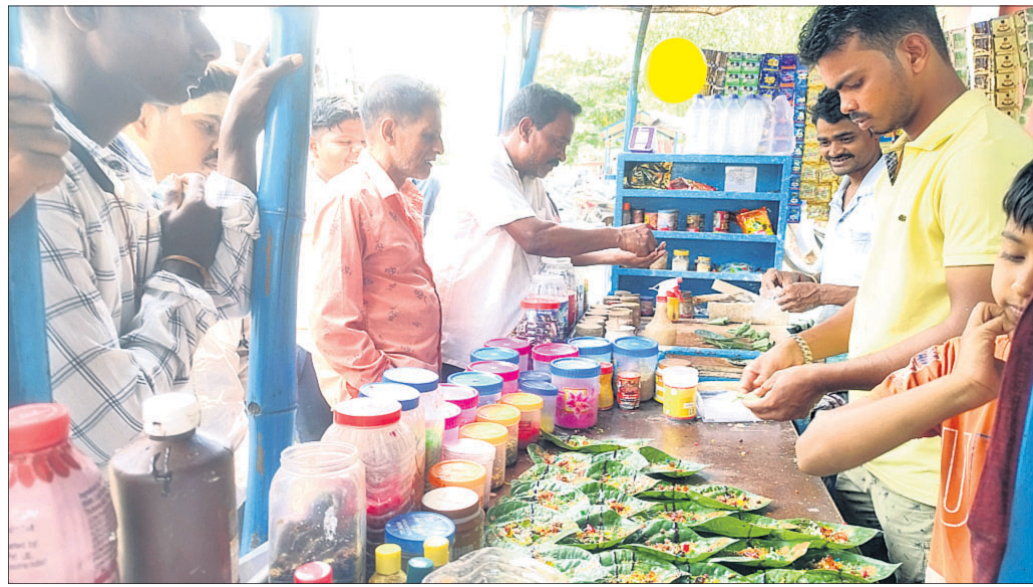
ରଜ ପାଇଁ ମିଠା ପାନ ଦୋକାନରେ ଲୋକଙ୍କ ଗହକ ।

ରଜ ପାନର ସ୍ୱଚନ୍ଦ୍ରତା ରଜପର୍ବ ଅବସରରେ ଅନାରକଳା, ଚୁଡ଼ି, ଅଗ୍ନି, ଅଗ୍ନିକୋଳା, କୋନ, ସିଙ୍ଗାପୁରୀ, ରୋଲ, ଧୂଆଁପାନ, ଲଢୁ, ରୁଟି କୋଳା, ବନାରସା ପାନ ପରି ଭିନ୍ନ ଭିନ୍ନ ପାନ ନୟାଗଡ଼ ବଜାରରେ ମିଳୁଛି । ଗ୍ରାହକଙ୍କ ରୁଚି ଅନୁସାରେ ବ୍ୟବସାୟୀ ପାନ ଭାଳି ଦେଉଛନ୍ତି । ପୋଡ଼ପିଠା ଚାହିଦା ପରି ପାନର ଚାହିଦା ଏଠାରେ ରହୁଛି ।