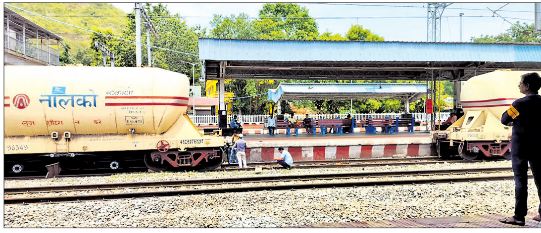
କେସିଙ୍ଗା ଷ୍ଟେଶନରେ ଆଲୁମିନିୟମ ବୋଝେଇ ଟ୍ରେନ୍ ବରିକୁ ମୋକାନିକ ଦ୍ୱାରା ସଂଯୋଗ କରାଯାଇଛି।