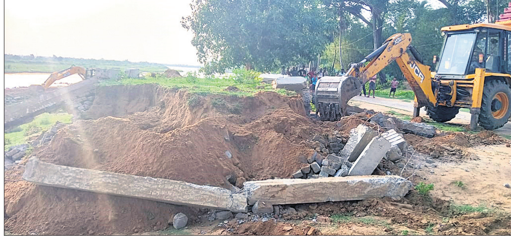
ମେଶିନ ସାହାଯ୍ୟରେ ଜବରଦଖଲ ଉଚ୍ଛେଦ କାଲିଛି।

କେନ୍ଦ୍ରାପଡ଼ା, ୧୫୧୬ (କରନାଥ ଧଳ) ପଟ୍ଟାମୁଣ୍ଡାଲ ରଜ ପର୍ବର ଶ୍ରୀରାମପୁର ଗ୍ରାମର ମା' ସିଦ୍ଧା ରାମଚଣ୍ଡୀ ପଡ଼ିଆରେ ସରକାରୀ ଜମା ଜବରଦଖଲ କରାଯାଇ ଗୁହ ନିର୍ମୂଳ ହୋଇଥିଲା। ଏ ସମ୍ପର୍କରେ ଅଭିଯୋଗ ହେବା ପରେ ଜବରଦଖଲ ହଟାଇବା ପାଇଁ ଗୁଣାୟ ପ୍ରଶାସନ ପକ୍ଷରୁ ଉଦ୍ୟମ ଆରମ୍ଭ କରାଯାଇଥିଲା।