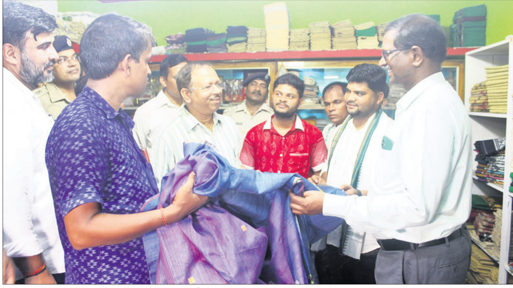
ପୁଖ୍ୟ ଶାସନ ସଚିବ ପ୍ରଦୀପ ଜେନା ଯୋଗାଯୋଗ ପୁର ଗାଁରେ ଏସପିଏସ୍ ବସ୍ତ୍ର ସମ୍ପର୍କରେ ବୁଣାକାରଙ୍କ ସହ ଆଲୋଚନା କରୁଛନ୍ତି।

କାରିଗରଙ୍କ ଦକ୍ଷତା ବୃଦ୍ଧି ପାଇବ ରଘୁଲୀପୁର, ୧୪୬(ଉତ୍ତର ରାଉତ):