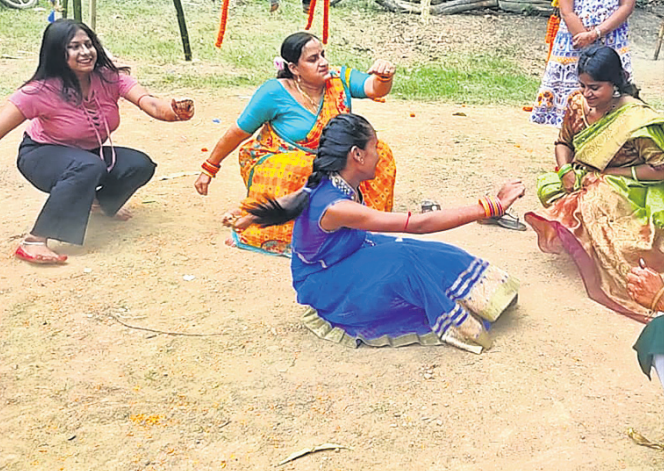
ମୁଚଟା ଓ ବାଜିକାମାନେ ପୁଟି ଖେଳୁଛନ୍ତି ।