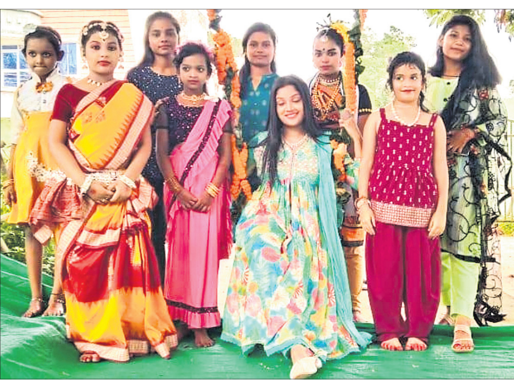
ନୟାଗଡ଼ ଜିଲ୍ଲା ରଣପୁର ମା'ମଣିନାଗଙ୍କ ପୀଠରେ ଆୟୋଜିତ ରଜ ଉତ୍ସବରେ ଝିଅମାନେ ବୋଲି ଖେଳୁଛନ୍ତି ।