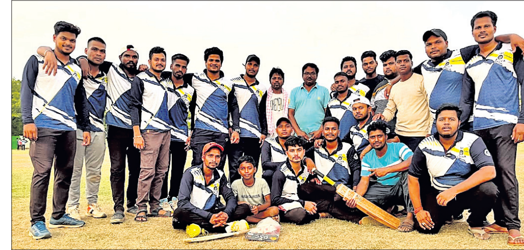
ଅତିଥିକ୍ଷେତ୍ରରେ ଉତ୍ତମ ଦଳର ଖେଳାଳି ।

ଆବାସ ଯୋଜନା ମାଧ୍ୟମରେ କଜାଘରେ ରହିଥିବା ପରିବାରକୁ ପଛାଯାଉଛି ଯୋଗାଇ ଦେବା ପାଇଁ ସରକାର ନିଷ୍ପତ୍ତି ନେଇ ପ୍ରକୃତ ହିତାଧିକାରୀଙ୍କୁ ଅନୁଦାନ ଯୋଗାଇ ଦେଉଛନ୍ତି । ହେଲେ ମୁଖ୍ୟ ଗୁଣାୟକ ଭଳି ଘରଟିଏ ନ ଥିଲେ ମଧ୍ୟ ସରକାରଙ୍କ ଆବାସ ଯୋଜନାରୁ ବାଦ୍ ପଡ଼ିଛନ୍ତି ଗରିବ ଲୋକ । ଏପରି ଅଭିଯୋଗ ଆସି ନୟାଗଡ଼ ଜିଲା ନୂଆଗାଁ ବୁକ୍ ବଡ଼ଗୋଟି ପଞ୍ଚାୟତ ଡିପାର୍ଟମେଣ୍ଟର ଗ୍ରାମରୁ ।