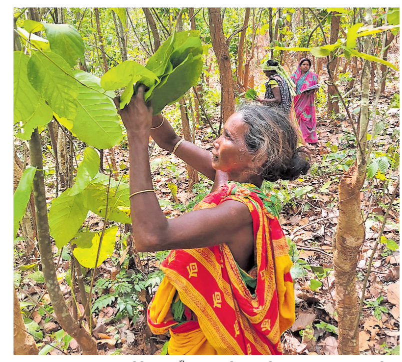
ବଗପଲାର ଏକ କଳାକାର, ଦୁର୍ଦ୍ଦିନୀକୁ ଗାଁର ଜଣେ ଆଦିବାସୀ ମହିଳା ଶାଳ ପତ୍ର ସଂଗ୍ରହ କରୁଛନ୍ତି ।