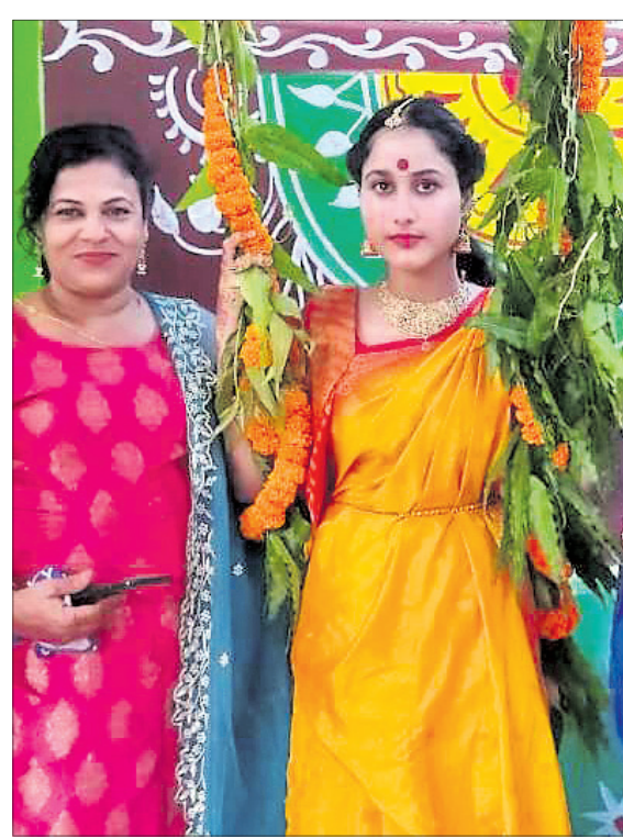
କଟକ ରାମଗଡ଼ ଅଙ୍ଗନଓଡ଼ି କେନ୍ଦ୍ରରେ ଅନୁଷ୍ଠିତ ରଜ ଉତ୍ସବ ।