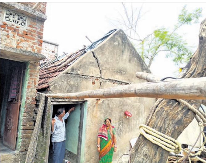
ନବୀନଙ୍କ ଭଙ୍ଗା ଗାଈର ଘର ।