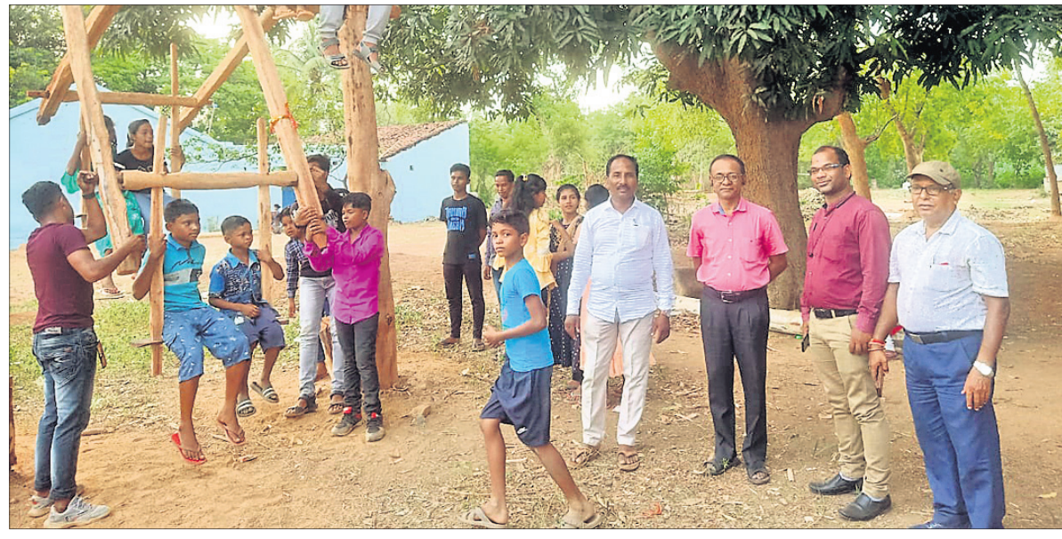
କେନ୍ଦୁଝର ଜିଲ୍ଲା ପାଟଣାଠାରେ ପିଲାମାନେ ପାରମ୍ପରିକ ଖାଲ ବୋଲି ଖେଳୁଛନ୍ତି।