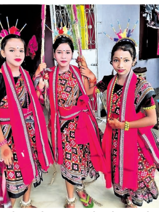
ନୟାଗଡ଼ ଜିଲା ଇଟାମାଟିରେ ୩ ଘାଟ ରକବୋଲିରେ ସୁଲି ମକା ନେଉଛନ୍ତି ।