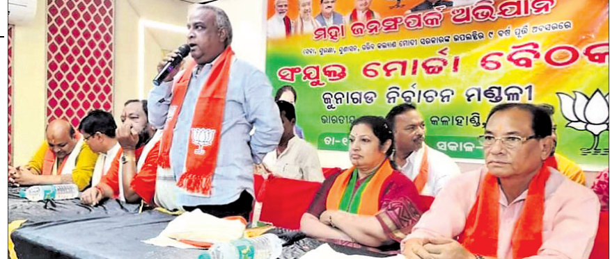
ଜୁନାଗଡ଼ରେ ଅନୁଷ୍ଠିତ ଭାଜପାର ସଂଯୁକ୍ତ ମୋର୍ଚ୍ଚା ବୈଠକରେ ଦଳୀୟ ନେତୃତ୍ୱ।

ଭବାନୀପାଟଣା, ୧୫ଜୁ (ଉତ୍ତମ କୁମାର ଦାଶ) କଳାହାଣ୍ଡିଜିଲ୍ଲାର ଜୁନାଗଡ଼, ଧର୍ମଗଡ଼ ଓ ନର୍ଲା ୩ଟି ନିର୍ବାଚନ ମଣ୍ଡଳୀରେ ପୁରୁବାର ଭାଜପାର ସଂଯୁକ୍ତ ବୈଠକ ଅନୁଷ୍ଠିତ ହୋଇଯାଇଛି।