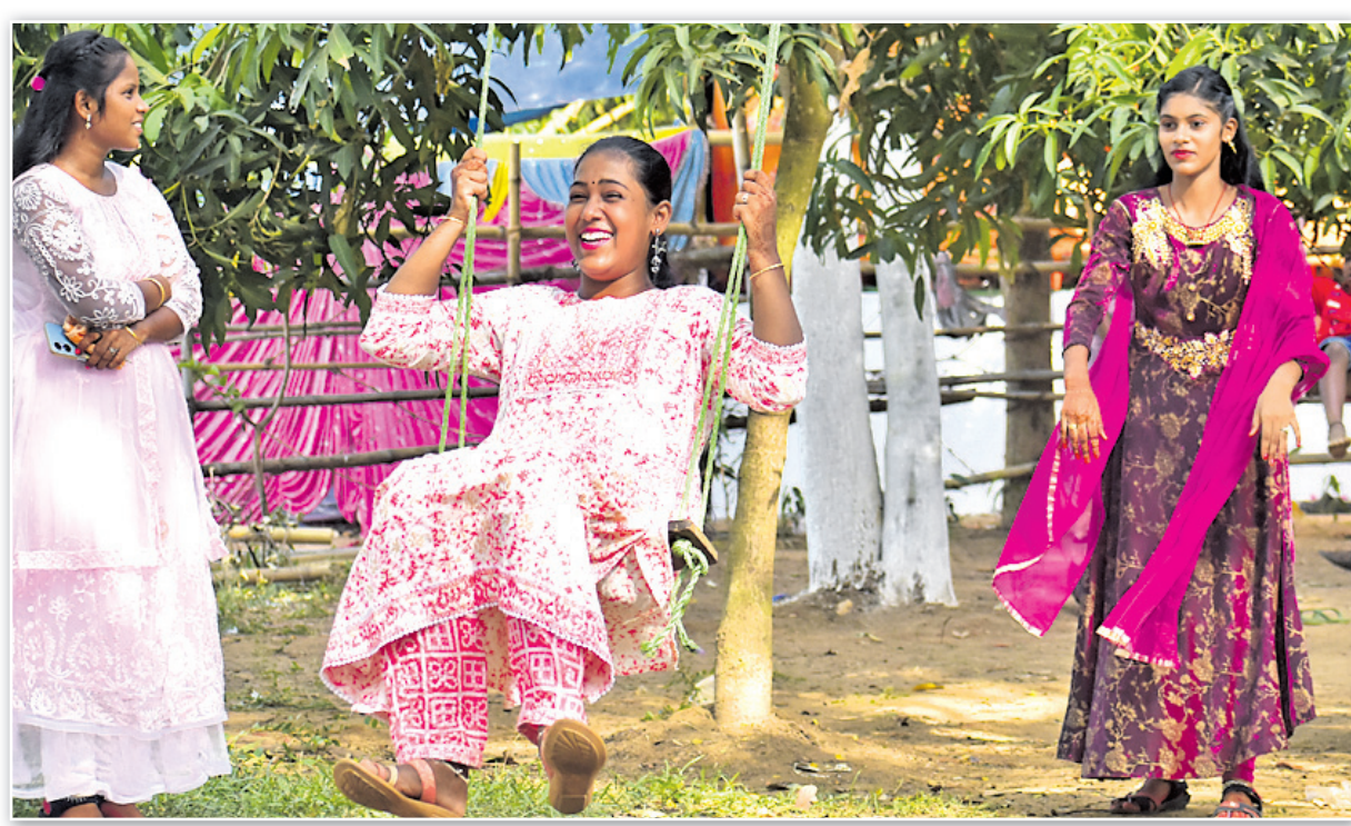
ଭୁବନେଶ୍ୱର ଉପକଣ୍ଠ କଲ୍ୟାଣପୁର ଗ୍ରାମ ରଜ ଉତ୍ସବରେ ଯୁବତୀମାନେ ରଜ ବୋଲି ଖେଳୁଛନ୍ତି।