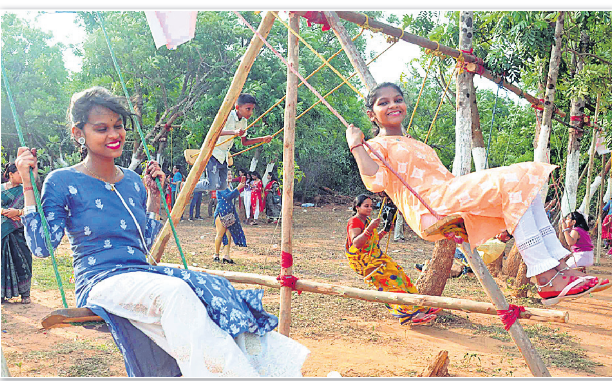
ଭୁବନେଶ୍ୱର ପାପୁପଡ଼ା ରଜ ମହୋତ୍ସବରେ ଦୁଇ ଯୁବତୀ ବୋଲି ଖେଳୁଛନ୍ତି।