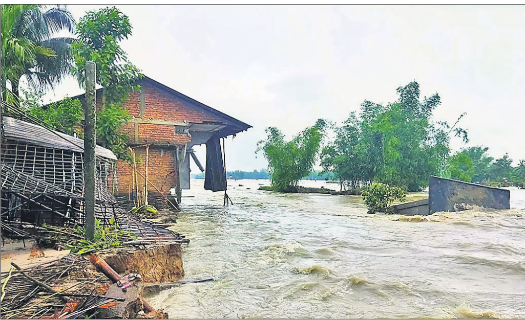
ଗୁଜରାଟ କଳ୍ପ ଜିଲ୍ଲାରେ ବାତ୍ୟା 'ବିପର୍ଯ୍ୟୟ' ଭୂପୃଷ୍ଠ ଛୁଇଁବା ପରେ ଭାଷଣ ଝଡ଼ ବର୍ଷା ଯୋଗୁ ବହୁ ଘର ଭାଙ୍ଗିଯାଇଛି।