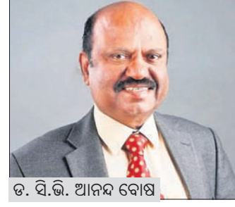
କୋଲକାତା, ୧୬୬ (ପି.ଟି.)

ପଶ୍ଚିମବଙ୍ଗରେ ରାଜନୈତିକ ହିଂସା ବନ୍ଦ ହେଉ: ରାଜ୍ୟପାଳ