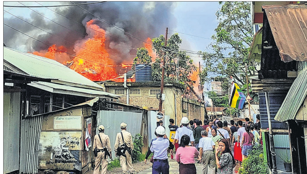
ବହିର୍ବ୍ୟାପାର ରାଷ୍ଟ୍ରମନ୍ତ୍ରୀ ଆର୍.କେ. ରଞ୍ଜନ ସିଂଙ୍କର ଇମ୍ପାଲସିଭିଟି ବାସଭବନରେ ଦଙ୍ଗାକାରୀମାନେ ନିଆଁ ଲାଗାଇ ଦେଇଛନ୍ତି।