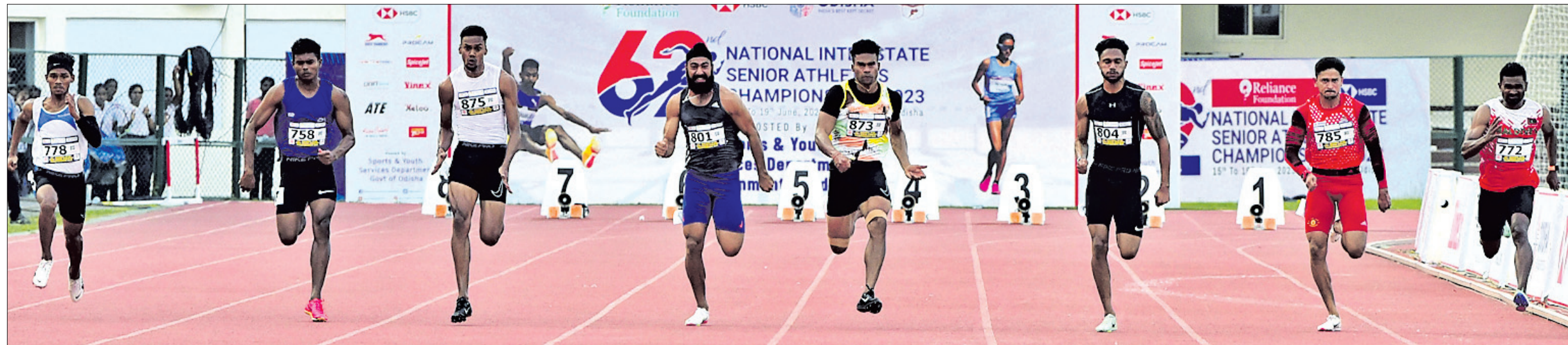
କଳିଙ୍ଗ କ୍ଷୁଦ୍ରମତ୍ସର ଚାଲିଥିବା ୬୨ତମ ଜାତୀୟ ଆନ୍ତର୍ଜାତୀୟ ସିନିୟର ଆଥଲେଟିକ୍ସ ଚାମ୍ପିୟନଶିପ୍‌ର ଦ୍ୱିତୀୟ ଦିବସରେ ଶୁକ୍ରବାର ପୁରୁଷ ୧୦୦ ମିଟର ପାଇନାଲ ଅବସରରେ ପ୍ରତିଯୋଗୀମାନେ ।