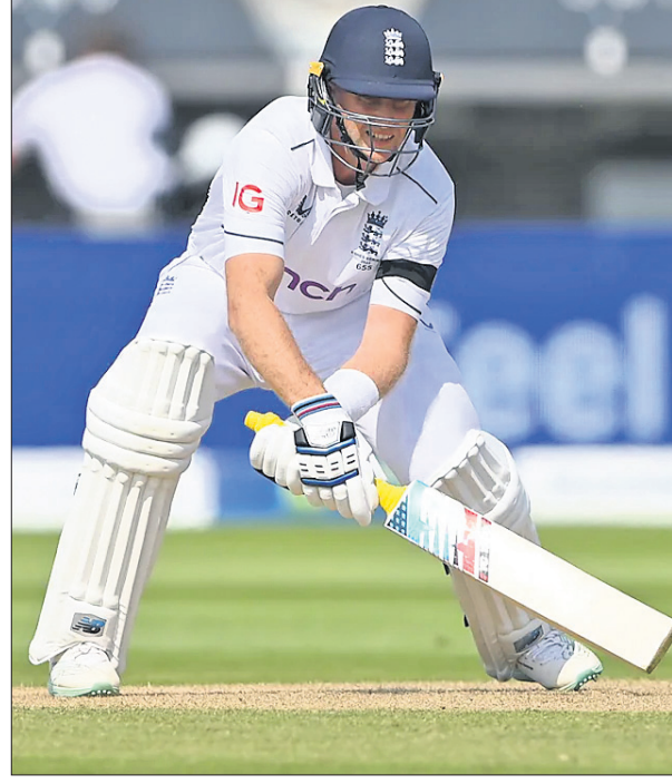
ଶତ ଖେଳିବା ଅବସରରେ ଜୋ ରୁଟ୍!

କର୍ମିହାମ୍, ୧୬.୬ (ଏପି) ଅଷ୍ଟ୍ରେଲିଆ ଓ ଇଂଲଣ୍ଡ ମଧ୍ୟରେ ବହୁପ୍ରତିକ୍ଷାତ ଆଶେଷ କ୍ରିକେଟ ଟେଷ୍ଟ ସିରିଜ ଶୁକ୍ରବାରଠାରୁ ଆରମ୍ଭ ହୋଇଛି। ବ୍ୟାଟିଂକୁ ସୁହାଉଥିବା ପିଚରେ ଟପ୍ ଜିଟି ପ୍ରଥମେ ବ୍ୟାଟିଂ କରିଥିବା ଇଂଲଣ୍ଡ ଏକମାତ୍ର ଉଇକେଟ ସୁଦ୍ଧା ୧୨୪ ରନରେ ୩ ଉଇକେଟ ହରାଇ ସକଟରେ ପଡ଼ିଥିଲା। ମାତ୍ର ଜୋ ରୁଟ (୧୧୮*) ଓ କନି ବେୟାରଣ୍ଟୋ (୭୮)ମଧ୍ୟରେ ୧୧୯ରନର