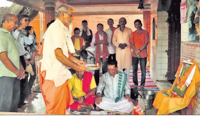
ବଚେଶ୍ୱର ବାବା ଶିବ ମନ୍ଦିରରେ ପ୍ରାକଟ୍ୟ ଦିବସ ପାଳନ ।