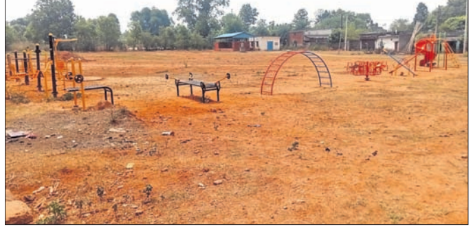
ବନପୋଷ ଛିଡ଼ି କ୍ରୀଡ଼ା ଉଦ୍ୟାନ ।

ମୁକୁଳା ଅବସ୍ଥାରେ ପଡ଼ି ରହିଥିବା ବେଳେ ବ୍ୟାରିକେଡ଼ ଲଗାଯାଇନାହିଁ। ଫଳରେ ବୁଲୁ ଗୋରୁ ପଶି ପାର୍କର ସୌଯ୍ୟକୁ ନଷ୍ଟ କରୁଛନ୍ତି। ପ୍ରଧାନପାଳି ୪ ନମ୍ବର (ଆଧିକାରକ ପାର୍କ) ନିର୍ମାଣ ହୋଇଛି। ଉଦ୍ୟାନରେ ବିଭିନ୍ନ ସରଞ୍ଚାମା ପାଇଁ କୋର୍ଟ କୋର୍ଟ ଚଳା ବ୍ୟୟ କରାଯାଉଛି। ମାତ୍ର ଅନେକ ସ୍ଥାନରେ ଉଦ୍ୟାନରୁଟିକ