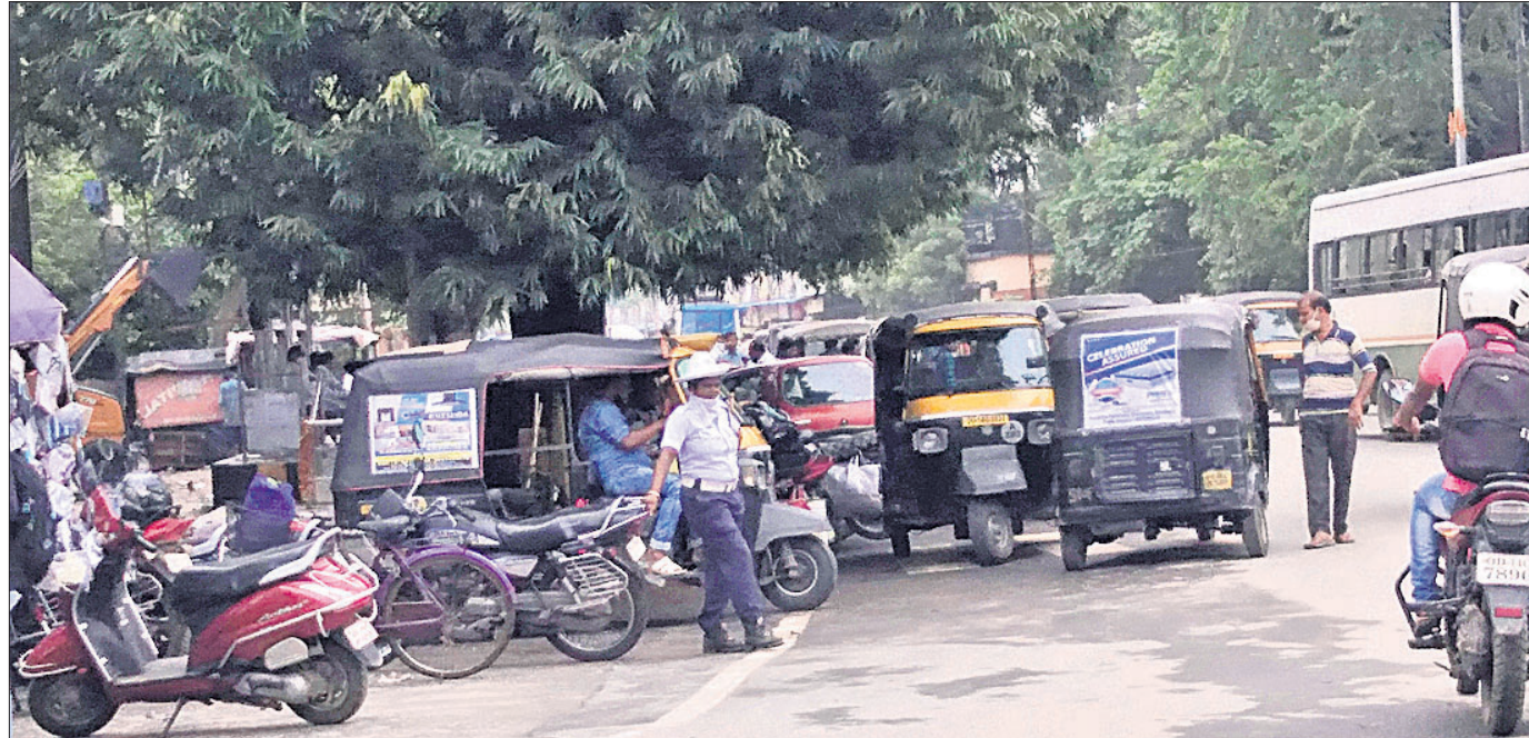
ରାଉରକେଳାର ଏକ ଛକରେ ଗ୍ରାମିକ ପୋଷ୍ଟ ନ ଥିବାରୁ ଜଣେ ମହିଳା ଗ୍ରାମିକ ପୋଲିସ ଗହଳତଳେ ଛିଡ଼ା ହୋଇ ଯାନବାହନ ପରିଚାଳନା କରୁଛନ୍ତି।