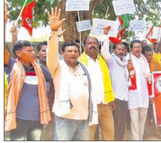
ବୀରମହାରାଜପୁର ଭାଜପା ତରଫରୁ ବିକ୍ଷୋଭ ପ୍ରଦର୍ଶନ ।

ଅଯୋଷିତ ବିଦ୍ୟୁତ କାଟ୍ ପ୍ରତିବାଦରେ ବିକ୍ଷୋଭ ବାଉଁଶଖଣ୍ଡ, ୧୬୬(ଦେବାଶିଷ୍ଟ ନେପାକ): ଅଯୋଷିତ ବିଦ୍ୟୁତ କାଟ୍ ପ୍ରତିବାଦରେ ଭାଜପା ପକ୍ଷରୁ ଶୁକ୍ରବାର ଦିନ ବାଉଁଶଖଣ୍ଡ ବିଦ୍ୟୁତ୍ ବିଭାଗ ଅଫିସ ସମ୍ମୁଖରେ ବିକ୍ଷୋଭ ପ୍ରଦର୍ଶନ କରାଯାଇଥିଲା । ସାମାନ୍ୟ ବର୍ଷା, ପବନ ହେଲେ ଘଷା ଘଷା ବିଦ୍ୟୁତ କାଟ୍ ହେଉଛି ଏବେ ଗାଟାପାତ୍ର ୪୫ ଡିଗ୍ରୀରୁ ଅଧିକ ରହିଥିବା ବେଳେ ଘଷା ଘଷା ବିଦ୍ୟୁତ କାଟ୍ ସମସ୍ୟାକୁ ଟିପ୍ପଣୀତ କରିଛି ବିଦ୍ୟୁତ୍ ବିଭାଗର କାର୍ଯ୍ୟକାରୀ ଗୋଟିଏ ଗୋଟିଏ ବିଜିଏ ମଞ୍ଜୁରୀ ଗ୍ରହଣକାରୀ ସୁଧୁ କୁଟିଲେ । ଏହାସହିତ ବୀରମହାରାଜପୁର ନିର୍ବାଚନମଣ୍ଡଳୀ ଅନ୍ତର୍ଗତ ରଞ୍ଜଣା ବ୍ଲକ ପାଇଁ ସେବେଳେ ଘରାଏ ଏବଂ ବିନିକା ବ୍ଲକ ପାଇଁ ବ୍ଲକୀନାଥ ସାହୁଙ୍କୁ ବ୍ଲକ ବିଜେଡି ସଭାପତି ଭାବେ ଯୋଗଣା କରାଯାଇଛି ।