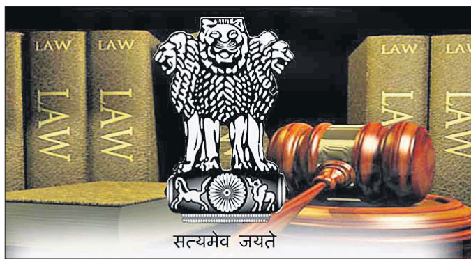
ଭୂମିକା ଉପରେ ଅନେକ ସମୟରେ ବନ୍ଦସ ସମ୍ପର୍କରେ ଆଇନ କମିଶନ ବୃଦ୍ଧି ଉପୁଜିଥିବା। ତେଣୁ ସହମତି ସରକାରଙ୍କଠାରୁ କେତେକ ତଥ୍ୟ

ସହମତି ବନ୍ଦସ ପ୍ରସଙ୍ଗର ଅନୁଧ୍ୟାନ କରୁଥିବା ୨୨ତମ ଆଇନ କମିଶନ ମହିଳା ଓ ଶିଶୁ ବିକାଶ ମନ୍ତ୍ରାଳୟର ଅଧିକାରୀମାନଙ୍କ ସହ ବୈଠକ କରିଛନ୍ତି। ଏନେଇ କମିଶନ ମନ୍ତ୍ରାଳୟକୁ ସଚିବଶେଷ ତଥ୍ୟ ମାଗିଥିବା ଏକ ସୂତ୍ରରୁ ଜଣାପଡ଼ିଛି। ଶିଶୁ ଯୌନ ଅପରାଧ ସୁରକ୍ଷା (ପୋକ୍‌ସୋ) ଆଇନରେ ୧୮ ବର୍ଷରୁ କମ୍ ବୟସ୍କଙ୍କୁ ନାବାଳକ ଦର୍ଶାଯାଇଛି। କିଶୋର କିଶୋରୀଙ୍କ ମଧ୍ୟରେ ସମ୍ପର୍କକୁ ନେଇ ସହମତି