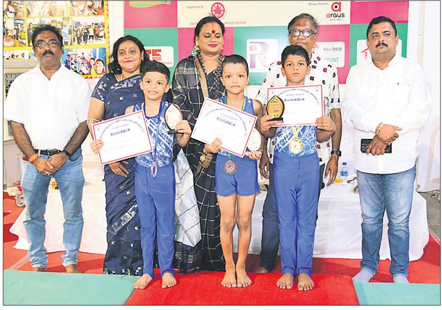
ଅତିଥିଙ୍କ ଗହଣରେ କୃତୀ ପ୍ରତିଯୋଗୀମାନେ।