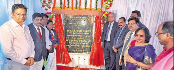
ସିଦ୍ଧିଲ କୋର୍ଟ ନିର୍ମାଣ ପାଇଁ ଭୂମି ପୂଜନ କରାଯାଇଛି ।