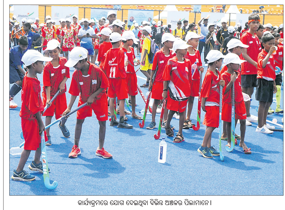
କାର୍ଯ୍ୟକ୍ରମରେ ଯୋଗ ଦେଇଥିବା ବିଭିନ୍ନ ଅଞ୍ଚଳର ପିଲାମାନେ ।