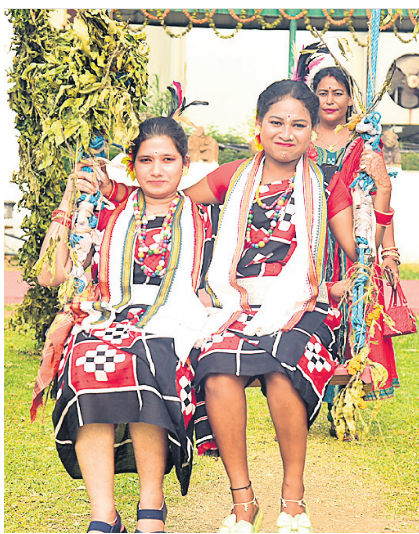
ଭୁବନେଶ୍ୱର ରାଜ୍ୟ ସଂଗ୍ରହାଳୟରେ ଅନୁଷ୍ଠିତ ରଜ ଉତ୍ସବରେ ଦୁଇ ମୁବତା ବୋଲି ଖେଳୁଛନ୍ତି।