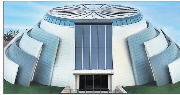
୨୦୨୨ ଏପ୍ରିଲ ୨୧ରେ ତିନି ମୂର୍ତ୍ତି ଭବନରେ ଉଦ୍‌ଘାଟିତ ପ୍ରାଇମ୍ ମିନିଷ୍ଟର୍ସ୍ ପୁସ୍ତକାଳୟ।