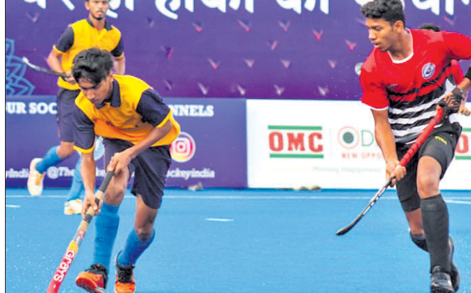
ମଧ୍ୟପ୍ରଦେଶ ଓ କେରଳ ମଧ୍ୟରେ ମ୍ୟାଚର ଦୃଶ୍ୟ।