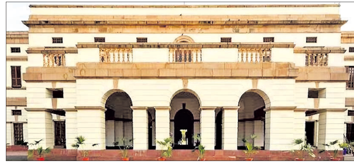
୧୯୩୦ରେ ନିର୍ମିତ ନେହେରୁ ମେମୋରିଆଲ୍ ପୁସ୍ତକାଳୟ ଆଞ୍ଚ ଲାଇବ୍‌ରେରି।