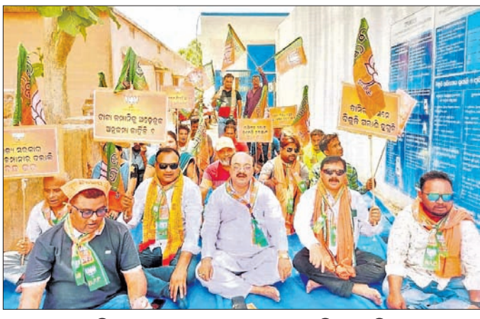
ଗାଟା ପାଠ୍ୟର ଅର୍ଥସ ସମ୍ମୁଖରେ ଭାଜପା ପକ୍ଷରୁ ଧାରଣା ଦିଆଯାଇଛି ।

ପ୍ରତ୍ୟକ୍ଷ ଗ୍ରାମ୍ୟ ସମୟରେ ମନଇଚ୍ଛା ବିଦ୍ୟୁତ୍ କାଟ୍ କରାଯାଉଛି । ଏହାର ପ୍ରତିବାଦରେ ସୁବର୍ଣ୍ଣପୁର ଜିଲ୍ଲା ଭାଜପା ପକ୍ଷରୁ ଗାଟା ପାଠ୍ୟର ପଶ୍ଚିମ ଓଡ଼ିଶା ବିଦ୍ୟୁତ୍ ବିତରଣ ସଂସ୍ଥାର ମଝିପତାଗିତ ସୋନପୁର ଉପଖଣ୍ଡ ଅଧିକାରୀଙ୍କ କାର୍ଯ୍ୟାଳୟ ସମ୍ମୁଖରେ ଶୁକ୍ରବାର ଧାରଣା ଦିଆଯିବା ସହ ବିକ୍ଷୋଭ ପ୍ରଦର୍ଶନ କରାଯାଇଛି । ଭାଜପା ଅଭିଯୋଗ କରିଛି, ରାଜ୍ୟ ସରକାରଙ୍କ ପ୍ରତ୍ୟକ୍ଷ ପ୍ରୋତ୍ସାହନରେ ବିଦ୍ୟୁତ୍ ବିତରଣ କମ୍ପାନୀ ଗାଟା ପାଠ୍ୟର ଅରାଜକତାରେ ସମସ୍ତ ସୀମା ଉଲ୍ଲଙ୍ଘନ କରିଛି । ଜିଲାର ତାପମାତ୍ରା ୪୪ ଡିଗ୍ରୀ ଉପରେ ରହିଥିବା ବେଳେ ସାମାନ୍ୟ ପବନ, ଧୂଳିଝଡ଼ରେ ମନଇଚ୍ଛା ବିଦ୍ୟୁତ୍ କାଟ୍ କରାଯାଉଛି । ଉପଭୋକ୍ତା ଗ୍ରାମରେ ଯନ୍ତ୍ରଣା ଶୋଭାପୂର୍ଣ୍ଣ ଭାଜପା ଅଭିଯୋଗ କରିଛି । ରାଜ୍ୟବାସୀଙ୍କୁ ନିରବଚ୍ଛିନ୍ନ ବିଦ୍ୟୁତ୍ ସେବା ଯୋଗାଇ ଦେବାର ଦାୟିତ୍ୱ ନେଇଥିବା ଗାଟା ପାଠ୍ୟର ସମସ୍ତ ଗୁଣ୍ଡି ଓ ନିୟମକୁ ଖୁଲାଇ ଦେଇଛି । ତେଣୁ ଶକ୍ତିମନ୍ତ୍ରୀଙ୍କୁ ଖୁଲାଇ ଦେଇଛି । ତେଣୁ ଶକ୍ତିମନ୍ତ୍ରୀଙ୍କୁ ଖୁଲାଇ ଦେଇଛି । ତେଣୁ ଶକ୍ତିମନ୍ତ୍ରୀଙ୍କୁ ଖୁଲାଇ ଦେଇଛି ।