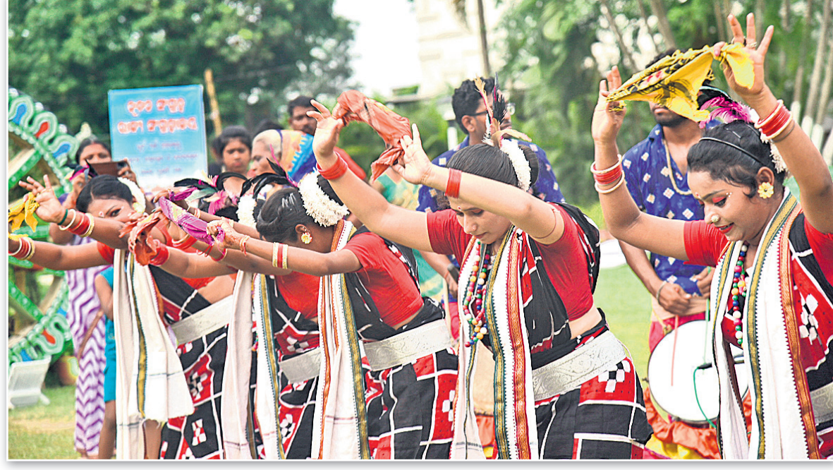
ଭୁବନେଶ୍ୱର ରାଜ୍ୟ ସଂଗ୍ରହାଳୟରେ ଅନୁଷ୍ଠିତ ରଜ ଉତ୍ସବରେ ସମଲପୁରୀ ନୃତ୍ୟ।