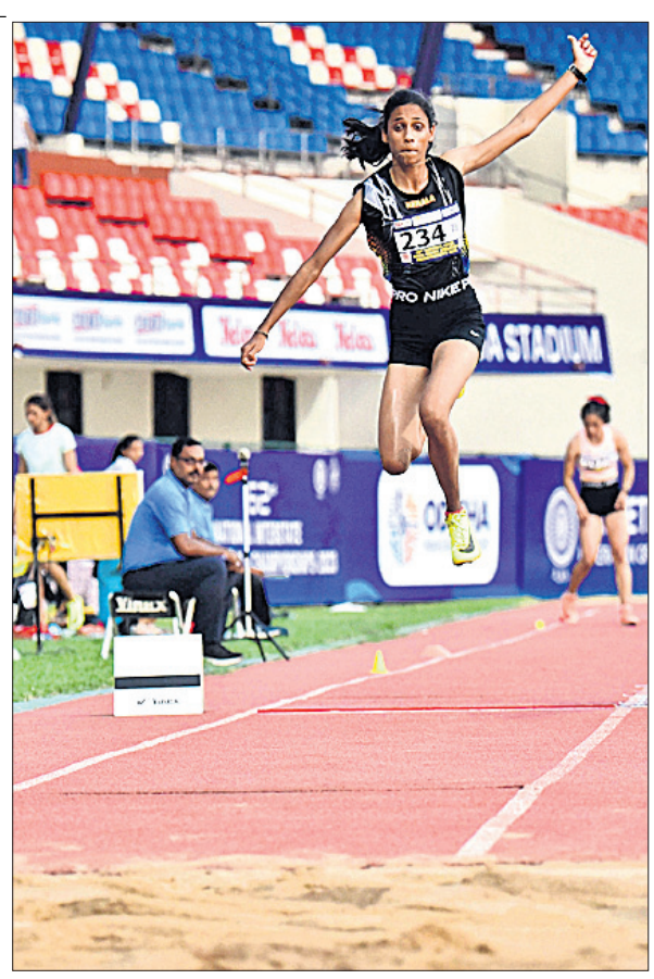
ମହିଳା ଲଙ୍ଗଜମ୍ପ ଇଭେଣ୍ଟ ଅବସରରେ ଜଣେ ପ୍ରତିଯୋଗୀ ।