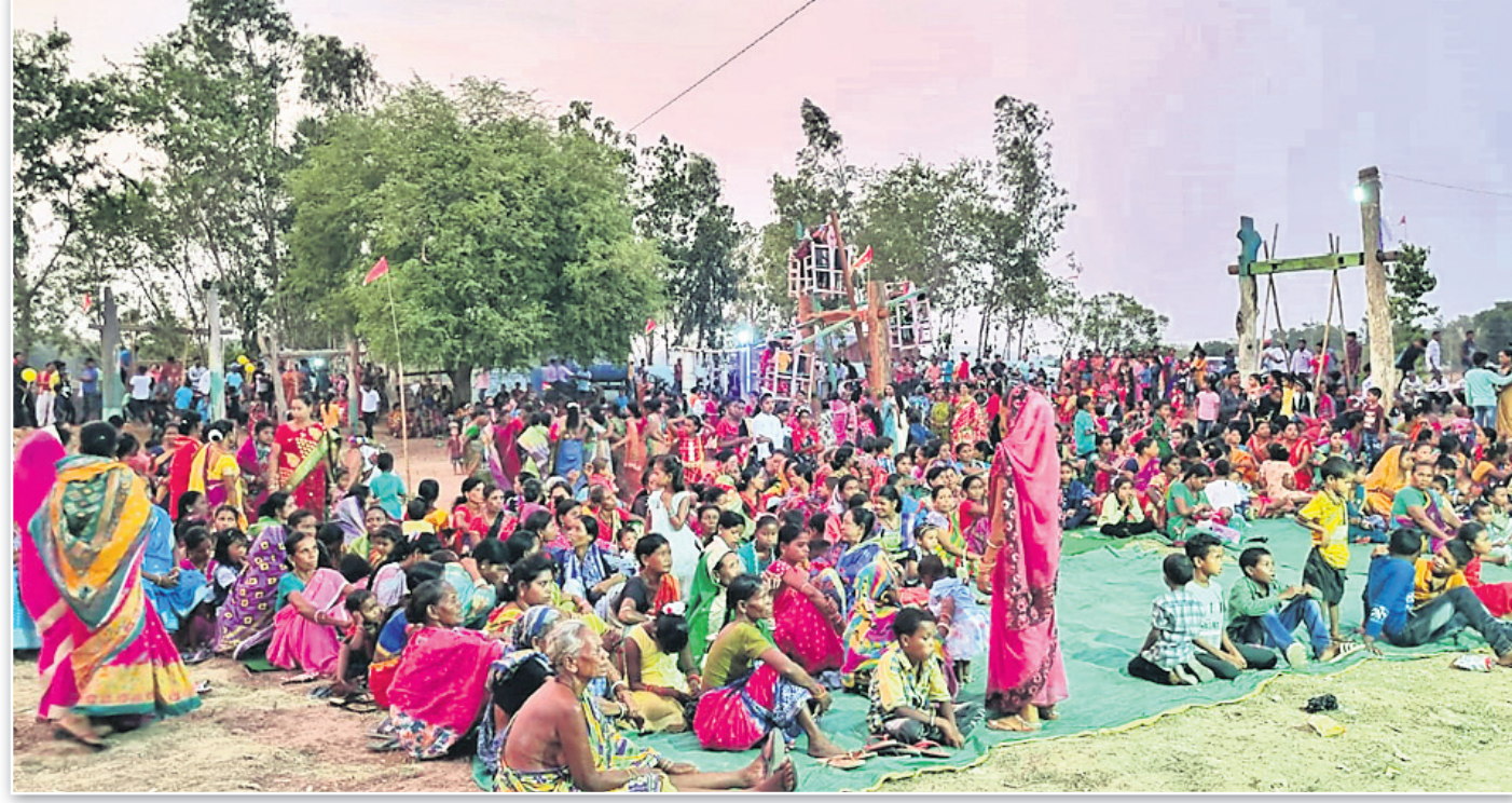
କେନ୍ଦୁଝର ଚେଳିକୋଟ ଚଳିରା ରଜ ପଢ଼ିଆରେ ଅନୁଷ୍ଠିତ ରଜ ପର୍ବ।