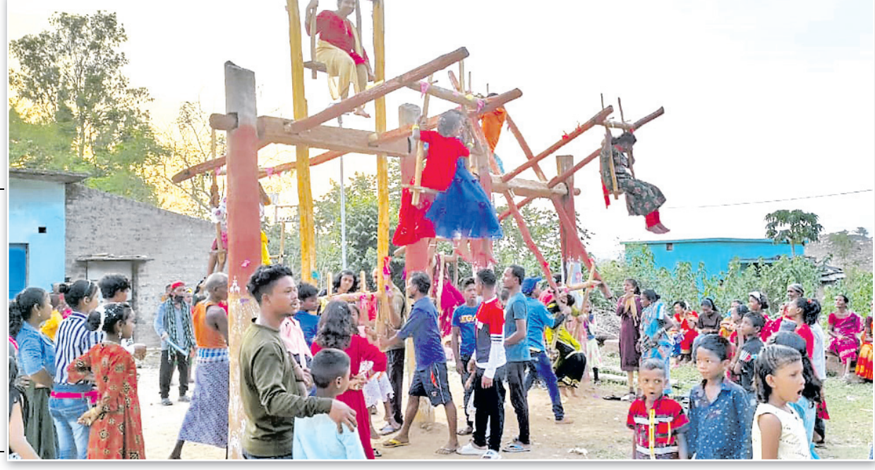
କେନ୍ଦୁଝର ଲାଲାବାଜୀଠାରେ ଖାଇ ବୋଲି ଖେଳ ଚାଲିଛି।

ବାହାଘର ପାଇଁ ବେଦି ନିର୍ମାଣ ହୋଇଥିଲା। ଶେଷ ରଜରେ ରଜବତୀ ଠାକୁରାଣୀଙ୍କୁ କନ୍ୟା ବେଶରେ ସଜ୍ଜିତ କରି ଗ୍ରାମର ଝିଅ ଓ ବୋହୂମାନେ ବିମାନରେ ବସାଇ ଗ୍ରାମ ପରିକ୍ରମା କରାଯାଇଥିଲା। ବର ବଳ ପାରମ୍ପରିକ ବ୍ୟାଞ୍ଜ ବଜାଇ ଶୋଭାଯାତ୍ରାରେ ଆସିଥିଲେ। ମଞ୍ଚପରେ ବିବାହ ସମ୍ପନ୍ନ ହୋଇଥିଲା। ଗ୍ରାମର ସମସ୍ତେ ଆକର୍ଷଣୀୟ ଚୋରଣ ଲଗାଯାଇଛି।