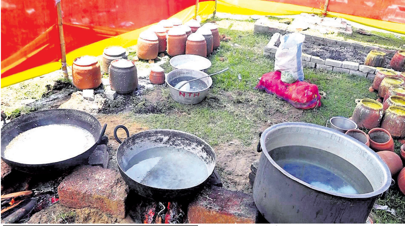
ଭଲ୍‌ଜି ଭାଗରେ ସହ ଖେଳି ଦୃଢ଼ କାର୍ଯ୍ୟାନୁଷ୍ଠାନ ଦାବି କଲେ ସେଗାୟତ

ମହାପ୍ରଭୁଙ୍କ ଅବଦାନ ଗ୍ରୀଣିଦେଲେ ମନରେ ଭରିଯାଏ ଭକ୍ତି। ଚିକେ ମହାପ୍ରସାଧନ ପାଇଁ କାବନ ଧର୍ମ୍ୟ ହୋଇଯିବ ତାହା ମନେ ହୁଏ। ହେଲେ ମହାପ୍ରସାଧନ ବି ନକଲି ପ୍ରସ୍ତୁତ ହେବା ସହ ବିକ୍ରି ହେଉଥିବା ଅଭିଯୋଗ ଉଠିଛି। ଶ୍ରୀମନ୍ଦିରରେ ଯେପରି ଅନ୍ନ, ତାଳି, ବେସର, ମହୁର, ଖଟା ପ୍ରସ୍ତୁତ ହୁଏ, ସେହିଭଳି ଅବିକଳ ପ୍ରସ୍ତୁତ କରାଯାଉଛି। ଏଭଳି କାର୍ଯ୍ୟକୁ ଭଲ୍‌ଜି, ଶ୍ରୀମନ୍ଦିର ପ୍ରଶାସନ ଏବଂ ସେବାୟତମାନେ ମହାପ୍ରଭୁଙ୍କୁ ଅପମାନ ବୋଲି କହିବା ସହ ଘଟଣାର ଦୃଢ଼ କାର୍ଯ୍ୟାନୁଷ୍ଠାନ ଦାବି କରିଛନ୍ତି।