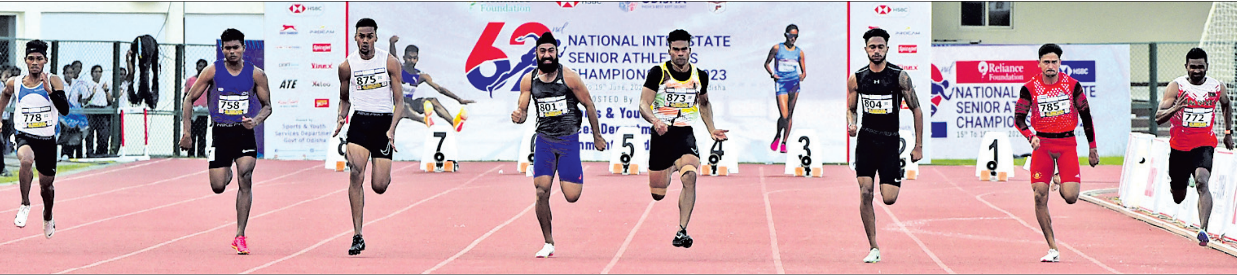
କଳିଙ୍ଗ କ୍ଷୁଦ୍ରମତ୍ରେ ଚାଲିଥିବା ୬୨ତମ ଜାତୀୟ ଆନ୍ତର୍ଜାତୀୟ ସିନିୟର ଆଥଲେଟିକ୍ସ ଚାମ୍ପିୟନଶିପ୍ରେ ବିଭିନ୍ନ ଦିବସରେ ଶୁଭକାରୀ ପୁରୁଷ ୧୦୦ ମିଟର ପାଇନାଲ ଅବସରରେ ପ୍ରତିଯୋଗୀମାନେ।