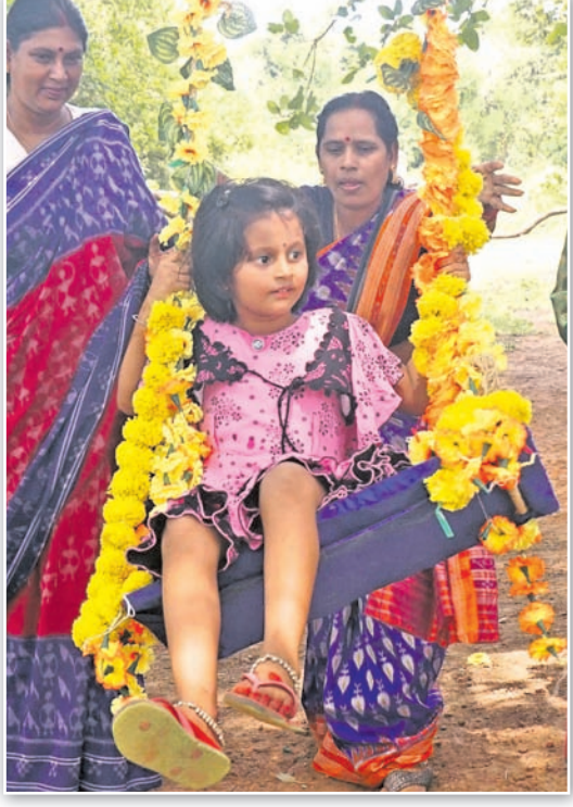
କଟକ ଧବନେଶ୍ୱରଗଡ଼ଠାରେ ଅନୁଷ୍ଠିତ ରଜ ଉତ୍ସବରେ ଜଣେ ବାଳିକା ବୋଲି ଖେଳୁଛନ୍ତି।