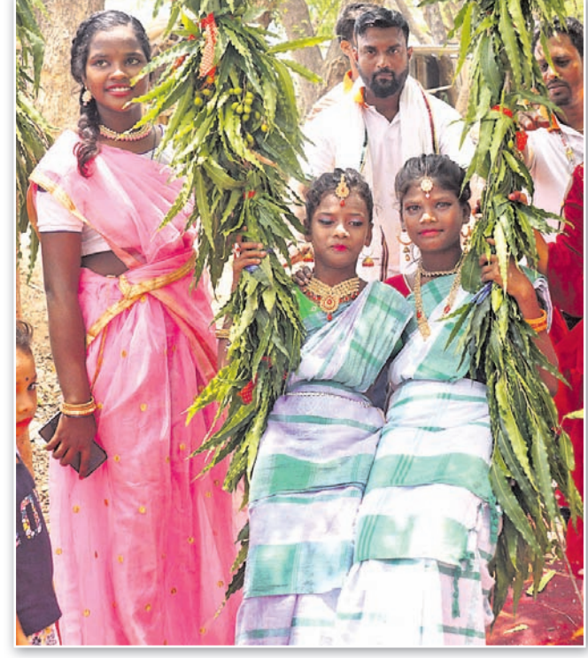
କଟକ ସିଡିଏ ସେକ୍ଟର-୯ ତାରିଶୀଗଡ଼ା ବସ୍ତିରେ ଅନୁଷ୍ଠିତ ରଜ ଉତ୍ସବରେ ୨ ବାଳିକା ବୋଲି ଖେଳୁଛନ୍ତି ଏବଂ ବାଳିକାମାନେ ସଜବାଜ ହେଉଛନ୍ତି(ତାହାଣ)।