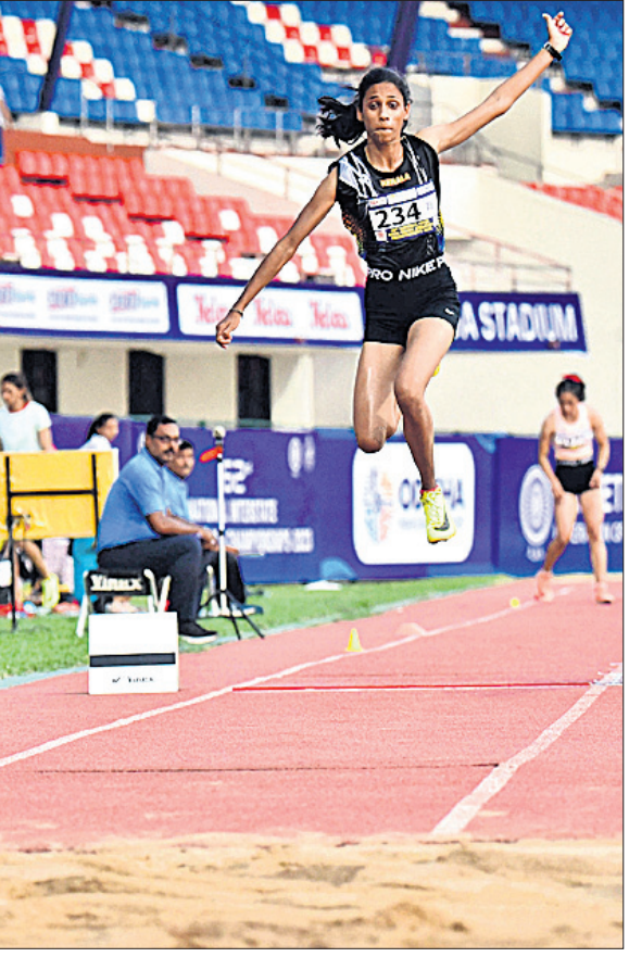
ମହିଳା ଲଞ୍ଜାକ୍ଷମ ଲଢ଼େଇ ଅବସରରେ ଜଣେ ପ୍ରତିଯୋଗୀ।