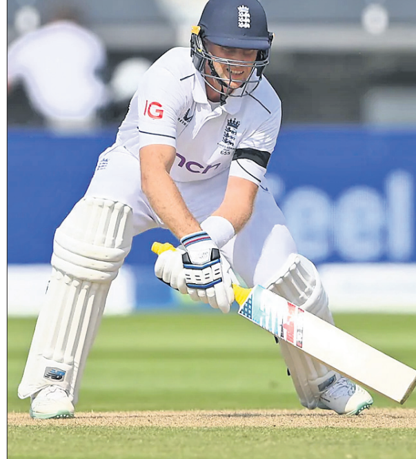
ଶତ ଖେଳିବା ଅବସରରେ ଜୋ ରୁଟ୍।

କର୍ମିହୀନ, ୧୬/୬ (ଏପି) ଅଷ୍ଟ୍ରେଲିଆ ଓ ଇଂଲଣ୍ଡ ମଧ୍ୟରେ ବହୁପ୍ରତିଯୋଗିତା ଆଶେଷ କ୍ରିକେଟ ଟେଷ୍ଟ ସିରିଜ୍ ଶୁକ୍ରବାରଠାରୁ ଆରମ୍ଭ ହୋଇଛି। ବ୍ୟାଟିଂକୁ ପୁସ୍ତାଭିତ୍ତିକ ପିଚ୍‌ରେ ଟପ୍ ଜିଟି ପ୍ରଥମେ ବ୍ୟାଟିଂ କରିଥିବା ଇଂଲଣ୍ଡ ଏକଦା ମଧ୍ୟାହ୍ନ ଭୋଜନ ପୂର୍ବ ୧୨୪ ରନରେ ୩ ଉଇକେଟ ହରାଇ ସକଟରେ ପଡ଼ିଥିଲା। ମାତ୍ର ଜୋ ରୁଟ୍ (୧୧୮*) ଓ କନି ବେୟାରଣ୍ଟୋ (୭୮)ମଧ୍ୟରେ ୧୧୯ରନର