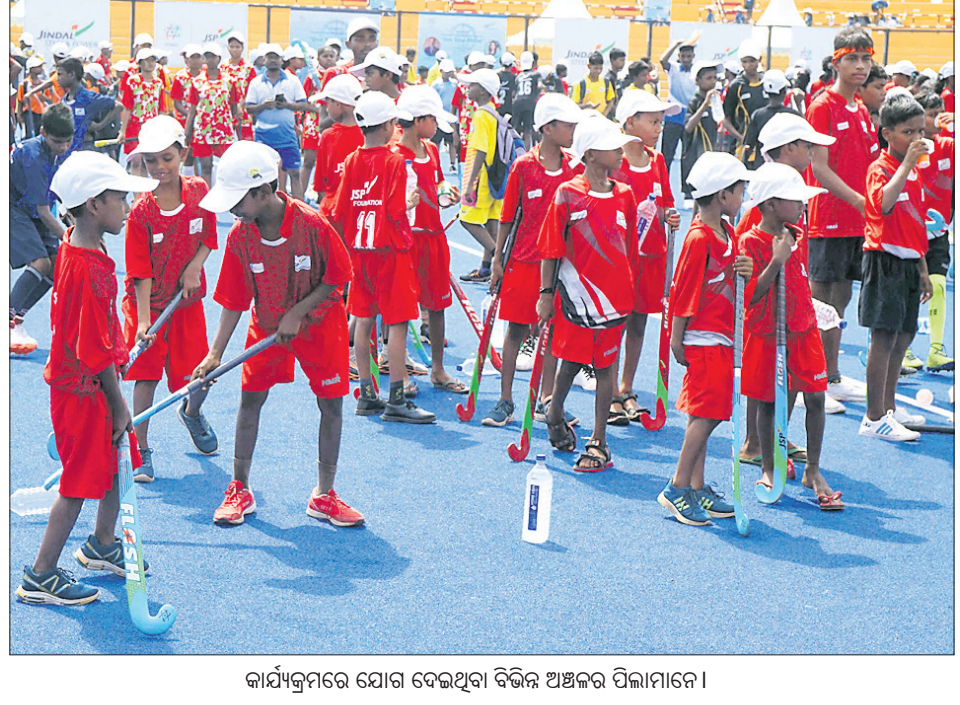
କାର୍ଯ୍ୟକ୍ରମରେ ଯୋଗ ଦେଇଥିବା ବିଭିନ୍ନ ଅଞ୍ଚଳର ପିଲାମାନେ।