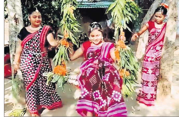
ଶେଷ ରଞ୍ଜରେ ଯୁବତୀମାନେ ବୋଲି ଖେଳର ମଜା ନେଉଛନ୍ତି।

ରାୟଗଡ଼ା ଜିଲ୍ଲା ପୁନିଗୁଡ଼ା କ୍ଲବରେ ରଜ ଉତ୍ସବ ପାଳିତ ହୋଇଯାଇଛି। ଶେଷରଞ୍ଜରେ ପୋଡ଼ିପିଠା, କାକରା, ବିଭିନ୍ନ କିସମର ମିଠା ଓ ରଜ ପାନ ସାଙ୍ଗକୁ କୁମାରୀମାନଙ୍କୁ ବୋଲି ଖେଳରେ ମୁନିଗୁଡ଼ା ଚଳଚଞ୍ଚଳ ହୋଇପାରିଥିଲା।