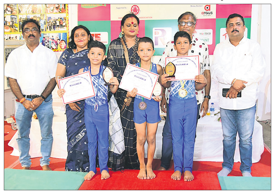
ଅତିଥିଙ୍କ ଗହଣରେ କୃତୀ ପ୍ରତିଯୋଗୀମାନେ।