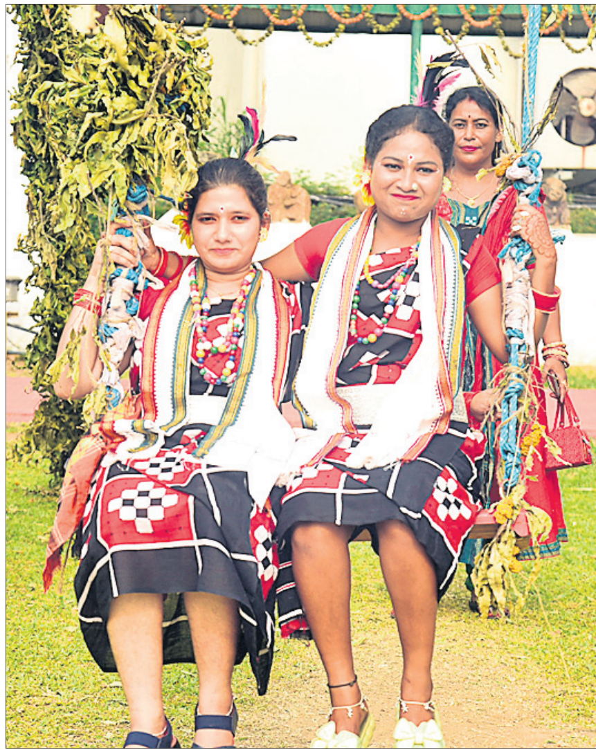
ଭୁବନେଶ୍ୱର ରାଜ୍ୟ ସଂଗ୍ରହାଳୟରେ ଅନୁଷ୍ଠିତ ରଜ ଉତ୍ସବରେ ବୁଲି ଯୁବତୀ ବୋଲି ଖେଳୁଛନ୍ତି।