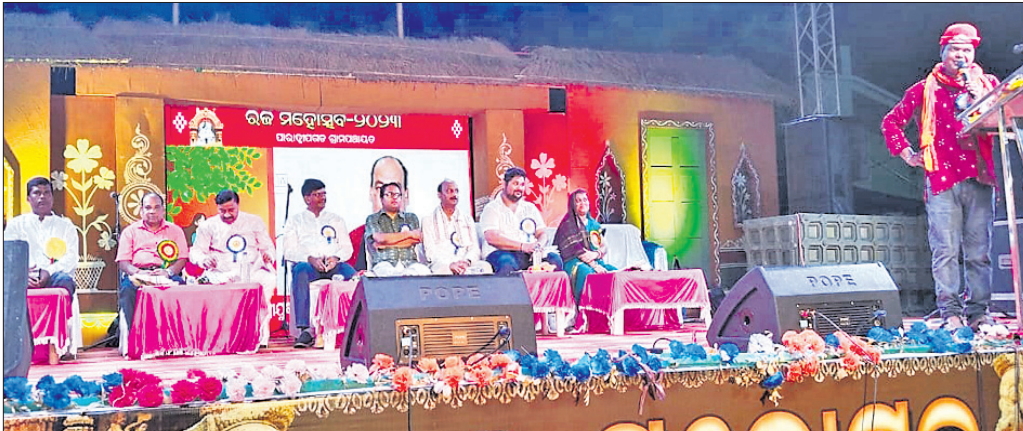
ରଜ ମହୋତ୍ସବ ଅବସରରେ ଆୟୋଜିତ କାର୍ଯ୍ୟକ୍ରମରେ ମଞ୍ଚାସୀନ ଅତିଥିମାନେ।