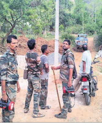
ହାତୀ ଘରଭାଇବା ପାଇଁ ବନ କର୍ମଚାରୀ ଜଗି ରହିଛନ୍ତି ।