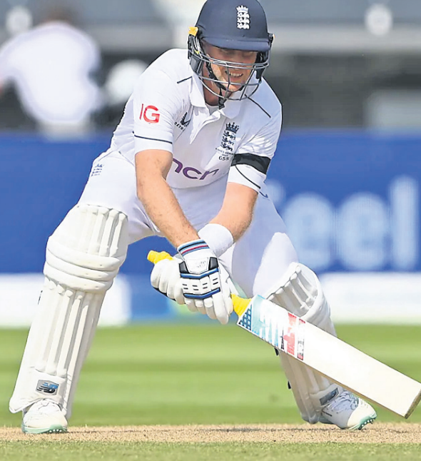
ଶତ ଖେଳିବା ଅବସରରେ ଜୋ ରୁଟ୍!

କର୍ମିହାମ୍, ୧୬.୬ (ଏପି) ଅଷ୍ଟ୍ରେଲିଆ ଓ ଇଂଲଣ୍ଡ ମଧ୍ୟରେ ବହୁପ୍ରତିଷ୍ଠାତ ଆଶେସ କ୍ରିକେଟ ଟେଷ୍ଟ ସିରିଜ ଶୁକ୍ରବାରଠାରୁ ଆରମ୍ଭ ହୋଇଛି। ବ୍ୟାଟିଂକୁ ସୁହାଉଥିବା ପିଚ୍‌ରେ ଟେଷ୍ଟ ପ୍ରଥମେ ବ୍ୟାଟିଂ କରିଥିବା ଇଂଲଣ୍ଡ ଏକଦା ମଧ୍ୟାହ୍ନ ଭୋକନ ସୁଦ୍ଧା ୧୨୪ ରନରେ ୩ ଉଇକେଟ ହରାଇ ସକଟରେ ପଡ଼ିଥିଲା। ମାତ୍ର ଜୋ ରୁଟ (୧୧୮*) ଓ କନି ବେୟାରଣ୍ଟୋ (୭୮)ମଧ୍ୟରେ ୧୧୯ରନର