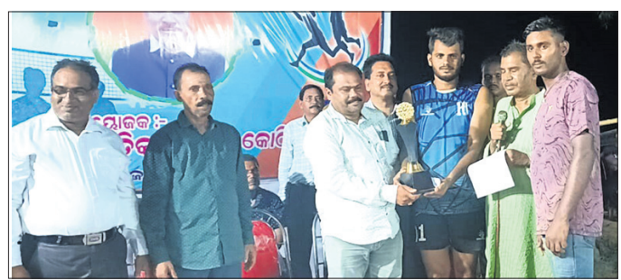
ଚାମ୍ପିୟନ ଦଳର ଖେଳାଳୀମାନଙ୍କୁ ଅତିଥି ଗ୍ରୁପ ପ୍ରଦାନ କରୁଛନ୍ତି।