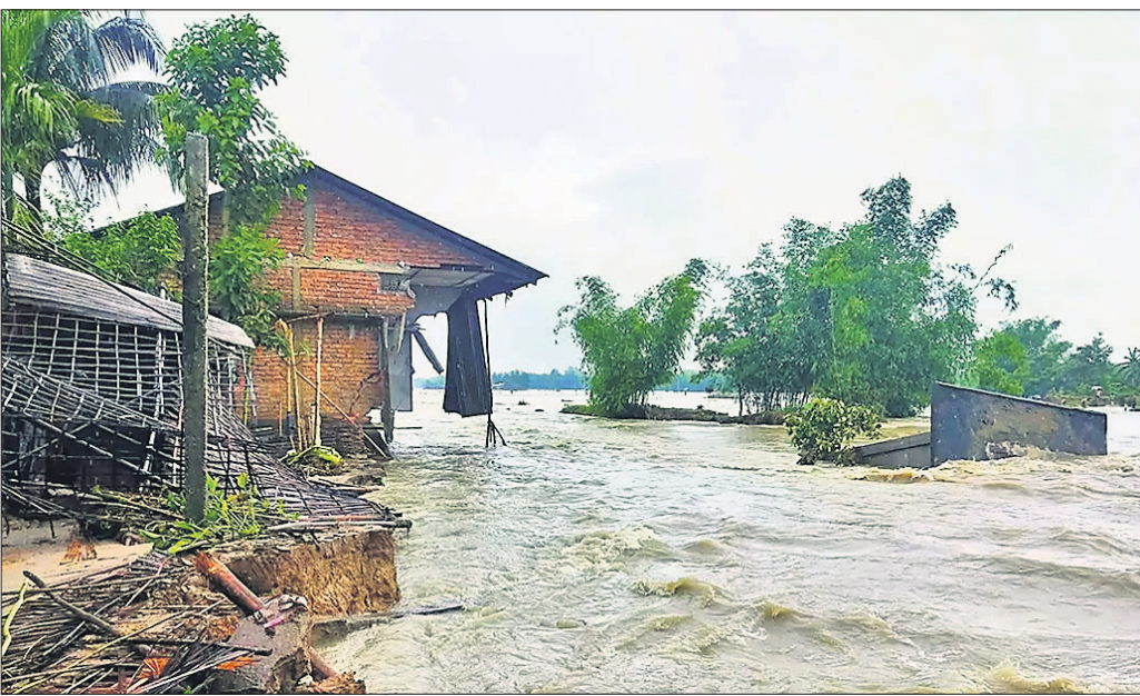
ଗୁଜରାଟ କଳ୍ଲ ଜିଲ୍ଲାରେ ବାତ୍ୟା 'ବିପର୍ଯ୍ୟୟ' ଭୂପୃଷ୍ଠ ଛୁଇଁବା ପରେ ଭାଷଣ ଝଡ଼ ବର୍ଷା ଯୋଗୁ ବହୁ ଘର ଭାଙ୍ଗିଯାଇଛି।

ପଶ୍ଚିମବଙ୍ଗରେ ରାଜନୈତିକ ହିଂସା ବନ୍ଦ ହେବା କରୁଣା ବୋଲି ରାଜ୍ୟପାଳ ଡ. ସି.ଭି. ଆନନ୍ଦ ବୋଷ ଶୁକ୍ରବାର କହିଛନ୍ତି। ରାଜ୍ୟରେ ପଞ୍ଚାୟତ ନିର୍ବାଚନ ପୂର୍ବରୁ ବିଭିନ୍ନ ସ୍ଥାନରେ ହିଂସାକାଣ୍ଡ ଘଟୁଛି। ଦିନକୁ ଦିନ ଭଙ୍ଗାଠାରେ ଦୁଇ ରାଜନୈତିକ ଦଳର କର୍ମୀଙ୍କ ମଧ୍ୟରେ ସଂଘର୍ଷ ଘଟି ୩ ଜଣଙ୍କ ମୃତ୍ୟୁ ହୋଇଥିଲା। ଭାଙ୍ଗାଠାକୁ ଗପ୍ତରେ ଯାଇଥିବା ରାଜ୍ୟପାଳ କହିଛନ୍ତି, ରାଜ୍ୟର ଆଇନ ଶୁଖିଲା ଛୁଟି ସମ୍ପର୍କରେ ସେ ମୁଖ୍ୟମନ୍ତ୍ରୀ ମମତା ବାନାର୍ଜୀଙ୍କ ସହ ଆଲୋଚନା କରିଛନ୍ତି। ପଶ୍ଚିମବଙ୍ଗର କେତେକ ଅଞ୍ଚଳରେ ଅବାସ୍ଥିତ ଘଟଣାମାନ ଘଟିଛି। କୌଣସି ହିଂସାକୁ ବରଦାସ୍ତ କରାଯିବନି, ଏହାକୁ ବନ୍ଦ କରିବାକୁ ହେବ ବୋଲି ରାଜ୍ୟପାଳ ଖବରଦାତା ସମ୍ମିଳନୀରେ କହିଛନ୍ତି। ପୂର୍ବରୁ ଦକ୍ଷିଣ ୨୪ ପ୍ରଗଣା ଜିଲ୍ଲାରେ ଭାଙ୍ଗାଠାରେ ଇଣ୍ଡିଆନ୍ ସିକ୍ୟୁଲାର ଫୁଣ୍ଡ (ଆଇଏସଏଫ) ଏବଂ ଶାସକ ଟିଏମ୍‌ସି କର୍ମୀଙ୍କ ମଧ୍ୟରେ ସଂଘର୍ଷ ଘଟିଥିଲା। ଅନ୍ୟପକ୍ଷରେ ପଞ୍ଚାୟତ ନିର୍ବାଚନ ପାଇଁ ନାମାଙ୍କନପତ୍ର ବାଖଲ ପ୍ରକ୍ରିୟା ଶାନ୍ତିପୂର୍ଣ୍ଣ ଭାବେ ଚାଲିଥିବା ମୁଖ୍ୟମନ୍ତ୍ରୀ ମମତା ବାନାର୍ଜୀ କହିଛନ୍ତି। ଗୋଟିଏ ଦୁଇଟି ଘଟଣାକୁ ନେଇ ବିରୋଧୀ ଦଳ ପ୍ରସଙ୍ଗ କରିବାକୁ ଉଦ୍ୟମ କରୁଥିବାରୁ ମମତା ଏହାର ସମାଲୋଚନା କରିଛନ୍ତି।