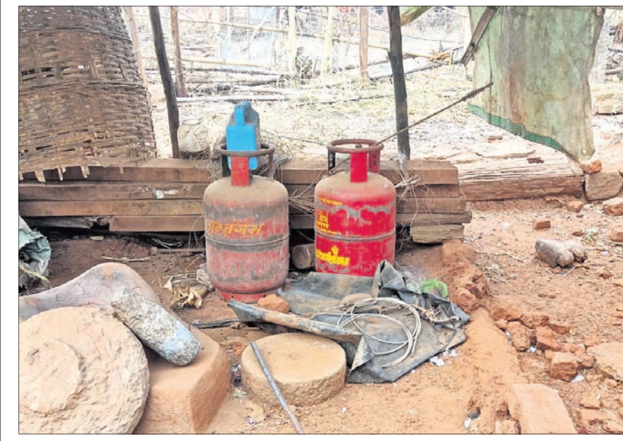
ଘରୋଇ ଗ୍ୟାସ୍ ଅହେତୁକ ଦର ବୃଦ୍ଧି ପରେ ନୂଆଗାଁ ବୁକ ଆସିବା ସାମାଜିକ ଅଲୋଡ଼ା ହୋଇ ପଡ଼ିରହିଛି ଉତ୍କଳା ଯୋଜନାରେ ମିଳିଥିବା ଗ୍ୟାସ୍ ସିଲିଣ୍ଡର ।

ସେଲ୍‌ଫି ପଠାଇବା ସମୟରେ ନିଜର ନାମ ଏବଂ ମୋବାଇଲ ନମ୍ବର ଦେବାକୁ ଜୁଲୁକୁ ନାହିଁ । ଯୋଗ୍ୟବିବେଚିତ ଫଟୋ ପ୍ରକାଶ ପାଇବ ।