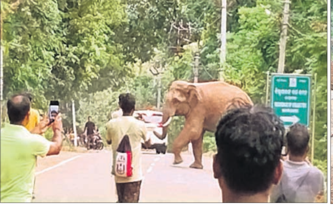
ହାତୀ ଜିଲ୍ଲାପାଳଙ୍କ ଆବାସ କାର୍ଯ୍ୟାଳୟ ସମ୍ମୁଖ ତିଆରତିଏ ରାସ୍ତାରେ ।

ନୟାଗଡ଼ ସହରର ରୁଖି ସଂରକ୍ଷିତ ଜଙ୍ଗଲ ଓ ତିଆରତିଏ ରାସ୍ତାରେ ଦେଖା ଦେଇଥିବା ଦନ୍ତା ହାତୀ ପୁଣି ଆସିବା ବାଟରେ ଶୁକ୍ରବାର ରାତି ୯ଟାରେ ଶୁଣିଆ ଜଙ୍ଗଲକୁ ଫେରି ଯାଇଛନ୍ତି । ନୟାଗଡ଼ ସହର ରୁଖି, ବଳରାମ ଓ ଯଜ୍ଞା ପାହାଡ଼ ପାଦଦେଶରେ ଗଢ଼ି ଉଠିଥିବା ରାଜା ଶାସନ ସମୟରେ ନୟାଗଡ଼ରେ ହାତୀ ଉପହୁବ ଲାଗି ରହିଥିଲା । ସେ ସମୟରେ ଜଙ୍ଗଲ ଭରପୁର ଥିଲା । ଦେଶ ସାଧାରଣତା ପରେ ଜଙ୍ଗଲ ହ୍ରାସ ଓ ଜନବସତି ବଢ଼ିବାରୁ ହାତୀଙ୍କ ବାସସ୍ଥଳ ବଦଳି ଯାଇଥିଲା । ନୟାଗଡ଼ ସହରରେ ହାତୀଙ୍କୁ ଦେଖିବାକୁ ମିଳୁ ନ ଥିଲା । ଶୁକ୍ରବାର ଭୋରୁ ଏକ ଦନ୍ତାହାତୀ ଖାଦ୍ୟ ଓ ପାନି ଅଭେଷଣରେ ଶୁଣିଆ ଜଙ୍ଗଲକୁ ବିରାଡ଼ିସାହି, ମନ୍ତ୍ରାପୁର, ଶାଳଭଞ୍ଜ ଜଙ୍ଗଲ ଦେଇ ନୟାଗଡ଼ ସହରର ତିଆରତିଏ ରାସ୍ତାରେ ବୁଲୁଥିଲା । ପରେ ରୁଖି ସଂରକ୍ଷିତ ଜଙ୍ଗଲକୁ ଚାଲି ଯାଇଥିଲା । ଅପରାହ୍ନ ଓ ସନ୍ଧ୍ୟାରେ ହାତୀ ମହର୍ଷି ସ୍ଥଳ,