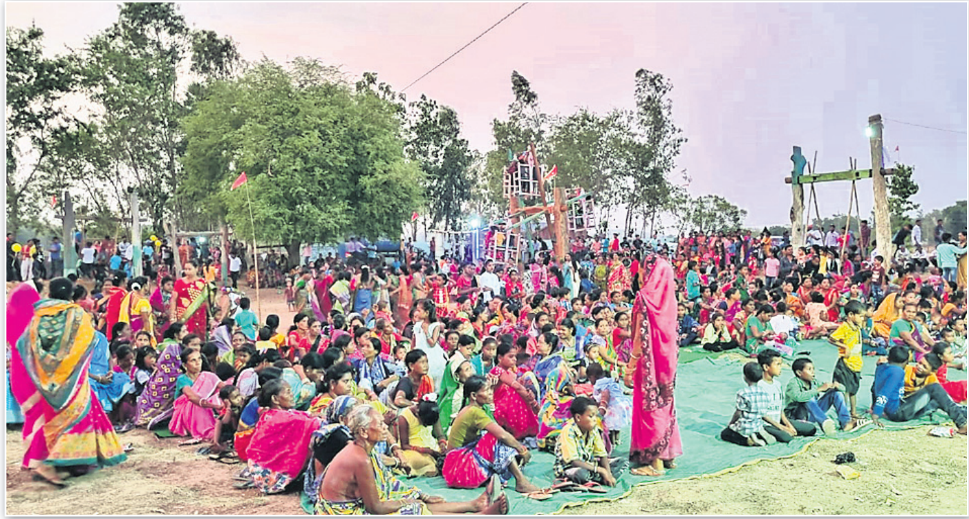
କେନ୍ଦୁଝର ଚେଳିକୋଟ ଚଳିବା ରଜ ପଡ଼ିଆରେ ଅନୁଷ୍ଠିତ ରଜ ପର୍ବ।