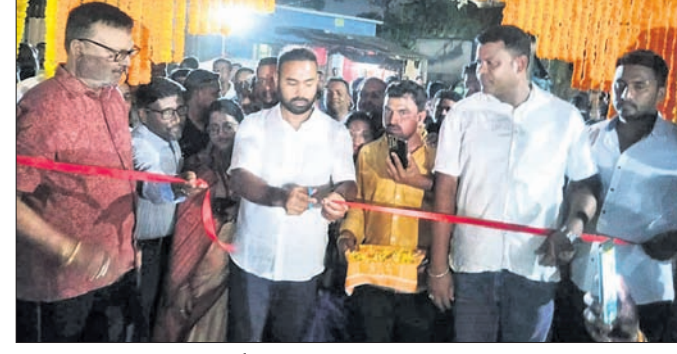
ମନ୍ତ୍ରୀ ପ୍ରତିରଞ୍ଜନ ଘଡ଼ାଳ ପାର୍କ ଉଦ୍ଘାଟନ କରୁଛନ୍ତି।

କଳିଙ୍ଗନଗର, ୧୬୬ (ଶୁଭାଶିଷ ରାଉତ) ପାର୍କ ବସିବାର ବ୍ୟବସ୍ଥା କରାଯାଇଛି। ଟାଟା ଷ୍ଟିଲର କମ୍ପାନିଟି ଖେଳନେତ୍ର ପାର୍କ ଉଦ୍ଘାଟନ କରାଯାଇଛି।