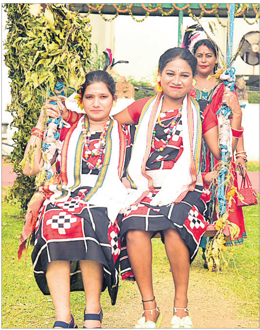
ଭୁବନେଶ୍ୱର ରାଜ୍ୟ ସଂଗ୍ରହାଳୟରେ ଅନୁଷ୍ଠିତ ରଜ ଉତ୍ସବରେ ଦୁଇ ମୁବତା ବୋଲି ଖେଳୁଛନ୍ତି।