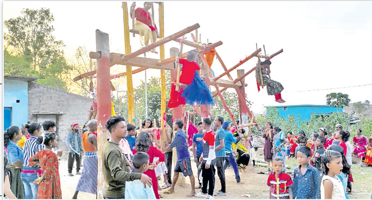
କେନ୍ଦୁଝର ଲାଲାବାଜୀଠାରେ ଖାଇ ବୋଲି ଖେଳ ଚାଲିଛି।

ବାହାଘର ପାଇଁ ବେଦି ନିର୍ମାଣ ହୋଇଥିଲା। ଶେଷ ରଜରେ ରଜବତୀ ଠାକୁରାଣୀଙ୍କୁ କନ୍ୟା ବେଶରେ ସଜ୍ଜିତ କରି ଗ୍ରାମର ଝିଅ ଓ ବୋହୂମାନେ ବିମାନରେ ବସାଇ ଗ୍ରାମ ପରିକ୍ରମା କରାଉଥିଲେ। ବର ଦଳ ପାରମ୍ପରିକ ବ୍ୟାଣ୍ଡ ବଜାଇ ଶୋଭାଯାତ୍ରାରେ ଆସିଥିଲେ। ମଞ୍ଚପରେ ବିବାହ ସମ୍ପନ୍ନ ହୋଇଥିଲା। ଗ୍ରାମର ସମସ୍ତେ ସାଙ୍ଗକୁ ଆକର୍ଷଣୀୟ ଚୋରଣ ଲଗାଯାଇଛି।