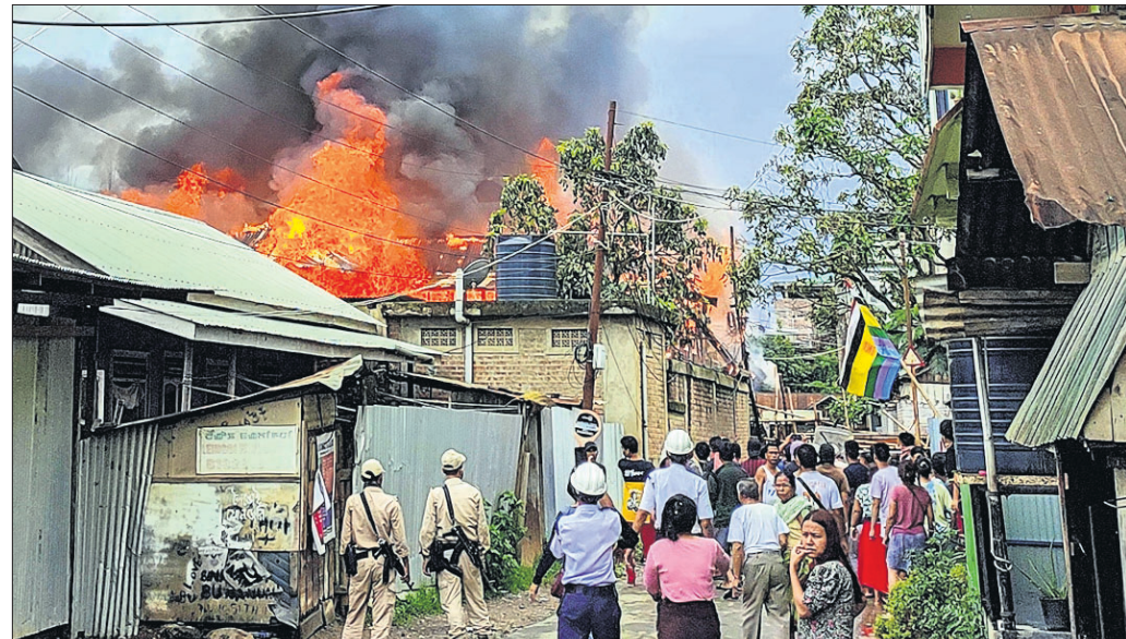
ବହିର୍ବାପାର ରାଷ୍ଟ୍ରମନ୍ତ୍ରୀ ଆର୍.କେ. ରଞ୍ଜନ ସିଂଙ୍କର ଇମ୍ପାଲସିଭ ବାସଭବନରେ ଦଙ୍ଗାକାରୀମାନେ ନିଆଁ ଲାଗାଇ ଦେଇଛନ୍ତି।

ଈମ୍ପାଲ, ୧୬୬ ମଣିପୁରରେ ପାଖାପାଖି ଦେଢ଼ମାସ ହେଲା ହିଂସାକାଣ୍ଡ ଜାରି ରହିଥିବାବେଳେ ପରିବାର ନାଁ ନେଉନି। ଶୁକ୍ରବାର ସନ୍ଧ୍ୟାରେ ରାଜଧାନୀ ଈମ୍ପାଲରେ ଦଙ୍ଗାକାରୀ ଏବଂ ରାପିଡ୍ ଆକ୍ସନ ଫୋର୍ସ (ଆର୍ଏସଏଫ୍) ଯବାନଙ୍କ ମଧ୍ୟରେ ସଂଘର୍ଷ ଘଟିଛି। ଦଙ୍ଗାକାରୀମାନେ ଏକ ଡ୍ରେହାଉସକୁ ଜାଳିଦେବା ସହ ଅନ୍ୟ ସମ୍ପତ୍ତିକୁ ଗର୍ଭେଷ୍ଟ କରିବାକୁ ପୋଲିସ୍ ହାତକୁ ଖାଣ୍ଡି ପ୍ରୟୋଗ କରିଥିଲା। ଈମ୍ପାଲ ପ୍ୟାଲେସ୍ ଗ୍ରାଉଣ୍ଡରେ ଏହି ହିଂସାକାଣ୍ଡ ଦେଖାଦେଇଛି। ଅଗ୍ନିଶମ କର୍ମୀଗଣ ଓ ସୁରକ୍ଷା ବଳ ଘଟଣାସ୍ଥଳରେ ପହଞ୍ଚି ନିଆଁକୁ ଆୟତ୍ତ କରିଥିଲେ। ଭକ୍ତ ସମ୍ପର୍କି ଜଣେ ହାଇପ୍ରୋପୋଲ୍ଲ