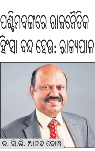
କୋଲକାତା, ୧୬୬ (ପି.ଟି.)

ପଶ୍ଚିମବଙ୍ଗରେ ରାଜନୈତିକ ହିଂସା ବନ୍ଦ ହେବା କରୁଣା ବୋଲି ରାଜ୍ୟପାଳ ଡ. ସି.ଭି. ଆନନ୍ଦ ବୋଷ ଶୁକ୍ରବାର କହିଛନ୍ତି। ରାଜ୍ୟରେ ପଞ୍ଚାୟତ ନିର୍ବାଚନ ପୂର୍ବରୁ ବିଭିନ୍ନ ସ୍ଥାନରେ ହିଂସାକାଣ୍ଡ ଘଟୁଛି। ଦିନକୁ ଦିନ ଭଙ୍ଗାଠାରେ ଦୁଇ ରାଜନୈତିକ ଦଳର କର୍ମୀଙ୍କ ମଧ୍ୟରେ ସଂଘର୍ଷ ଘଟି ୩ ଜଣଙ୍କ ମୃତ୍ୟୁ ହୋଇଥିଲା। ଭାଙ୍ଗାଠାକୁ ଗପ୍ତରେ ଯାଇଥିବା ରାଜ୍ୟପାଳ କହିଛନ୍ତି, ରାଜ୍ୟର ଆଇନ ଶୁଖିଲା ଛୁଟି ସମ୍ପର୍କରେ ସେ ମୁଖ୍ୟମନ୍ତ୍ରୀ ମମତା ବାନାର୍ଜୀଙ୍କ ସହ ଆଲୋଚନା କରିଛନ୍ତି। ପଶ୍ଚିମବଙ୍ଗର କେତେକ ଅଞ୍ଚଳରେ ଅବାସ୍ଥିତ ଘଟଣାମାନ ଘଟିଛି। କୌଣସି ହିଂସାକୁ ବରଦାସ୍ତ କରାଯିବନି, ଏହାକୁ ବନ୍ଦ କରିବାକୁ ହେବ ବୋଲି ରାଜ୍ୟପାଳ ଖବରଦାତା ସମ୍ମିଳନୀରେ କହିଛନ୍ତି। ପୂର୍ବରୁ ଦକ୍ଷିଣ ୨୪ ପ୍ରଗଣା ଜିଲ୍ଲାରେ ଭାଙ୍ଗାଠାରେ ଇଣ୍ଡିଆନ୍ ସିକ୍ୟୁଲାର ଫୁଣ୍ଡ (ଆଇଏସଏଫ) ଏବଂ ଶାସକ ଟିଏମ୍‌ସି କର୍ମୀଙ୍କ ମଧ୍ୟରେ ସଂଘର୍ଷ ଘଟିଥିଲା। ଅନ୍ୟପକ୍ଷରେ ପଞ୍ଚାୟତ ନିର୍ବାଚନ ପାଇଁ ନାମାଙ୍କନପତ୍ର ବାଖଲ ପ୍ରକ୍ରିୟା ଶାନ୍ତିପୂର୍ଣ୍ଣ ଭାବେ ଚାଲିଥିବା ମୁଖ୍ୟମନ୍ତ୍ରୀ ମମତା ବାନାର୍ଜୀ କହିଛନ୍ତି। ଗୋଟିଏ ଦୁଇଟି ଘଟଣାକୁ ନେଇ ବିରୋଧୀ ଦଳ ପ୍ରସଙ୍ଗ କରିବାକୁ ଉଦ୍ୟମ କରୁଥିବାରୁ ମମତା ଏହାର ସମାଲୋଚନା କରିଛନ୍ତି।