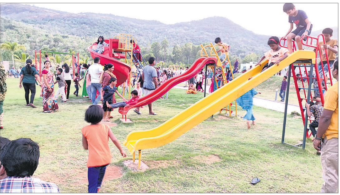
ରଜ ଲାଗି ନୟାଗଡ଼ ବଳାଙ୍ଗୀ ପାର୍କରେ ଭିଡ଼ ।