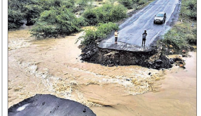
ଗୁଜରାଟ ପଶ୍ଚିମାଞ୍ଚଳରେ ବିପର୍ଯ୍ୟୟ ପ୍ରଭାବରେ ବ୍ରିକ୍ ଭାଙ୍ଗିବା ପରେ ବନ୍ୟା ଜଳରେ ନାଲିୟା-ଭୁଜ ହାଇୱେ ଧୋଇହୋଇଯାଇଛି।

ଗାନ୍ଧୀନଗର, ୧୬୬ ଗୁଜରାଟ କଳ୍ଲ ଜିଲ୍ଲାରେ ଗୁଜୁବାର ଅତି ଭାଷଣ ସାମୁଦ୍ରିକ ବାତ୍ୟା ସ୍ଥଳଭାଗ ଛୁଇଁବା ପରେ ୭୦୭ ନବଜାତ ଜନ୍ମ ନେଇଛନ୍ତି। ବାତ୍ୟା ବିପର୍ଯ୍ୟୟ ଯୋଗୁ ପ୍ରଭାବିତ ହେବାକୁ ଥିବା ଅଞ୍ଚଳରୁ ଏହି ଗର୍ଭବତୀମାନଙ୍କୁ ସ୍ଥାନାନ୍ତର କରାଯାଇଥିଲା। ସରକାରୀ ସୁଚନାମୁତାବକ ପାଖାପାଖି ୮ ଜିଲ୍ଲାକୁ ୧,୧୫୨ରୁ ୧,୧୭୧ ଗର୍ଭବତୀଙ୍କୁ ସୁରକ୍ଷିତ ସ୍ଥାନକୁ ନିଆଯାଇଥିଲା। ବାତ୍ୟା ବିପର୍ଯ୍ୟୟ ସ୍ଥଳଭାଗ ଛୁଇଁବା ପୂର୍ବରୁ ଉପକୂଳ ଅଞ୍ଚଳକୁ ଲକ୍ଷ୍ୟକୃତ ଲୋକଙ୍କୁ ସୁରକ୍ଷିତ ସ୍ଥାନକୁ ନିଆଯାଇଥିଲା।