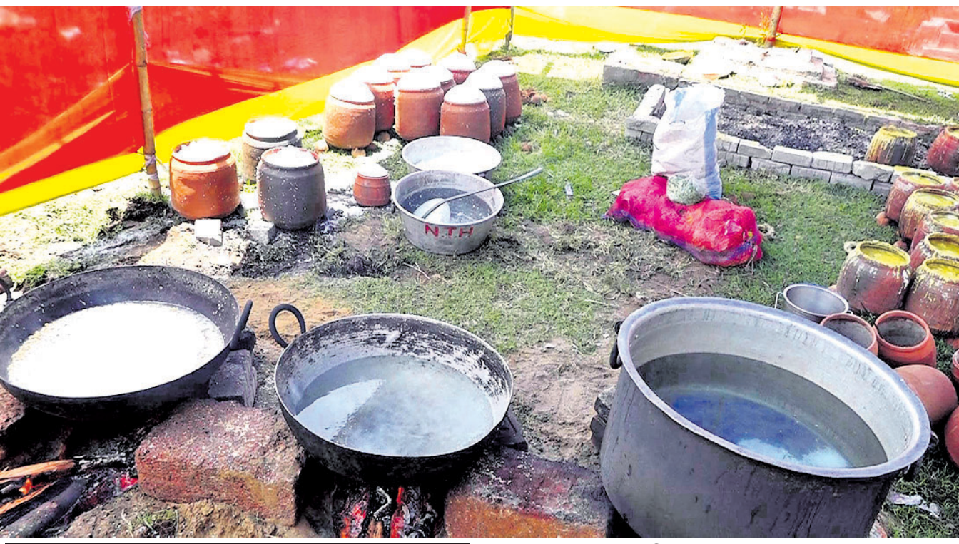
ଭକ୍ତଙ୍କ ଭାଗାବେଗ ସହ ଖେଳ ଦୃଢ଼ କାର୍ଯ୍ୟାନୁଷ୍ଠାନ ଦାବି କଲେ ସେବାୟତ

ମହାପ୍ରଭୁଙ୍କ ଅବତ୍ତା ନାଁ ଶୁଣିଦେଲେ ମନରେ ଭରିଯାଏ ଭକ୍ତି। ଚିତ୍ତେ ମହାପ୍ରସାଦ ପାଇବଲେ କାବନ ଧନ୍ୟ ହୋଇଯିବା ଭଳି ମନେ ହୁଏ। ହେଲେ ମହାପ୍ରସାଦ ବି ନକଲି ପ୍ରସ୍ତୁତ ହେବା ସହ ବିକ୍ରି ହେଉଥିବା ଅଭିଯୋଗ ଉଠିଛି। ଶ୍ରୀମନ୍ଦିରରେ ଯେପରି ଅନ୍ନ, ତାଲି, ବେସର, ମହୁର, ଖଟା ପ୍ରସ୍ତୁତ ହୁଏ, ସେହିଭଳି ଅବିକଳ ପ୍ରସ୍ତୁତ କରାଯାଉଛି। ଏଭଳି କାର୍ଯ୍ୟକୁ ଭକ୍ତ, ଶ୍ରୀମନ୍ଦିର ପ୍ରଶାସନ ଏବଂ ସେବାୟତମାନେ ମହାପ୍ରଭୁଙ୍କୁ ଅପମାନ ବୋଲି କହିବା ସହ ଘଟଣାର ଦୃଢ଼ କାର୍ଯ୍ୟାନୁଷ୍ଠାନ ଦାବି କରିଛନ୍ତି।