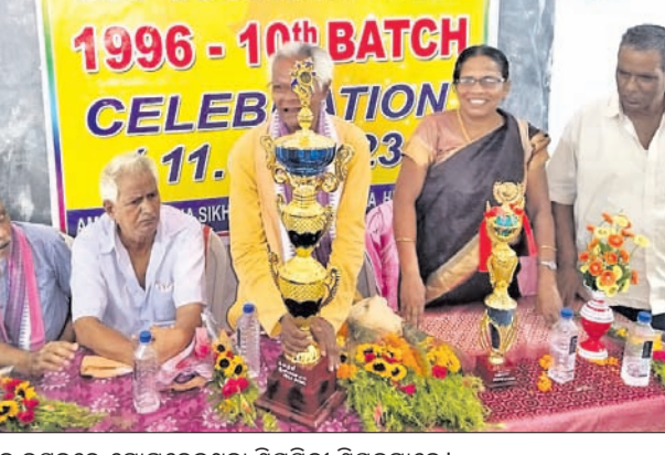
ବନ୍ଧୁମିଳନ ଉତ୍ସବରେ ଯୋଗଦେଇଥିବା ଶିକ୍ଷକମାନେ।