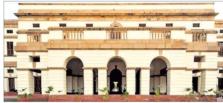
୧୯୩୦ରେ ନିର୍ମିତ ନେହେରୁ ମେମୋରିଆଲ ପ୍ୟୁବ୍ଲିକ୍ ଆଣ୍ଡ ଲାଇବ୍ରେରି।