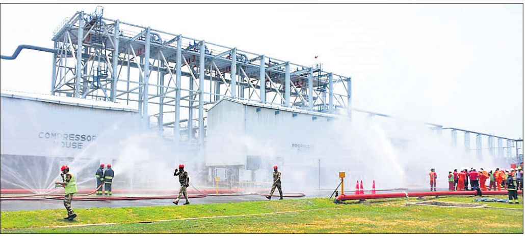
ପାରାଦୀପ ରିଫାଇନେରି ପରିସରରେ ପୁରୁଣା କର୍ମାଗାର ମକ୍ତଦ୍ୱିଲ କରୁଛନ୍ତି।

ପାରାଦୀପ, ୧୬୬୬ (ଶରତ ରାଉତ) ପାରାଦୀପ ରିଫାଇନେରି ପରିସରରେ ଶୁକ୍ରବାର ପ୍ରୋପିଲିନ ଗ୍ୟାସ୍ ନିର୍ଗମନ କମିଟି ପକ୍ତଦ୍ୱିଲ ଅନୁଷ୍ଠିତ ହୋଇଯାଇଛି। ଆପତକାଳୀନ ସୁରକ୍ଷା ଚିନ୍ତା ଏହି