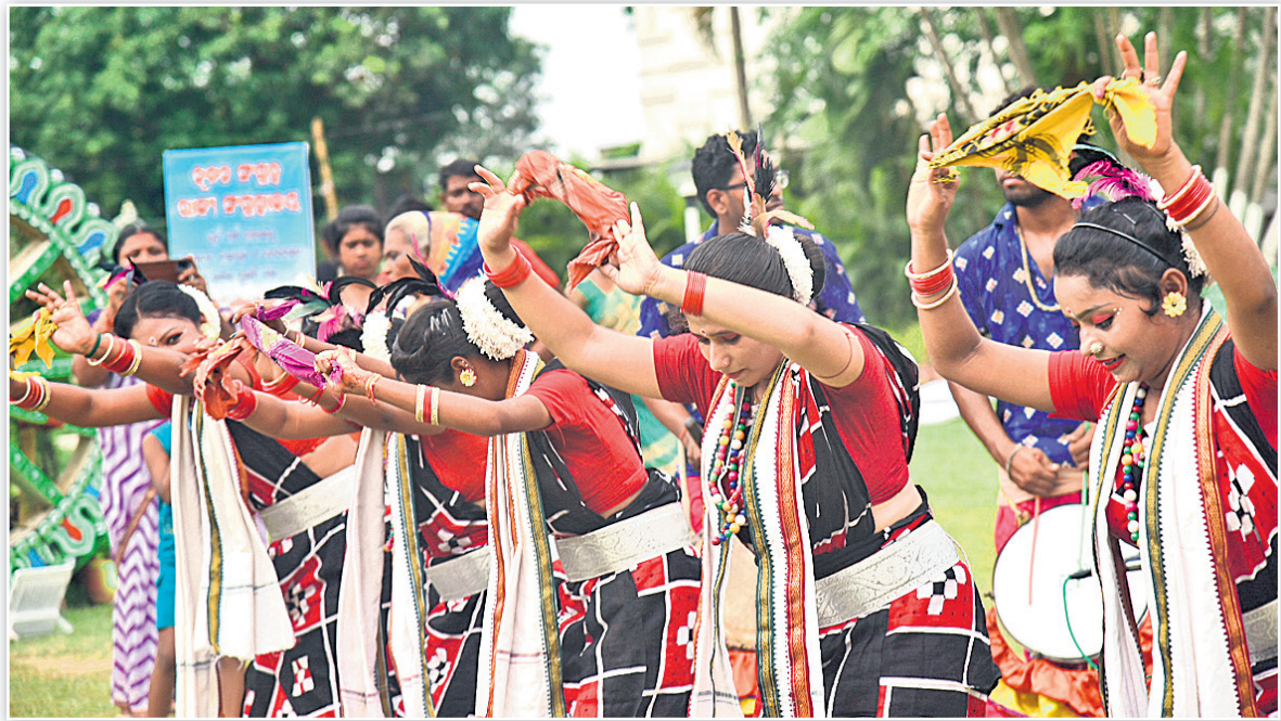
ଭୁବନେଶ୍ୱର ରାଜ୍ୟ ସଂଗ୍ରହାଳୟରେ ଅନୁଷ୍ଠିତ ରଜ ଉତ୍ସବରେ ସମଲପୁରୀ ନୃତ୍ୟ।