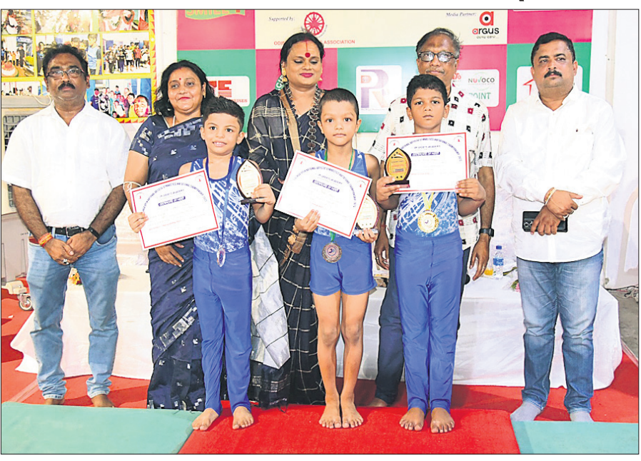
ଅତିଥିଙ୍କ ଉତ୍ସବରେ କୃତୀ ପ୍ରତିଯୋଗୀମାନେ।