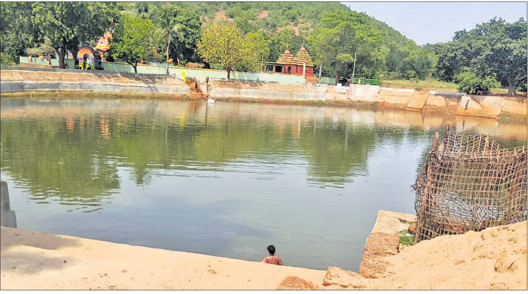
ରଣପୁର ବୁକ ଚମ୍ପାନଟୁ ଗ୍ରାମ ଯୋଖରୀ ।

ନୟାଗଡ଼/ରଣପୁର, ୧୬୬୬(ଲୋକନାଥ ମିଶ୍ର/ସୁକାନ୍ତ କିଶୋର ଡାକୁଆ)