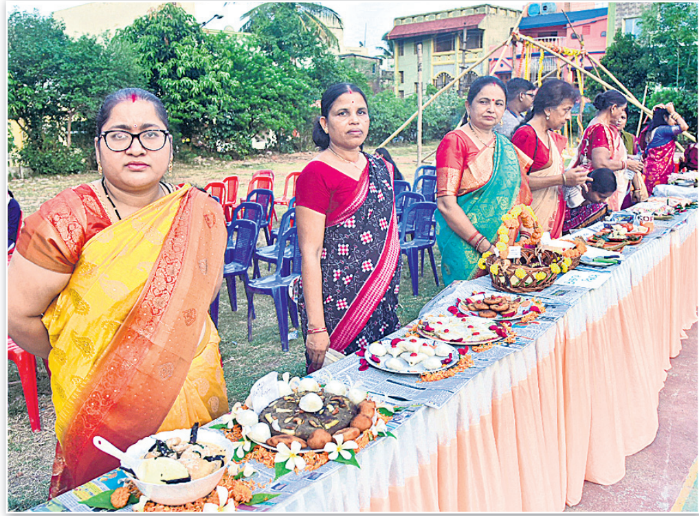
ଭୁବନେଶ୍ୱର କାନନବିହାର ଲେଡିଜ୍ ଫୋରମ୍ ପକ୍ଷରୁ ଆୟୋଜିତ ରଜ ମହୋତ୍ସବରେ ପିଠା ପ୍ରତିଯୋଗିତା।