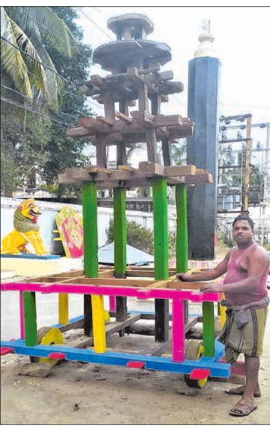
ବନ୍ଧପଲ୍ଲୀରେ ପିଲାମାନଙ୍କ ରଥ ପ୍ରସ୍ତୁତ । ଏଥିରେ ଦଧିପାନ ଉପାଦାନ ହେବ ।