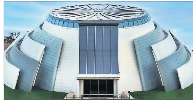
୨୦୨୨ ଏପ୍ରିଲ ୨୧ରେ ତିନି ମୂର୍ତ୍ତି ଭବନରେ ଉଦ୍‌ଘାଟିତ ପ୍ରାଇମ୍ ମିନିଷ୍ଟର୍ସ ପ୍ୟୁବ୍ଲିକ୍ସ।