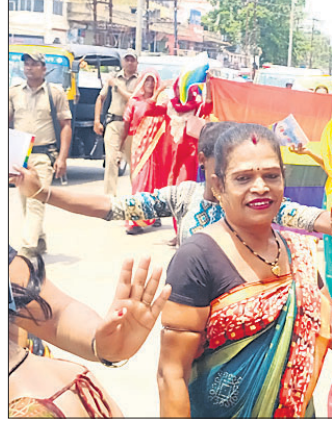
ଶୋଭାଯାତ୍ରାରେ କିନରମାନେ ସଚେତନ କରାଉଛନ୍ତି ।

ପାଇଁ ପ୍ରଶାସନ ଏବଂ ଜନସାଧାରଣଙ୍କୁ ସଚେତନ କରିବା ଲକ୍ଷ୍ୟରେ ଏହି ଶୋଭାଯାତ୍ରା କରାଯାଇଥିବା ଅର୍ଦ୍ଧନାରାୟଣ ଲକ୍ଷ୍ୟର ସ୍ୱାସ୍ଥ୍ୟ ଲକ୍ଷ୍ୟକୁ ସମାନ ଅଧିକାର ପ୍ରଦାନ ପାଇଁ କିନର ସଂଘ ପକ୍ଷରୁ ଶନିବାର ଭଦ୍ରକରେ ଏକ ସଚେତନତା ଶୋଭାଯାତ୍ରା ଅନୁଷ୍ଠିତ ହୋଇଥିଲା । ଲିଙ୍ଗପାଳକ ଅତିଥି ପାଖରୁ କିନରମାନେ ଶୋଭାଯାତ୍ରାରେ ବାହାରି ହାତରେ ପୁାକର୍ ଧରି ଚାନ୍ଦବାଲି ବାଇପାସ୍ ପର୍ଯ୍ୟନ୍ତ ଯାଇଥିଲେ । ଶିକ୍ଷା, ସ୍ୱାସ୍ଥ୍ୟ, ନିଯୁକ୍ତି ଓ ଆଇନ କ୍ଷେତ୍ରରେ ସମାନ ଅଧିକାର ପ୍ରଦାନ