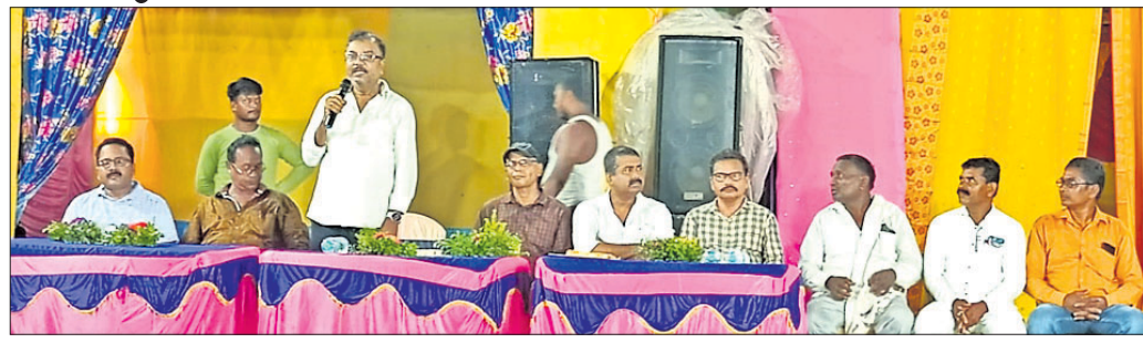
ମଞ୍ଚରେ ଉପସ୍ଥିତ ଅତିଥିମାନେ ।