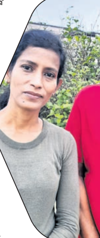
ବାପା ନେତ୍ରାନନ୍ଦଙ୍କ ସହ ଶ୍ରଦ୍ଧାଞ୍ଜଳି

ବାପା ନେତ୍ରାନନ୍ଦଙ୍କ ସହ ଶ୍ରଦ୍ଧାଞ୍ଜଳି ବାପା ନେତ୍ରାନନ୍ଦଙ୍କ ସହ ଶ୍ରଦ୍ଧାଞ୍ଜଳି ବାପା ନେତ୍ରାନନ୍ଦଙ୍କ ସହ ଶ୍ରଦ୍ଧାଞ୍ଜଳି ବାପା ନେତ୍ରାନନ୍ଦଙ୍କ ସହ ଶ୍ରଦ୍ଧାଞ୍ଜଳି