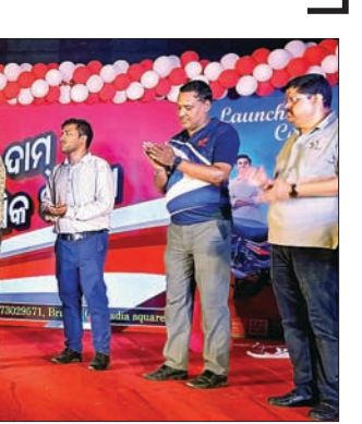
ଅତିଥିକ ଦ୍ୱାରା ଗ୍ରାହକଙ୍କୁ ବାଇକ୍ ଚାରି ଦିଆଯାଇଛି ।

ଏହାକୁ ଚଳୁଥିବା ବେଳେ କମ୍ପାନୀ ଏଭଲି ଏକ ନୂତନ ବାଇକ୍ ପ୍ରସ୍ତୁତ କରିଛି । ଓଡ଼ିଶାର ବାଇକ୍ ଓ ସ୍କୁଟର ବଜାରରେ ହୋଷ୍ଟା ଅଗ୍ରଣୀ ସ୍ଥାନରେ ଥିବା ବେଳେ ବିକ୍ରୟ ନୂତନ ୧୦୦ସିସି ବାଇକ୍ ନିର୍ମାଣର ଆଭିମୁଖ୍ୟ ସମ୍ପର୍କରେ ସୂଚନା ଦେଇଥିଲେ । ହୋଷ୍ଟା କମ୍ପାନୀର ସଂଖ୍ୟାତ୍ମକ ଶ୍ରେଣୀର ବାଇକ୍ ଓ ସ୍କୁଟର ଉତ୍ପାଦନ ଥିଲେ ମଧ୍ୟ ୧୦୦ସିସି ଶ୍ରେଣୀରେ ବାଇକ୍ ଅଭାବ ଅନୁଭୂତ ହେଉଥିଲା । ଏଥିସହିତ ସାଇନ ୧୦୦ ସିସି ବାଇକ୍ ପ୍ରସ୍ତୁତ ପାଇଁ ପୂର୍ବରୁ ଗ୍ରାହକମାନେ ଦାବି କରିଆସୁଥିଲେ ।