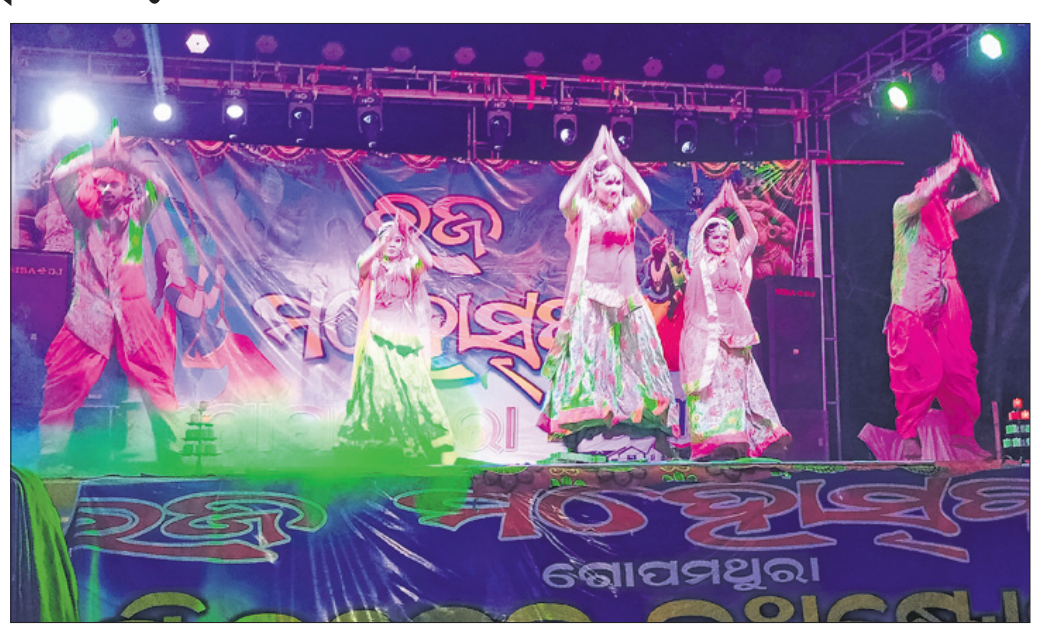
ରଜ ମହୋତ୍ସବର ଉଦ୍‌ଯାପନା ଉତ୍ସବରେ କଳାକାରଙ୍କ ଦ୍ୱାରା ରଙ୍ଗାରଙ୍ଗ ନୃତ୍ୟ ପରିବେଷଣ କରାଯାଇଛି।