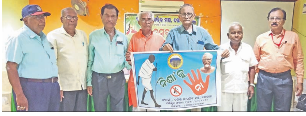
ଅତିଥିମାନେ 'ନିଶାକୁ ନା' ପୋଷ୍ଟର ଉନ୍ମୋଚନ କରୁଛନ୍ତି।