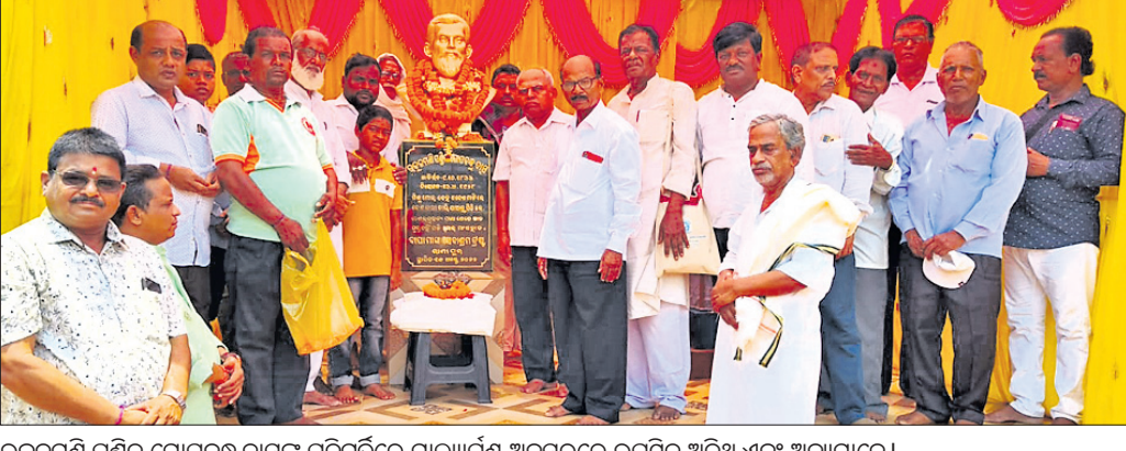
ଉତ୍କଳମଣି ପଣ୍ଡିତ ଗୋପବନ୍ଧୁ ଦାସଙ୍କ ପ୍ରତିମୂର୍ତ୍ତିରେ ମାଲ୍ୟାପର୍ଣ୍ଣ ଅବସରରେ ଉପସ୍ଥିତ ଅତିଥି ଏବଂ ଅନ୍ୟମାନେ।