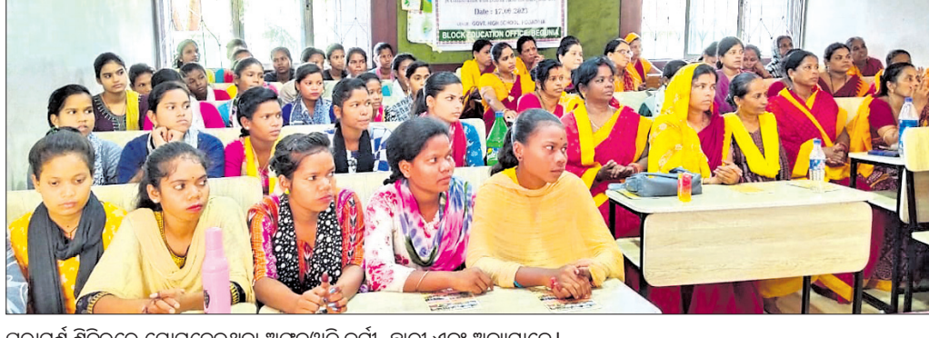
ପରାମର୍ଶ ଶିବିରରେ ଯୋଗଦେଇଥିବା ଅଜନାପ୍ରୀତି କର୍ମୀ, ଛାତ୍ରୀ ଏବଂ ଅନ୍ୟମାନେ।

ଅତିଥି ଲୋକା ଉଦ୍‌ସୋଧନ ଦେଇଥିଲେ। ସେହିପରି ଯଦି ପ୍ରାଥମିକ ଶିକ୍ଷା ଲାଭ ନ କରିବା ତେବେ ଭବିଷ୍ୟତ ଅନ୍ଧାର ବୋଲି କୁହାଯାଏ। ପାଠ ଛାଡ଼ିଥିବା ଛାତ୍ରଛାତ୍ରୀମାନେ କିପରି ସମାଜର ମୂଖ୍ୟ ସ୍ରୋତର ସାମିଲ ହୋଇପାରିବେ ସେଥିରେ ସ୍ପଷ୍ଟତା ଦେବା ଆବଶ୍ୟକ।