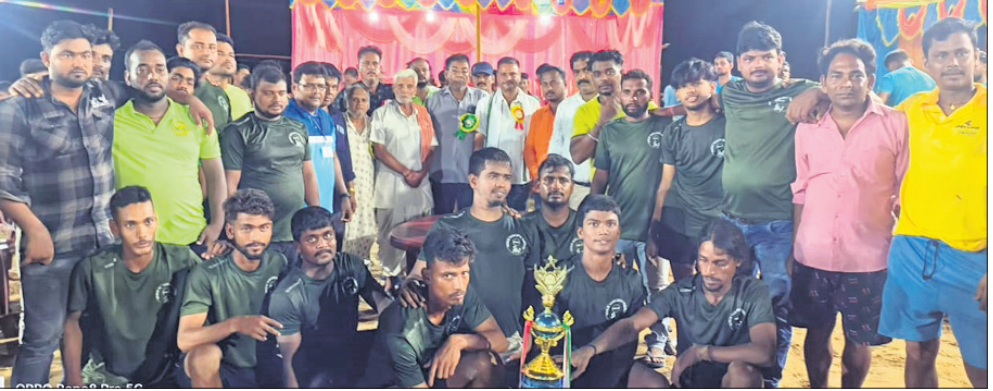
ଅତିଥିଙ୍କ ଗହଣରେ ଚାମ୍ପିୟନ ଦଳର ଖେଳାଳି।