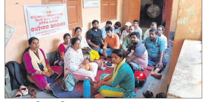
ଧାରଣାରେ ବସିଥିବା ତହସିଲ ରାଜସ୍ୱ କ୍ଷେତ୍ର ଅଧିକାରୀ ସଂଘର ସଦସ୍ୟ ସଦସ୍ୟମାନେ।

ଛକରେ ବିଦ୍ୟୁତ୍ ତାର ସଂସ୍ପର୍ଶରେ ଆସି ଲଗେ ବ୍ୟକ୍ତିଙ୍କ ମୃତ୍ୟୁ ଘଟିଛି। ଏହିପରି ଭାବେ ଗଣା ପାଖାନ୍ତ ଦାୟିତ୍ୱ ହାନିତା ଓ କରକର୍ତ୍ତୃକମାନଙ୍କୁ କାରଣକୁ ବହୁ ଧନକାଶ୍ଚର ହାନି ଘଟିଛି। ସ୍ଥାନୀୟ ଅନୁରୋଧ, ନିର୍ଦ୍ଦେଶକଙ୍କୁ ଓ ଉଚ୍ଚତମ ବିଦ୍ୟୁତ୍ ବିଭାଗ କାର୍ଯ୍ୟାଳୟରେ ବିଦ୍ୟୁତ୍ କାଟ ଯୋଗୁ କୋମଳମତି ଶିଶୁ, ରୋଗାଗ୍ରସ୍ତ ବ୍ୟକ୍ତି, ବୃଦ୍ଧାବସ୍ଥାରେ ବହୁ ଦୁର୍ଦ୍ଦଶାର ସମ୍ମୁଖୀନ ହେଉଥିବା ଅଭିଯୋଗ ହୋଇଛି। ଏନେଇ ସ୍ଥାନୀୟ ଅଞ୍ଚଳରେ ନିରବଚ୍ଛିନ୍ନ ବିଦ୍ୟୁତ୍ ସେବା ଯୋଗାଇବା ସହ ଗଣା ପାଖାନ୍ତ ବିରୋଧରେ ଦୃଢ଼ କାର୍ଯ୍ୟାନୁଷ୍ଠାନ ନେବାକୁ ସାମାଜିକ କର୍ମୀ ଯାଚୁଥିଲେ। ଅନୁରୋଧ ଭାବେ କଟକଟା ପଞ୍ଚାୟତର ପରିଷଦଙ୍କୁ କୁମାରଙ୍କୁ ଗ୍ରାମରେ ମଧ୍ୟ ବିଦ୍ୟୁତ୍ ତାର ସଂସ୍ପର୍ଶରେ ଆସି ୨ଟି ନିର୍ଦ୍ଦେଶକଙ୍କୁ ବିଦ୍ୟୁତ୍ ବିଭାଗରୁ ନିର୍ଦ୍ଦେଶକଙ୍କୁ ଆନାରେ ଲିଖିତ ଅଭିଯୋଗ ହୋଇଥିଲା। ସେହିପରି ଅନୁରୋଧରେ ମଧ୍ୟ କ୍ଷେତ୍ରରେ ତତ୍ତ୍ୱ ବିଦ୍ୟୁତ୍ କାର୍ଯ୍ୟ କରୁଥିବା ବେଳେ ସଂସ୍ପର୍ଶରେ ଆସିଥିବା ଯୋଗୁ କଣ୍ଠ କର୍ମଚାରୀ ବିଦ୍ୟୁତ୍ ତାର ସଂସ୍ପର୍ଶରେ ଆସିଥିବାରୁ ତାଙ୍କ ମୃତ୍ୟୁ ଘଟିଛି। କଟକ-ଗାନ୍ଧୀନୀ ରାସ୍ତାରେ କେନ୍ଦୁପାଟଣା