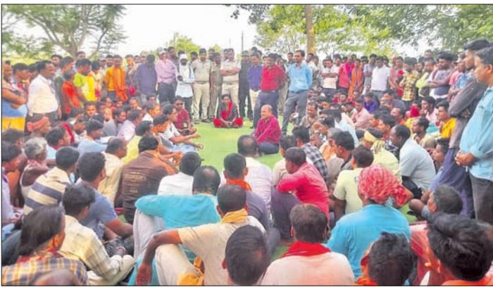
ପ୍ରଶାସନିକ ଅଧିକାରୀମାନେ ଉତ୍ତମ ଲୋକଙ୍କ ସହ ଆଲୋଚନା କରୁଛନ୍ତି।

ସଜ୍ଜା କରିବାକୁ ମନା କରିଥିଲେ। ଏହାପରେ ମୃତଦେହର ଲୋକେ ଘଟଣା ସମ୍ପର୍କରେ ଉତ୍ତରକୋଟ ଥାନାରେ ଅଭିଯୋଗ କରିଥିଲେ। ଉତ୍ତରକୋଟ ଉପଖଣ୍ଡ ଅଧିକାରୀ, ସ୍ଥାନୀୟ ଡାକ୍ତରଖାନାରେ ପହଞ୍ଚି ଗ୍ରାମବାସୀଙ୍କୁ ବୁଝାଣୁଣା କରିଥିଲେ। ଘଟଣା ସମ୍ପର୍କରେ ପଞ୍ଜୀକୃତ ହେବା ପରେ ଗ୍ରାମବାସୀଙ୍କୁ ନେଇ ସଜ୍ଜା କରାଯିବାରୁ ନେଇ