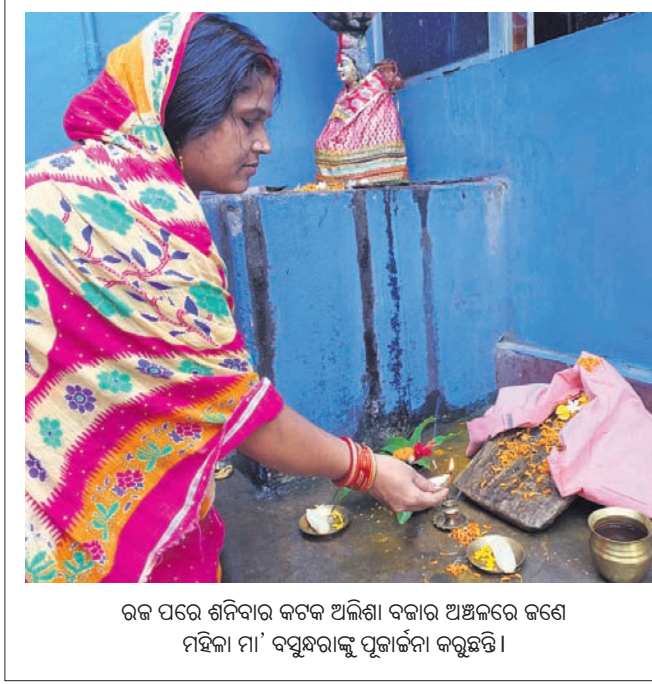
ରଜ ପରେ ଶନିବାର କଟକ ଅଲିଶା ବଜାର ଅଞ୍ଚଳରେ ଜଣେ ମହିଳା ମା' ବସୁନ୍ଧରାଙ୍କୁ ପୂଜାର୍ଚ୍ଚନା କରୁଛନ୍ତି।

ସବୁ ନିର୍ମାଣ କାର୍ଯ୍ୟ ପ୍ରାୟ ଶେଷ ହୋଇଛି। ଏହାକୁ ପରିଚାଳନା କରିବା ପାଇଁ କଟକ ମହାନଗର ନିଗମ କିଛି ଭାରତୀୟ ପ୍ରଫେସର ବିଭାଗକୁ ଦାୟିତ୍ୱ ହସ୍ତାନ୍ତର କରାଯିବ। ଅପରପକ୍ଷରେ ଗଡ଼ଖାଲର ପୁନରୁଦ୍ଧାର ଓ ଉନ୍ନତୀକରଣ ପାଇଁ ୨୦୧୦ରେ ମୁଖ୍ୟମନ୍ତ୍ରୀ ଭିଜିପ୍ରସ୍ତର ସ୍ଥାପନ କରିଥିଲେ। ଇତିମଧ୍ୟରେ ଦୀର୍ଘ ବର୍ଷ ବିତ୍ୟାପନରେ ମଧ୍ୟ କିଛି ମିଗର ପାଟେରି ନିର୍ମାଣ କାମ ହୋଇଛି। ସେହିପରି ଅଧାପଡ଼ିଆ ଭାବେ ଦଳ କାଢି ଭାରତୀୟ ପ୍ରଫେସର ବିଭାଗ, ସିଏନସି ଓ ଜିଲ୍ଲା ପ୍ରଶାସନ ନାରବ ରହିଥିବା ସାଧାରଣରେ ଆଲୋଚନା ହୋଇଛି। ଦୁଇଟି ସଂପ୍ରତି ବୃଷ୍ଟି ଦିଆଯିବା ପାଇଁ ସ୍ଥାନୀୟ ଲୋକେ ଦାବି କରିଛନ୍ତି।