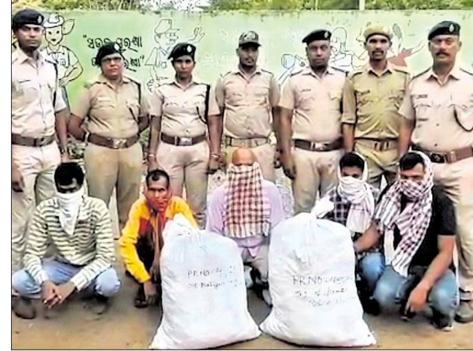
ଗିରଫ ୫ ଅଭିଯୁକ୍ତ ଏବଂ ଜବତ ଗଞ୍ଜୋଇ।