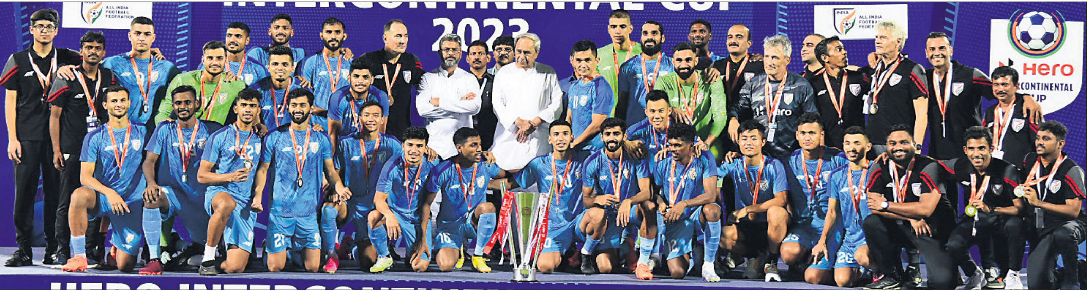
ପୁଷ୍ୟମନ୍ତ୍ରୀ ନବୀନ ପଟ୍ଟନାୟକ ଓ ଏଆଇଏସ୍‌ଏସ୍ ସଭାପତି କଲ୍ୟାଣ ଚୌବେକ୍ ଗହଣରେ ଚାମ୍ପିୟନ ଟ୍ରଫି ସହ ଭାରତୀୟ ଦଳ ।