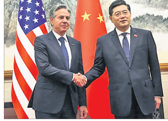
ଚାଇନା ବହିଷ୍କାର ପତ୍ରା କ୍ରିନ୍ ଗାଙ୍ଗୁଲୀ ସହ ଆମେରିକା ପରାମର୍ଶ ସଚିବ ଆଣ୍ଡ୍ରୀୟା ବ୍ଲେକ୍ (ବାମ)।

କ୍ରିକେଟରେ ଜଣେ ନିଶାଗ୍ରସ୍ତ ତଥା ଅଧିକାରୀଙ୍କୁ ଘରକୁ ନେଇଯାଇ ବଳାହାର କରିବା ଅଭିଯୋଗରେ ଜଣେ ଭାରତୀୟ ଛାତ୍ରକୁ ଗିରଫ କରାଯାଇଛି।