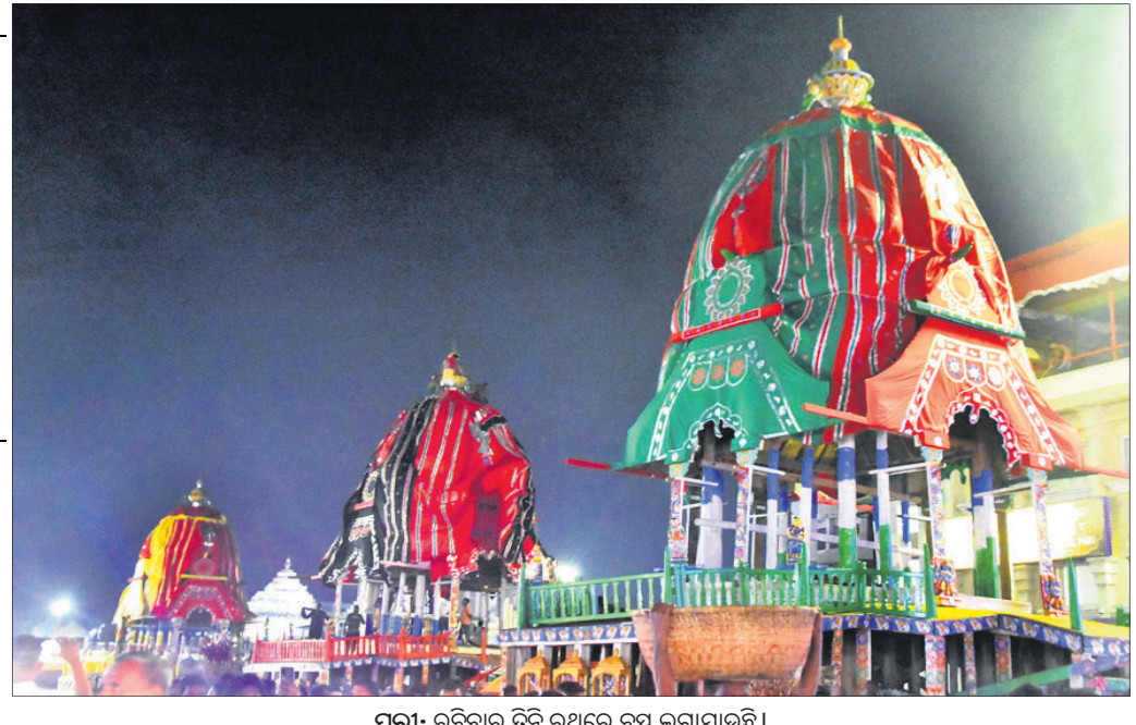
ପୁରୀ: ଉଦ୍ଦେଶ୍ୟ ଡାଇଲଗ୍ ରଥରେ ବସି ଲଗାଯାଇଛି।