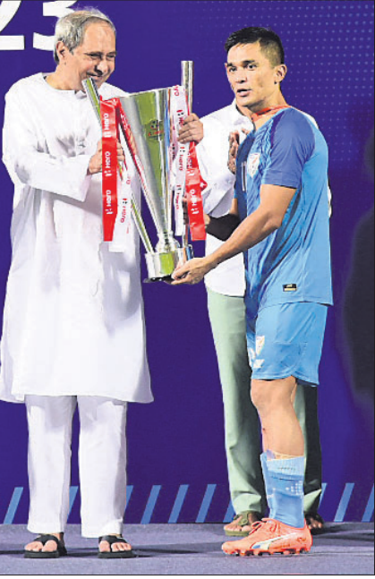
ମୁଖ୍ୟମନ୍ତ୍ରୀ ନବୀନ ପଟ୍ଟନାୟକ ଭାରତୀୟ ଦଳର ଅଧିନାୟକ ସୁନୀଲ ଛେଟ୍ରୀଙ୍କୁ ରୂପି ପ୍ରଦାନ କରୁଛନ୍ତି।