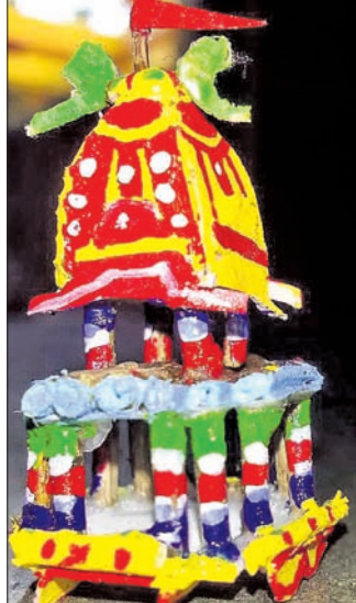
ତୁଳସୀ କାଠିରେ ନିର୍ମିତ ରଥ।

ଇଚ୍ଛା ହୋଇଥିଲା। ଏଥିପାଇଁ ପୂର୍ବରୁ ପୂର୍ଣ୍ଣ ରିସର୍ଚ୍ଚ କରିଥିଲେ। ଆଜିପର୍ଯ୍ୟନ୍ତ କେହି ବି ତୁଳସୀ କାଠିରେ ପାଖାପାଖି ୧ ଲକ୍ଷର ରଥ ପ୍ରସ୍ତୁତ କରିନାହାନ୍ତି। ସେଥିପାଇଁ ତୁଳସୀ କାଠିରେ ନିର୍ମିତ ଏହି ରଥ ବିଶ୍ୱର ଉଦ୍ଦେଶ୍ୟରେ ରଥ ପ୍ରସ୍ତୁତ କରିବା ପାଇଁ