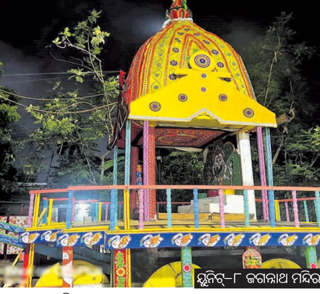
ଧୂଳି-୮ ଜଗନ୍ନାଥ ମନ୍ଦିର

ଗ୍ରୀଷ୍ମ ନିୟନ୍ତ୍ରଣ ପାଇଁ ରଥଚରଣ ଆରମ୍ଭ ହେବା ସମୟରେ ଯାନବାହନକୁ ଫାଇରଫାଇଟିଂ ପାଖରୁ ଦୂରରେ ରଖାଯିବ। ତଳ ରାସ୍ତାରେ କୌଣସି ଗାଡ଼ିକୁ ଛଡ଼ାଯିବ ନାହିଁ। ଏଥିସହ ମନ୍ଦିରରୁ ରଥ ବାହାରି ଯିଆର୍ପି ଦେଇ ଯିବା ସମୟରେ ରଥକୁ ସମାନ ଦେଇ କୌଣସି ଗାଡ଼ି ଓଭରଡ୍ରିଭ୍ ଉପରେ ଯିବନାହିଁ। ରଥଯାତ୍ରା ସମୟରେ ବର୍ଷା ହେଲେ ତୁରନ୍ତ ଆବଶ୍ୟକ ସଂଖ୍ୟକ ମଟରପମ୍ପ ପକାଇ ପାଣି ନିଷ୍କାସନ କରାଯିବା ନେଇ ବ୍ୟବସ୍ଥା ହୋଇଛି। ଖରା ହେଲେ ବିଏମ୍‌ସି ପକ୍ଷରୁ ପାଣି ସିଞ୍ଚନ କରିବା, ଲ-ଟ୍ୟାଲେଟ୍‌ର ବ୍ୟବସ୍ଥା କରିବା, ଓଭରହେଟ୍ କେବୁଲ୍ ହଟାଇବା, କ୍ୟାପଟାଳ ହସ୍ତିତାଳ ପକ୍ଷରୁ ଫାଷ୍ଟବର୍‌ର ବ୍ୟବସ୍ଥା କରାଯାଇଛି।