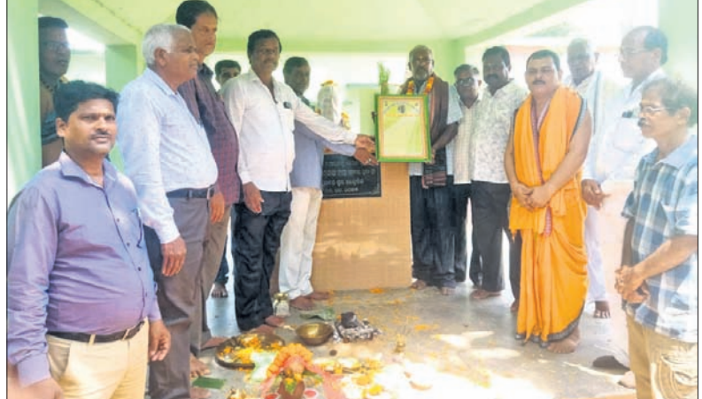
ବାଙ୍କୀ ପୂଜ୍ୟପୂଜା ସଂସ୍କୃତି ପୁରଣା ଅଭିଯାନ ପକ୍ଷରୁ ଗୋପବନ୍ଧୁଙ୍କ ଶ୍ରାଦ୍ଧ ଦିବସ ପାଳନ କରାଯାଇଛି ।

ବାଙ୍କୀ/ସାଲେପୁର/ଚୌଦ୍ୱାର, ୧୮୬(ଈନ୍ଦ୍ରମୋହନ ମୋହନ ମିଶ୍ର/ଅରବିନ୍ଦ ଭୂୟାଁ/ଆଶୁତୋଷ ଦାସ)୧୮୬: