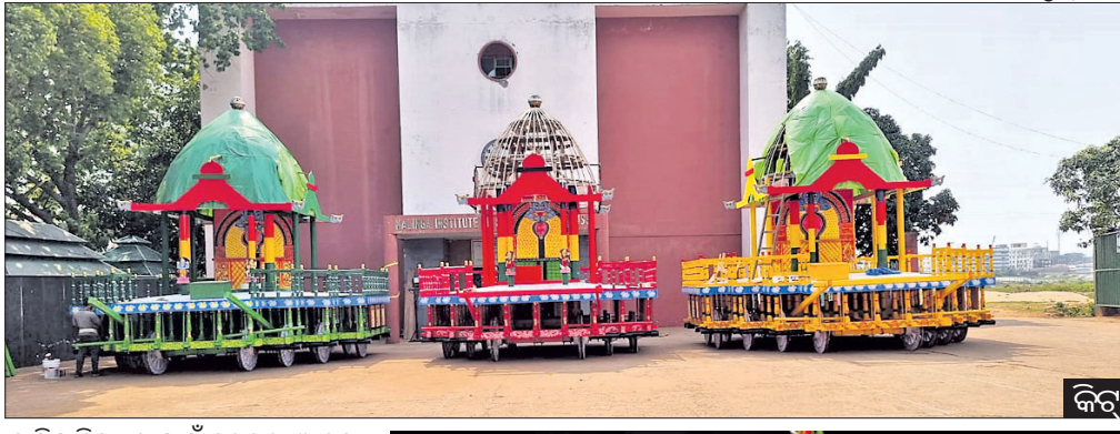
କିଟ୍ ଜଗନ୍ନାଥ ମନ୍ଦିର : ରଥଯାତ୍ରା ସହ ଭଜନ ସମାରୋହ

ରାତି ପାହିଲେ ବିଶ୍ୱ ପ୍ରସିଦ୍ଧ ରଥଯାତ୍ରା। କାଳିଆ ଠାକୁର ସାଙ୍ଗରେ ବଡ଼ଭାଇ ବଳଭଦ୍ର ଓ ଭଉଣୀ ସୁଭଦ୍ରାଙ୍କୁ ଧରି ରଥରେ ମାଉସୀ ମା' ଘରକୁ ଯିବେ। ଚେରୁ ରଥାରୁତ୍ତ ଚେରୁମୂର୍ତ୍ତିଙ୍କୁ ଦର୍ଶନ କରିବା ସହିତ ରଥଚାରିବା ପାଇଁ ଅଗଣିତ ଭକ୍ତ ଆଜ୍ଞାକରାଣୀ ସହ ଆପେକ୍ଷା କରି ରହିଛନ୍ତି। ପୁରୀ ଭଳି ରାଜଧାନୀ ଭୁବନେଶ୍ୱରର ବିଭିନ୍ନ ଜଗନ୍ନାଥ ମନ୍ଦିରରେ ରଥଯାତ୍ରା ପାଇଁ ବ୍ୟାପକ ଆୟୋଜନ କରାଯାଇଛି। ଏହା ପୂର୍ବରୁ ସୋମବାର ନବଯୌବନ ବେଶରେ ଭକ୍ତଙ୍କୁ ଦର୍ଶନ ଦେବେ ଠାକୁର।