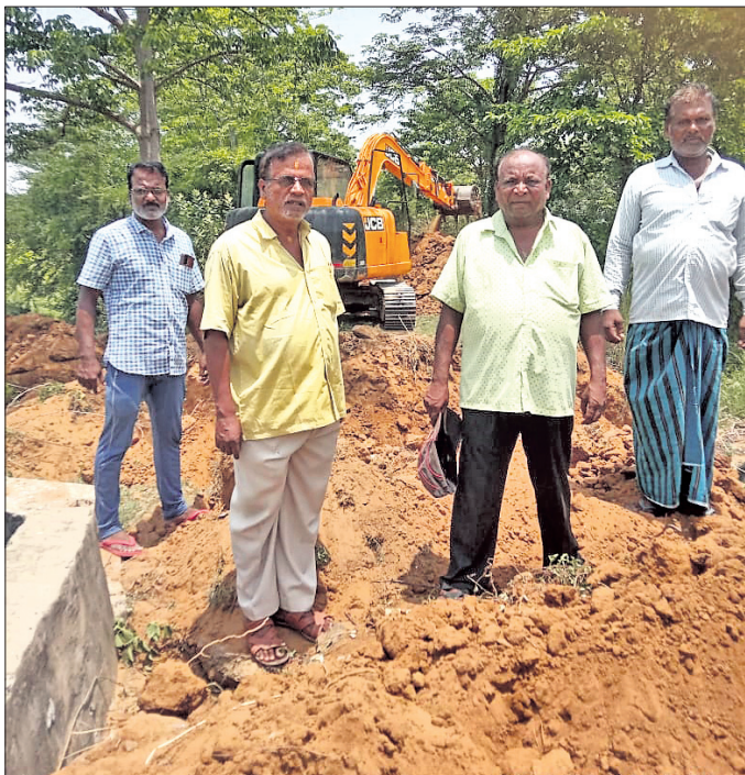
ଚେକ୍‌ଡ୍ୟାମ ଭଙ୍ଗାଯିବା ସହ ମୁହଁଗୁ ଓସାର କାର୍ଯ୍ୟ ଚାଲିଛି।

ବଡ଼ମ୍ବା ବାଲିଜୋରି ଓ ସିଆରିଆ ନାଳକୁ ବର୍ଷା ଜଳ ନିଷ୍କାସନ ହେବା ପାଇଁ ଜଳସେଚନ ବିଭାଗ ତରଫରୁ ଉଦ୍ୟମ ଆରମ୍ଭ ହୋଇଛି। ଜଳ ନିଷ୍କାସନରେ ପ୍ରତିବନ୍ଧକ ସୃଷ୍ଟି କରୁଥିବା ବାଲିଜୋରିର ନାଳ ମୁହଁରେ ନିର୍ମିତ ଚେକ୍‌ଡ୍ୟାମକୁ ସମ୍ପୂର୍ଣ୍ଣ ଭଙ୍ଗାଯାଇଛି। ଏଥିସହ ସିଆରିଆ ମୁହଁରେ ରହିଥିବା ମୁହଁଗୁଡ଼ିକୁ ଲାଗି ଅନ୍ୟ ଏକ ମୁହଁଗୁ ଓସାର କାର୍ଯ୍ୟ ଚାଲିଛି। ସୂଚନାଯୋଗ୍ୟ, ବଡ଼ମ୍ବା ଅଞ୍ଚଳର ଶଙ୍ଖାମେରା, କନ୍ତପଡ଼ା, ଦେଉଳି, ଗୋପମଥୁରା, ମଙ୍ଗରାଜପୁର, ଝାଡ଼ିଆ, ବିଶ୍ୱମରପୁର, ବୃନ୍ଦାବନପୁର, ଗଡ଼ାପୋଖରୀ ଦେଇ ବାଲିଜୋରି ଓ ସିଆରିଆ ନାଳ ପ୍ରବାହିତ ହେଉଛି। ରକ୍ଷଣାବେକ୍ଷଣ ଅଭାବରୁ କାଳକ୍ରମେ ଏହା ପୋତି ହେବାରେ ଲାଗିଛି।