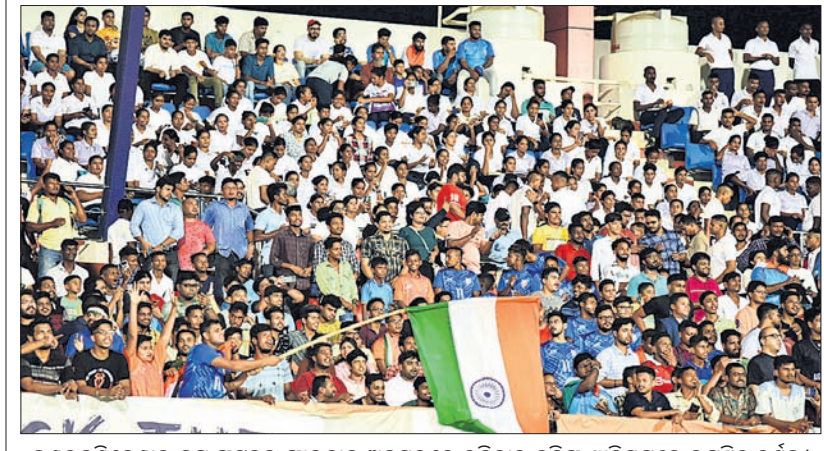
ଇଣ୍ଡିଆନ୍ ଫୁଟବଲ୍ ଫାଇନାଲ୍ ଅବସରରେ ରବିବାର କଳିଙ୍ଗ ଷ୍ଟୁଡିୟମ୍ରେ ଉପସ୍ଥିତ ଦର୍ଶକ ।

ପୁରସ୍କାର ଚାମ୍ପିୟନ: ଭାରତ (୫୦,୦୦୦ ଆନେରିକାୟ ଡଲାର) ରନରଅପ୍: ଲେବାନନ୍ (୨୫,୦୦୦ ଆନେରିକାୟ ଡଲାର) ହିରୋ ଅଫ୍ ଦି ଟୁର୍ନାମେଣ୍ଟ: ସହେଶ୍ ଝିଙ୍ଗାନ୍ (୧,୫୦,୦୦୦ଟଙ୍କା) ହିରୋ ପ୍ଲେୟର ଅଫ୍ ଦି ମ୍ୟାଚ୍: ଲାଲିଆଞ୍ଜୁଲା ଚାଙ୍ଗଟେକ୍ ଟପ୍ ସ୍କୋରର: ସୁନୀଲ ଛେଟ୍ରୀ ଓ ଲାଲିଆଞ୍ଜୁଲା ଚାଙ୍ଗଟେକ୍ (୨ଟି ଲେଖାଏ ଗୋଲ) ପହଞ୍ଚାଇଥିଲେ । ଲେବାନନ୍ ସାବେ କିନ୍ତୁ ବଲ୍‌କୁ ନିୟନ୍ତ୍ରଣ କରିପାରି ନ ଥିଲେ । ସେ ବଲ୍ ନିକଟରେ ପୁଣି ପହଞ୍ଚିବାକୁ ଉଦ୍ୟମ କରିଥିଲେ ମଧ୍ୟ ତାଙ୍କ ପୂର୍ବରୁ ଚାଙ୍ଗଟେକ୍ ପହଞ୍ଚି ଗୋଲପୋଷ୍ଟକୁ ପଠାଇ ଦେଇଥିଲେ ।