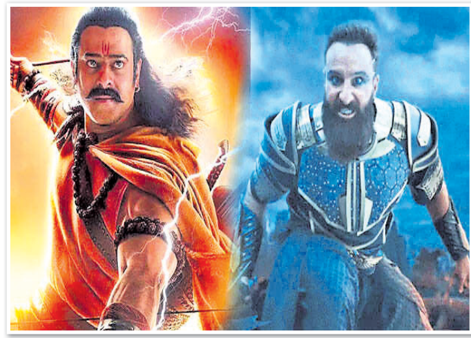
ଭୁବନେଶ୍ୱର, ୧୮ (ଶର୍ମିଷ୍ଠା ପାଣିଗ୍ରାହୀ)

ରାମାୟଣ କଥାବସ୍ତୁକୁ ନେଇ ଭିନ୍ନ ଭାବେ ପ୍ରସ୍ତୁତ ଚଳଚ୍ଚିତ୍ର 'ଆଦିପୁରୁଷ' ଏବେ ବିବାଦରେ ଛଦି ହୋଇଯାଇଛି। ହିନ୍ଦୀ, ତେଲୁଗୁ ଆଦି ଭିନ୍ନ ଭାଷାରେ ରିଲିଜ୍ ହୋଇଥିବା ଏହି ଚଳଚ୍ଚିତ୍ରରେ ରହିଥିବା ଚରିତ୍ରର ବେଶଭୂଷା, ଡାଇଲଗ୍ ଓ ତଥ୍ୟକୁ ନେଇ ଦେଶବ୍ୟାପୀ ବିରୋଧ କରାଯାଇଛି। ଏଭଳି ଅନେକ ପ୍ରସଙ୍ଗକୁ ନେଇ ବିବାଦ ଉପୁଜିଛି। ଚଳଚ୍ଚିତ୍ରର ଟ୍ରେଲର ରିଲିଜ୍ ସମୟରେ ଏହା ଦର୍ଶକଙ୍କୁ ବେଶ୍ ପସନ୍ଦ ଆସିଥିଲା। କିନ୍ତୁ ଟିକର ରିଲିଜ୍ ପରେ ପ୍ରତିକ୍ରିୟା ଆରମ୍ଭ ହୋଇଥିଲା। ଶୁକ୍ରବାର