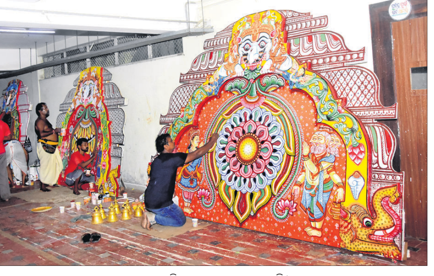
ରଥ ପ୍ରଭାରେ ଚିତ୍ରକରମାନେ ରଙ୍ଗ ଦେଉଛନ୍ତି।