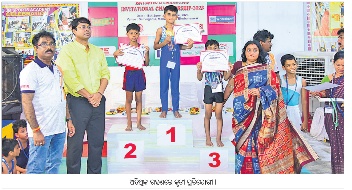
ଅତିଥିଙ୍କ ଗହଣରେ କୃତୀ ପ୍ରତିଯୋଗୀ।