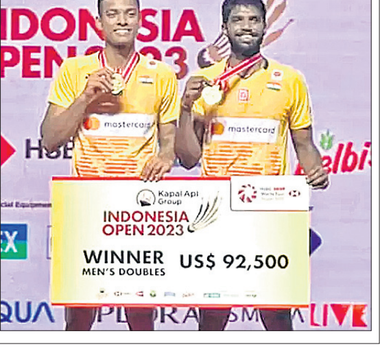
INDONESIA OPEN 2023 MEN'S DOUBLES WINNER US$ 92,500