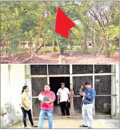
ଚିନିଶିଳ୍ପ ବାଜ୍ୟାପ୍ତି ପାଇଁ ନାଲିପତାକା ଲାଗିଛି।