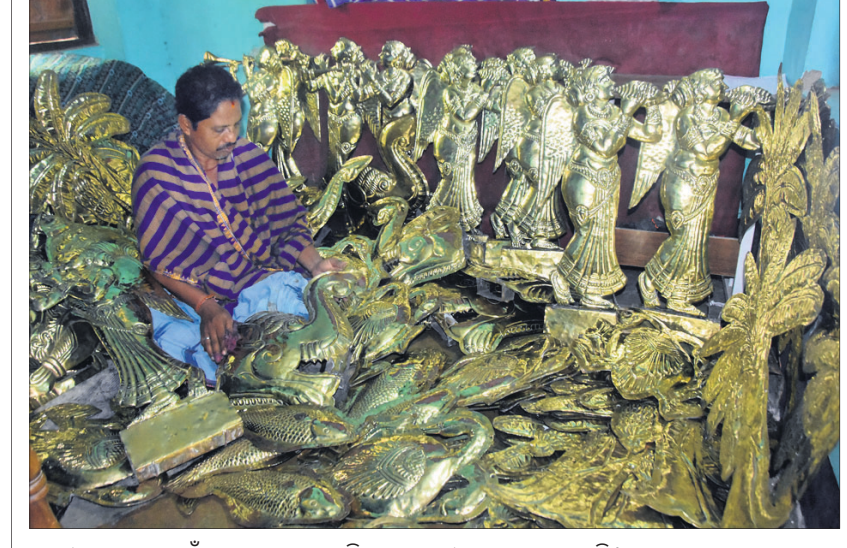
ପୁରୀ ରଥଯାତ୍ରା ପାଇଁ ରଥରେ ଲାଗୁଥିବା ପିତଳ ସାମଗ୍ରୀକୁ ସଫା କରାଯାଇଛି।

କାହାଣୀ, ଶିଶୁ ଗୀତ, କବିତା ଆଦି ଆଦି ସହ ଯୋଡ଼ାଯିବ। ଏହାଦ୍ୱାରା ପିଲାଙ୍କ ସ୍ମୃତିଶକ୍ତି ଓ ସଂଖ୍ୟା ଜ୍ଞାନ ବୃଦ୍ଧି ହେବ। ବିଦ୍ୟାଳୟରେ ତିସପ୍ନେ ବୋର୍ଡ ରହିବା ସହ ପିଲାଙ୍କ ସ୍ୱାଭାବ ପ୍ରକୃତ ହସ୍ତକଳା ସେଥିରେ ପ୍ରଦର୍ଶନ କରାଯିବ। ସେହିପରି ଆଦିବାସୀ ଅଞ୍ଚଳର ପିଲାଙ୍କ ପାଇଁ ସେମାନଙ୍କ ଆଞ୍ଚଳିକ ଭାଷାରେ ପାଠପଢ଼ାକୁ ଗୁରୁତ୍ୱ ଦିଆଯିବ। ଏକ ସ୍ୱତନ୍ତ୍ର କକ୍ଷରେ ପିଲାଙ୍କ ପାଇଁ ବିଭିନ୍ନ ଖେଳା, କ୍ୟାମିଟି ବୋର୍ଡ, କ୍ଲବ୍, ବିଭିନ୍ନ ପଶୁ, ପକ୍ଷୀ ଆଦି ଆକୃତିର ଖେଳା ରଖାଯିବ। ଏ ସମସ୍ତ ପ୍ରକ୍ରିୟା ପରିଚାଳନା ପାଇଁ ଜଣେ ଦକ୍ଷ ଶିକ୍ଷକଙ୍କୁ ଦାୟିତ୍ୱ ଦିଆଯିବ। ସେହିପରି କାର୍ଯ୍ୟକ୍ରମର ପରିଚାଳନା ଦାୟିତ୍ୱରେ ଜିଲା ଓ ବ୍ଲକ୍ ଶିକ୍ଷାଧିକାରୀଙ୍କ ସମେତ, ଡିପିସି, ସିଆର୍‌ସିସି ପ୍ରମୁଖ ରହିବେ।