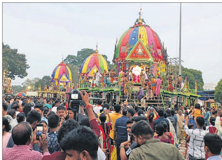
ରଥାରୁଡ଼ ଶ୍ରୀକାଳ୍ପଙ୍କ ଦେଖିବା ପାଇଁ ବାରିପଦାରେ ଶ୍ରୀକାଳ୍ପଙ୍କ ଭିଡ଼।