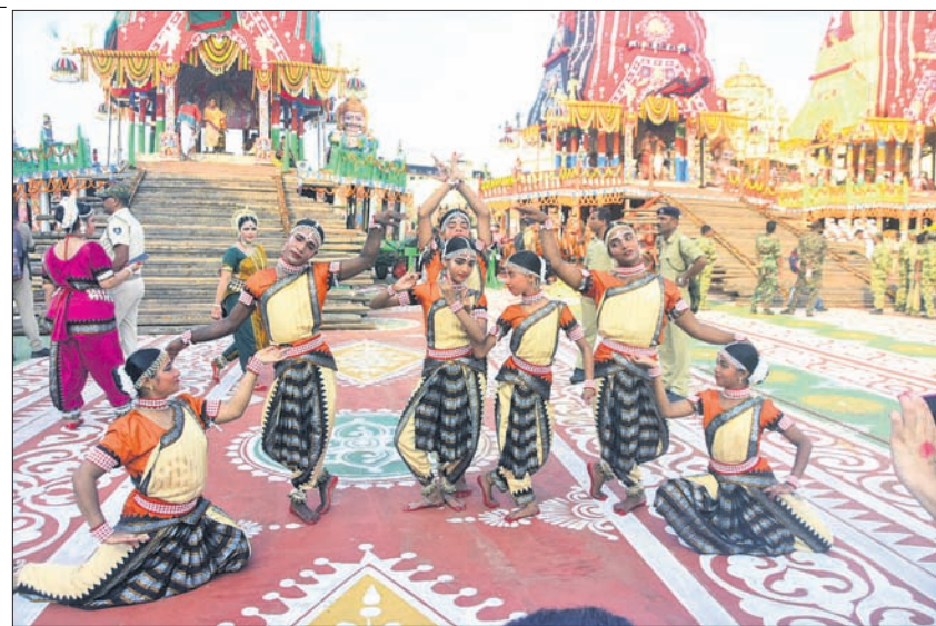
ପୁରୀ ଶ୍ରୀମନ୍ଦିର ସମ୍ମୁଖ ତିନି ରଥ ଆଗରେ କଳାକାରମାନେ ନୃତ୍ୟ ପରିବେଷଣ କରୁଛନ୍ତି।