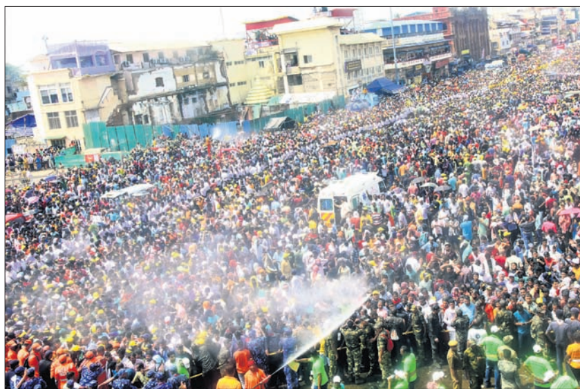
ବଡ଼ଦାଣ୍ଡରେ ଭକ୍ତଙ୍କୁ ଖରା ଦାଉରୁ ରକ୍ଷା କରିବା ପାଇଁ ପାଣି ସିଞ୍ଚନ କରାଯାଇଛି।