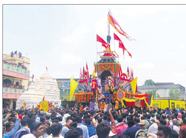
ବରଗଡ଼ର ଭରଲିଠାରେ ଅଭିଷିକ୍ତ ରଥଯାତ୍ରା।