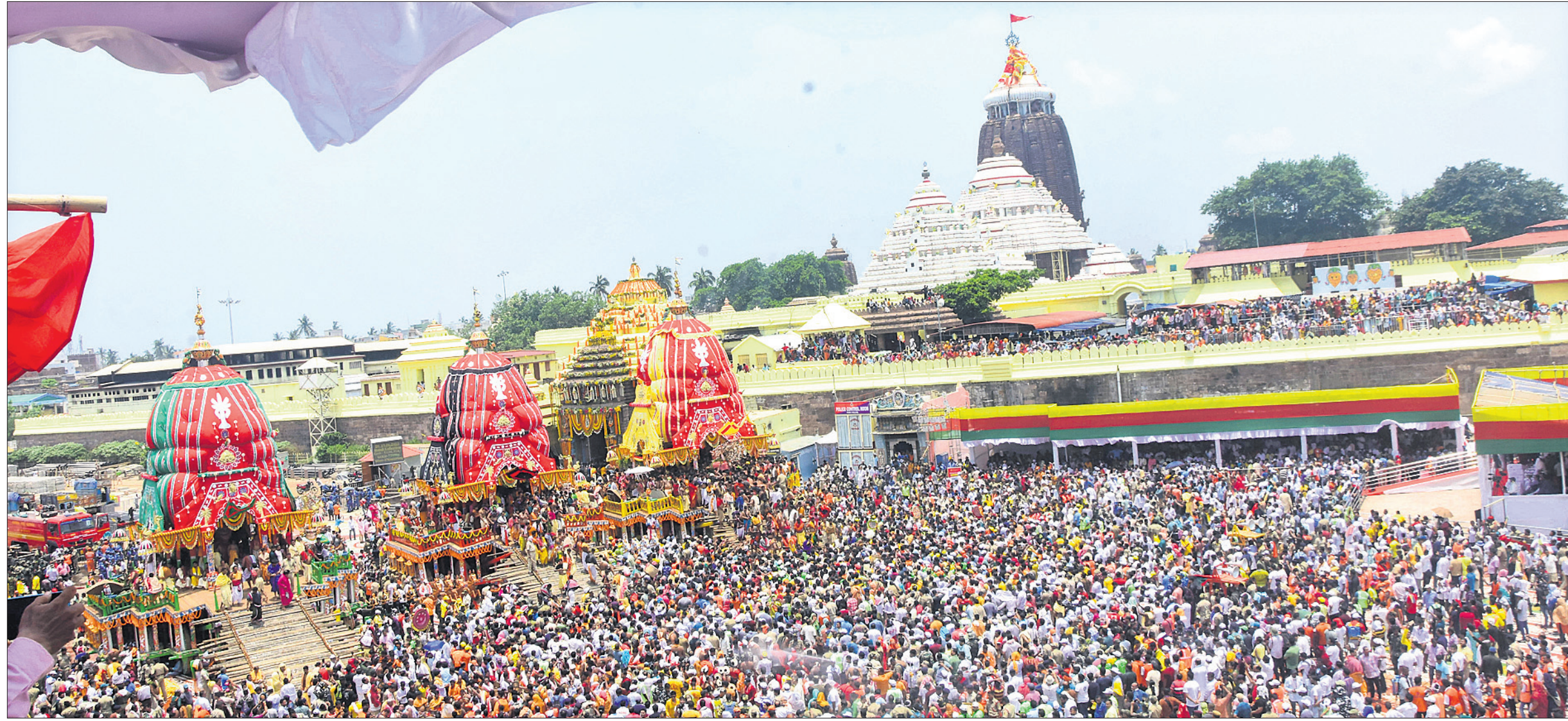
ପୁରୀ ବଡ଼ଦାଣ୍ଡରେ ଜନସମୂହ: ତିନି ରଥ ଚାରିବାଜୁ ଶ୍ରୀକାଳ୍ପଙ୍କ ପ୍ରବଳ ଭିଡ଼।