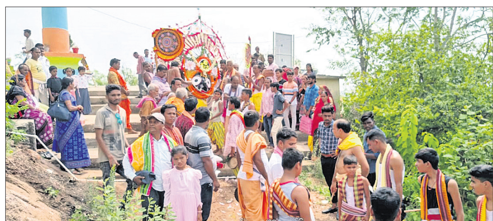
ସୁବର୍ଣ୍ଣପୁର ଜିଲ୍ଲା ଉଲୁଣ୍ଡା ବ୍ଲକ୍ ପାଟଳି ଶ୍ରୀକ୍ଷେତ୍ରରେ ଠାକୁରଙ୍କୁ ପହଞ୍ଚି କରାଯାଇଛି।