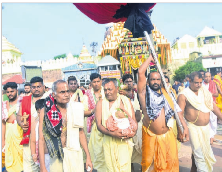
ଶ୍ରୀକ୍ଷେତ୍ରରେ ରଥ ପ୍ରତିଷ୍ଠା ଠାକୁରଙ୍କୁ ପୂଜା ପାଇଁ ରଥ ଅଭିଯୁକ୍ତ ନିଆଯାଇଛି।