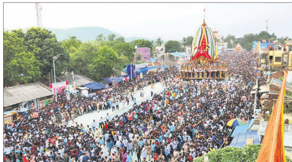
କେନ୍ଦୁଝର ରଥଦାଣ୍ଡରେ ଭକ୍ତଙ୍କ ଗହଣରେ ବଳଦେବଜୀଉଙ୍କ ରଥ।