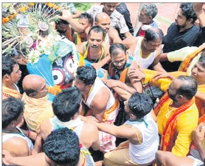
କୋରାପୁଟ ଶାବର ଶ୍ରୀକ୍ଷେତ୍ରରେ ଶ୍ରୀଜଗନ୍ନାଥଙ୍କ ପହଞ୍ଚି କରାଯାଇଛି।