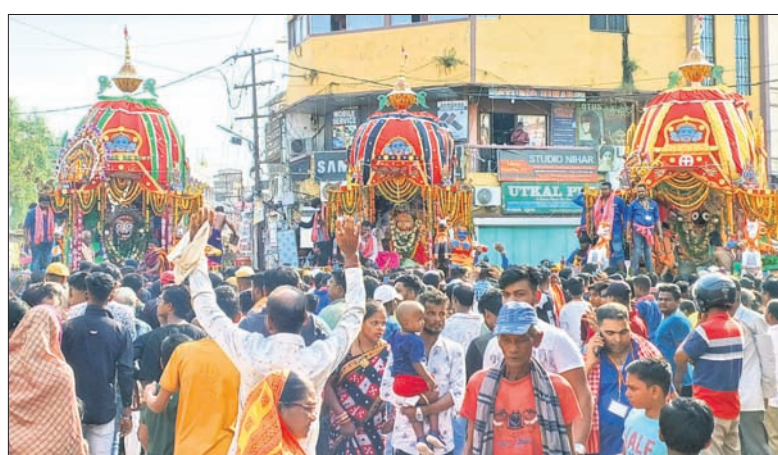
କଟକ ବୋକପୁଣ୍ଡାରେ ରଥରୁ ତିନି ଠାକୁର।