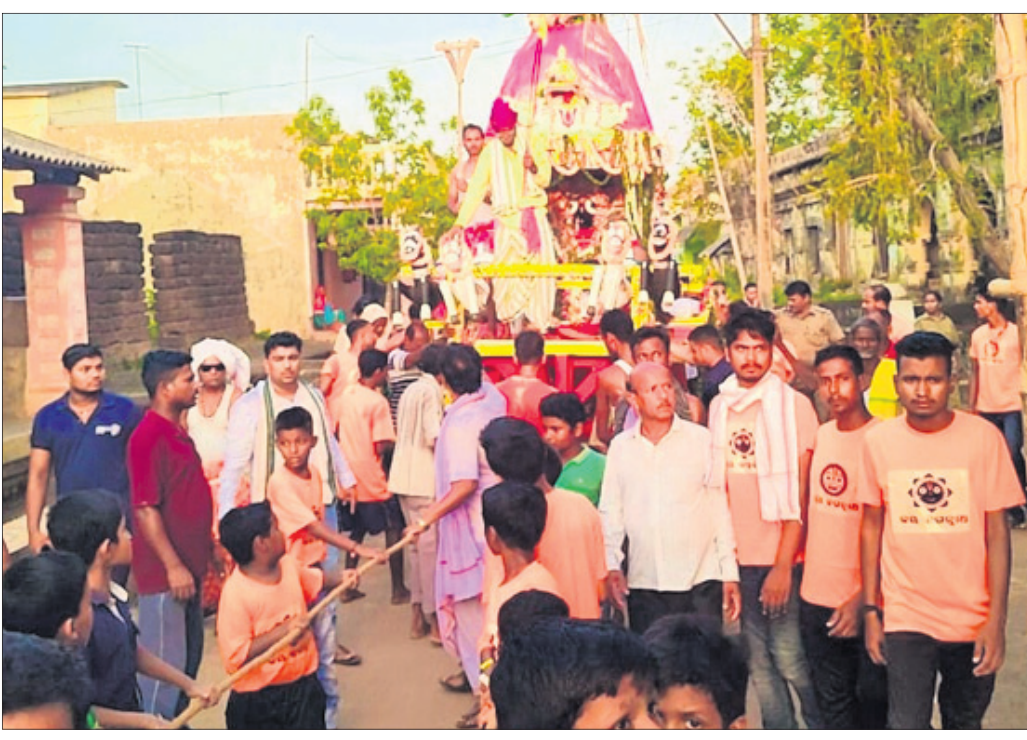
ପତିତପାବନ ରଥକୁ ଶ୍ରୀକାଳୁମାନେ ଚାଣ୍ଡି ଚାଣ୍ଡି ନେଉଛନ୍ତି।

ନିରାକାରପୁର, ୨୦୧୩ (ମାନସ ବନ୍ଦୁ ପଟ୍ଟନାୟକ): ଓଳସିଂହର ବିଜେ ଶ୍ରୀପତିପାବନ ଦେବଙ୍କ ଷଷ୍ଠ ଘୋଷଯାତ୍ରା ଅବସରରେ ମଙ୍ଗଳବାର ଅପରାହ୍ନ ୧ଟାରେ ରାତିକାଟି ଅନୁଯାୟୀ ପଞ୍ଚିତ ବୁଦ୍ଧବନ୍ଧୁ ତ୍ରିପାଠୀଙ୍କ ଦ୍ୱାରା ରଥ ପ୍ରତିଷ୍ଠା କରାଯାଇଥିଲା। ୨୮ଟାରେ ଶ୍ରୀକାଳୁଙ୍କ ପହଞ୍ଚି କରାଯାଇଥିଲା। ଭକ୍ତଙ୍କ ଗହଣରେ ଗ୍ରାମର ଦେବଦାଳ ବନ୍ଦିଶଳ ଛେରାପହଞ୍ଚା କରିଥିଲେ। ଅପରାହ୍ନ ୪ଟାରେ ରଥଟା ଆରମ୍ଭ ହୋଇଥିଲା। ପତିତପାବନଙ୍କ ରଥକୁ ଭକ୍ତମାନେ ଚାଣ୍ଡିବା ସହ ଗ୍ରାମ ପରିକ୍ରମା କରି ସନ୍ଧ୍ୟା ୬ଟାରେ ଗୁଣ୍ଡିଚା ମନ୍ଦିରଠାରେ ପହଞ୍ଚିଥିଲେ। ଏହି କାର୍ଯ୍ୟକ୍ରମରେ ଜଣେଶୁଣ୍ଠା ବୈଦିଗଞ୍ଜନଙ୍କ ସମେତ ସ୍ଥାନୀୟ ସରପଞ୍ଚ, ସମିତି ସଭ୍ୟ ଓ ଗ୍ରାମବାସୀ ସହଯୋଗ କରିଥିଲେ। କଳିଆ ଥାନା ଅଧିକାରୀ ପ୍ରକ୍ଷା ରିତମ୍ବର କରଙ୍କ ସମେତ ସମସ୍ତ କର୍ମଚାରୀ ଉପସ୍ଥିତ ରହି ଶାନ୍ତିଶୁଖିଲା ରକ୍ଷା କରିଥିଲେ। ମନ୍ଦିର କମିଟି ପକ୍ଷରୁ ପତିତପାବନ ଦେବଙ୍କ ରଥଯାତ୍ରା ଉଦ୍ଦେଶ୍ୟରେ ଧାରା ବିବରଣୀ ପ୍ରଦାନ କରାଯାଇଥିଲା।