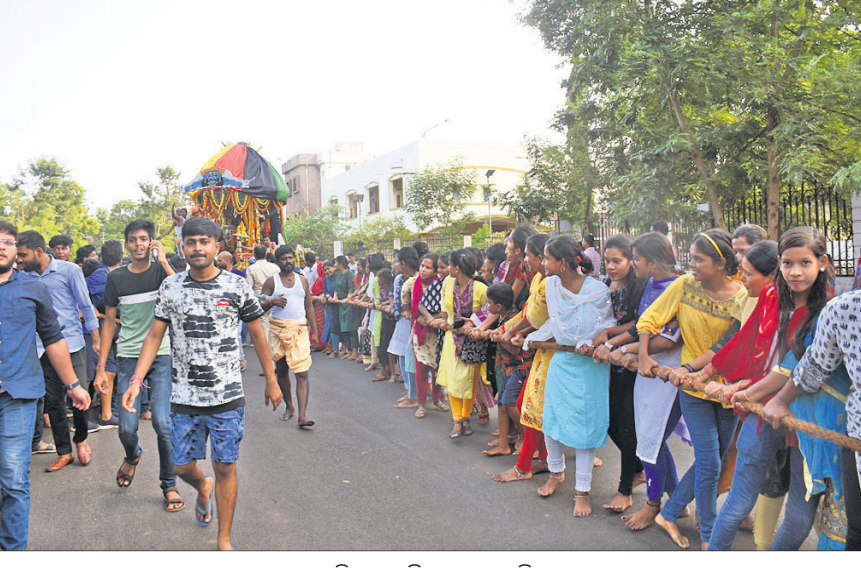
ବାଣୀବିହାର ପରିସରରେ ଅନୁଷ୍ଠିତ ରଥଯାତ୍ରା ।