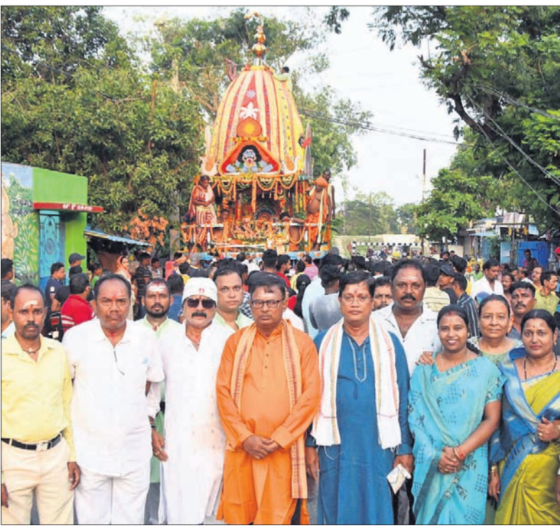
ଯୋଗ୍ୟ ନୂଆସାହିଠାରେ ଅନୁଷ୍ଠିତ ରଥଯାତ୍ରାରେ ଭକ୍ତ ସମାଗମ।

ଲୀଳା ଦେଖାଇବାକୁ ଭକ୍ତଙ୍କ ଗହଣକୁ ଓହ୍ଲାଇଥିଲେ ମହାପ୍ରଭୁ। ସୃଷ୍ଟି ହୋଇଥିଲା ଆଧ୍ୟାତ୍ମିକ ପରିବେଶ। ଏକାଠି ହୋଇଥିଲେ ଭକ୍ତ ଓ ଭଗବାନ। ମାଉସୀ ମା' ହାତରୁ ପୋଡ଼ିପା ଖାଇବାକୁ ଗୁଣ୍ଡିଚା ମନ୍ଦିର ଅଭିମୁଖେ ବାହାରିଥିଲେ ତିନି ଠାକୁର। ହଳହଳି, ଘଣ୍ଟଘଣ୍ଟା ଶଙ୍ଖଧ୍ୱନିରେ ମଙ୍ଗଳକାର ପ୍ରକମ୍ପିତ ହୋଇଥିଲା କଟକ ସହର। ତେବେ ସହରର ୩ ପ୍ରମୁଖ ସ୍ଥାନ ଚାରିନାଟିକ, ବୋଳପୁଣ୍ଡା ଓ ରାଣାହାତରେ ପୂଜାମଣି ସମ୍ପନ୍ନ ପରେ ଠାକୁରଙ୍କୁ ରଥାରୁତ୍ କରାଯାଇଥିଲା। ଛେରାପହରା ପରେ ଶ୍ରୀକାନ୍ତମାନେ ରଥ ଚାରିଥିଲେ। ଚାରିନାଟିକ ଜଗନ୍ନାଥ ମନ୍ଦିରରେ ବିଭିନ୍ନ ନୀତି ପରେ ଠାକୁରଙ୍କ ପହଞ୍ଚିରେ ଆଣି ରଥାରୁତ୍ କରାଯାଇଥିଲା। ଅପରାହ୍ଣ ୨ଟାରେ ରଥଟଣା ଆରମ୍ଭ ହୋଇଥିଲା। ଭକ୍ତମାନେ ୩ ରଥକୁ ଚାରି ନେଇ ସଞ୍ଜା ସୁଦ୍ଧା ବେଲୁଣ୍ଡା ଛକସ୍ଥିତ ଅସ୍ଥାୟୀ ଗୁଣ୍ଡିଚା ମନ୍ଦିରରେ ପହଞ୍ଚିଥିଲେ। ସେହିଭଳି ବୋଳପୁଣ୍ଡାସ୍ଥିତ ପତିତପାବନଜୀଉ ମନ୍ଦିରରେ ରଥଯାତ୍ରା ଅନୁଷ୍ଠିତ ହୋଇଥିଲା। ଠାକୁରଙ୍କୁ ପହଞ୍ଚିରେ ଆଣି ରଥାରୁତ୍ କରାଯାଇଥିଲା। ରଥରେ ଛେରାପହରା ପରେ