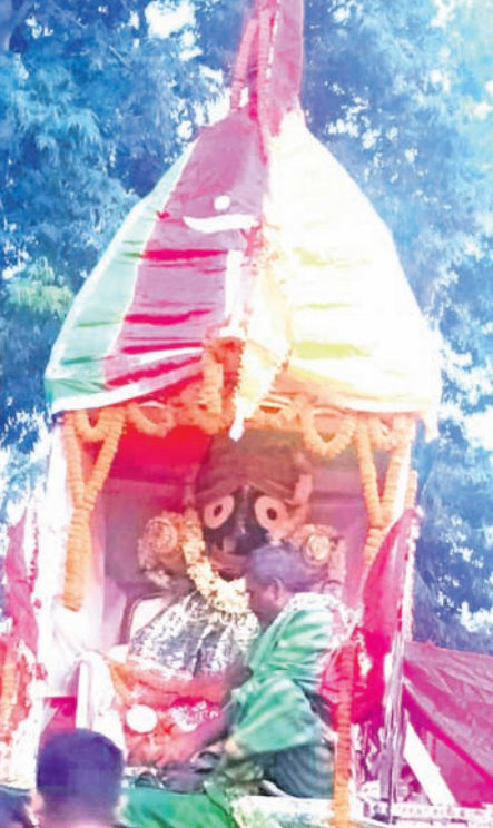
କଟକ ସହର ରୁକ୍ମିଣୀପୁର ଗ୍ରାମ ବ୍ୟୁତ୍ସାହାରୀମାନଙ୍କ ପୀଠରେ ରଥଯାତ୍ରା।