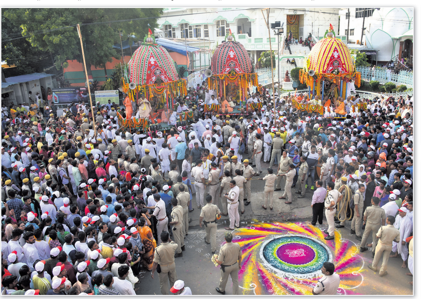
ଭୁବନେଶ୍ୱର ଉତ୍ସବ ମନ୍ଦିରରେ ଅନୁଷ୍ଠିତ ରଥଯାତ୍ରା।