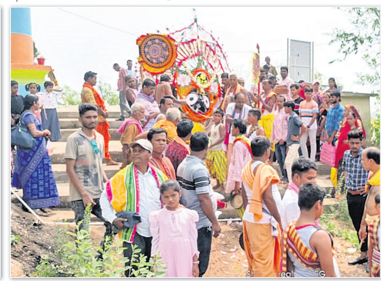
ସୁବର୍ଣ୍ଣପୁର ବିନା ରଘୁଶା ବୁଦର ପାଟଳି ଶ୍ରୀକ୍ଷେତ୍ରରେ ଠାକୁରଙ୍କୁ ପହଣି କରାଯାଇଛି।