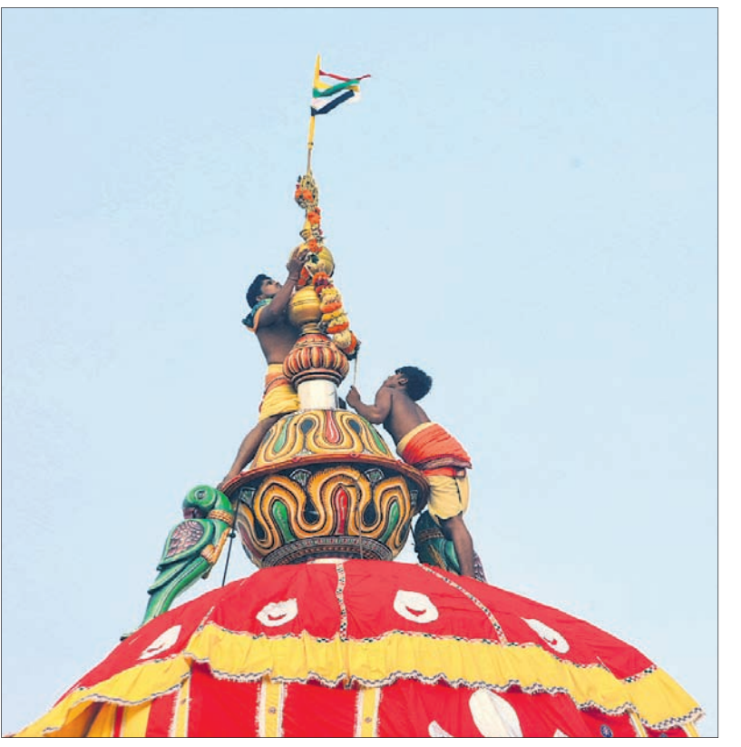
ପୁରୀ: ପ୍ରତିଷ୍ଠା ପରେ ଉପରେ ରଥନାଚି ଓ ଧ୍ୱଜା ବାସୋଗ କରାଯାଇଛି।