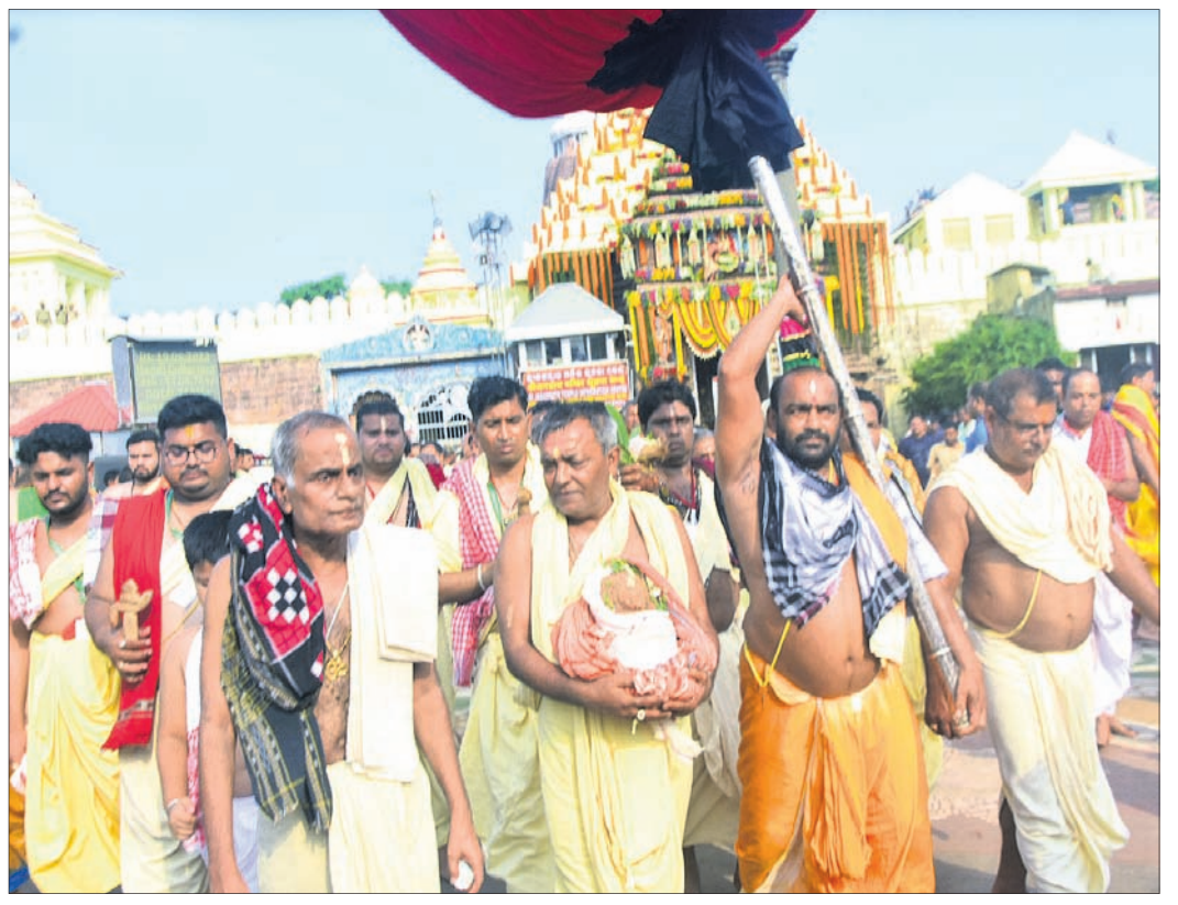
ଶ୍ରୀକ୍ଷେତ୍ରରେ ରଥ ବେଦବାଜୁ ରଥ ଉପରେ ଘ୍ରାପନ ପାଇଁ ନିଆଯାଇଛି।