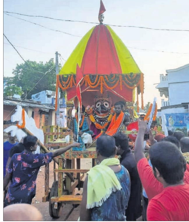
ଜଗଣା ବୁଦ୍ଧ କଣ୍ଠିଆ ଗ୍ରାମରେ ରଥକୁ ଶ୍ରୀକାଳୁମାନେ ଚାଣ୍ଡିଛନ୍ତି।