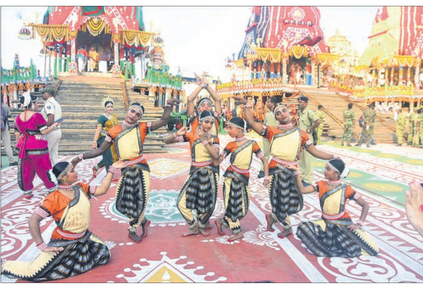
ପୁରୀ ଶ୍ରୀନରିବ ସମ୍ମୁଖରେ ବିନି ରଥ ଆଗରେ କରାଯାଉଥିବା ନୃତ୍ୟ ପରିବେଷଣ କରୁଛନ୍ତି।