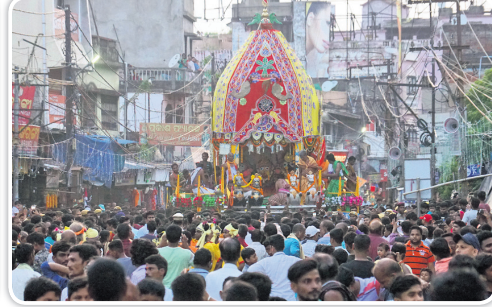
ରାଣାହାତସ୍ଥିତ ବଳଦେବଜୀଉ ମନ୍ଦିର ସମ୍ମୁଖରେ ଶ୍ରୀକାନ୍ତମାନେ ରଥ ଶାନ୍ତୁଛନ୍ତି।