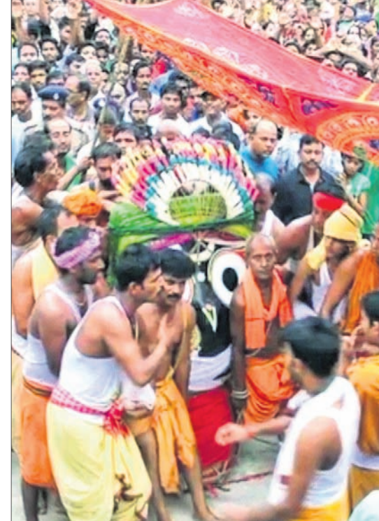
ନିଶ୍ଚିତକୋଇଲି ନିଶ୍ଚିତକୋଇଲି ବଳଦେବଜୀଉ ମନ୍ଦିରରୁ ଠାକୁରଙ୍କୁ ପହଞ୍ଚି।