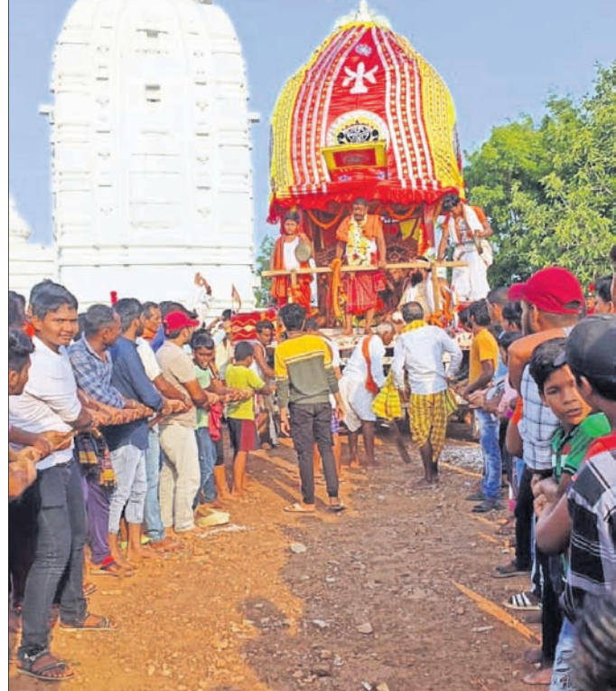
ଲବଣଗିରି ବଡ଼ୁର୍ଦ୍ଧାପୁର ରଥକୁ ଭକ୍ତମାନେ ଚାଣ୍ଡି ନେଉଛନ୍ତି।