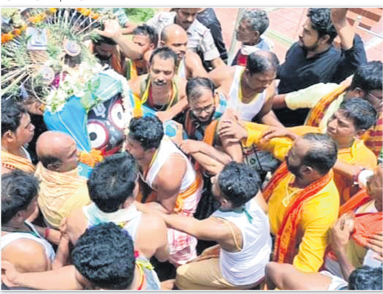
କୋରାପୁଟ ଶାବର ଶ୍ରୀକ୍ଷେତ୍ରରେ ଶ୍ରୀକରମାଥଙ୍କ ପହଣି କରାଯାଇଛି।