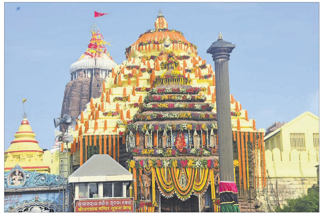
ଶ୍ରୀନରିବକୁ ମୁକ୍ତରେ ସଜାଯାଇଛି।