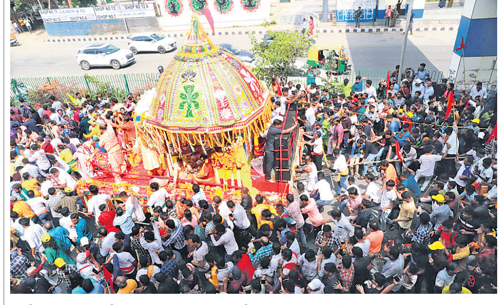
ନୂଆଦିଲ୍ଲୀର ଚ୍ୟାଗରାଜ ଷ୍ଟାଡ଼ିୟମରେ ରଥଯାତ୍ରା ବେଳେ ଭକ୍ତ ଭିଡ଼।

ଆଗାମୀ ଦିନରେ ଉତ୍ତର ପ୍ରଦେଶ, ବିହାର, ହରିୟାଣା, ତାମିଲନାଡୁ, ମଧ୍ୟପ୍ରଦେଶ, ଖଡ଼ଖଣ୍ଡ, ବିହାର, ଓଡ଼ିଶା, ପଶ୍ଚିମବଙ୍ଗ, ଆନ୍ଧ୍ରପ୍ରଦେଶ ଏବଂ ତେଲଙ୍ଗାନାରେ ଗ୍ରୀଷ୍ମ ପ୍ରବାହ ଅନୁଭବ ହେବାରୁ ଟିମ୍ ପଠାଯାଇଛି।