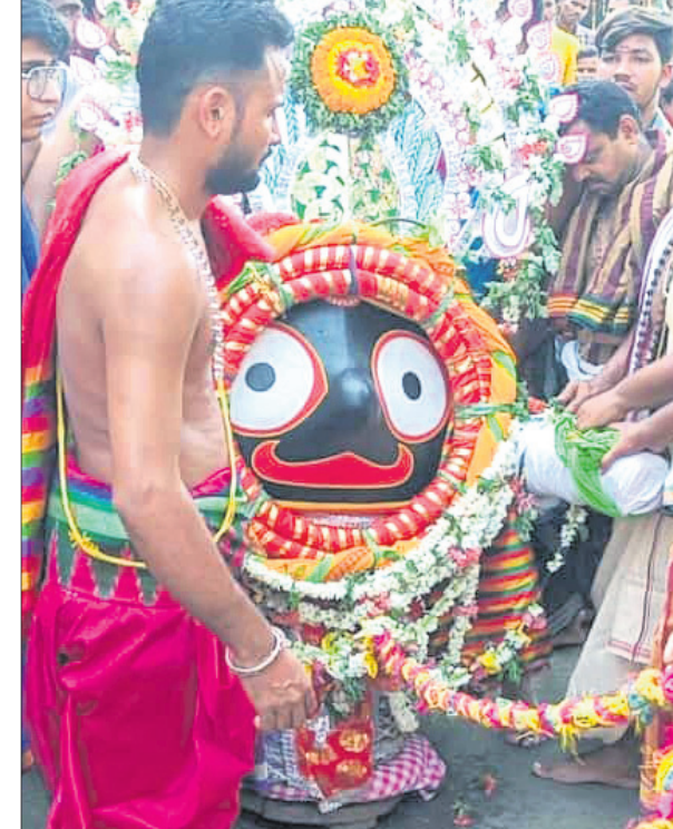
ଆଠଗଡ଼ ଗଡ଼ଜାତର ଅଜାକା ଜଗନ୍ନାଥଙ୍କୁ ପହଞ୍ଚିରେ ନିଆଯାଇଛି।