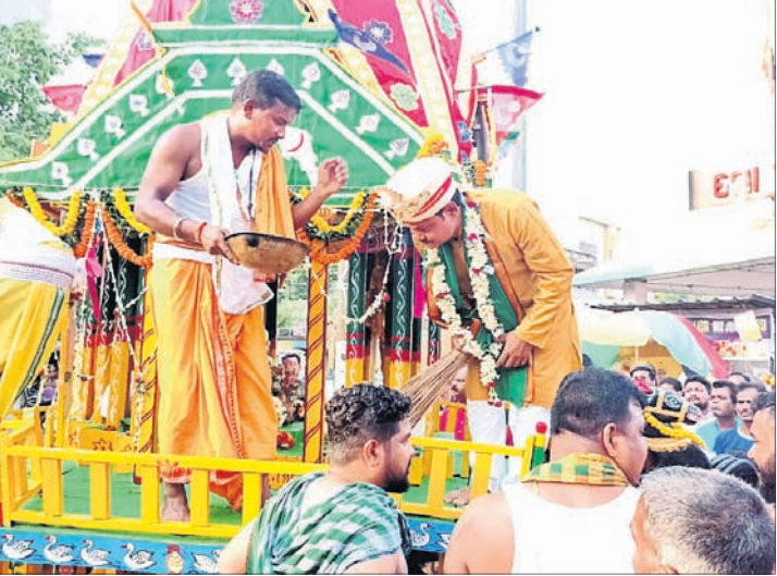
ରସୁଲଗଡ଼ ଗ୍ରାମ ଜଗନ୍ନାଥ ମନ୍ଦିର ପୂଜା କମିଟି ।