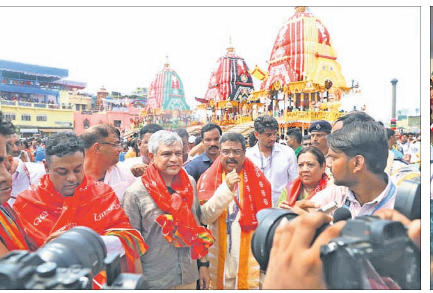
ପୁରୀ ରଥଯାତ୍ରାରେ ଯୋଗଦେଇଥିବା କେନ୍ଦ୍ର ଚଳେକମନ୍ତ୍ରୀ ଅଶ୍ୱିନୀ କୈଶେବ, କେନ୍ଦ୍ର ଶିକ୍ଷାମନ୍ତ୍ରୀ ଧର୍ମେନ୍ଦ୍ର ପ୍ରସାଦ ଏବଂ ରାଜ୍ୟା ଚଳେକ ସମିତ ପାତ୍ର।