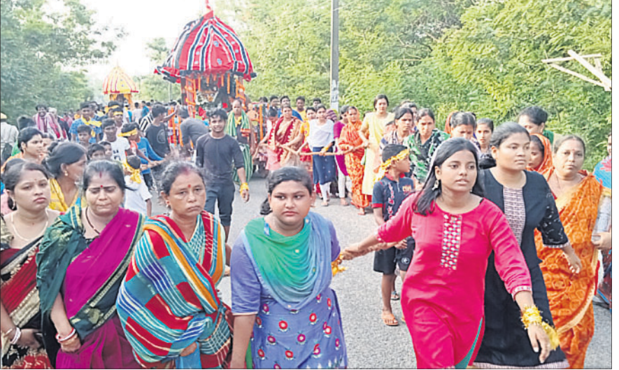
ନନ୍ଦକନ୍ୟା ଶ୍ରୀ ଜଗନ୍ନାଥ ମନ୍ଦିର ପକ୍ଷରୁ ଅନୁଷ୍ଠିତ ରଥଯାତ୍ରାରେ ସୁଭଦ୍ରାଙ୍କ ରଥକୁ ମହିଳାମାନେ ଚାଳୁଛନ୍ତି ।