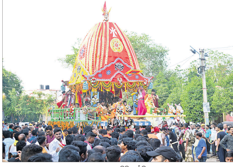
ଖଞ୍ଜିରି ଧର୍ମ ବିହାର