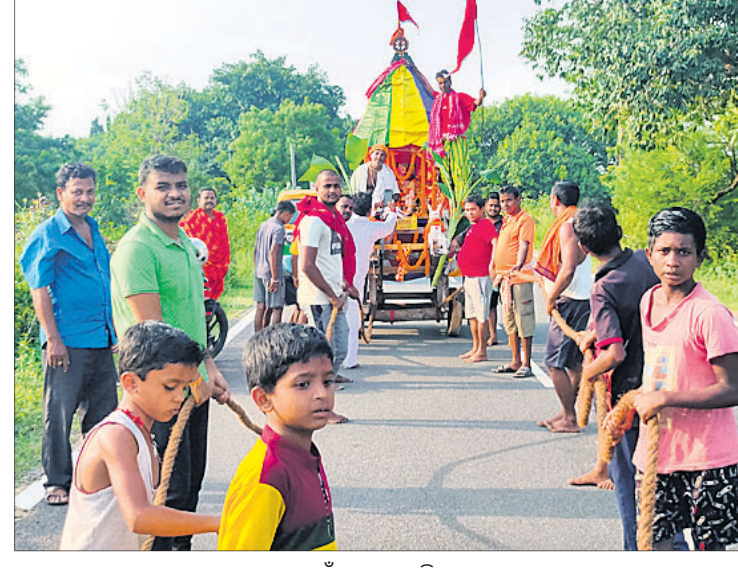
ଭୁବନେଶ୍ୱର ଉପକଣ୍ଠ ବଜାରୁଆ ରୁପ୍ରମଣି ମଠ ପକ୍ଷରୁ ରଥଯାତ୍ରା ।