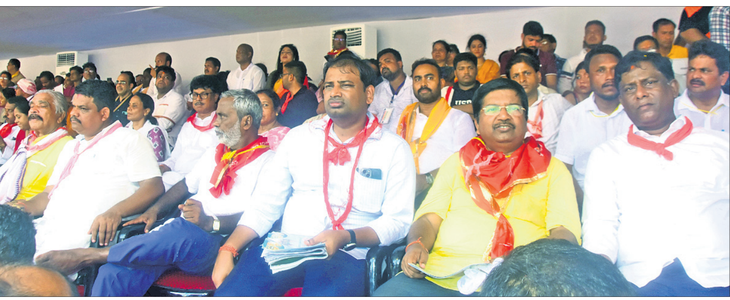
ରଥଯାତ୍ରା ସେବକାଳୁ ଆସିଥିବା ମନ୍ତ୍ରୀ, ବିଧାୟକ, ନେତା ଓ ଅଧିକାରୀ।