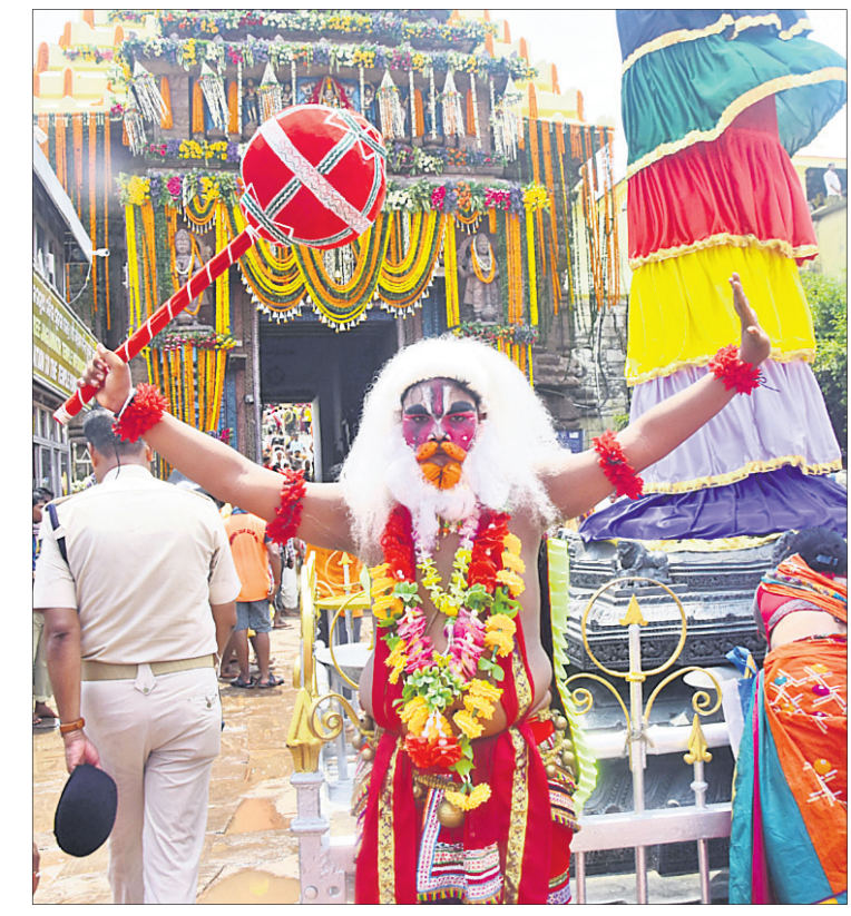
ଶ୍ରୀନରିବ ସମ୍ମୁଖରେ ବଣେ ବନ୍ଦୁଗାନ ବୋଧାଗା।