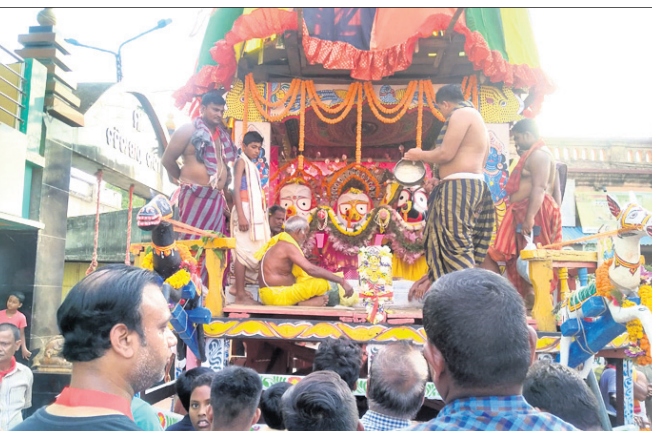
ବାଙ୍କୀ ମା' ଚର୍କାଙ୍କ ପୀଠରେ ଆୟୋଜିତ ରଥଯାତ୍ରା।