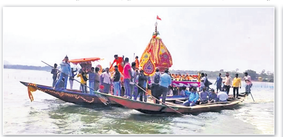
ମହାପ୍ରଭୁଙ୍କ ଅନନ୍ତନାମା ଲାଭାକ୍ଷେତ୍ର ବାବୁଶ୍ରୀକୋଣାର୍କରେ ବରମାଥ ମନ୍ଦିର ପ୍ରସ୍ତୁତ ପକ୍ଷରୁ ଚିଲିକାରେ ବନ୍ଦାରେ ଅନୁଷ୍ଠିତ ରଥଯାତ୍ରା।