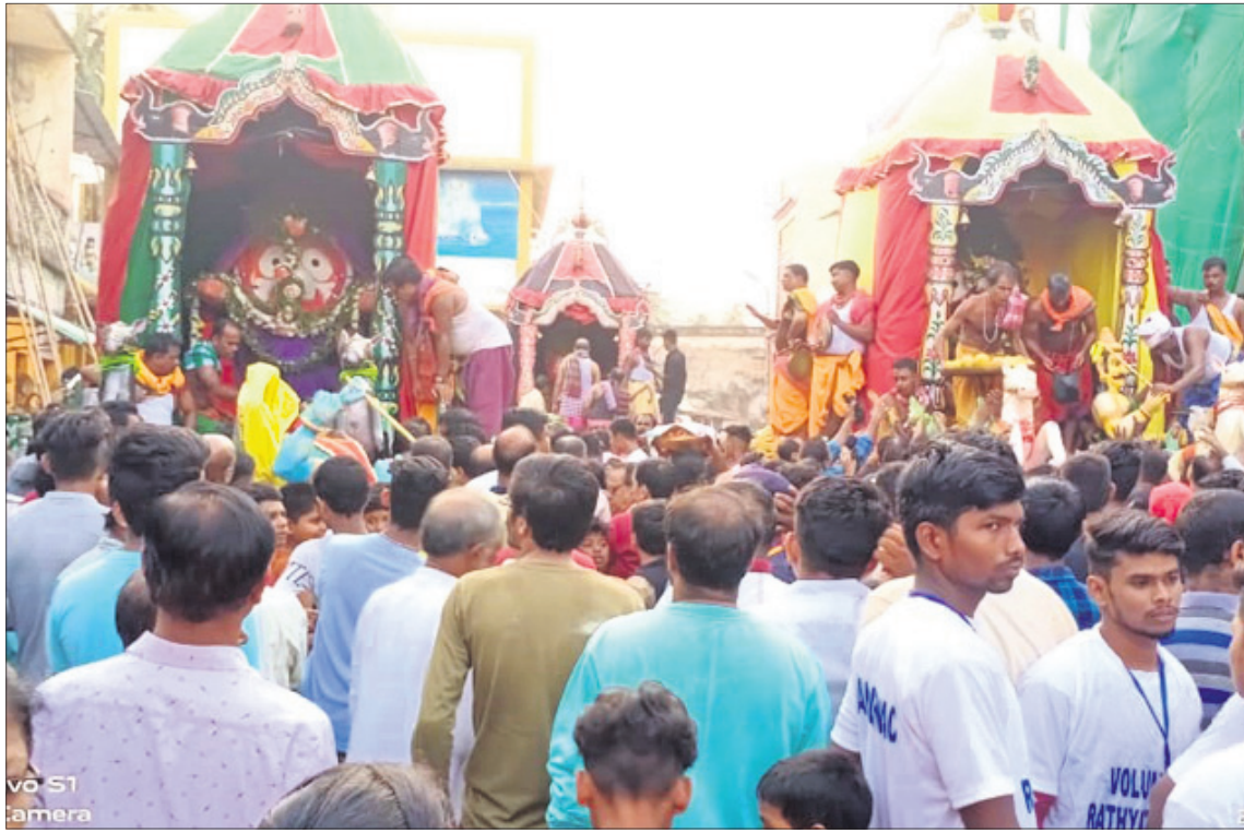
ବାଣପୁରରେ ଆୟୋଜିତ ରଥଯାତ୍ରାରେ ଶ୍ରୀକାଳୁଙ୍କ ଭିଡ଼।