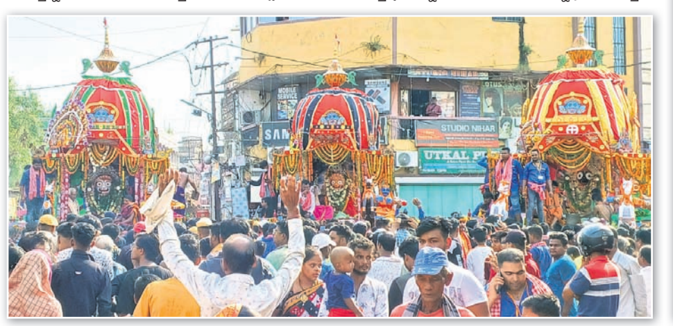
କବଚ ବୋଧକପୁଣ୍ୟରେ ରଥାବୁଡ଼ି ବିନି ଠାକୁର।