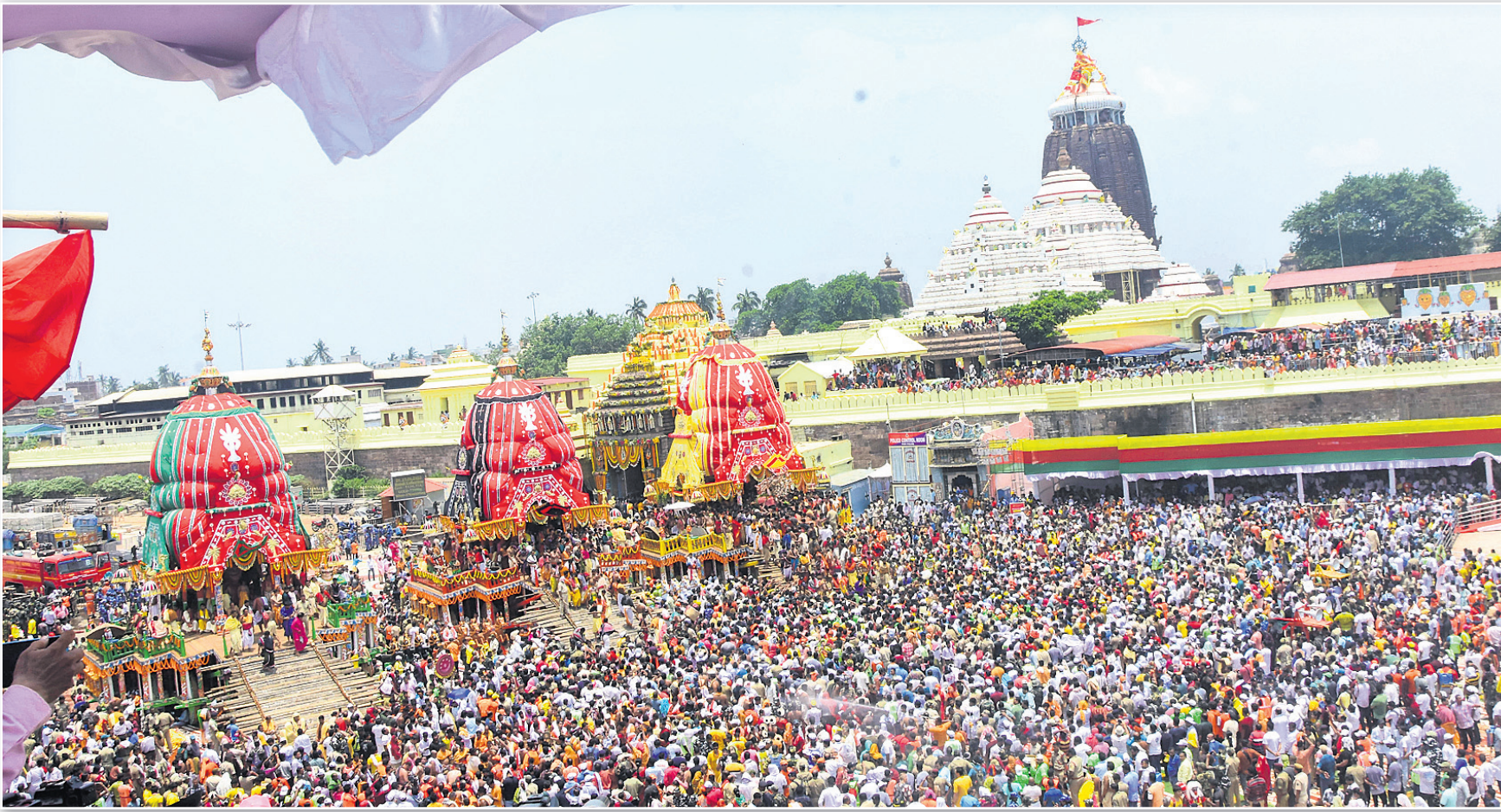
ପୁରୀ ବନ୍ଦାଘରେ ବିନି ରଥ ଚାଣିବାକୁ ଶ୍ରଦ୍ଧାଳୁଙ୍କ ପ୍ରବଳ ଭିଡ଼।