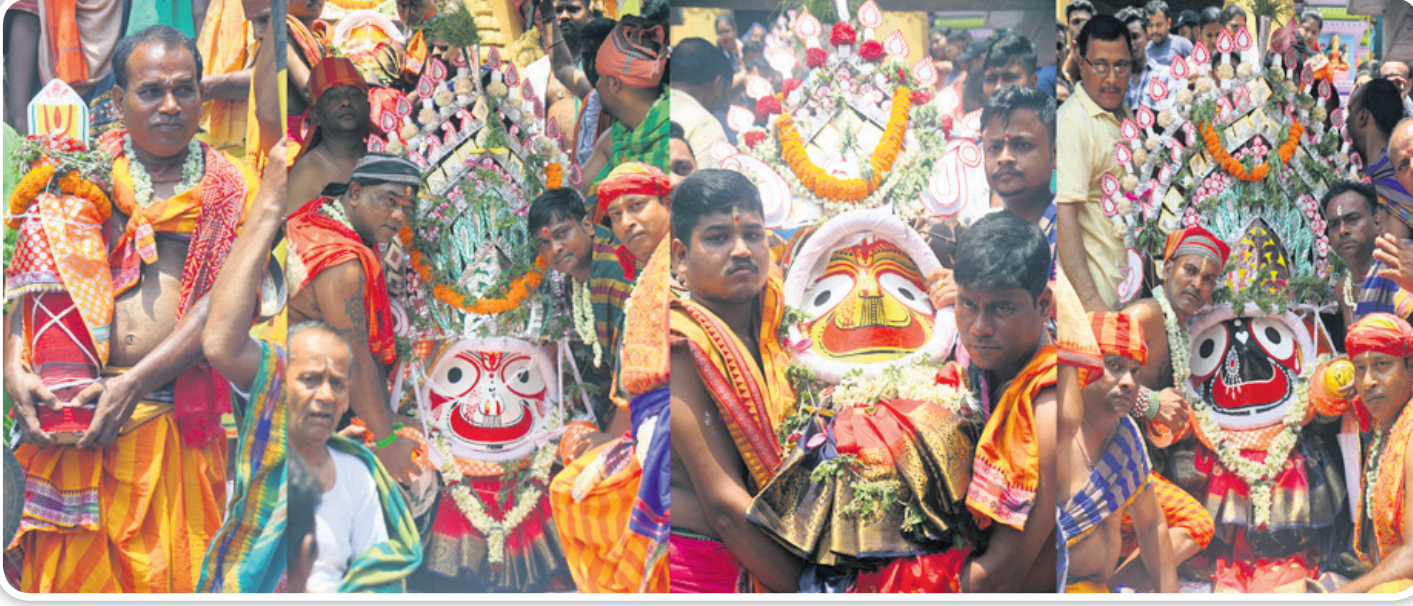
ରଥଯାତ୍ରା ଅବସରରେ ମଙ୍ଗଳକାର କଟକ ଚାରିନାଟିକ ଜଗନ୍ନାଥ ମନ୍ଦିରରୁ ଚତୁର୍ଦ୍ଧା ମୂର୍ତ୍ତିକ ପହଞ୍ଚିବେ।