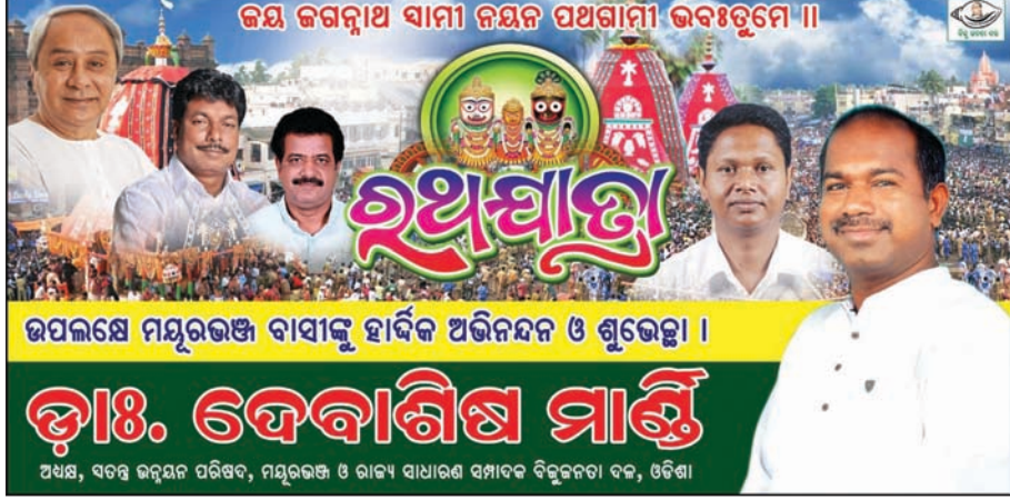
ଭଦ୍ରକରେ ମୟୂରଭଞ୍ଜ ବାସୀଙ୍କୁ ହାର୍ଦ୍ଦିକ ଅଭିନନ୍ଦନ ଓ ଶୁଭେଚ୍ଛା ।

ଲାଗୁ ହେବ ବୋଲି ଅଭିଯୋଗ ଡାକ୍ତରୀରେ ସ୍ପଷ୍ଟ କରିଛନ୍ତି । ସରକାରଙ୍କ ପକ୍ଷରୁ ଆଇନଜୀବୀ ସେହେରା ବେହେରା ମାମଲା ପରିଚାଳନା କରୁଥିଲେ ।