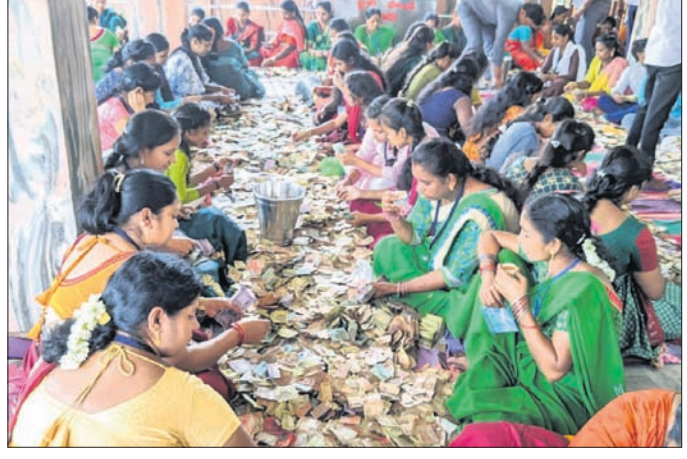
ରାୟଗଡ଼ାର ଅଧିକାରୀ ଦେବୀ ମା' ମଝି ଘରିଆଣୀ ମଝିରରେ ଦାନଟଙ୍କା ଗଣତି କରାଯାଇଛି।