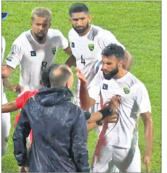
ଜଗର୍ ଷ୍ଟିପାକ ଓ ପାକିସ୍ତାନ ଖେଳାଳିଙ୍କ ମଧ୍ୟରେ ମୁତ୍ତର୍କ

ଭାରତୀୟ ଜାତୀୟ ପୁରବଳ ଦଳର ମୁଖ୍ୟ କୋଚ୍ ଜଗର୍ ଷ୍ଟିପାକଙ୍କୁ ମିଲିଟି ରେଡ୍ କାର୍ଡ। ଭାରତ ଓ ପାକିସ୍ତାନ ମଧ୍ୟରେ ଖେଳା ଯାଇଥିବା ସାତ୍ କପ୍ ପ୍ରତିଯୋଗିତାରେ ଏମିତି ଘଟଣା ଘଟିଥିଲା। ୪୫ ତମ ମିନିଟରେ ପାକିସ୍ତାନକୁ ଏକ ଷ୍ଟ୍ରୋ ମିଡିଥିଲା। ପ୍ରାଥମ କୋଚାଳକ ଠାକୁ ପାକିସ୍ତାନୀ ଖେଳାଳି ବଲ୍ ଛତାଇବାକୁ ପ୍ରୟାସ କରୁଥିଲେ। ରେଫରି ପାକିସ୍ତାନ ସପକ୍ଷରେ ନିଷ୍ପତ୍ତି ଦେବା ପରେ ଅସନ୍ତୋଷ ପ୍ରକାଶ କରିଥିଲେ ଷ୍ଟିପାକ୍। ପାକିସ୍ତାନୀ ଖେଳାଳି ଅବଦୁଲ୍ ଇକ୍ବାଲ୍ ସାଇତ୍ତୁ ବଲ୍ ଷ୍ଟ୍ରୋ କରିବାକୁ ଯାଉଥିବା ବେଳେ ପଛପଟୁ ଆସି ଷ୍ଟିପାକ୍ ବଲ୍କୁ ହାତରେ ଠେଲି ଦେଇଥିଲେ। ଏହାକୁ ନେଇ ଏକାଧିକ ପାକିସ୍ତାନୀ ଖେଳାଳି ଓ ଷ୍ଟିପାକଙ୍କ ମଧ୍ୟରେ ମୁତ୍ତର୍କ ହୋଇଥିଲା। ପରେ ରେଫରି ଷ୍ଟିପାକଙ୍କୁ