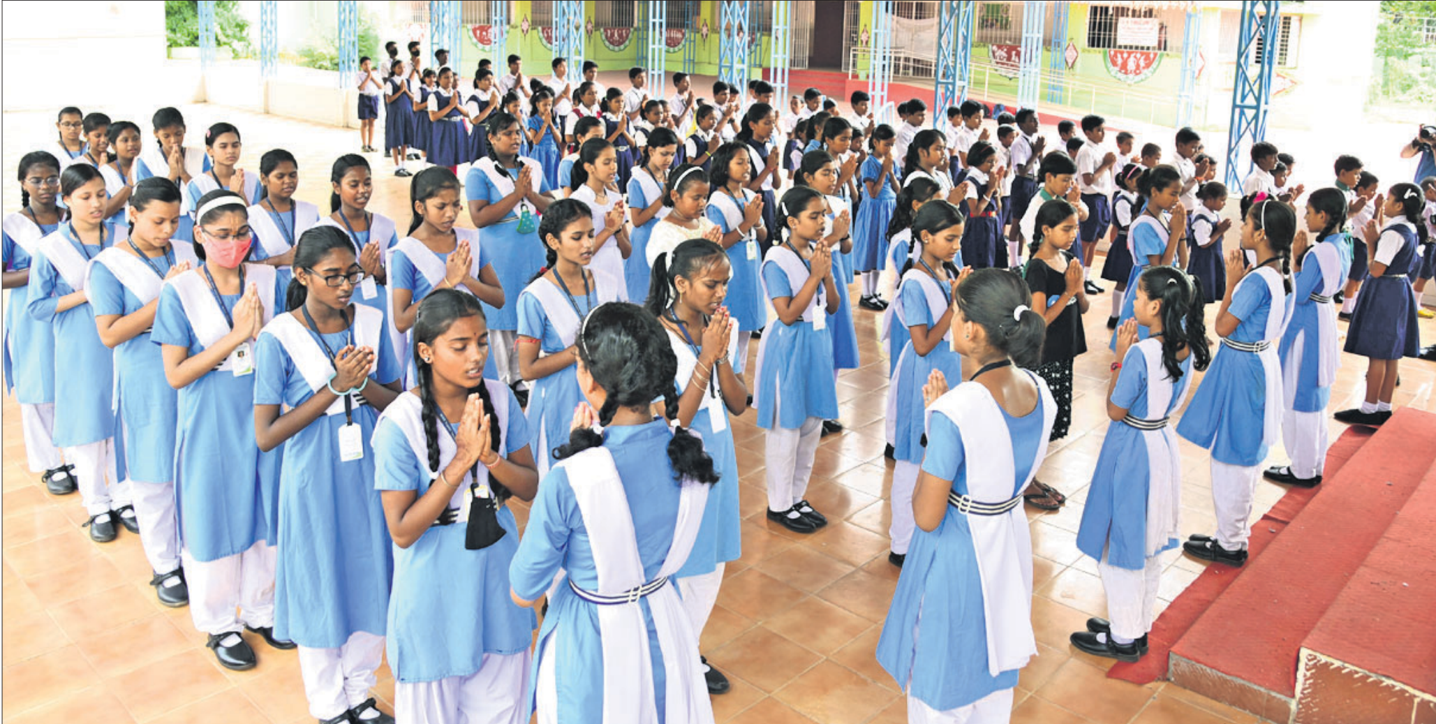
ଗ୍ରୀଷ୍ମ ଋତୁ ପରେ ଖୋଲିଲା ସ୍କୁଲ: ଭୁବନେଶ୍ୱର ସୁନିର୍ମିତ ୨ କ୍ୟାମ୍ପସ୍ରେ ଉଚ୍ଚ ବିଦ୍ୟାଳୟରେ ଛାତ୍ରାଛାତ୍ରୀମାନେ ପାଠପଢ଼ା ଆରମ୍ଭ ପୂର୍ବରୁ ପ୍ରାର୍ଥନା କରୁଛନ୍ତି।