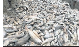
କୃତ କୃତ ମଲାମାଛ। ସଂଖ୍ୟା ବୃଦ୍ଧି ପାଇ ପୋଖରୀ ସାଗର ମାଛ ଭାଙ୍ଗିବା ଦେଖିଥିଲେ। କିଛି ଏହାର କ୍ଷତିଭରଣା କରିବେ ଓ ମାଛ ଗଣ ଲାଗି କରିଥିବା ରଣ କିଛି ପରିଶୋଧ କରିବେ ତାକୁ ନେଇ ତିରାରେ ପଡିଛନ୍ତି ସୁଶାନ୍ତ।

କବିସୂର୍ଯ୍ୟନଗର, ୨୧.୬ (କୃପାସିନ୍ଧୁ ସାଲ) ଗଞ୍ଜାମ ଜିଲା କବିସୂର୍ଯ୍ୟନଗର ବ୍ଲକ୍ ସିଆଲିଆ ପଞ୍ଚାୟତ ଅନ୍ତର୍ଗତ ବିଘ୍ନୋରଣ ମନ୍ଦିର ନିକଟ ଲକ୍ଷ୍ମୀନାରାୟଣ ସାଗର ପୋଖରୀରେ ମାଛ ମଡ଼କ ଦେଖିବାକୁ ମିଳିଛି।