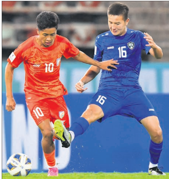
କୁଏତ୍ ଓ ନେପାଳ ମଧ୍ୟରେ ଅନୁଷ୍ଠିତ ମ୍ୟାଚ୍

କୁଏତ୍ ଏହି ଦଳ ୩-୧ ଗୋଲରେ ନେପାଳକୁ ପରାସ୍ତ କରିଛି। ଆମନ୍ତଣୀୟ ଦଳ ଭାବେ ପ୍ରଥମଥରପାଇଁ ସାତ୍ ଚାମ୍ପିୟନଶିପ୍ ଖେଳୁଥିବା କୁଏତ୍ ଆରମ୍ଭରୁ ଶେଷ ପର୍ଯ୍ୟନ୍ତ ପ୍ରାଧାନ୍ୟ ବିସ୍ତାର କରି ଖେଳିଥିଲା। ୨୩ତମ ମିନିଟରେ