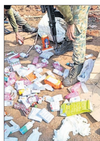
ଜବତ ମାଉସାଦୀ ସାମଗ୍ରୀ। ଅନେକ କ୍ୟାମ୍ପ ମଧ୍ୟ ଧ୍ୟୁ୍ୟ କରିଥିଲେ। ଏହି କ୍ୟାମ୍ପ ଧ୍ୟୁ୍ୟ ସମୟରେ ଅନେକ ବିଘ୍ନୋରଣ ସାମଗ୍ରୀ ସହ ଉତ୍ପାଦନ ହୋଇଛି।

ମାଲକାନଗିର, ୨୧.୬ (ଦୁର୍ଯ୍ୟୋଧନ ପାଠ୍ୟ) ମାଲକାନଗିର ଜିଲା ସାମାଜିକ ଛତିଶଗଡ ବିକାସ ବିଭାଗରେ କୋଫିଂ ବେଳେ ଆଇଡି ବିଘ୍ନୋରଣ ହୋଇ ଜଣେ ଯବାନ ଆହତ ହୋଇଛନ୍ତି।