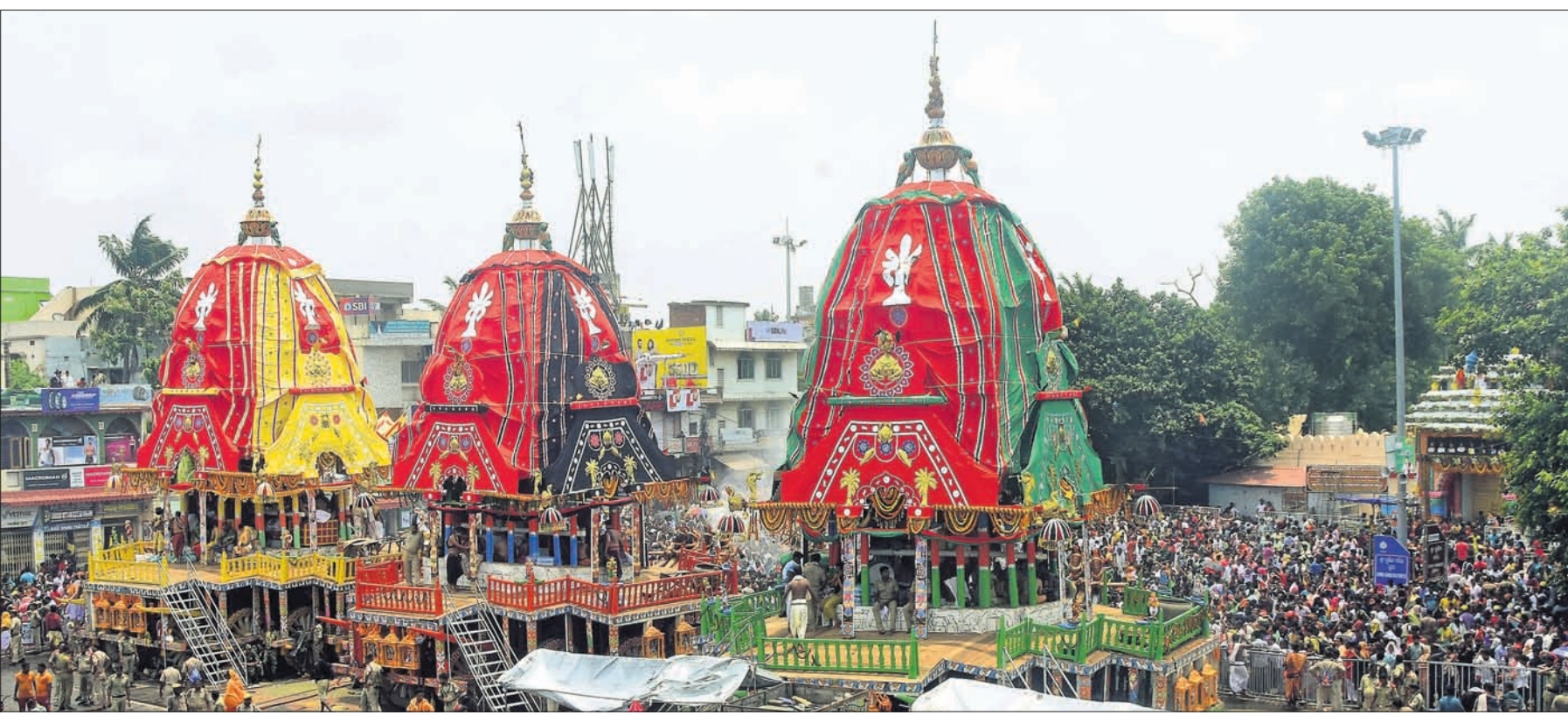
ରଥଯାତ୍ରା ପୂର୍ବ ଶ୍ରୀଗୁଣ୍ଡିଚା ମନ୍ଦିର ସମ୍ମୁଖରେ ତିନିରଥ ।