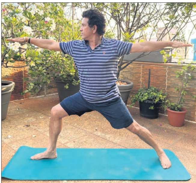
ଅନ୍ତର୍ଜାତୀୟ ଯୋଗ ଦିବସ ଅବସରରେ ଯୋଗ ପୂଜାରୀ ଭେନସଙ୍କୁ ଓଲଟୁ କାର୍ଡ