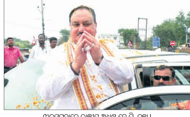
ଝାରସୁଗୁଡ଼ାରେ ରାଷ୍ଟ୍ରୀୟ ଅଧ୍ୟକ୍ଷ ଜେ.ପି. ନଞ୍ଜା।