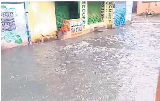
ମୌସୁମୀ ବର୍ଷାରେ ସହରର ବିଭିନ୍ନ ସ୍ଥାନ ଜଳାଣି ହେଉଛି।

ବ୍ରହ୍ମପୁର, ୨୨।୬ (ହୃତି ରଞ୍ଜନ ମହାଲିକ)/ ଗୋପାଳପୁର (ନବୀନ ରାଜ ଆଚାରୀ)