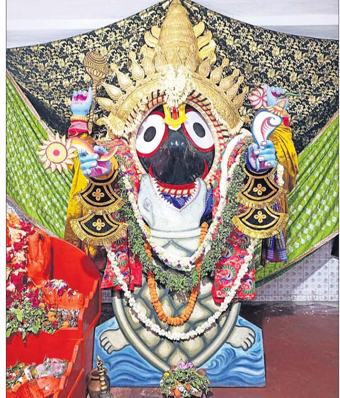
ଗୋଷ୍ଠୀଗୁଆଁ ଆଡ଼ପମଣ୍ଡପରେ ମହାପ୍ରଭୁଙ୍କ କଳ୍ପ ଅବତାର ବେଶ।

ବ୍ରହ୍ମପୁର, ୨୨।୬ (ଚନ୍ଦ୍ରମୁଖ ନାହାକ) ରଥଯାତ୍ରାର ତୃତୀୟ ଦିବସ ଗୁରୁବାର ରେଶମ ସହରରେ ବିଭିନ୍ନ ଆଡ଼ପ ମଣ୍ଡପରେ ମହାପ୍ରଭୁଙ୍କ କଳ୍ପ ଅବତାର ବେଶ ହୋଇଥିଲା।