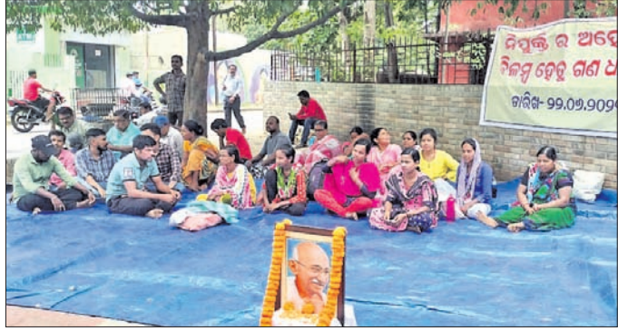
ଗ୍ରାମବାସୀ ଆମରଣ ଅନଶନରେ ବସିଛନ୍ତି।

ଅନୁଗୋଳ, ୨୨।୬ (ଅମିତ କୁମାର ସାମଲ) ଦୀର୍ଘ ୨ ବର୍ଷ ହେବ ଆଲୋଚନାକୁ କୋଣସି ପ୍ରକଳ୍ପ ନ ମିଳିବାରୁ ଅନୁଗୋଳ ଜିଲା କର୍ମଚାରୀଙ୍କୁ ନିରାଶ କରିଛି।