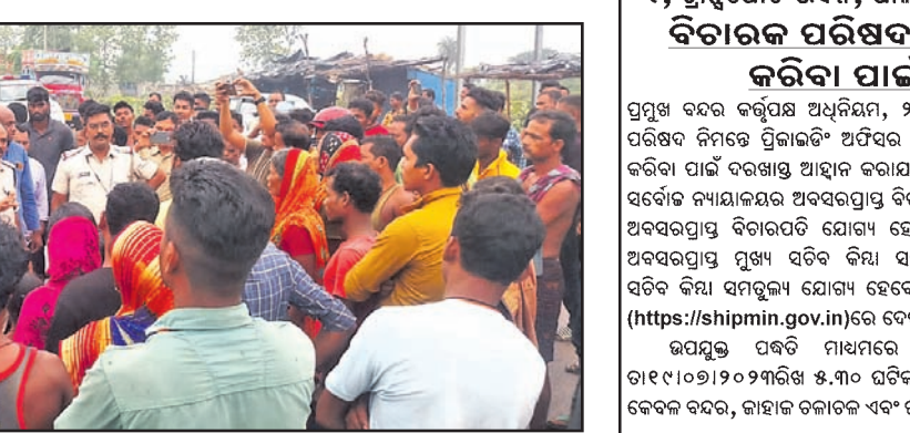
ମୃତ ବ୍ୟବସାୟ ସମ୍ପର୍କୀୟ ଓ ଗ୍ରାମବାସୀ ୫୫୫୫. ଭାଗ୍ୟ ରାଜପଥ ଅବରୋଧ କରିଛନ୍ତି।