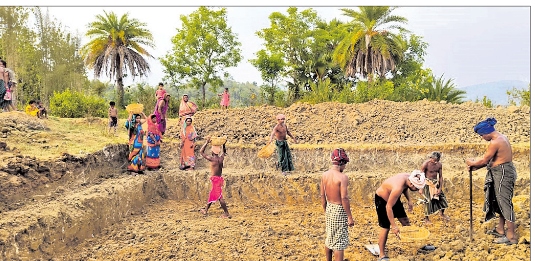
ସମନ୍ୱିତ ଚାଷ ପ୍ରଣାଳୀରେ ପୋଖରୀ ଖନନ ବଶପଲ୍ଲୀ ବ୍ଲକ ଯୁଗୁଡ଼ିପଡ଼ା ପଞ୍ଚାୟତର ଚମ୍ପା ଭାଲି ଗାଁରେ ଚାଲିଛି ।