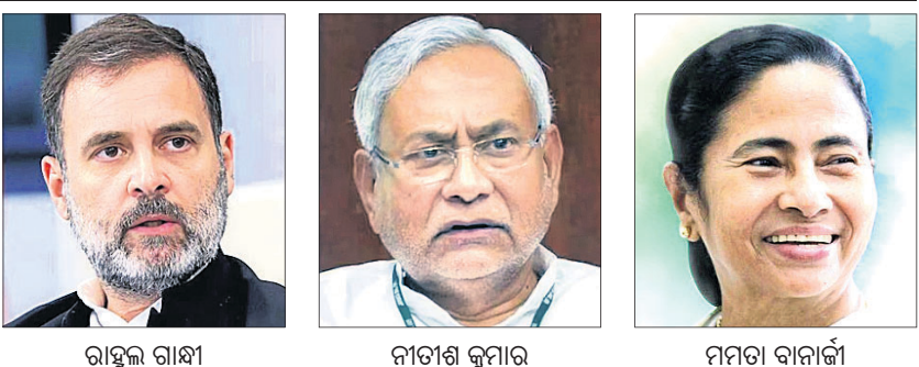
ରାହୁଲ ଗାନ୍ଧୀ ନୀତୀଶ କୁମାର ମମତା ବାନାର୍ଜୀ

ସାଧାରଣ ନିର୍ବାଚନକୁ ପ୍ରାୟ ୧୦ ମାସ ବାକି ଥିବାବେଳେ କେନ୍ଦ୍ରରେ ଭାଜପା ନେତୃତ୍ୱାଧୀନ ଜାତୀୟ ଗଣତାନ୍ତ୍ରିକ ମେଣ୍ଟ (ଏନଡିଏ) ସରକାରକୁ କ୍ଷମତାଭ୍ୟୁତ କରିବା ପାଇଁ ବିରୋଧୀ କୋରସର ପ୍ରସ୍ତୁତି ଚଳାଇଛନ୍ତି। ବିହାର ମୁଖ୍ୟମନ୍ତ୍ରୀ ନୀତୀଶ କୁମାରଙ୍କ ନିମନ୍ତ୍ରଣକ୍ରମେ ଶୁକ୍ରବାର ପାଟନାରେ ବିରୋଧୀ ଦଳଗୁଡ଼ିକର ବିଶାଳ ସମାବେଶ ଆୟୋଜିତ ହେବାକୁ ଯାଉଛି। ଏଥିରେ ପ୍ରାୟ ୧୫ ବିପକ୍ଷ ଦଳର ନେତାମାନେ ଯୋଗଦେଇ ଶକ୍ତି ପ୍ରଦର୍ଶନ କରିବାର କାର୍ଯ୍ୟକ୍ରମ ରହିଛି। ପ୍ରତି ଲୋକ ସଭା ଆସନରେ ଭୋଟ ବିଭାଜନକୁ ଏଡ଼ାଇବା ପାଇଁ ଭାଜପା ବିପକ୍ଷରେ ବିରୋଧୀଙ୍କ ପକ୍ଷରୁ ମିଳିତ ପ୍ରାର୍ଥା ଦେବା ବୈଠକର ମୁଖ୍ୟ କାର୍ଯ୍ୟକ୍ରମ ହୋଇଥିବାରୁ ଏହା ଉପରେ ଦେଶବାସୀଙ୍କ ନଜର କେନ୍ଦ୍ରୀଭୂତ ହୋଇଛି।