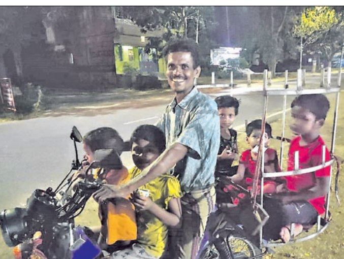
ବାଲକ୍ଷରେ ବିପଦସଙ୍କୁଳ ଯାତ୍ରା । ଦଶପଲ୍ଲୀ ବନ୍ଦାରରୁ ଫେରୁଛନ୍ତି ଗୋଟିଏ ବାଲକ୍ଷରେ ୬ ଜଣ ।