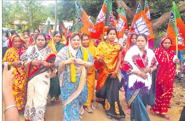
ଭାଜପା ନେତ୍ରୀ ପ୍ରତ୍ୟୁଷା ରାଜେଶ୍ୱରୀ ସିଂହଙ୍କ ଜନସମ୍ମିଳନ ଯାତ୍ରା ।