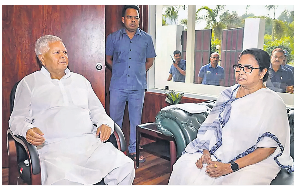
ପାଟଣାଠାରେ ଗୁରୁବାର ପଶ୍ଚିମବଙ୍ଗ ମୁଖ୍ୟମନ୍ତ୍ରୀ ତଥା ଟିଏମ୍ସି ସୁପ୍ରିମୋ ନମତା ବାନାର୍ଜୀ ଆରଜେଡି ମୁଖ୍ୟ ଲାଲୁ ପ୍ରସାଦ ଯାଦବଙ୍କୁ ଭେଟି ଆଲୋଚନା କରୁଛନ୍ତି।