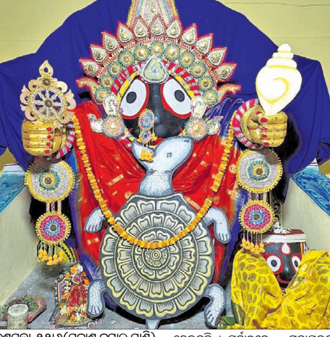
ଦଶପଲ୍ଲୀ, ୨୨।୬(ପ୍ରକାଶ କୁମାର ପାଣି) ଗୁରୁବାର ମହାବୀର କ୍ଷେତ୍ର ଦଶପଲ୍ଲୀରେ ପବିତ୍ର ଜନ୍ମଦେବୀରେ ତ୍ରିତୀୟ ଦିବସରେ ମହାପ୍ରଭୁ ଶ୍ରୀଜଗନ୍ନାଥ କଳ୍ପପ ଅବତାର ବେଶ ରେ ଭକ୍ତଙ୍କୁ ଦର୍ଶନ ଦେଇଛନ୍ତି। ପୂର୍ବାହ୍ନରେ ମହାପ୍ରଭୁଙ୍କ ନୀତିକାନ୍ତି ସରିବା ପରେ କଳ୍ପପ ଅବତାରରେ ଶ୍ରୀଜଗନ୍ନାଥଙ୍କୁ ଦର୍ଶନ ଦେଇଥିଲେ। ଏହି ବେଶ ଦେଖିବା ପାଇଁ ଭକ୍ତମାନଙ୍କ ସମାଗମ ହୋଇଥିଲା।

ନୟାଗଡ଼, ୨୨।୬(ଲୋକନାଥ ମିଶ୍ର) ତେବେ ବିଲେ ଶ୍ୟାମଳ ଗାମୁଛା ଓ ବ୍ୟବହାର କରୁଥିବା ଭଙ୍ଗା ଚର୍ଚ୍ଚ କବଚ କରି ଅପହରଣ ସମ୍ଭବ ହେବାର ପୋଲିସକୁ ଖବର ଦେଇଥିଲେ। ସୋମବାରଠାରୁ ରୁଧିବାର ପର୍ଯ୍ୟନ୍ତ ଖୋଜାଖୋଜି କାରି ରହିଥିଲେ ମଧ୍ୟ ସୁରାକ ମିଳି ନ ଥିଲା। ରୁଧିବାର ରାତିରେ ବାରପଲ୍ଲୀ ପଶ୍ଚିମ ଗାଁର କବି ମହାନ୍ତି ଗୁମାସ୍ତା ପୋଖରୀକୁ ଗାଧୋଇବାକୁ ଯାଇଥିଲେ। ଗାଧୋଇବା ବେଳେ ଏକ ପ୍ରକାପତି ଚାକ ଦେହରେ ବାରମ୍ବାର ବସି ଉଠୁଥିଲା। ପୁଣି ବସୁଥିଲା। ପ୍ରକାପତିକୁ ଠାବ କିଛି ବାଟ ଯିବା ପରେ ଶୁଣିଆପ୍ରଥମେ ମୂଳିଶରଠାରେ ପ୍ରକାପତି ଯାଇ ଅଚେତ ଲୋକର ଶରୀରରେ ବସିଥିଲା। ଘଟଣା ସମ୍ପର୍କରେ କବି ଗାଁରେ ଜଣାଇବା ପରେ ଗୁମାସ୍ତା ଲୋକ ଶ୍ୟାମଳଙ୍କୁ ଅଚେତ ଅବସ୍ଥାରେ ଡିଆଁପଡ଼ାରେ ଛାଡ଼ିଥିଲେ। ପରେ ଗାଁ ପକ୍ଷରୁ ଶ୍ୟାମଳଙ୍କୁ ନୟାଗଡ଼ ଜିଲା ମୁଖ୍ୟ ଚିକିତ୍ସାଳୟରେ ଭର୍ତ୍ତି କରାଯାଇଥିଲା। ତେବେ ଶ୍ୟାମଳଙ୍କୁ ଅଧିକାଂଶ ଡାକ୍ତର କହି ରାତିରେ ଡିସ୍ଚାର୍ଜ କରିଥିଲେ। ଏଭଳିସ୍ଥିତି ଗଣ୍ୟ ଗଣମାଧ୍ୟମକୁ ଓ ଗାଁଲୋକଙ୍କୁ ଭିନ୍ନ ଭିନ୍ନ କଥା କହି ଫସି ଯାଇଥିଲେ। ବିଲ ପରେ କିଛି ଲୋକ ତାଙ୍କିବାକୁ ଯାଇଥିଲେ।