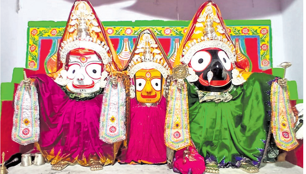
ନୟାଗଡ଼, ୨୨।୬(ଲୋକନାଥ ମିଶ୍ର) ରାଜା ରାଜେଶ୍ୱର ବେଶରେ ଦର୍ଶନ ଦେଇଛନ୍ତି। ଠାକୁରଙ୍କ ବେଶ ଦେଖିବାକୁ ଭିଡ଼ ଜମୁଛି। ମନ୍ଦିର ବଡ଼ପଣା, ସେବାୟତମାନେ ସନ୍ଧ୍ୟାରେ ବେଶ କରିଥିଲେ। ଏ ଅବସରରେ ଘାଟିଛି କାଳିଆନିଶା ଭଜନ-ପରିବେଷଣ ହୋଇଛି।