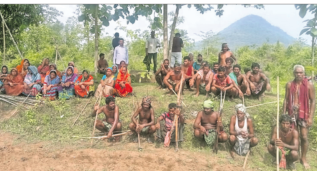
ଆଦିବାସୀମାନେ ପାରମ୍ପରିକ ଅସ୍ତ୍ରଶସ୍ତ୍ର ଧରି ଜମି ବସିଛନ୍ତି ।