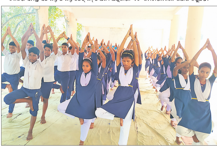
ଆର୍ଯେଲର ମିଲକ ନିସ୍ତନ ସ୍କୁଲ (ଏଏମ୍‌ଏନ୍‌ଏସ୍) ଇଣ୍ଡିଆର ପାରାପାପ ଯୁନିଟ୍ ପକ୍ଷରୁ ଏମ ଅନ୍ତରାଷ୍ଟ୍ରୀୟ ଯୋଗ ଦିବସ ପାଳିତ ହୋଇଯାଇଛି। ଏହି ପରିପ୍ରେକ୍ଷୀରେ ପାରାପାପର ନୂଆଗଡ଼ସ୍ଥିତ ଗୋବିନ୍ଦ ଚନ୍ଦ୍ର ହାଇସ୍କୁଲ ପରିସରରେ ଏକ ସ୍ୱତନ୍ତ୍ର ଯୋଗ ଶିବିର ଆୟୋଜନ କରାଯାଇଥିଲା। ଉକ୍ତ ଶିବିରରେ ହାଇସ୍କୁଲର ଛାତ୍ରଛାତ୍ରୀମାନେ ଅଂଶ ଗ୍ରହଣକରି ଯୋଗ କରୁଛନ୍ତି।