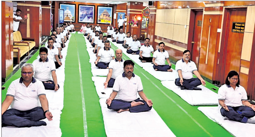
ଭାରତୀୟ ଷ୍ଟେଟ ବ୍ୟାଙ୍କ (ଏସ୍‌ବିଆଇ) ପକ୍ଷରୁ ଏମ ଆନ୍ତର୍ଜାତିକ ଯୋଗ ଦିବସ ଏସ୍‌ବିଆଇ ଭୁବନେଶ୍ୱର ମଣ୍ଡଳ ମୁଖ୍ୟ କାର୍ଯ୍ୟାଳୟରେ ପାଳିତ ହୋଇଯାଇଛି। ଏହି ପରିପ୍ରେକ୍ଷୀରେ ସତ୍ୟନାଥ ଯୋଗ ବିଦ୍ୟାଳୟ ଭୁବନେଶ୍ୱରର ପ୍ରଶିକ୍ଷକଙ୍କ ସହ ଏସ୍‌ବିଆଇର ବରିଷ୍ଠ ଅଧିକାରୀ ଓ କର୍ମଚାରୀମାନେ ଯୋଗ କରୁଛନ୍ତି। ଉଲ୍ଲେଖଯୋଗ୍ୟ, ରାଜ୍ୟର ସମସ୍ତ ଏସ୍‌ବିଆଇ ଶାଖା ଏବଂ ଶାଖା କାର୍ଯ୍ୟାଳୟରେ ମଧ୍ୟ ଏମ ଅନ୍ତରାଷ୍ଟ୍ରୀୟ ଯୋଗ ଦିବସ ପାଳିତ ହୋଇଯାଇଛି।