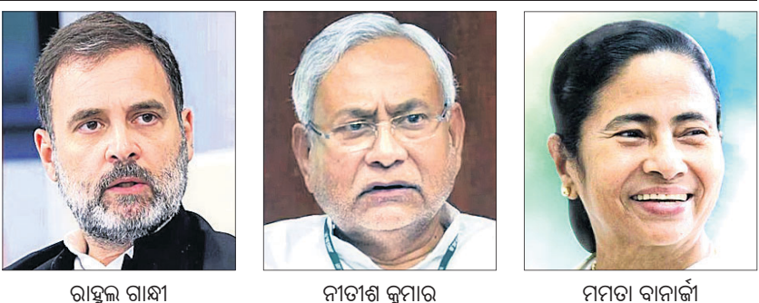
ରାହୁଲ ଗାନ୍ଧୀ ନୀତୀଶ କୁମାର ମନୋ ବାନାର୍ଜୀ

ସାଧାରଣ ନିର୍ବାଚନକୁ ପ୍ରାୟ ୧୦ ମାସ ବାକି ଥିବାବେଳେ କେନ୍ଦ୍ରରେ ଭାଜପା ନେତୃତ୍ୱାଧୀନ ଜାତୀୟ ଗଣତାନ୍ତ୍ରିକ ମେଣ୍ଟ (ଏନଡିଏ) ସରକାରକୁ କ୍ଷମତାଭ୍ୟୁତ କରିବା ପାଇଁ ବିରୋଧୀ ଜୋରଦାର ପ୍ରସ୍ତୁତି ଚଳାଇଛନ୍ତି। ବିହାର ମୁଖ୍ୟମନ୍ତ୍ରୀ ନୀତୀଶ କୁମାରଙ୍କ ନିମନ୍ତ୍ରଣକ୍ରମେ ଶୁକ୍ରବାର ପାଟନାରେ ବିରୋଧୀ ଦଳଗୁଡ଼ିକର ବିଶାଳ ସମାବେଶ ଆୟୋଜିତ ହେବାକୁ ଯାଉଛି। ଏଥିରେ ପ୍ରାୟ ୧୫ ବିପକ୍ଷ ଦଳର ନେତାମାନେ ଯୋଗଦେଇ ଶକ୍ତି ପ୍ରଦର୍ଶନ କରିବାର କାର୍ଯ୍ୟକ୍ରମ ରହିଛି। ପ୍ରତି ଲୋକ ସଭା ଆସନରେ ଭୋଟ ବିଭାଜନକୁ ଏଡ଼ାଇବା ପାଇଁ ଭାଜପା ବିପକ୍ଷରେ ବିରୋଧୀଙ୍କ ପକ୍ଷରୁ ମିଳିତ ପ୍ରାର୍ଥା ଦେବା ବୈଠକର ମୁଖ୍ୟ କାର୍ଯ୍ୟକ୍ରମ ହୋଇଥିବାରୁ ଏହା ଉପରେ ଦେଶବାସୀଙ୍କ ନଜର କେନ୍ଦ୍ରୀଭୂତ ହୋଇଛି।