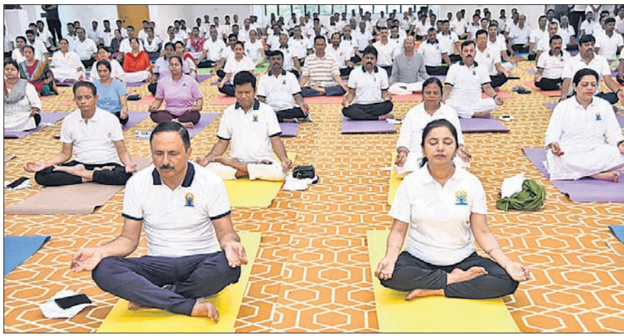
ପୂର୍ବତନ ରେଳପଥ ପକ୍ଷରୁ ଏମ ଅନ୍ତରାଷ୍ଟ୍ରୀୟ ଯୋଗ ଦିବସ ପାଳିତ ହୋଇଯାଇଛି। ଏହି ପରିପ୍ରେକ୍ଷୀରେ ଚନ୍ଦ୍ରଶେଖରପୁରସ୍ଥିତ ରେଳ ବିହାରଠାରେ ଆୟୋଜିତ ଏକ ସ୍ୱତନ୍ତ୍ର ଯୋଗ ଶିବିରରେ ଯୋଗଦେଇ ପୂର୍ବତନ ରେଳପଥର ମହାପ୍ରବନ୍ଧକ ମନୋଜ ଶର୍ମା, ଇକୋରୋର ସଭାପତି ବିଦ୍ୟା ଶର୍ମାଙ୍କ ସମେତ ବହୁ ବରିଷ୍ଠ ଅଧିକାରୀ ଓ ଅନ୍ୟମାନେ ଯୋଗ କରୁଛନ୍ତି।