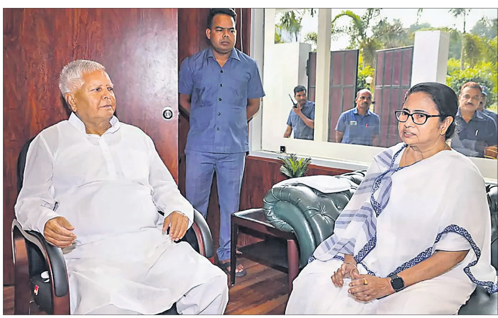
ପାଟନାଠାରେ ଗୁରୁବାର ପଶ୍ଚିମବଙ୍ଗ ମୁଖ୍ୟମନ୍ତ୍ରୀ ତଥା ଟିଏମ୍ସି ସୁପ୍ରିମୋ ନମତା ବାନାର୍ଜୀ ଆରଜେଡି ମୁଖ୍ୟ ଲାଲୁ ପ୍ରସାଦ ଯାଦବଙ୍କୁ ଭେଟି ଆଲୋଚନା କରୁଛନ୍ତି।