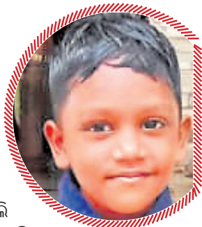
—ଆରତ ପାତ୍ର କ୍ଲାସ-୨, ଗାଇତାନ୍ତ ଇଂଲିଶ ମିଡ଼ିୟମ୍ ସ୍କୁଲ, ଭୁପୁଡ଼ୁମା, ଭୁବନେଶ୍ୱର

ପୂରା ପ୍ରସ୍ତୁତ ଛୁଟିରେ ଗାଁକୁ ଯାଇଥିଲି । ଗାଁରୁ ଫେରି ସବୁ ସଜାଡି ସ୍କୁଲ ଯିବାକୁ ପୂରା ପ୍ରସ୍ତୁତ ହୋଇଛି । ଏଥର ସ୍କୁଲକୁ ନେବା ପାଇଁ ମୋର ନୂଆ ବ୍ୟାଗ୍ ଆଉ ଟିଫିନ୍ କିଣା ହୋଇଛି । ହେଲେ ଏବର୍ଷ ୟୁନିଫର୍ମ କିଣିବାକୁ ପଡ଼ିନି । ବହି ଖାତା ସବୁଥିରେ ନୂଆ କଭର ବି ଲାଗେଇ ଦେଇଛି । ସବୁ ପ୍ରକାରର ପ୍ରସ୍ତୁତି କରି ସ୍କୁଲକୁ ଆସିଛି । ଏବେ ଖାଲି ପାଠ ପଢ଼ିବାକୁ ହେବ । ବହୁତ ଦିନ ବୁଲାରୁଲି ହୋଇଛି । ଏବେ ମନଦେଇ ପାଠ ପଢ଼ିବାକୁ ହେବ ବୋଲି ମାମା ତାରିଦ କରି ସାରିଛି । ଅବଶ୍ୟ ଗାଁରେ ଏତେଦିନ ରହିବା ପରେ ମନ ବହୁତ ଖୁସି ଅଛି । ତେଣୁ ସ୍କୁଲ ଯିବା ପାଇଁ ଭଲ ଲାଗୁଛି ।