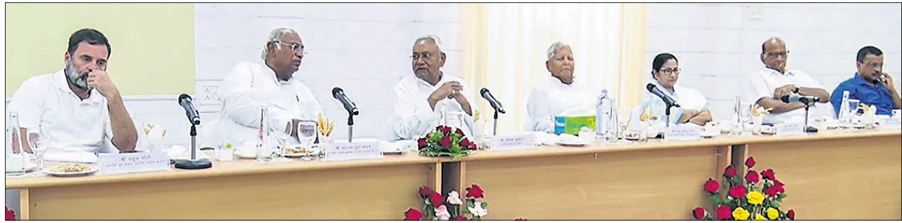
ପାଟନା ବୈଠକରେ କଂଗ୍ରେସ ନେତା ରାହୁଲ ଗାନ୍ଧୀ, ଅଧ୍ୟକ୍ଷ ମଲିକାର୍ଜୁନ ଖାର୍ଗେ, ବିହାର ମୁଖ୍ୟମନ୍ତ୍ରୀ ନୀତୀଶ କୁମାର, ଆରଜେଡି ମୁଖ୍ୟ ଲାଲୁ ପ୍ରସାଦ ଯାଦବ, ପଶ୍ଚିମବଙ୍ଗ ମୁଖ୍ୟମନ୍ତ୍ରୀ ମମତା ବାନାର୍ଜୀ, ଏନ୍‌ସିପି ମୁଖ୍ୟ ଶରଦ ପାଠାଏ ଏବଂ ଦିଲ୍ଲୀ ମୁଖ୍ୟମନ୍ତ୍ରୀ ଅରବିନ୍ଦ କେଜ୍‌ରିୱାଲ।

ମିଶନ ୨୦୨୪ ■ ପାଟନା ବୈଠକରେ ୩୨ ବିରୋଧୀ ନେତା ■ ଶିମ୍ଲୀ ବୈଠକରେ ପରଦର୍ଶୀ ରଣନାତି ■ କେଁ ପୁରାଇଲେ କେଜ୍‌ରିୱାଲ ■ ଶାହା କହିଲେ, ଫଟୋ ସେସନ୍ ଚାଲିଛି ଭାବେ ବାଛିବା। ଏପରି ସଂକଳ୍ପ ନେଇ ୧୭ ବିପକ୍ଷ ଦଳର ୩୨ ଜଣ ନେତା ବିହାର ମୁଖ୍ୟମନ୍ତ୍ରୀ ନୀତୀଶ କୁମାରଙ୍କ ସରକାରୀ ବାସଭବନରେ ପୂର୍ବାହ୍ନ ୧୧ଟା ୩୦ରେ ଏକତ୍ରିତ ହୋଇଥିଲେ। ବିରୋଧୀଙ୍କ ଏହି ବୈଠକ ୪ ଘଣ୍ଟା ଧରି ଚାଲିଥିଲା। ଏଥିରେ ଅଧ୍ୟକ୍ଷତା କରିଥିବା ସଂଯୁକ୍ତ ଜନତା ଦଳ (ଜେଡିୟୁ) ନେତା ନୀତୀଶ ଏକ ମିଳିତ ଖବରଦାତା ସମ୍ମିଳନୀକୁ ସମୋ୍ପାତ କରି କହିଛନ୍ତି, ଆମେ ଜାତୀୟ ସ୍ୱାର୍ଥ ପାଇଁ କାମ କରୁଛୁ। କିନ୍ତୁ ଭାଜପା ଦେଶର ସ୍ୱାର୍ଥ ବିରୋଧରେ ଯାଉଛି। ବୈରିକ ଦଳ ଭାରତର ଇତିହାସକୁ ବଦଳାଇବାକୁ ଉଦ୍ୟମ କରୁଛି। ଏଥିଲାଗି ମିଳିତ ରଣନୀତିକୁ ରୂପାନ୍ତ ରୂପ ଦେବା ପାଇଁ ଆମେ ଶିମ୍ଲୀରେ ପୁଣି ଏକାଠି ହେବୁ ବୋଲି ନୀତୀଶ କହିଥିଲେ। ସୂତ୍ରରୁ ଜଣାପଡ଼ିଛି ଯେ, ଦିଲ୍ଲୀ ମୁଖ୍ୟମନ୍ତ୍ରୀ ଅରବିନ୍ଦ କେଜ୍‌ରିୱାଲ ଅମଳାତନ୍ତ୍ରୀ ନିୟନ୍ତ୍ରଣ ସମ୍ପର୍କିତ କେନ୍ଦ୍ରର ଅଧ୍ୟାଦେଶ ବିରୋଧରେ କଂଗ୍ରେସ ଖୋଲାଖୋଲି ଭାବେ ନିଜ ଆଭିମୁଖ୍ୟ ସ୍ପଷ୍ଟ କରୁ ବୋଲି କହିଥିଲେ। ରାଜ୍ୟ ସଭାରେ କଂଗ୍ରେସ ସଦସ୍ୟମାନେ ଏହି ଅଧ୍ୟାଦେଶକୁ ରୋକିବାରେ ସମର୍ଥନ ନ କଲେ ଭବିଷ୍ୟତରେ ବିରୋଧୀଙ୍କ କୌଣସି ବୈଠକରେ ତାଙ୍କ ଆମ୍ ଅଧିକାରୀ ପାର୍ଟି (ଏଏପି) ସାମିଲ ହେବ ନାହିଁ ବୋଲି ସେ କହିଥିଲେ। ଏହି ପ୍ରସଙ୍ଗକୁ ନେଇ ଏଏପି ଏବଂ କଂଗ୍ରେସ ମଧ୍ୟରେ ମତଭେଦ ଦେଖାଦେଇଥିଲା। କଂଗ୍ରେସ ଅଧ୍ୟକ୍ଷ ମଲିକାର୍ଜୁନ ଖାର୍ଗେ କହିଥିଲେ, ଶିମ୍ଲୀ ବୈଠକରେ ଏକ ସାଧାରଣ କାର୍ଯ୍ୟସୂଚୀ ପ୍ରସ୍ତୁତ ହେବୁ।