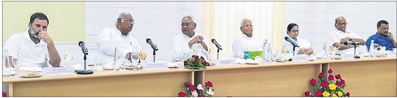
ପାଟନା ବୈଠକରେ କଂଗ୍ରେସ ନେତା ରାହୁଲ ଗାନ୍ଧୀ, ଅଧ୍ୟକ୍ଷ ମଲିକାର୍ଜୁନ ଖାର୍ଗେ, ବିହାର ମୁଖ୍ୟମନ୍ତ୍ରୀ ନୀତୀଶ କୁମାର, ଆରଜେଡି ମୁଖ୍ୟ ଲାଲୁ ପ୍ରସାଦ ଯାଦବ, ପଶ୍ଚିମବଙ୍ଗ ମୁଖ୍ୟମନ୍ତ୍ରୀ ମମତା ବାନାର୍ଜୀ, ଏନ୍‌ସିପି ମୁଖ୍ୟ ଶରଦ ପାଠାଏ ଏବଂ ଦିଲ୍ଲୀ ମୁଖ୍ୟମନ୍ତ୍ରୀ ଅରବିନ୍ଦ କେଜ୍ରିୱାଲ।

ମିଶନ ୨୦୨୪ ■ ପାଟନା ବୈଠକରେ ୩୨ ବିରୋଧୀ ନେତା ■ ଶିମ୍ଲୀ ବୈଠକରେ ପରଦର୍ଶୀ ରଣନାତି ■ କେଁ ପୁରାଇଲେ କେଜ୍ରିୱାଲ ■ ଶାହା କହିଲେ, ଫଟୋ ସେସନ୍ ଚାଲିଛି ଭାବେ ବାଛିବା। ଏପରି ସଂକଳ୍ପ ନେଇ ୧୭ ବିପକ୍ଷ ଦଳର ୩୨ ଜଣ ନେତା ବିହାର ମୁଖ୍ୟମନ୍ତ୍ରୀ ନୀତୀଶ କୁମାରଙ୍କ ସରକାରୀ ବାସଭବନରେ ଶୁକ୍ରବାର ପୂର୍ବାହ୍ନ ୧୧ଟା ୩୦ରେ ଏକତ୍ରିତ ହୋଇଥିଲେ। ବିରୋଧୀଙ୍କ ଏହି ବୈଠକ ୪ ଘଣ୍ଟା ଧରି ଚାଲିଥିଲା। ଏଥିରେ ଅଧ୍ୟକ୍ଷତା କରିଥିବା ସଂଯୁକ୍ତ ଜନତା ଦଳ (କେଜ୍ରିୱାଲ) ନେତା ନୀତୀଶ ଏକ ମିଳିତ ଖବରଦାତା ସମ୍ମିଳନୀକୁ ସମ୍ବୋଧିତ କରି କହିଛନ୍ତି, ଆମେ ଜାତୀୟ ସ୍ତରୀୟ ପାଇଁ କାମ କରୁଛୁ। କିନ୍ତୁ ଭାଜପା ଦେଶର ସ୍ୱାର୍ଥ ବିରୋଧରେ ଯାଉଛି। ବୈରିକ ଦଳ ଭାରତର ଇତିହାସକୁ ବଦଳାଇବାକୁ ଉଦ୍ୟମ କରୁଛି। ଏଥିଲାଗି ମିଳିତ ରଣନୀତିକୁ ରୂପାନ୍ତ ରୂପ ଦେବା ପାଇଁ ଆମେ ଶିମ୍ଲୀରେ ପୁଣି ଏକାଠି ହେବୁ ବୋଲି ନୀତୀଶ କହିଥିଲେ। ସ୍ୱତନ୍ତ୍ର ଜଣାପଡ଼ିଛି ଯେ, ଦିଲ୍ଲୀ ମୁଖ୍ୟମନ୍ତ୍ରୀ ଅରବିନ୍ଦ କେଜ୍ରିୱାଲ ଅମଳାତନ୍ତ୍ରୀ ନିୟନ୍ତ୍ରଣ ସମ୍ପର୍କିତ କେନ୍ଦ୍ରର ଅଧ୍ୟାଦେଶ ବିରୋଧରେ କଂଗ୍ରେସ ଖୋଲାଖୋଲି ଭାବେ ନିଜ ଆଭିମୁଖ୍ୟ ସ୍ପଷ୍ଟ କରୁ ବୋଲି କହିଥିଲେ। ରାଜ୍ୟ ସଭାରେ କଂଗ୍ରେସ ସଦସ୍ୟମାନେ ଏହି ଅଧ୍ୟାଦେଶକୁ ରୋକିବାରେ ସମର୍ଥନ ନ କଲେ ଭବିଷ୍ୟତରେ ବିରୋଧୀଙ୍କ କୌଣସି ବୈଠକରେ ତାଙ୍କ ଆତ୍ମ ଆତ୍ମା ପାର୍ତି (ଏଏପି) ସାମିଲ ହେବ ନାହିଁ ବୋଲି ସେ କହିଥିଲେ। ଏହି ପ୍ରସଙ୍ଗକୁ ନେଇ ଏଏପି ଏବଂ କଂଗ୍ରେସ ମଧ୍ୟରେ ମତଭେଦ ଦେଖାଦେଇଥିଲା। କଂଗ୍ରେସ ଅଧ୍ୟକ୍ଷ ମଲିକାର୍ଜୁନ ଖାର୍ଗେ କହିଥିଲେ, ଶିମ୍ଲୀ ବୈଠକରେ ଏକ ସାଧାରଣ କାର୍ଯ୍ୟସୂଚୀ ପ୍ରସ୍ତୁତ ହେବୁ-୪