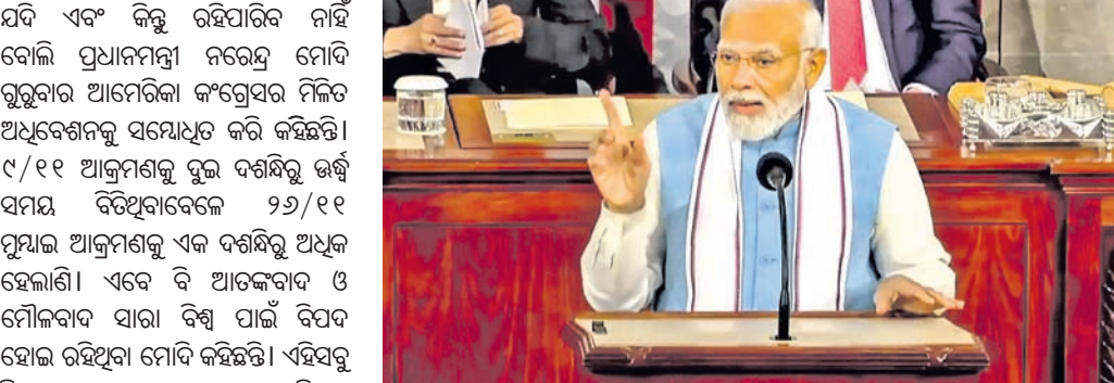
ଆମେରିକା କଂଗ୍ରେସରେ ମିଳିତ ଅଧିବେଶନରେ ପ୍ରଧାନମନ୍ତ୍ରୀ ନରେନ୍ଦ୍ର ମୋଦି।

ଆମେରିକାରେ ଥିବା ଭାରତୀୟମାନଙ୍କୁ ପ୍ରଧାନମନ୍ତ୍ରୀ ନରେନ୍ଦ୍ର ମୋଦି ଉକ୍ତ ପ୍ରଶଂସା କରିଛନ୍ତି। ସେମାନେ କେବଳ ସେଲିଂ ବି'ରେ ରୁହନ୍ତି ସବୁ କ୍ଷେତ୍ରରେ ପ୍ରତିଭାଶାଳୀ ଓ ଦକ୍ଷ।