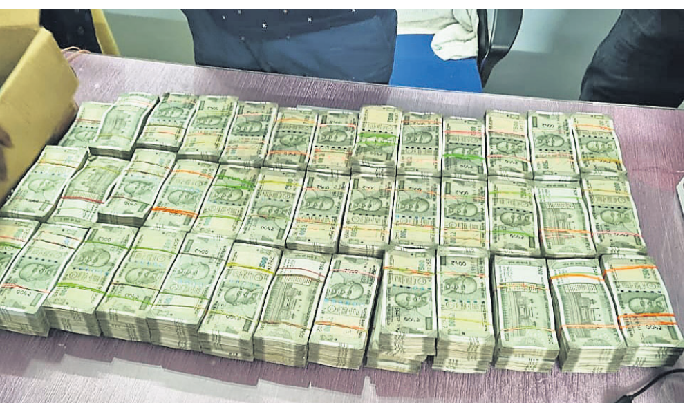
ଅତିରିକ୍ତ ଉପଜିଲ୍ଲାପାଳଙ୍କ ଘରୁ ଜବତ ହୋଇଥିବା ଟଙ୍କା ।