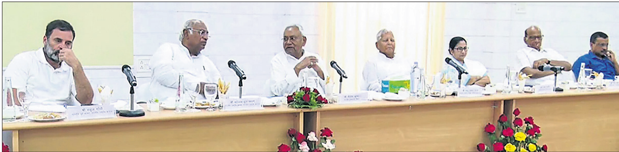
ପାଟନା ବୈଠକରେ କଂଗ୍ରେସ ନେତା ରାହୁଲ ଗାନ୍ଧୀ, ଅଧକ୍ଷ ମଲିକାର୍ଜୁନ ଖାର୍ଗେ, ବିହାର ମୁଖ୍ୟମନ୍ତ୍ରୀ ନୀତୀଶ କୁମାର, ଆରଜେଡି ମୁଖ୍ୟ ଲାଲୁ ପ୍ରସାଦ ଯାଦବ, ପଶ୍ଚିମବଙ୍ଗ ମୁଖ୍ୟମନ୍ତ୍ରୀ ମମତା ବାନାର୍ଜୀ, ଏନ୍‌ସିପି ମୁଖ୍ୟ ଶରଦ ପାଠାଏ ଏବଂ ଦିଲ୍ଲୀ ମୁଖ୍ୟମନ୍ତ୍ରୀ ଅରବିନ୍ଦ କେଜ୍‌ରିୱାଲ।