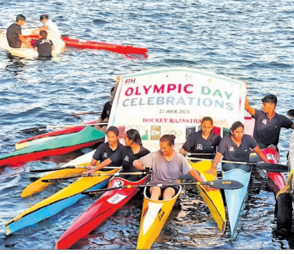
ଅଲିମ୍ପିକ ଦିବସ ପାଳନ ଅବସରରେ ଶୁକ୍ରବାର ହକି ଇଣ୍ଡିଆ ପକ୍ଷରୁ ଭାରତର ବିଭିନ୍ନ ସ୍ଥାନରେ ଅନୁଷ୍ଠିତ ଭିନ୍ନଭିନ୍ନ କାର୍ଯ୍ୟକ୍ରମ।

କେଉଁ ପୁଲ୍‌ରେ କିଏ ପୁଲ୍ 'ଏ': ଅଷ୍ଟେଲିଆ, ଚିଲି, ନେଦରଲାଣ୍ଡ, ଦକ୍ଷିଣ ଆଫ୍ରିକା ପୁଲ୍ 'ବି': ଆର୍ଜେଣ୍ଟିନା, କୋରିଆ, ସ୍ପେନ୍, ଜିମ୍ବାୱେ ପୁଲ୍ 'ସି': ବେଲଜିୟମ, କାନାଡା, ଜର୍ମାନୀ, ଭାରତ ପୁଲ୍ 'ଡି': ଇଂଲଣ୍ଡ, ଜାପାନ, ସ୍ୱିଜ୍ଜରଲ୍ୟାଣ୍ଡ, ଆମେରିକା