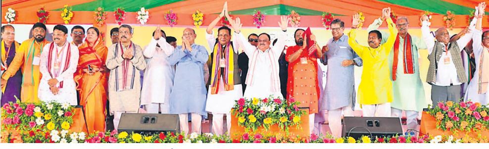
ଭାଜପା ପହାଞ୍ଚନସମ୍ପର୍କ ଅଭିଯାନରେ ରାଷ୍ଟ୍ରୀୟ ଅଧ୍ୟକ୍ଷ ଜେ.ପି. ନଞ୍ଜା ଓ ଦଳୀୟ ନେତୃବୃନ୍ଦ।

ରେକ ଟ୍ରାକ୍ ବିନ୍ୟାସକରଣ ହୋଇଛି। ଭୁବନେଶ୍ୱର, କଟକ, ପୁରୀରେ ଷ୍ଟେଶନ ଉନ୍ନତୀକରଣ ହୋଇଛି। ରାଜ୍ୟରେ ୭ଟି ମେଡିକାଲ କଲେଜ ହୋଇଛି। ୩ଟି କାର୍ଯ୍ୟକାରୀ ହୋଇଛି, ୪ଟି ଖୁବ୍ ଶୀଘ୍ର ହେବ। କଳାହାଣ୍ଡିରେ ମଧ୍ୟ ମେଡିକାଲ କଲେଜ ହୋଇଛି। ପୁଣି ପଞ୍ଚା ଥାନାରେ ଓଡ଼ିଶା କମ୍ପା, ଚାଷୀଙ୍କ ଆମଦାନୀରେ ବି ଓଡ଼ିଶା କମ୍, ମହିଳା ଶୋଷଣର ଶିକାର ହେଉଛନ୍ତି। ଭୁଷ୍ମାଚାରର ସରକାର ଚାଲିଛି, ୫୦ ପ୍ରତିଶତ କମିଶନରେ ଚାଲିଛି। ନବୀନ ପକ୍ଷନାୟକ କହିଥିଲେ, ସବୁ କୁଳରେ ଶୀତଳ ଭଣ୍ଡାର ହେବ, ହୋଇଛି କି ବୋଲି ପ୍ରଶ୍ନ ପଚାରିଥିଲେ। ରାଜ୍ୟକୁ ଚଳାଉଛି କିଏ ନେତା ନା ଅଧିକାରୀ। ରାଜ୍ୟରେ ନବୀନ ବାବୁ ସରକାରରେ ଭୁଷ୍ମାଚାର ଚାଲିଛି। ବିଜେଡି ଏମ୍ପି ଓ ବିଧାୟକଙ୍କ କଥା କେହି ଶୁଣୁନାହାନ୍ତି। ନବୀନ ପକ୍ଷନାୟକ ଅଧିକାରୀଙ୍କ ହାତରେ ପୁରୀ ଶାସନକୁ ଟେକି ଦେଇଛନ୍ତି ବୋଲି ନଞ୍ଜା କହିଥିଲେ। ସମାନ ଭାବେ କଂଗ୍ରେସ ଉପରେ ବ୍ୟାପକ ଯୋଗାଣ ହେଉଛି। ନଞ୍ଜା କହିଥିଲେ ମୋତିକୁ ପ୍ରଶଂସା କଲେ କଂଗ୍ରେସକୁ କଷ୍ଟ ତଦନ୍ତ ହେବା କଥା। ଚିରିରାଜ ସିଂହଙ୍କୁ କହିବ ତଦନ୍ତ କରିବା ପାଇଁ, ଦୁଧ କା ଦୁଧ ପାଣି କା ପାଣି ହେବ। ଯେଉଁମାନେ ଭୁଷ୍ମାଚାର କରିଛନ୍ତି ସେମାନଙ୍କୁ ଜେଲ ପଠାଯିବ। ନବୀନ ପକ୍ଷନାୟକ ଚାହୁଁ ନାହାନ୍ତି ଆୟୁଷ୍ମାନ ଯୋଜନାରେ ଓଡ଼ିଶା ଲୋକଙ୍କୁ ସୁଧିଆ ମିଳୁ। ଓଡ଼ିଶାରେ ସମସ୍ତ