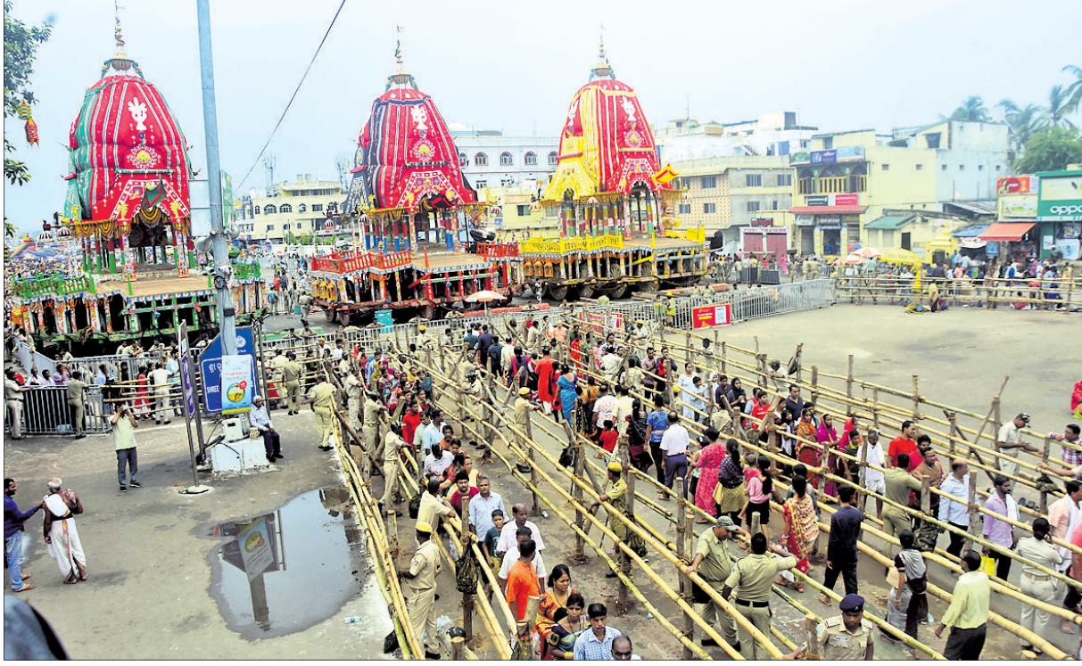
ଆଡ଼ପମଣ୍ଡପରେ ଦାରୁବିଗ୍ରହକୁ ଦର୍ଶନ କରିବା ପାଇଁ ଶୁକ୍ରବାର ଶ୍ରଦ୍ଧାଳୁମାନେ ଲମ୍ବାଧିକରେ ଶ୍ରୀଗୁଣ୍ଡିଚା ମନ୍ଦିରକୁ ଯାଉଛନ୍ତି।

ଓଡ଼ିଆ ଜଗତମାଳି ଓ ଲୋକଗୀତ - ପ୍ରେମ୍‌ଶଫ୍ଟ ପରିଶ୍ରମୀ