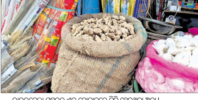
ରାଉରକେଲା ସହରର ଏକ ଦୋକାନରେ ବିକ୍ରି ହେଉଥିବା ଅଦା।

ଖାଦ୍ୟ ପ୍ରସ୍ତୁତିରେ ପ୍ରମୁଖ ମସଲା ଭାବେ ବ୍ୟବହାର କରାଯାଉଥିବା ଅଦା ଦର ବଜାର ଦର ହୁ ହୁ ହୋଇ ବଢ଼ିଚାଲିଛି।