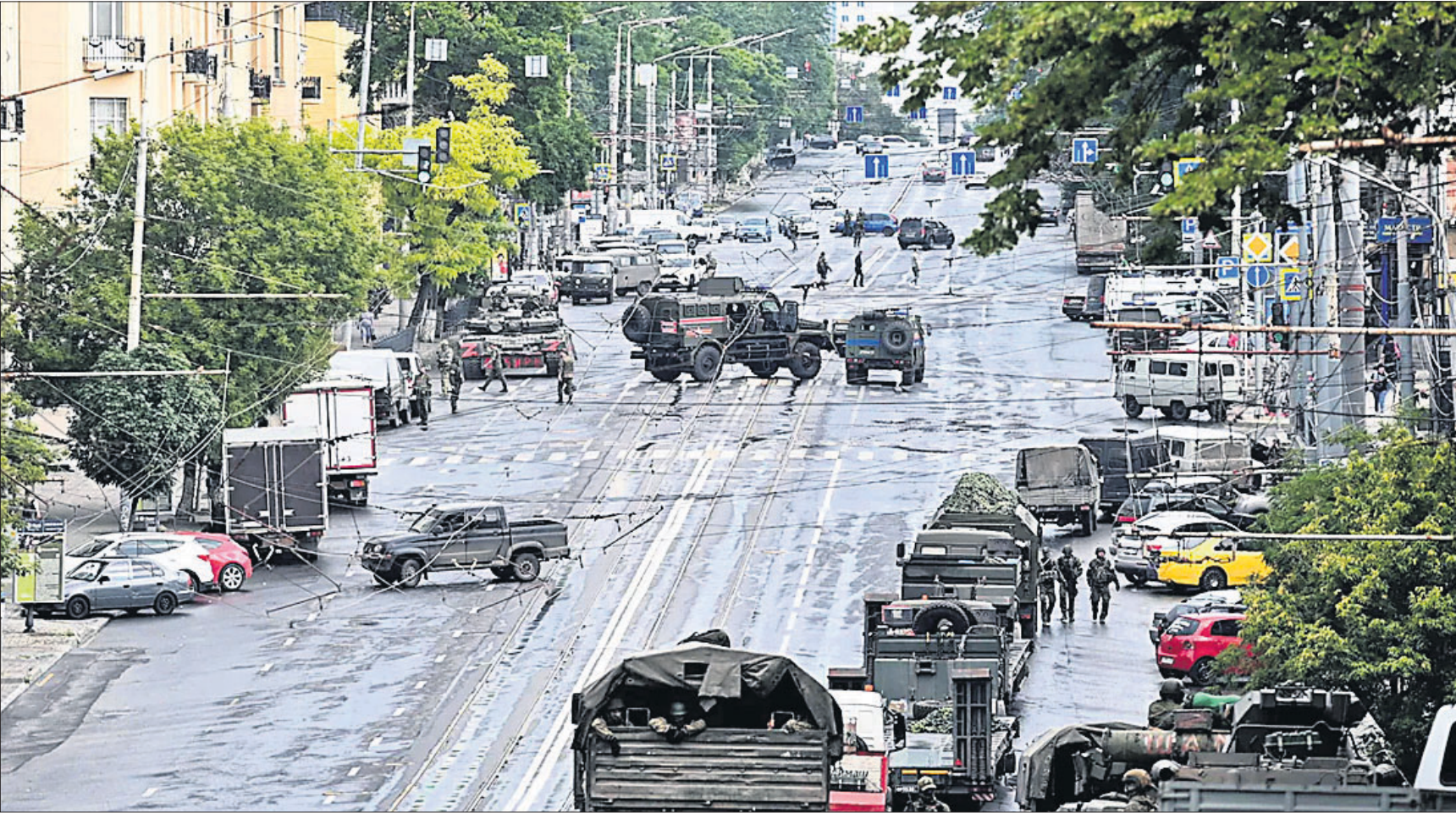
ରୁଷିଆର ବିଦ୍ରୋହୀ ଘରୋଇ ସେନା 'ଓଗନର'ର ଯୋଦ୍ଧାମାନେ ଶନିବାର ରୋଷ୍ଟୋଭ୍-ଅନ୍-ଡନ୍ ସହର ଦଖଲ କରିଛନ୍ତି।