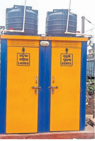
ତାଲା ପଡ଼ିଥିବା ପ୍ଲାନିଂଫର ଝରପୁରୁଡ଼ା ପଟ ମହିଳା ପୁରୁଷ ଟଏଲେଟ୍।

ଉପଯୋଗୀ ନ ଥିଲା ବୋଲି ଜଣେ ଯାତ୍ରୀ କହିଛନ୍ତି। ଉଲ୍ଲେଖନୀୟ, ପ୍ଲାନିଂଫ ନ-୪ ଓ ୫ର ବିପରୀତ ଦିଗ ଅର୍ଥାତ୍ ରାଷ୍ଟ୍ର ରେଳପଥ ପଟକୁ ପୁଖ୍ୟ ପ୍ଲାନିଂଫ ରୁଟର ଦୁଇଟି ନାହିଁ।