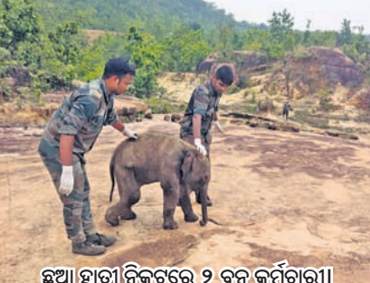
ଛୁଆ ହାତୀ ନିକଟରେ ୨ ବନ କର୍ମଚାରୀ।