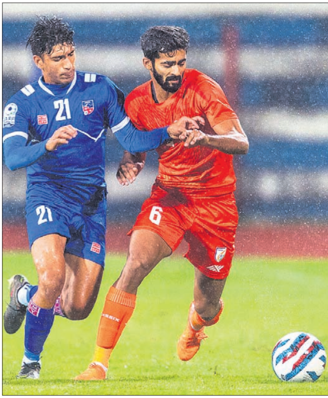
ଭାରତ ଓ ନେପାଳ ମଧ୍ୟରେ ଅନୁଷ୍ଠିତ ମ୍ୟାଚର ଏକ ସଂଘର୍ଷପୂର୍ଣ୍ଣ ସୂଚକ।

ବେଙ୍ଗାଳୁରୁ, ୨୪।୬ କ୍ରମାଗତ ଦ୍ୱିତୀୟ ବିଜୟ ସହ ଭାରତ ଓ କୁଏଟ୍ ଶ୍ରୀ କାନ୍ତିରଥା ଷ୍ଟାଡ଼ିୟମରେ ଚାଲିଥିବା ସାମ୍ରାଜ୍ୟ ଚାମ୍ପିୟନସ୍‌ସିପର ସେମିଫାଇନାଲରେ ପ୍ରବେଶ କରିଛନ୍ତି। ଶନିବାର ଅନୁଷ୍ଠିତ ଲିଗ୍ ମ୍ୟାଚରେ ଭାରତ ୨-୦ ଗୋଲରେ ନେପାଳକୁ ହରାଇଥିବାବେଳେ ଅନ୍ୟ ଏକ ମ୍ୟାଚରେ କୁଏଟ୍ ୪-୦ ଗୋଲରେ ପାକିସ୍ତାନକୁ ପରାସ୍ତ କରିଛି। ଅନ୍ୟପକ୍ଷରେ ୨ଟି ଲେଖାଏ ପରାଜୟ ସହ ନେପାଳ ଓ