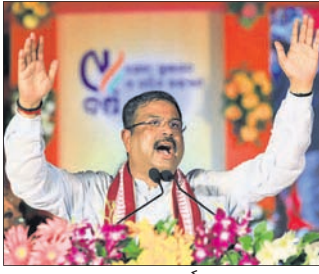
କେନ୍ଦ୍ରମନ୍ତ୍ରୀ ଧର୍ମେନ୍ଦ୍ର ପ୍ରଧାନ

୨୦୨୩ ଜାନୁଆରୀରୁ ଜୁନ, ଏହି ୬ ମାସ ମଧ୍ୟରେ ରାଜ୍ୟର ଦୁର୍ଗତିପ୍ରସ୍ତ କର୍ମଚାରୀଙ୍କ ଠାରୁ ୧୦୦ କୋଟିରୁ ଅଧିକ ଟଙ୍କା ଜବତ ହୋଇଛି। ନବରଙ୍ଗପୁରର ଅତିରିକ୍ତ ଉପଜିଲ୍ଲାପାଳଙ୍କ ଘରୁ ଭିକ୍ଷାକୁ ନଗଦ ୩ କୋଟି ଟଙ୍କା ଜବତ କରିଛି। ଏହା କଂଗ୍ରେସର 'ଷ୍ଟପ୍ ପିସି'ର ଉଦ୍ଦେଶ୍ୟ ବୋଲି ଶନିବାର ଅନୁଗୋଳ ଜିଲ୍ଲା ତାଳଚେର ଦେଉଳବେଡ଼ା ଠାରେ ଆୟୋଜିତ ଗରିବ କଲ୍ୟାଣ ସମାବେଶରେ ଯୋଗଦେଇ ରାଜ୍ୟ ସରକାରଙ୍କୁ ପ୍ରଶ୍ନ କରିଛନ୍ତି କେନ୍ଦ୍ରମନ୍ତ୍ରୀ ଧର୍ମେନ୍ଦ୍ର ପ୍ରଧାନ। କେନ୍ଦ୍ର ସରକାର ଦେଉଥିବା ଟଙ୍କା ଗରିବ ଲୋକଙ୍କ ପାଖରେ କିପରି ନ ପହଞ୍ଚୁ, ସେ ନେଇ ଷଡ଼ଯନ୍ତ୍ର ହେଉଛି। ତେଣୁ ୨୩ ବର୍ଷର ଅପାରାଧ ଓଡ଼ିଶା ସରକାରକୁ ପରିବର୍ତ୍ତନ କରିବା ପାଇଁ ସଂକଳ୍ପ ନେବାକୁ ଧର୍ମେନ୍ଦ୍ର ରାଜ୍ୟବାସୀଙ୍କୁ ଆହ୍ୱାନ ଦେଇଛନ୍ତି। କେନ୍ଦ୍ର ସରକାର ଗରିବ କଲ୍ୟାଣର ଏବଂ ପୂର୍ଣ୍ଣ ଅବସରରେ ଆୟୋଜିତ ଏହି ସମାବେଶରେ ଯୋଗଦେଇ ଧର୍ମେନ୍ଦ୍ର କହିଛନ୍ତି ଯେ, ରାଜ୍ୟରେ ଗରିବ, ଜନଜାତି, ପଞ୍ଚୁଆ ଲୋକଙ୍କ ଖତିଭିତ୍ତି ପାଇଁ ବାଟନାମା