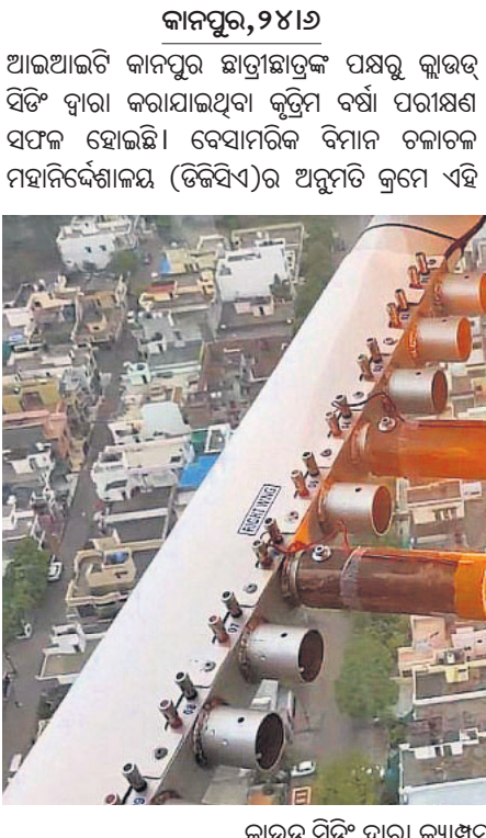
କ୍ଲାଉଡ୍ ସିଟିଂ ଦ୍ୱାରା କ୍ୟାମ୍ପସ୍‌ରେ କୃତ୍ରିମ ବର୍ଷା ପରୀକ୍ଷଣ ବେଳର ଦୃଶ୍ୟ

କାନପୁର, ୨୪।୬ ଆଇଆଇଟି କାନପୁର ଛାତ୍ରାଛାତ୍ରୀଙ୍କ ପକ୍ଷରୁ କ୍ଲାଉଡ୍ ସିଟିଂ ଦ୍ୱାରା କରାଯାଇଥିବା କୃତ୍ରିମ ବର୍ଷା ପରୀକ୍ଷଣ ସଫଳ ହୋଇଛି। ବେସାମରିକ ବିମାନ ଚଳାଚଳ ମହାନିର୍ଦ୍ଦେଶାଳୟ (ଡିଜିଏସ୍‌ଏ)ର ଅନୁମତି କ୍ରମେ ଏହି ପରୀକ୍ଷଣ କରାଯାଇଛି। ପୂର୍ବରୁ ରାଜ୍ୟ ସରକାର କୃତ୍ରିମ ବର୍ଷା ପରୀକ୍ଷଣ ନେଇ ସହମତି ପ୍ରଦାନ କରିଥିଲେ। କଲେଜ କ୍ୟାମ୍ପସ୍‌ରେ ପାଖାପାଖି ୫୦୦୦ ଫୁଟ ଉପରେ ସେମ୍ପାନ ବିମାନ ରହି କ୍ଲାଉଡ୍ ସିଟିଂ ଚେକ୍‌ନୋଲୋଜି ବ୍ୟବହାର କରି କିଛି କେମିକାଲ ପାଉଡର ବାଦଲ ଉପରକୁ ଛାଡ଼ିଥିଲା। ଏହାର କିଛି ମୁହୂର୍ତ୍ତରେ ଚଳିଥିଲା-୪