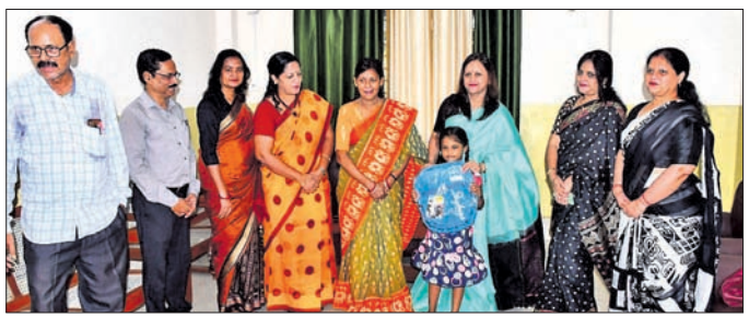
ପ୍ରଥମ ଶ୍ରେଣୀର ଜଣେ ଛାତ୍ରୀଙ୍କୁ ସ୍କୁଲ ବ୍ୟାଗ ପ୍ରଦାନ କରାଯାଇଛି।

ରାଉରକେଲା, ସେପ୍ଟେମ୍ବର-୧୮ ସ୍ଥିତ ନିଷ୍ଠୁଲ ଇନ୍ଦ୍ରାତ ଶିକ୍ଷା ସଦନରେ ଶନିବାର ପ୍ରଥମ ଶ୍ରେଣୀ ଛାତ୍ରାଛାତ୍ରୀମାନଙ୍କୁ ସ୍କୁଲ ବ୍ୟାଗ୍ ସହ ପାଠ୍ୟ ଉପକରଣ ବଣ୍ଟନ କରାଯାଇଛି।