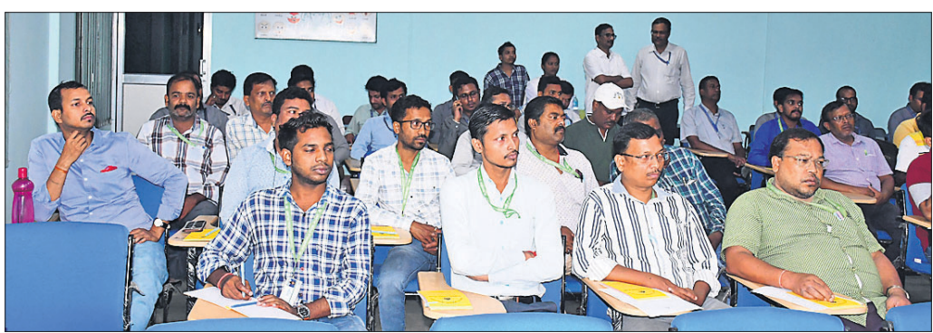
ତାଲିମ କାର୍ଯ୍ୟକ୍ରମରେ ଯୋଗ ଦେଉଥିବା କର୍ମଚାରୀଗଣ।

ରାଉରକେଲା, ୨୪।୬(ବିପ୍ଳବ ରଞ୍ଜନ ଦାଶ): ଆର୍ଏସ୍‌ପିର କାତାୟ ପୁରଣା ପରିଷଦ ଓ ଓଡ଼ିଶା ଶାଖା ପକ୍ଷରୁ ଏକ ତିନିଦିନିଆ ପ୍ରାଥମିକ ଚିକିତ୍ସା ତାଲିମ କାର୍ଯ୍ୟକ୍ରମର ଆରମ୍ଭ ହୋଇଛି।