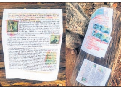
ଗପରାଜରେ ମାଓବାଦୀଙ୍କ ପୋଷ୍ଟର ଲାଗିଛି।