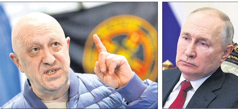
ଓଗନର ଗ୍ରୁପ୍ ମୁଖ୍ୟ ଯେଭଗେନି ପ୍ରିଗୋଡିନ୍ ରୁଷିଆ ରାଷ୍ଟ୍ରପତି ଭ୍ଲାଡିମିର ପୁଟିନ୍