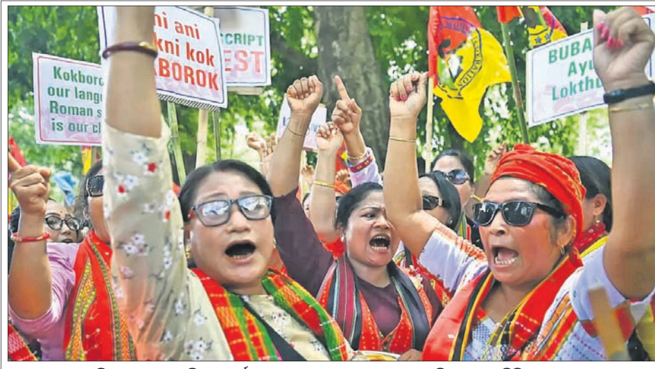
ଡିପ୍ଲୋମାଆର ମହକା ମୋର୍ଚ୍ଚା ପକ୍ଷରୁ କୋକବୋରୋକ ଜାଷା ଲାଗି ରୋମାନ୍ ଲିପି ବ୍ୟବହାର ଦାବିରେ ଶନିବାର ଅଗରତାଳାଠାରେ ବିକ୍ଷୋଭ ପ୍ରଦର୍ଶନ କରାଯାଇଛି।

କେଲରେ ରଖାଯାଇଛି। ଯଦି ଏହି ଦେଶକୁ ବଞ୍ଚାଇବାକୁ ପଡିବ ତେବେ ବିରୋଧୀଙ୍କୁ ଏକାଠି ହେବାକୁ ପଡିବ। ଆଜି ଆମର କୁସ୍ତିଯୋଦ୍ଧା ଝିଆମାନେ ଯତ୍ନ ପତ୍ତନରେ ଧାରଣାରେ ବସିଛନ୍ତି। କିନ୍ତୁ ଯିଏ ଅଭିଯୁକ୍ତ ବାହାରେ ସେ ମୁକ୍ତ ଭାବେ ବୁଲୁଛନ୍ତି। ଏଥି ସହିତ ସେ କହିଛନ୍ତି, ମୁଁ ଭାବୁଛି କଂଗ୍ରେସ ଏକ ବଡ଼ ଦଳ ଯାହାକୁ ନେଇ ସମସ୍ତେ ଏକାଠି ହୋଇଛନ୍ତି। ଆମର ଏବଂ ଉତ୍କଳ ଠାକରେକ ମଧ୍ୟରେ ପାର୍ଥକ୍ୟ ଅଛି, କିନ୍ତୁ ଗୋଟିଏ ଲକ୍ଷ୍ୟ ନେଇ ଆମେ ଏକତ୍ର ହୋଇଛୁ ବୋଲି ମେହରୁବା କହିଛନ୍ତି।