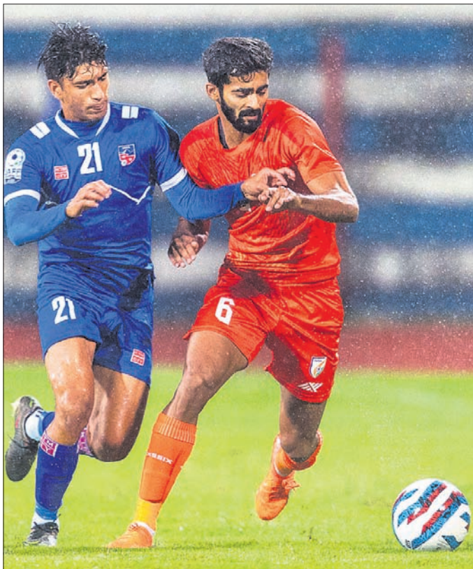
ଭାରତ ଓ ନେପାଳ ମଧ୍ୟରେ ଅନୁଷ୍ଠିତ ମ୍ୟାଚର ଏକ ସଂଘର୍ଷପୂର୍ଣ୍ଣ ମୁହୂର୍ତ୍ତ।

ପାକିସ୍ତାନ ଦଳ ଏଲିମିନେଟ ହୋଇଛନ୍ତି। କେବଳ ଓପିବାର୍ତିକତା ଦୃଷ୍ଟିରୁ ଏହି ଦୁଇ ୪୪ ରନ୍ର ଇନିଂସ ଖେଳିଥିଲେ। ବିମଣ୍ଟ ବିତୀର ଉଇକେଟରେ ନାଇଟ୍ ସହିତ ୧୧୫ ରନ୍ ଯୋଡ଼ିଥିବା ବେଳେ ସିଭର ବ୍ରଷ୍ଟ ସହିତ ୧୩୭ ରନ୍ ଯୋଡ଼ିଥିଲେ। ଡାନିଏଲଙ୍କ ସହିତ ୫ମ ଉଇକେଟରେ ୭୨ରନ୍ ଯୋଡ଼ିଥିବା ବେଳେ ଅତିମ ୫ ବ୍ୟାଟରଙ୍କ ସହିତ ୫୨ ରନ୍ ଯୋଡ଼ି ନିଜର ଦ୍ୱିଶତକ ପୂରଣ କରିଥିଲେ। ଆଷ୍ଟ୍ରେଲିଆ ପକ୍ଷରୁ ଆସ୍କଲେ ଗାର୍ଡନର ୪ ଓ ଟାଲିଆ ମ୍ୟାକଗ୍ରା ୩ ଉଇକେଟ ନେଇଥିଲେ। ଅନ୍ୟମାନଙ୍କ ମଧ୍ୟରେ ଏଲିସ୍ ପେରୀ, ଆନାବେଲ ସ୍ୱବରଲାଣ୍ଡ ଓ ଡାର୍ସି ବ୍ରାଉନ୍ ଗୋଟିଏ ଲେଖାଏ ଉଇକେଟ ନେଇଛନ୍ତି।