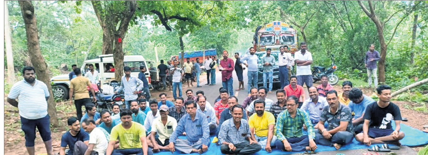
କାଜମାଟିଠାରେ ଅଞ୍ଚଳବାସୀଙ୍କ ରାସ୍ତାରେକୋ ।