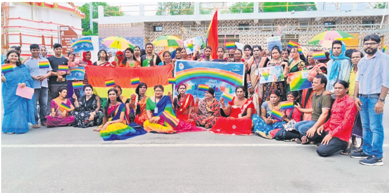
କିନରାଳ ଅଧିକାର ବିଷୟରେ ସଚେତନ କରାଇବାକୁ ଅନୁଗୋଳ ସହରରେ ଶନିବାର ଅନୁଷ୍ଠିତ ହୋଇଯାଇଛି ରେନୁକା କାର୍ଯ୍ୟକ୍ରମ । ଏହି ଅବସରରେ କିନର ସଂଘର କର୍ମକର୍ତ୍ତା, ବୁଦ୍ଧିବାବାଙ୍କ ସମେତ ସ୍ୱେଚ୍ଛାସେବୀ ଅନୁଷ୍ଠାନର କର୍ମକର୍ତ୍ତା ।