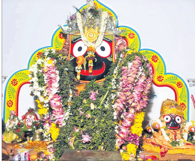
ହେରାପଞ୍ଚମୀରେ ଠାକୁର ଦର୍ଶନ ଦେଉଛନ୍ତି ।