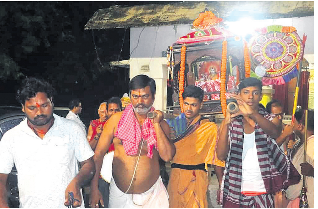
ଡେଜାନାଲ ଜିଲା କାମାକ୍ଷାନଗରରେ ଶ୍ରୀଗୁଣ୍ଡିଚା ଯାତ୍ରା ଅବସରରେ ଶନିବାର ହେରାପଞ୍ଚମୀ ନାତି ଅନୁଷ୍ଠିତ ହୋଇଯାଇଛି । ଏହି ଅବସରରେ ଜଗନ୍ନାଥ ମନ୍ଦିରରୁ ମା’ ଲକ୍ଷ୍ମୀଙ୍କ ଚଳନ୍ତି ପ୍ରତିମାକୁ ବିମାନରେ ଅନନ୍ତପୁରସ୍ଥିତ ମାଉସୀ ମା’ ମନ୍ଦିରକୁ ରଥ ଭାଙ୍ଗିବା ପାଇଁ ନିଆଯାଇଛି ।