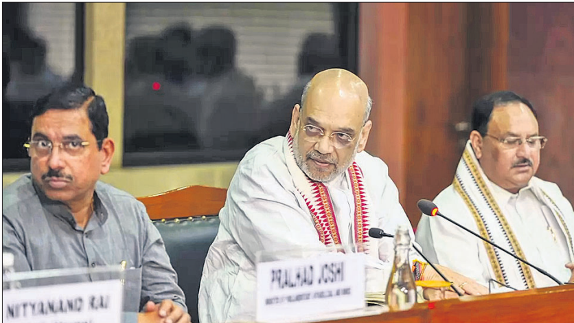
ସର୍ବଦଳୀୟ ବୈଠକରେ ଅମିତ ଶାହାଙ୍କ ସହ ପ୍ରହଲ୍ଲାଦ ଜୋଷୀ ଏବଂ ଜେ.ପି. ନନ୍ଦା ।