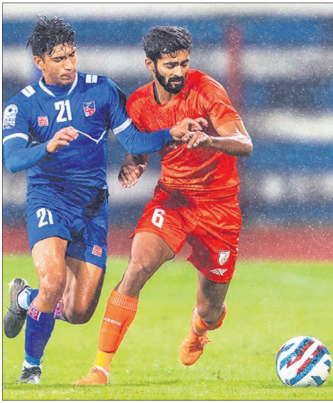
ଭାରତ ଓ ନେପାଳ ମଧ୍ୟରେ ଅନୁଷ୍ଠିତ ମ୍ୟାଚର ଏକ ସଂଘର୍ଷପୂର୍ଣ୍ଣ ସୂଚକ।

ପାକିସ୍ତାନ ଦଳ ଏଲିମିନେଟ ହୋଇଛନ୍ତି। କେବଳ ଓପନରକତା ଦୃଷ୍ଟିରୁ ଏହି ଦୁଇ ଦଳ ୨୭ଟି ଖେଳ ଆଡ଼ିନ ଲିମ୍ପ୍ୟାଟ