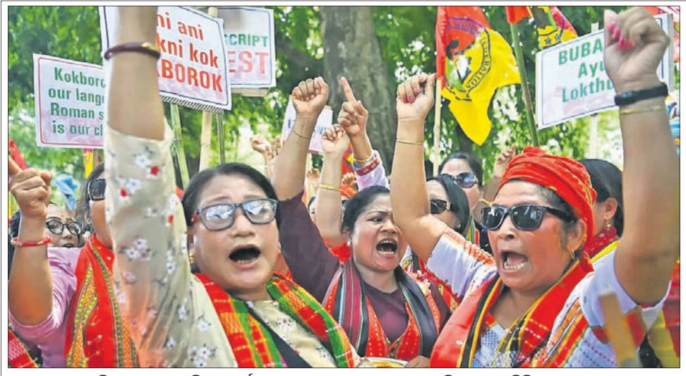
ଟିପ୍ପା ମୋଆର ମହକା ମୋର୍ଚ୍ଚା ପକ୍ଷରୁ କୋକବୋରୋକ ଲାଖା ଲାଗି ରୋମାନ୍ ଲିପି ବ୍ୟବହାର ଦାବିରେ ଶନିବାର ଅଗରତାଳାଠାରେ ବିକ୍ରୋଧ ପ୍ରଦର୍ଶନ କରାଯାଇଛି ।

କେଲରେ ରଖାଯାଇଛି । ଯଦି ଏହି ଦେଶକୁ ବଞ୍ଚାଇବାକୁ ପଡିବ ତେବେ ବିରୋଧୀଙ୍କୁ ଏକାଠି ହେବାକୁ ପଡିବ । ଆଜି ଆମର କୁସ୍ତିଯୋଦ୍ଧା ଝିଆମାନେ ଯତ୍ନ ପତ୍ତନରେ ଧାରଣାରେ ବସିଛନ୍ତି । କିନ୍ତୁ ଯିଏ ଅଭିଯୁକ୍ତ ବାହାରେ ସେ ପୁଣି ଭାବେ ବୁଲୁଛନ୍ତି । ଏଥି ସହିତ ସେ କହିଛନ୍ତି, ପୁଁ ଭାବୁଛି କଂଗ୍ରେସ ଏକ ବଡ଼ ଦଳ ଯାହାକୁ ନେଇ ସମସ୍ତେ ଏକାଠି ହୋଇଛନ୍ତି । ଆମର ଏବଂ ଉତ୍ତର ଠାକରେକ ମଧ୍ୟରେ ପାର୍ଥକ୍ୟ ଅଛି, କିନ୍ତୁ ଗୋଟିଏ ଲକ୍ଷ୍ୟ ନେଇ ଆମେ ଏକତ୍ର ହୋଇଛୁ ବୋଲି ମେହରୁବା କହିଛନ୍ତି ।