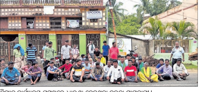
ବିଦ୍ୟୁତ୍ କାର୍ଯ୍ୟାଳୟ ସମ୍ମୁଖରେ ଧାରଣା ଦେଇଥିବା ଦରବାର ଗ୍ରାମବାସୀ।