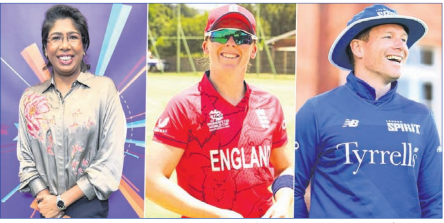
ଝୁଲଣ ଗୋସ୍ୱାମୀ, ହିଅର ନାଜର୍, ଇଅନ ମୋର୍ଗାନ

ଝୁଲଣ ଗୋସ୍ୱାମୀ ଲଣ୍ଡନ, ୨୬ (ପି.ଟି.) ଭାରତର କିମ୍ବଦନ୍ତୀ ମହିଳା କ୍ରିକେଟର ଝୁଲଣ ଗୋସ୍ୱାମୀ ଏମ୍ସିସି ଡ୍ୱାଲ୍ କ୍ରିକେଟ (ଡବ୍ଲ୍ୟୁସିସି) କମିଟିରେ ଯୋଗ ଦେଇଛନ୍ତି। ଏଥିରେ ଇଂଲଣ୍ଡ ମହିଳା ଦଳର ଅଧିନାୟିକା ହିଅର ନାଜର୍ ଓ ୨୦୧୯ ଦିନିକିଆ ବିଶ୍ୱକପ ବିଜୟୀ ଅଧିନାୟିକା ଇଅନ ମୋର୍ଗାନଙ୍କୁ ମଧ୍ୟ ସାମିଲ କରାଯାଇଛି। ଲଣ୍ଡନରେ କୁବର ରେଠକ ପୂର୍ବରୁ କୁବର ଚରମ୍ପା ଏହି ସୂଚନା ଦିଆଯାଇଛି। ଏମ୍ସିସି ଡ୍ୱାଲ୍ କ୍ରିକେଟ କମିଟି ହେଉଛି ଏକ ସ୍ୱାଧୀନ ସଂସ୍ଥା। ଏହା ବିଶ୍ୱର ବର୍ତ୍ତମାନ ଓ