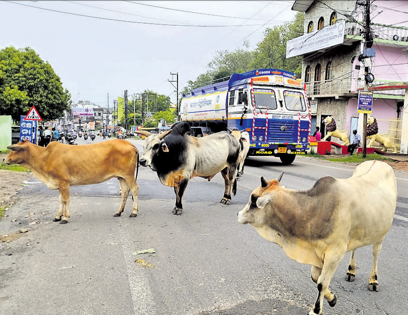
ଖୋର୍ଦ୍ଧା-ବଲାଙ୍ଗୀର ୫୭ ନଂ. ଜାତୀୟ ରାଜପଥର ନୟାଗଡ଼ ଏବଂ ବି ସାଲଗୁଲ ସମ୍ମୁଖରେ ରାସ୍ତା ଉପରେ ଖସି ଓ ଗାଈଙ୍କ ଅବରୋଧ।