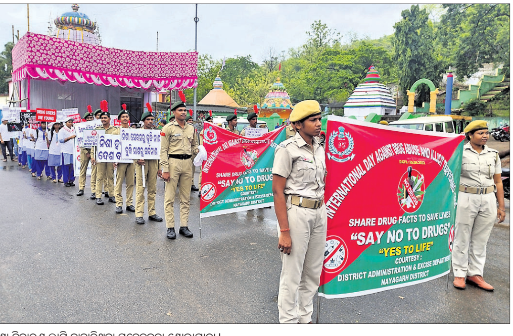
ନିଶା ନିବାରଣ ଲାଗି ବାହାରିଥିବା ସଚେତନତା ଶୋଭାଯାତ୍ରା।

ଖଣ୍ଡପଡ଼ା ବ୍ଲକ ଅଧୀନ ଜଗନ୍ନାଥ ପ୍ରସାଦର ଦରବାରରେ ଥିବା ବିଦ୍ୟୁତ୍ ଗ୍ରାହ୍ୟତା ନିକଟ କାଳବିଶେଷୀ ସମୟରେ ବିକଳ, ଘଟଣାଦି ଯୋଗୁ ପୋଡ଼ିଯିବା ଫଳରେ ଶତାଧିକ ଦରବାର ଗ୍ରାମବାସୀ ଆଜକୁ ୬ ଦିନ ହେଲା ଅନ୍ଧାରରେ ରହିଛନ୍ତି। ଗ୍ରାମରେ ଏକ ନୂତନ ଗ୍ରାହ୍ୟତା ସ୍ଥାନ ନିର୍ମାଣ ଗ୍ରାମବାସୀ ବିଦ୍ୟୁତ୍ ବିଚାରଣା କମିଟି (ପିପିପିଏଲ) କର୍ତ୍ତୃପକ୍ଷ ଓ ଜିଲ୍ଲା ପ୍ରଶାସନର ଦୃଷ୍ଟି ଆକର୍ଷଣ କରି କୌଣସି ପୁଞ୍ଜି ନ ପାଇବା ପରେ ୫୦ରୁ ଉର୍ଦ୍ଧ୍ୱ ଗ୍ରାମବାସୀ ସୋମବାର ଖଣ୍ଡପଡ଼ା ବିଦ୍ୟୁତ୍ ଉପଖଣ୍ଡ (ପିପିପିଏଲ) କାର୍ଯ୍ୟାଳୟରେ ଗଲା ଫୁଲାଇ ଯେଉଡ଼ା କରି ବିରୋଧ ପ୍ରଦର୍ଶନ କରିଥିଲେ। ଦରବାର ଗ୍ରାମରେ ତୁରନ୍ତ ଏକ ଉଚ୍ଚ ଶକ୍ତି ସମ୍ପନ୍ନ ବିଦ୍ୟୁତ୍ ଗ୍ରାହ୍ୟତା ସ୍ଥାନ ଲାଗି କର୍ତ୍ତୃପକ୍ଷ ଦୃଷ୍ଟି ଦେବାକୁ ଗ୍ରାମବାସୀ ଦାବି କରିଥିଲେ। ସୁନାଯୋଗ୍ୟ, ଉଚ୍ଚ ଗ୍ରାମର ୮୦ରୁ