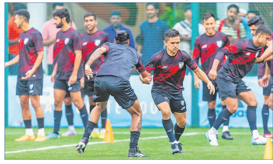
ଭାରତୀୟ ଫୁଟବଲ୍ ଦଳର ଅଭ୍ୟାସ ସେସନ।

ବେଙ୍ଗାଲୁରୁ, ୨୬ (ପି.ଟି.) କାନ୍ଥାରା ଷ୍ଟାଡିୟମରେ ଅନୁଷ୍ଠିତ ସାଏ ଚାମ୍ପିୟନଶିପ୍ ୨୦୨୩ରେ ଚୁପ୍ ଏରେ ଭାରତ ନିଜର ଅନ୍ତିମ ମ୍ୟାଚ୍ ଖେଳିବ। ମଙ୍ଗଳବାର କୁଏର୍ ବିପକ୍ଷରେ ଦଳ ଏହାର ଅନ୍ତିମ ଲିଗ୍ ମ୍ୟାଚ୍ ଖେଳିବ। ଉଭୟ ଦଳ ସେମି ଫାଇନାଲରେ ପ୍ରବେଶ କରି ସାରିଥିବା ବେଳେ ବିଜୟୀ ହୋଇ ମନସ୍ତାନ୍ଧିକ ଫାଇନା ହାସଲ ପାଇଁ ଭାରତ ପ୍ରସାସ କରିବ। ଦୁଇଟି ଲେଖାଏ ମ୍ୟାଚ୍ ଖେଳି ଉଭୟ ଦଳ ୬ ପଏଣ୍ଟ ଲେଖାଏ ଅର୍ଜନ କରିଥିବା ବେଳେ ଗୋଲ ବ୍ୟବଧାନ ଆଧାରରେ କୁଏର୍ ପ୍ରଥମ ସ୍ଥାନରେ ରହିଛି। ପାକିସ୍ତାନକୁ ୪-୦ ଓ ନେପାଳକୁ ୨-୦ରେ ପରାସ୍ତ କରିଥିଲା ଭାରତ। ଉଭୟ ମ୍ୟାଚ୍‌ରେ ଭାରତ ସହଜ ବିଜୟ ହାସଲ କରିଥିବା ବେଳେ କୁଏର୍ ବିପକ୍ଷ ମ୍ୟାଚ୍‌ରେ ଭାରତକୁ କଡା ଚ୍ୟାଲେଞ୍ଜର ସମ୍ମୁଖୀନ ହେବାକୁ ପଡିବ। ଦଳ ଅଧ୍ୟକ୍ଷ ଗୋଟିଏ ଦି ଗୋଲ ବରଣ କରି ନ ଥିବା ବେଳେ