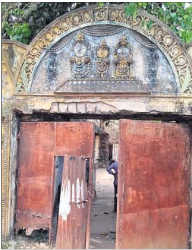
ବନ୍ଦ ହୋଇପଡ଼ିଥିବା ବଳଦେବଜୀଉ ପାଖର ଲୁଗା

■ କରତକଳରେ ଜିଲାର ଶିଳ୍ପ ସମିତି ରହିଛି ■ ଯୁବୋଦ୍ୟୋଗୀଙ୍କୁ ମିଳୁନି ପ୍ରୋତ୍ସାହନ