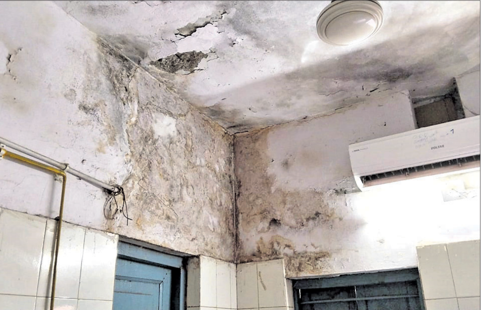
ନୟାଗଡ଼ ଜିଲ୍ଲା ମୁଖ୍ୟ ବିକିଷାକର ସର୍ବରୀ ଖର୍ଚ୍ଚ ଛାତ ଓ କାନ୍ଥ ନଷ୍ଟ ହୋଇ ପାଣି ଗଲୁଛି। ରୋଗୀଙ୍କ ଜୀବନ ନିରାପଦ ନୁହେଁ।