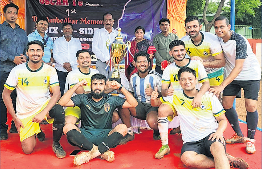
ଅଟ୍ରିକ୍ ଗହଣରେ ଚାମ୍ପିୟନ ଦଳର ଖେଳାଳି।