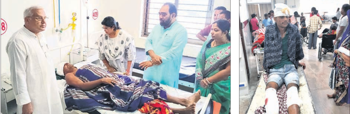
ଏମ୍ବେସିଡିରେ ଆହତଙ୍କ ସ୍ୱାସ୍ଥ୍ୟାବସ୍ଥା ପରାରି ବୁଝିଛନ୍ତି ଏମ୍ପି ଓ ଅର୍ଥମନ୍ତ୍ରୀ ।