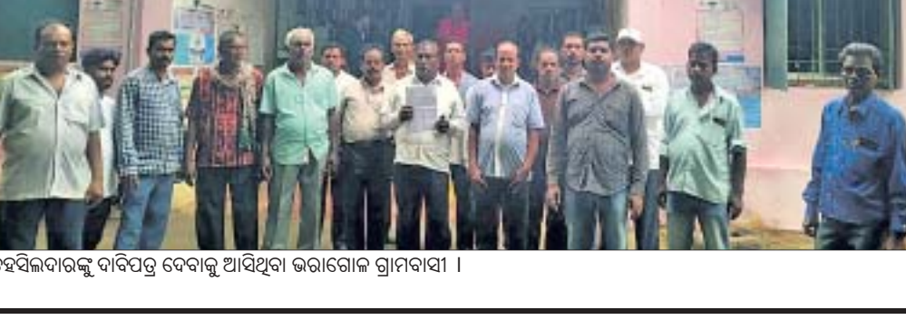
ତହସିଲଦାରଙ୍କୁ ଦାବିପତ୍ର ଦେବାକୁ ଆସିଥିବା ଭରାଗୋଳ ଗ୍ରାମବାସୀ।