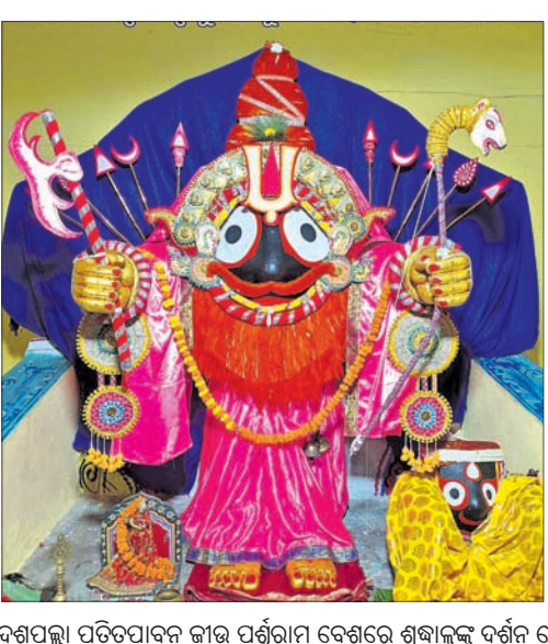
ଦଶପଲ୍ଲୀ ପତିପାବନ ଜାତ ପର୍ଣ୍ଣରାମ ବେଶରେ ଶ୍ରୀବାଳୁଙ୍କୁ ଦର୍ଶନ ଦେଉଛନ୍ତି।