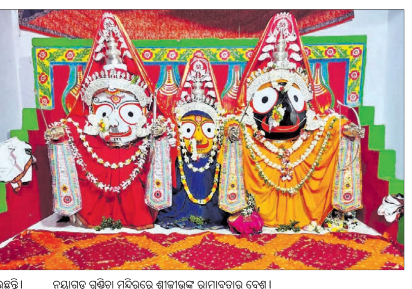
ନୟାଗଡ଼ ଗୁଣ୍ଡିଚା ମନ୍ଦିରରେ ଶ୍ରୀକାଉଁଟ ରାମାବତୀର ବେଶ।