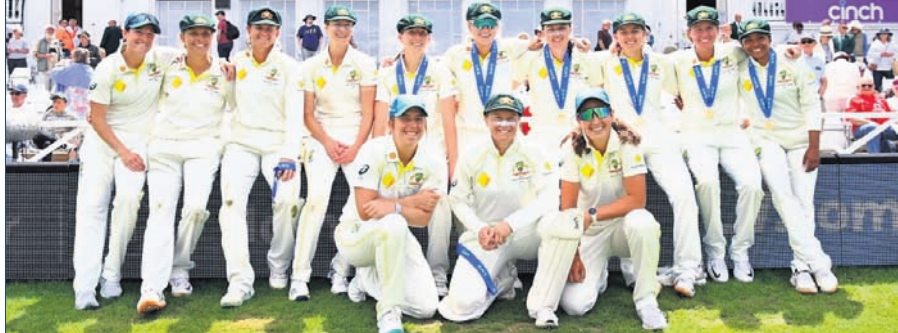
ମହିଳା ଆଶେସ ବିଜୟୀ ଅଷ୍ଟ୍ରେଲିଆ ଦଳ।

ନୂଆଦିଲ୍ଲୀ, ୨୬ (ପି.ଟି.) ଏସିଆନ ଗେମ୍ସ ଆଇ କିଛି ଦିନ ବାକି ରହିଥିବା ବେଳେ ଭାରତ ଭଳ ମହିଳା ବକ୍ସିଂ ପୁଖ୍ୟ କୋର୍ସ ପଦବୀରୁ ଓହରିଯାଇଛନ୍ତି। ଷୋର୍ଟ୍ ଅଥରିଟି ଅଫ୍ ଇଣ୍ଡିଆ(ସାଇ)ରେ ଟାକ୍ ହାଜ ପରମ୍ପରା ତାଲିମରେ ଭାବେ ନୂଆ ଦାୟିତ୍ୱ ମିଳିଛି। ସେଥିରେ ସେ ମନୋନିବେଶ କରିବେ। ସେପ୍ଟେମ୍ବରରେ ଏସିଆନ ଗେମ୍ସ ହେବ। ମହାଦେଶର ବକ୍ସିଂମାନଙ୍କ ଲାଗି ଏହା ପ୍ରଥମ ଅଭିଯୋଗୀ କାଳିଯୋଗ୍ୟ। ଚଳିତ ମାସ ପ୍ରାରମ୍ଭରେ ଭଳକୁ ସାଇର ହାଜ ପରମ୍ପରା ତାଲିମରେ (ଏସିଆ) ଭାବେ ନିଯୁକ୍ତି ମିଳୁଥିଲା। ନୂଆ ଭୂମିକାରେ ବର୍ତ୍ତମାନ ସେ ସମସ୍ତ ସାଇ ନ୍ୟାଶନାଲ ସେଣ୍ଟର ଅଫ୍ ଏକ୍ସଲେନ୍ସିଟିରେ ଉଭୟ ପୁରୁଷ ମହିଳା ବକ୍ସିଂର ଦେଖା ଦାୟିତ୍ୱ କରିବେ। ଭାରତ ବର୍ତ୍ତମାନ ଏଲୋର୍ଡା କପ୍ ପାଇଁ ଭାରତର ବିତୀୟ ସାମ୍ରାଜ୍ୟ ଦଳ ସହ କାମାଖ୍ୟାମ୍ଭରେ ଅଛନ୍ତି। ନୂଆ