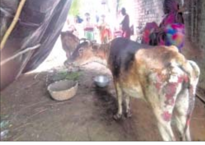
ନିଆଁରେ ପୋଡ଼ିଯାଇଥିବା ଗାଈ, ବାଛୁରୀ।