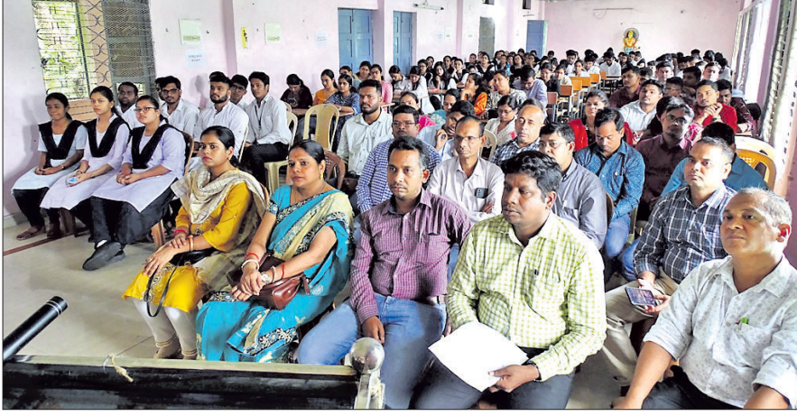
ବଲାଙ୍ଗୀର ଆୟୁର୍ବେଦ କଲେଜରେ ଆୟୋଜିତ ବଜ୍ରତା ପ୍ରତିଯୋଗିତାରେ ଉପସ୍ଥିତ ଅତିଥି ଓ ବିଚାରକ ମଣ୍ଡଳୀ ।