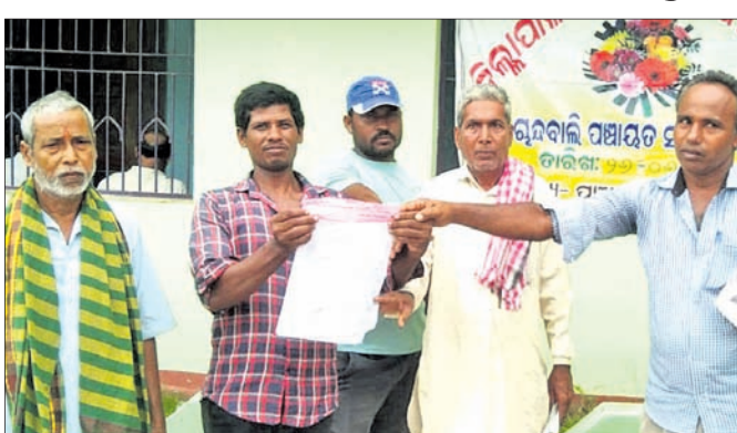
ଜନଶୁଣାଣି ଶିବିରରେ ଚାଷୀମାନେ।