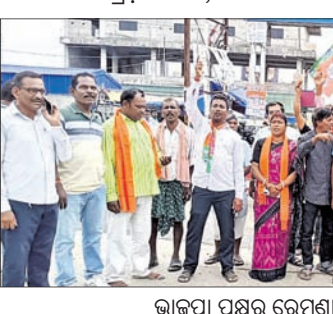
ଭାଜପା ପକ୍ଷରୁ ରେମୁଣା ବଜାର ବନ୍ଦ କରାଯାଇଛି।