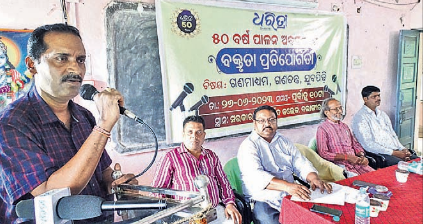
ବଲାଙ୍ଗୀର ଆୟୁର୍ବେଦ କଲେଜରେ ଆୟୋଜିତ ବକ୍ତୃତା ପ୍ରତିଯୋଗିତାରେ ଉପସ୍ଥିତ ଅତିଥି ଓ ବିଚାରକ ମଣ୍ଡଳୀ।