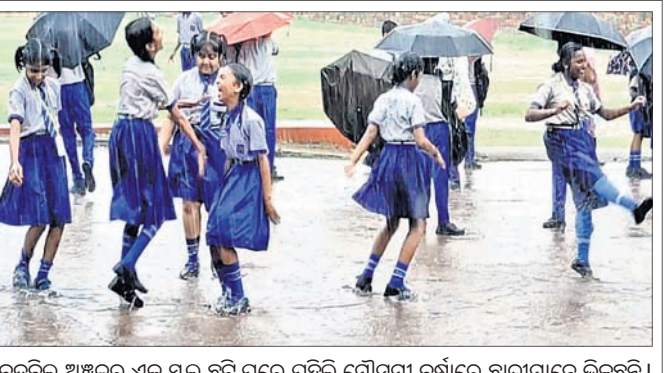
ବଡ଼କଲ ଅଞ୍ଚଳର ଏକ ସ୍କୁଲ ଛୁଟି ପରେ ପଢ଼ିଲେ ମୋସୁମୀ ବର୍ଷାରେ ଛାତ୍ରୀମାନେ ଭିକ୍ଷୁଛନ୍ତି।