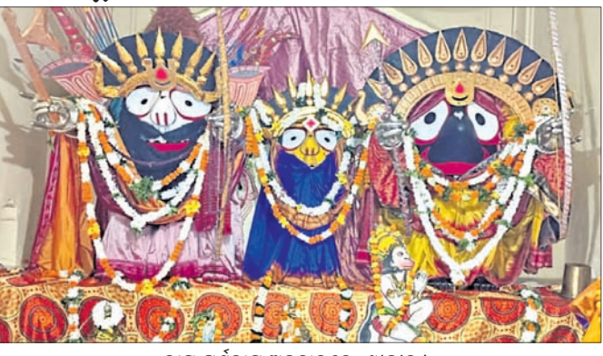
ରାମ ପଶୁରାମ ଅବତାରରେ ଶ୍ରୀଜୀଉ।