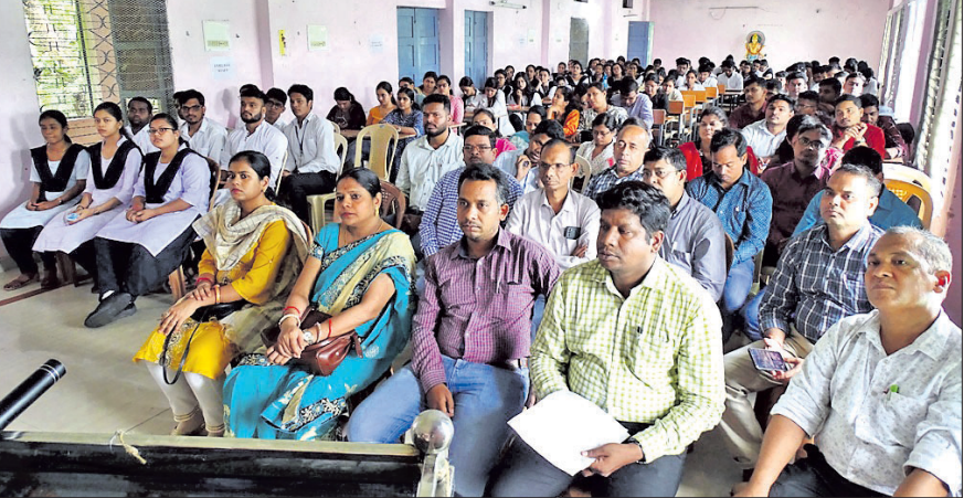
ପ୍ରତିଯୋଗିତାରେ ଭାଗ ନେଇଥିବା ଛାତ୍ରାଛାତ୍ରୀ ଏବଂ ଉପସ୍ଥିତ ବ୍ୟକ୍ତିଗଣେଷ।