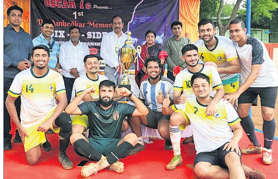
ଅତିଥିକ୍ ଗହଣରେ ଚାମ୍ପିୟନ ଦଳର ଖେଳାଳି।

ଅର୍ଜନ କରିଛି। ୨୩ରୁ ୨୫ ଜୁନ୍ ଯାଏ ଯୁନିଟ୍-୮ ଗ୍ରୀଡ୍ ରାଜଭବନ ପୁଟବଲ୍ ଗ୍ରାଉଣ୍ଡରେ ଏହି ମ୍ୟାଚ ଖେଳାଯାଇଥିଲା। ରବିବାର ଅନୁଷ୍ଠିତ ଫାଇନାଲରେ ଏସିଏ ଟିମ୍ ପରାସ୍ତ କରି ନର୍ ଯେର୍ ଦଳ ଚାମ୍ପିୟନ ଆଖ୍ୟା