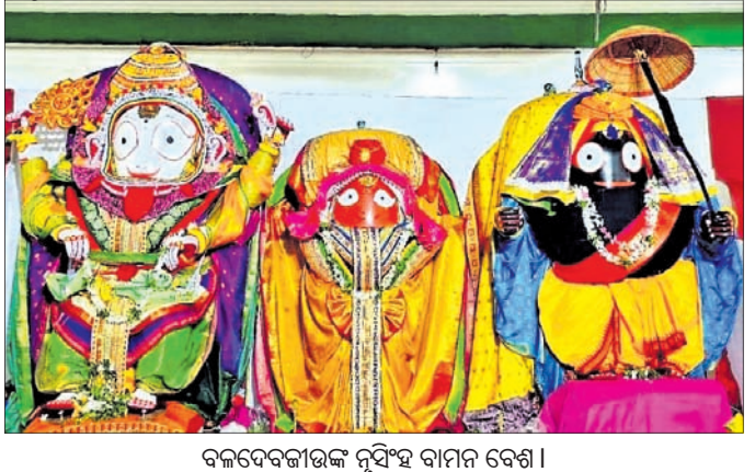
ବଳଦେବଜୀଉଙ୍କ ନୃସିଂହ ବାମନ ବେଶ।

କେନ୍ଦୁଝର, ୨୬୬ (ନରେଶ ଚନ୍ଦ୍ର ପଟ୍ଟନାୟକ) କେନ୍ଦୁଝରର ଆରାଧ୍ୟ ଶ୍ରୀ ବଳଦେବଜୀଉ ଯୋଗବାର ନୃସିଂହ ବାମନ ବେଶରେ ଭକ୍ତଙ୍କୁ ଦର୍ଶନ ଦେଇଛନ୍ତି। ଲକ୍ଷ୍ମୀପୁ କନିତ ବର୍ଷା ସଭେ ଦର୍ଶନ ପାଇଁ ଭକ୍ତଙ୍କ ଭିଡ଼ ଜମିଥିଲା। ବର୍ଷା ଯୋଗୁ ବଡ଼ଦାଣ୍ଡରେ ଚାଲି ଥିବା ସାଂସ୍କୃତିକ କାର୍ଯ୍ୟକ୍ରମ, ମେଳା, ପଲ୍ଲୀଶ୍ରୀ ମେଳା ଆଦିରେ ଦର୍ଶକଙ୍କ ଆଗମନ ମାଧ୍ୟ ଦେଖାଦେଇଥିଲା। ସକାଳୁ ଝିପି ଝିପି ବର୍ଷା ଲାଗି ରହିଥିବାରୁ ରାସ୍ତା ଘାଟରେ ଯାତାୟତ କମ ଦେଖିବାକୁ ମିଳିଛି।