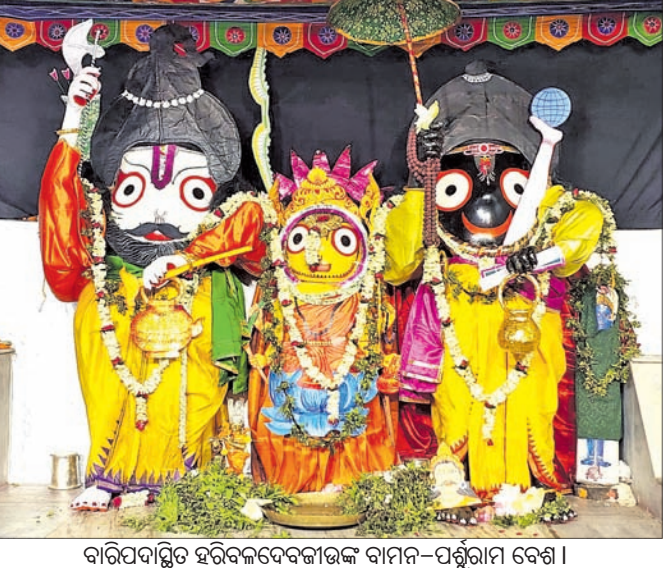
ବାରିପଦାସ୍ଥିତ ହରିବଳଦେବଜୀଉଙ୍କ ବାମନ-ପଶୁରାମ ବେଶ।

ସେଲ୍ଫି ସହ ନିଜର ନାମ ଓ ମୋବାଇଲ୍ ନମ୍ବର ଉଲ୍ଲେଖ କରନ୍ତୁ।