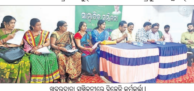
ଖବରଦାତା ସମ୍ମିଳନୀରେ ବିଜେଡି କର୍ମକର୍ମୀ।