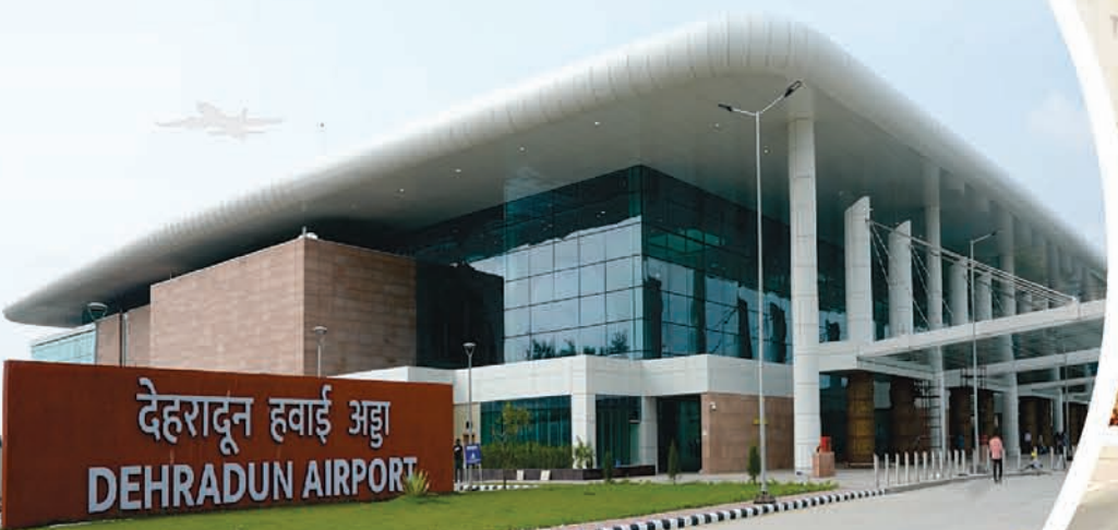
देहरादून हवाई अड्डा DEHRADUN AIRPORT