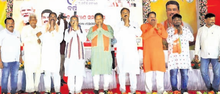
ସଭାମଣ୍ଡଳରେ କେନ୍ଦ୍ରମନ୍ତ୍ରୀ ଧର୍ମେନ୍ଦ୍ର ପ୍ରଧାନଙ୍କ ସହିତ ଭାଜପା ନେତୃବୃନ୍ଦ।