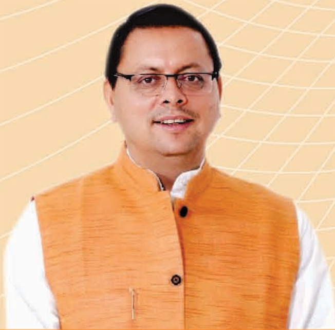
Pushkar Singh Dhami Chief Minister, Uttarakhand