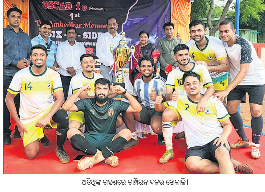
ଅତିଥିକ ଗହଣରେ ଚାମ୍ପିୟନ ଦଳର ଖେଳାଳି।