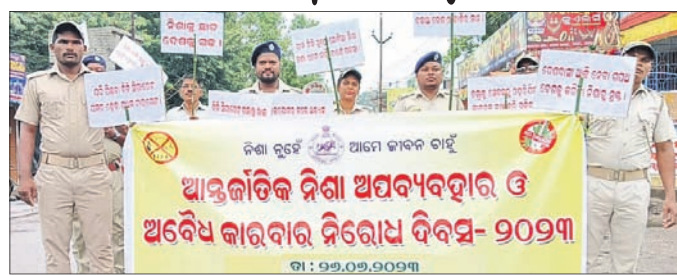
ବାଙ୍କୀରେ ଅବକାରୀ ବିଭାଗ ପକ୍ଷରୁ ସଚେତନ ଶୋଭାଯାତ୍ରା କରାଯାଇଛି ।

ସାଲେପୁର/ବାଙ୍କୀ, ୨୬/୬ (ଅରବିନ୍ଦ ଭୂୟାଁ/ ଶ୍ରୀନେତ୍ର ମୋହନ ମିଶ୍ର) ସାଲେପୁର ସ୍ୱୟଂଶାସିତ ମହାବିଦ୍ୟାଳୟ ପରିସରରେ ଅନ୍ତର୍ଜାତୀୟ ନିଶା ନିରୋଧ ଓ ବିପଦସ୍ୱୀ କାର୍ଯ୍ୟକ୍ରମ ପ୍ରତି ପ୍ରଶ୍ନବାଚୀ ସୃଷ୍ଟି ହୋଇଥିବାବେଳେ ସାଧାରଣରେ ଅସହଯୋଗୀ ପ୍ରକାଶ ପାଇଛି । ଅନ୍ୟପକ୍ଷରେ ଏ ନେଇ ଯୋଗ୍ୟ ହୁଏତ ଫି କହିଛନ୍ତି, ସଫେଇ କାର୍ଯ୍ୟ ଭାବି ରହିଛି । ଏଥିପାଇଁ ଏକ ସଂସ୍କୃତ ୩ କୋଟି ୬ ଲକ୍ଷ ଟଙ୍କାର ଟେଣ୍ଡର ଦିଆଯାଇଛି । ସମ୍ପୂର୍ଣ୍ଣ ସଂସ୍କୃତ ଭାବେ କାର୍ଯ୍ୟ କରୁଛି କି ନାହିଁ ତାହା ଆମେ ତଦାରଖ କରିବୁ । ବାହାରୁ ଅଣାଯାଇଥିବା ଗଡ଼ଖାଇର ଐତିହାସିକ ମାନ୍ୟତା ରହିଛି । ସମୟାନୁକ୍ରମେ ଏହାର ପୁନରୁଦ୍ଧାର ପାଇଁ ବାଙ୍କୀରେ ଅବକାରୀ ବିଭାଗ ପକ୍ଷରୁ ସଚେତନ ଶୋଭାଯାତ୍ରା କରାଯାଇଛି । ସାଲେପୁର/ବାଙ୍କୀ, ୨୬/୬ (ଅରବିନ୍ଦ ଭୂୟାଁ/ ଶ୍ରୀନେତ୍ର ମୋହନ ମିଶ୍ର) ସାଲେପୁର ସ୍ୱୟଂଶାସିତ ମହାବିଦ୍ୟାଳୟ ପରିସରରେ ଅନ୍ତର୍ଜାତୀୟ ନିଶା ନିରୋଧ ଓ ବିପଦସ୍ୱୀ କାର୍ଯ୍ୟକ୍ରମ ପ୍ରତି ପ୍ରଶ୍ନବାଚୀ ସୃଷ୍ଟି ହୋଇଥିବାବେଳେ ସାଧାରଣରେ ଅସହଯୋଗୀ ପ୍ରକାଶ ପାଇଛି । ଅନ୍ୟପକ୍ଷରେ ଏ ନେଇ ଯୋଗ୍ୟ ହୁଏତ ଫି କହିଛନ୍ତି, ସଫେଇ କାର୍ଯ୍ୟ ଭାବି ରହିଛି । ଏଥିପାଇଁ ଏକ ସଂସ୍କୃତ ୩ କୋଟି ୬ ଲକ୍ଷ ଟଙ୍କାର ଟେଣ୍ଡର ଦିଆଯାଇଛି । ସମ୍ପୂର୍ଣ୍ଣ ସଂସ୍କୃତ ଭାବେ କାର୍ଯ୍ୟ କରୁଛି କି ନାହିଁ ତାହା ଆମେ ତଦାରଖ କରିବୁ । ବାହାରୁ ଅଣାଯାଇଥିବା ଗଡ଼ଖାଇର ଐତିହାସିକ ମାନ୍ୟତା ରହିଛି । ସମୟାନୁକ୍ରମେ ଏହାର ପୁନରୁଦ୍ଧାର ପାଇଁ