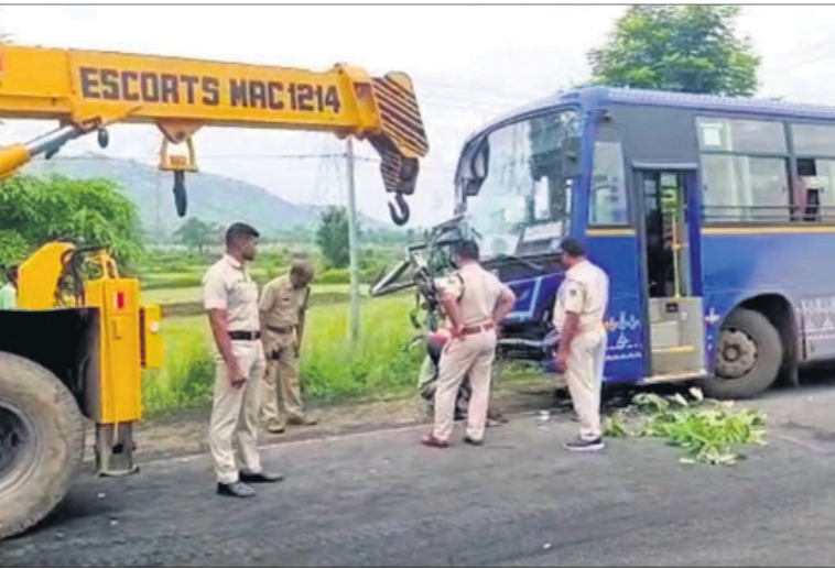
କ୍ରେନ୍ ସାହାଯ୍ୟରେ ଦୁର୍ଘଟଣାଗ୍ରସ୍ତ ଓଏସଆର୍ଟିସି ବସ୍କୁ ରାତ୍ରା ପାର୍ଶ୍ୱକୁ ନିଆଯାଇଛି।