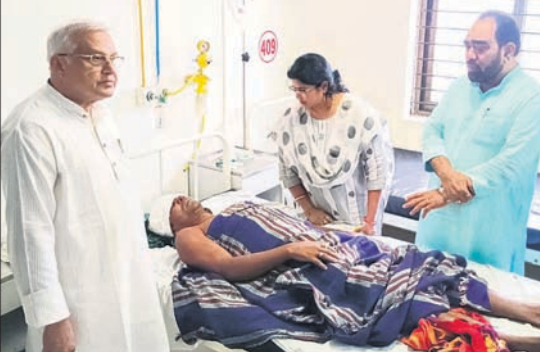
ଏମ୍ପିକେସିକରେ ଆହତଙ୍କ ସାହାଯ୍ୟଗ୍ରା ପଚାରି ବୁଝୁଛନ୍ତି ଏମ୍ପି, ମନ୍ତ୍ରୀ ଓ ବିଧାୟକ।