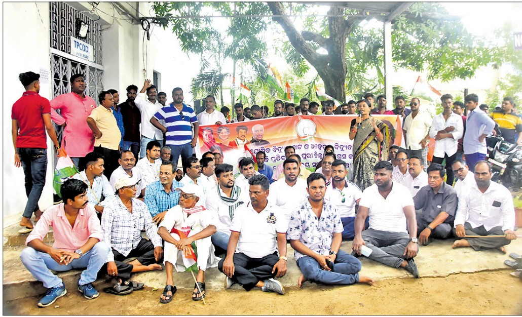
ପୁରୀ ବିଦ୍ୟୁତ୍ କାର୍ଯ୍ୟାଳୟ ସମ୍ମୁଖରେ ଜିଲ୍ଲା କଂଗ୍ରେସ ପକ୍ଷରୁ ବିକ୍ଷୋଭ ପ୍ରଦର୍ଶନ କରାଯାଇଛି।