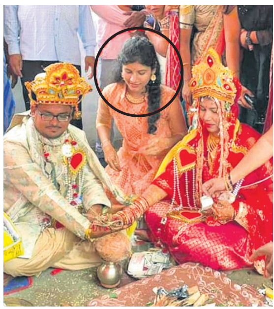
ହାତଗଣ୍ଠି ଖୋଲୁଥିବା ରୁପାଳି (ବୃନ୍ଦାବନ) ଦୁର୍ଘଟଣାରେ ପ୍ରାଣ ହରାଇଛନ୍ତି।