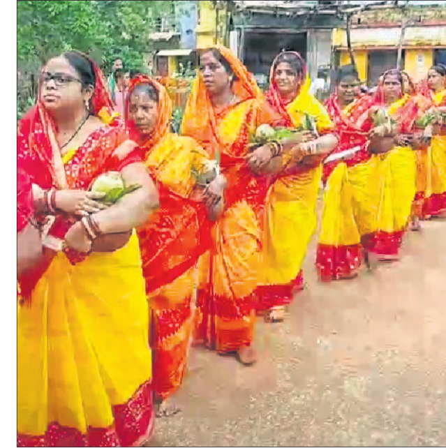
ମାନବିକାଧାରୀ ମହିଳାମାନେ କଳସରେ ନଦୀରୁ ପାଣି ଉଠାଇ ଯଜ୍ଞସ୍ଥଳକୁ ଯାଉଛନ୍ତି ।