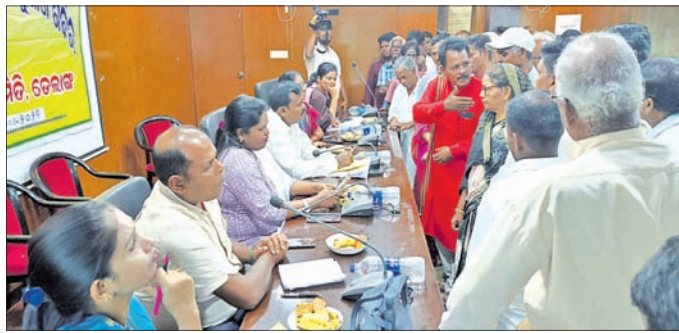
ଶିବିରରେ ଅଧିକାରୀମାନେ ଲୋକଙ୍କ ଅଭିଯୋଗର ଶୁଣାଣି କରୁଛନ୍ତି।