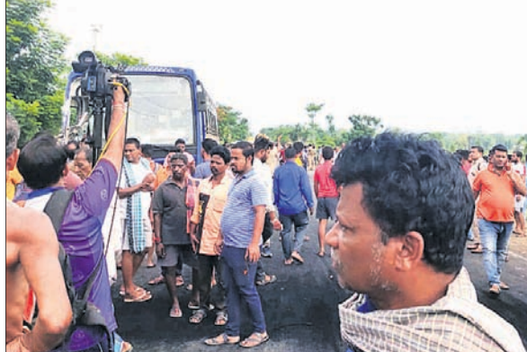
ଦୁର୍ଘଟଣା ଘାଟରେ ଜନଗହଳ।