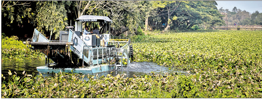
ମେଶିନ ସାହାଯ୍ୟରେ ଗଡ଼ଖାଇ ଦଳ ସଫା କରାଯାଉଛି । (ଫାଇଲ ଫଟୋ)

ହୋଇଥିଲା ୩ କୋଟିର ବ୍ୟୟ ବରାଦ ■ କୃଷୀରୁ ଆସିଥିବା ମେଶିନ ଉତ୍ପାଦନ ■ ଅଧ୍ୟାପକଙ୍କୁ ଆବଦ୍ଧୀରେ କାର୍ଯ୍ୟ